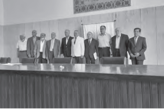
خلال انعقاد الجمعية

وتقرر إرسال نسخة من المحضر إلى وزارة الداخلية وفقاً للأصول.