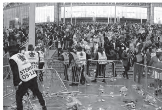
اقتحام ملعب ويمبلي

كشفت شرطة لندن، عن اعتقال شخصين للاشتباه بهما في عملية سرقة معدات ساعدت جماهير على اقتحام ملعب ويمبلي، لحضور نهائي اليورو، دون تذاكر.