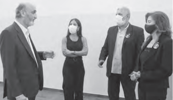
وفد أهالي شهداء الأطفاء عند جعجع

وقت ويرفع الحصانات عن جميع النواب والوزراء الذين طلب المحقق العدلي رفع الحصانات عنهم، لأنها الطريق الوحيد من أجل تسهيل التحقيق بغية الوصول إلى الحقيقة، ونحن مهما كان الثمن لن نتخلى عن قضية انفجار المرفأ».