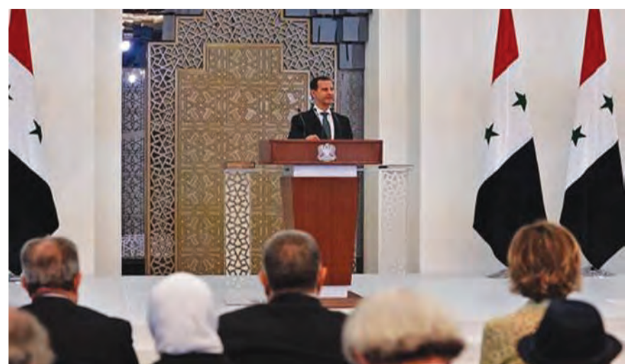
الاسد خلال مراسم أدائه اليمين الدستورية

قال الرئيس السوري بشار الأسد في كلمته إلى الشعب السوري، خلال مراسم أدائه اليمين الدستورية لولاية جديدة أمام أعضاء مجلس الشعب، أمس السبت، إن «الشعب الذي تعرف طريق الحرية لا تتعب في سبيل الدفاع عن حقوقها». وأضاف الأسد: «أرادوا تقسيم البلاد، فأطلق الشعب رصاصة الرحمة على مشاريعهم يوحدته»، مؤكداً أن «السوريين داخل وطنهم يزدادون تحدياً وصلابة». ورأى أن المشاركة الشعبية الواسعة في الانتخابات الرئاسية «دليل على الوعي الوطني الكبير»، معتبراً أن «رهان الأعداء كان على الخوف من الإرهاب. أما اليوم، فالرهان على تحويل المواطن إلى مرتزق».