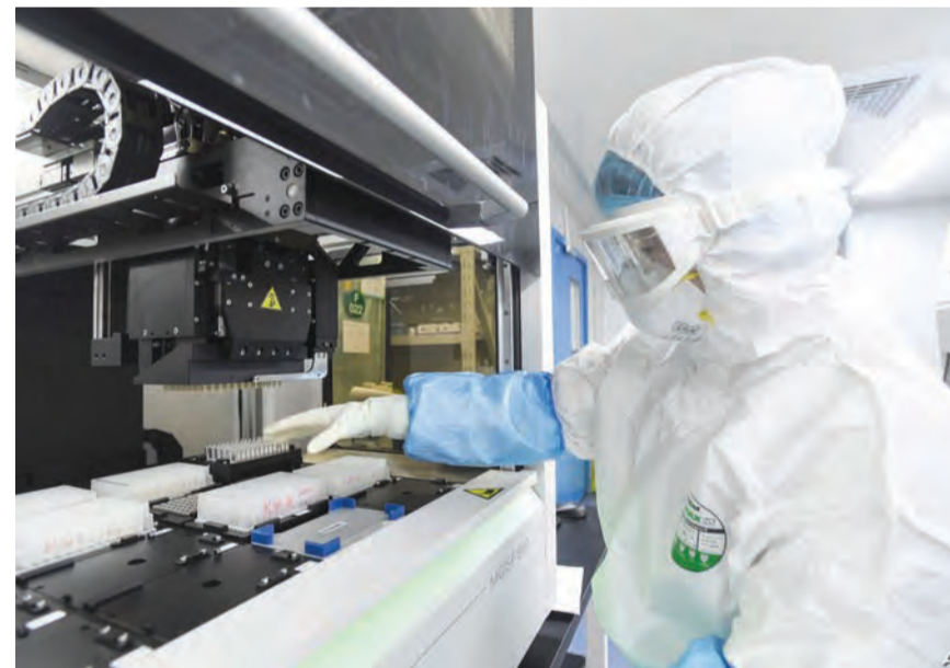
موجة جديدة من كورونا

قالت منظمة الصحة العالمية إن المرحلة الثانية من التحقيق حول منشأ فيروس كورونا يجب أن تشمل مزيداً من الدراسات في الصين إضافة إلى المزيد من «التدقيق» في أنشطة مختبرات هناك. وفي إحاطة مغلقة للدول الأعضاء، أعلن مدير عام المنظمة تيدروس أدهانوم غنبري عن تشكيل مجموعة عمل دائمة للبحث عن منشأ فيروس كورونا.