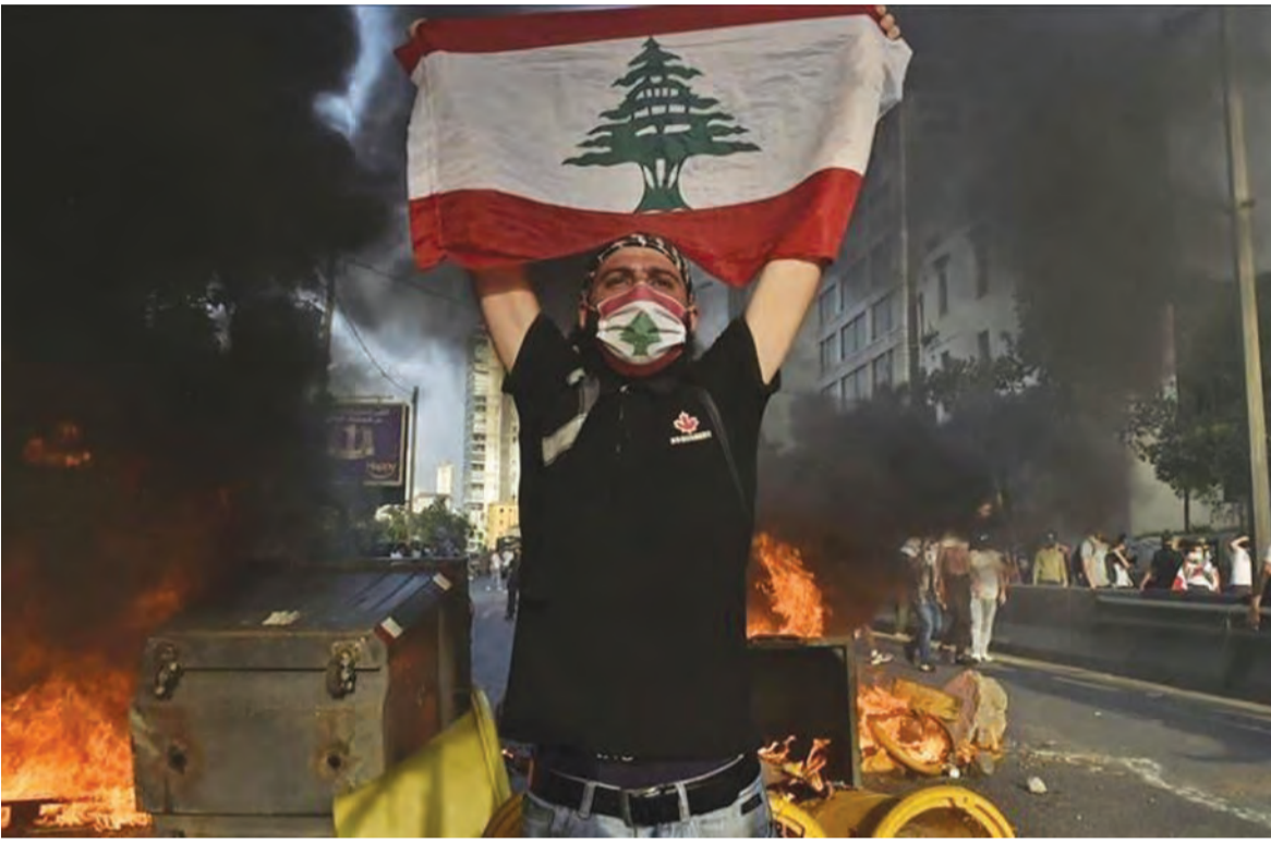
الاحتجاجات الشعبية مستمرة