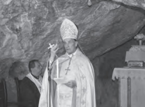
الراعي يترأس القداس

أكد البطريرك الماروني الكردينال مار بشارة بطرس الراعي، «أن المسؤولين السياسيين ابتعدوا عن الثوابت التي أرساها البطاركة ففقد اللبنانيون التوازن الوطني والدور المرعي في تقرير مصير لبنان. ودعا للصلاة كي يصمد شعبنا اللبناني ويثبت في وجه الظلم الكبير والتضليل والكذب».