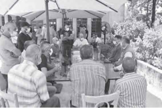
تيمور جنبلاط مستقبلاً زواره

العامية في الجامعة اللبنانية - الفرع السادس في عين وزين الدكتور هشام حرب. والتقى وفدا من جمعية «دعم وتعزيز دور المرأة» في بلدة سبلين ومنطقة اقليم الخروب، ووفدا سياحيا فرنسيا اطلع من جنبلاط على بعض المسائل، وجال في أرجاء القصر مستطلعا معالمه التاريخية والاثرية والتراثية ومكتبته.