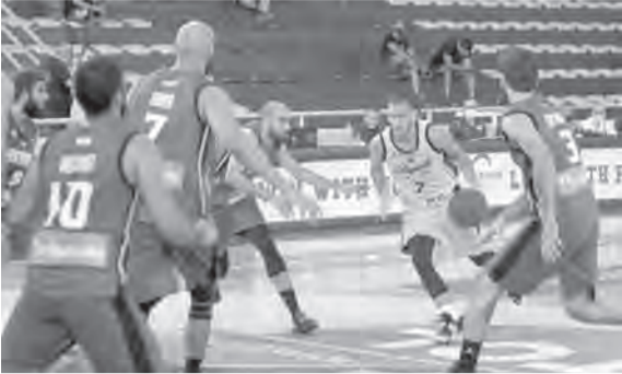
من مباراة الرياضي وضيغه بيروت

وسيلعب الرياضي بمواجهة الحكمة في دوري كرة السلة اللبنانية، في حين سيخوض الشانفيل مواجهة قوية مع أطلس الفرزل. وتصدر الرياضي ترتيب الدوري برصيد ٣٥ نقطة، في حين حل الشانفيل وصيفاً بـ ٣١ نقطة، وأطلس ثالثاً بـ ٣٠ نقطة ومن ثم الحكمة رابعاً بـ ٢٠ نقطة.