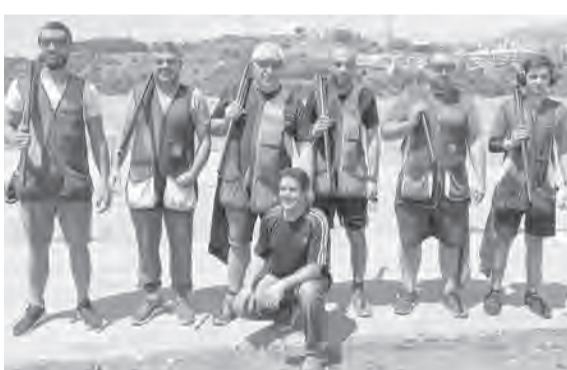
الرماة الستة الأوائل

واهتزت شبك الباراغواي مجدداً عندما مرر غوميز كرة خطيرة حاول جونيور أونسو مدافع الباراغواي التصدي لها لكنه وجهها بالخطأ إلى داخل الشباك، لكنها لم تحسب هدفاً في النهاية بداعي التسلل بعد الاحتكام للفار.