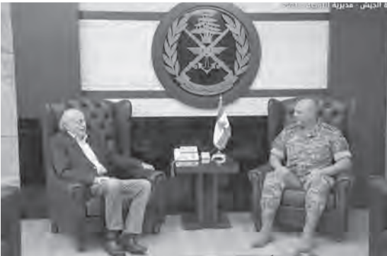
قائد الجيش مجتمعاً مع جنبلاط

استقبل قائد الجيش العماد جوزاف عون في مكتبه في البرزة، رئيس الحزب التقدمي الاشتراكي النائب السابق وليد جنبلاط، وتناول البحث الأوضاع العامة في البلاد. كما استقبل وفداً من نواب بعلبك - الهرمل برئاسة النائب حسين الحاج حسن، وجرى التداول في شؤون مختلفة.