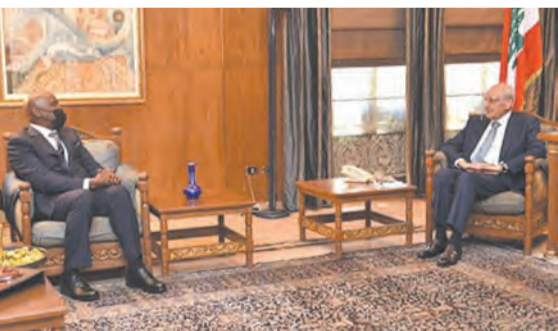
بري مجتمعاً مع سفير غانا (حسن ابراهيم)

استقبل رئيس مجلس النواب نبيه بري في مقر الرئاسة الثانية في عين التينة سفير جمهورية مصر العربية ياسر علوي حيث تم البحث في آخر المستجدات السياسية والوضع العامة والعلاقات الثنائية بين البلدين.