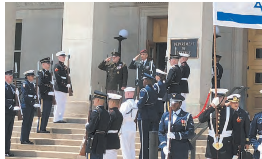
قبيل الاجتماع الأمني الإسرائيلي - الأميركي

بحجم أجهزة الطرد المركزي وجودة وكمية المواد المخصبة، وشدد على غياب المراقبة على مجال تطوير السلاح النووي»، حسب «٢٤NEWS». كذلك، شدد كوخافي على «الخطر الكامن في العودة إلى الاتفاق النووي الأصلي»، محذرا من أنه «يجب فعل كل شيء لمنع حصول إيران على قدرات نووية عسكرية».