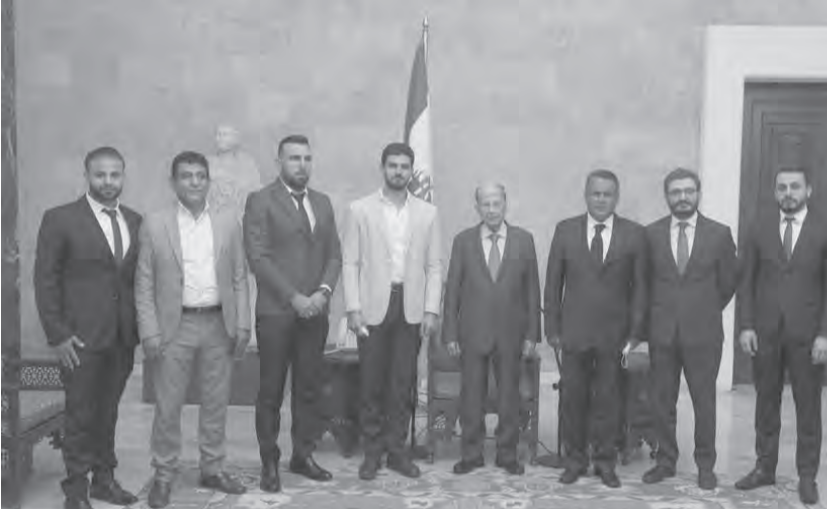
عون مع الوفد (الداخلي ونهرا)

عقد لقاء سنوياً في بيروت. وشدد الرئيس عون على تطوير العلاقات بين لبنان وزيمبابوي، لافتاً إلى أهمية عمل الجمعية والجالية اللبنانية في هذا السياق بالتوازي مع ما تقوم به الدولة عبر وزارة الخارجية ومؤسساتها الرسمية. وقال: «انتم رسل لبنان في الخارج ورسول للدولة المضيفة لكم في لبنان، وعبركم تتطور العلاقات بين الدولتين وتحسن وتصبح مجدية». وأكد رئيس الجمهورية أنّ «الإنهاء في لبنان ضرورة، لا سيما في هذه الفترة الصعبة التي يمر بها وفي ظل الأزمة الكبيرة التي يعيشها اللبنانيون والتي لا سابق لها، وهي جزء من الإرث الثقيل الذي ورثناه من العهود السابقة ونتيجة لتراكم الازمات التي بدأت بالديون الهائلة التي ترتبت على الدولة، نتيجة الفساد وهدر الأموال العامة وسوء الإدارة، وقد زاد هذا العبء بعد الحرب في سوريا وارتفاع الحدود، إضافة طبعاً إلى التأثير الكبير للنزوح السوري على مختلف القطاعات الاقتصادية، من دون اغفال تأثير تظاهرات تشرين وجائحة كورونا»، وصولاً إلى الكارثة الكبيرة التي حلت على لبنان إثر وقوع انفجار مرفأ بيروت». أضاف: «إن العبء كبير جداً على بلد صغير مثل لبنان، اقتصاده فقير بالانتاج، وتم دعم عملته ونتيجة لتراكم الازمات وزيادة الديون، في حين كان من الإحدى دعم الليرة عبر زيادة الإنتاج الوطني. لذلك نحن نحاول اليوم إعادة إحياء الاقتصاد اللبناني واسترداد قيمة الليرة، وتدعو الجميع إلى التعاون لتحقيق هذا الهدف، لا سيما أبناء الانتشار الذين في استطاعتهم لعب دور مهم في هذا المجال».