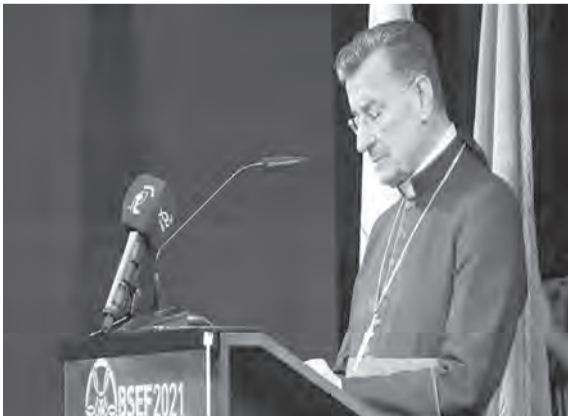
الراعي يلقي كلمته خلال الافتتاح

بلبنان ورسالته وبمقدرات لبنان وشعبه، وبما ينتظر من لبنان كوطن رسالة في هذه الأسرة الإقليمية والدولية، كما ذكر البابا القديس يوحنا بولس الثاني، فنحن هنا من أجل تجديد الثقة بوطننا وبعضنا البعض وبما عندنا من مقدرات وإمكانات، فهذه لا يستطيع أحد أن يبدها». وختم: «عندما اعتقل بولس الرسول وقيد في السلاسل، قال: «يდაي مقيدتان حر، ونستطيع إذا تضامنا وتكاتفن، كما هي الغاية من هذا المنتدى الاقتصادي - الاجتماعي، أن ننهض رغم كل شيء، فلنسا الوطن الوحيد الذي يخترع مثل هذه المحنة. لقد سبقتنا أيضاً شعوب وبلدان هدمت واستطاعوا بقوتهم وقدراتهم إعادة بناء بلدانهم، هكذا فعل أجدادنا وهذا دورنا اليوم، نحن أبناء هذا الزمن، هكذا نفتح هذا المنتدى الاقتصادي، بهذه الروح وهذه الهمة وهذا الإيمان والرجاء. عشمتم وعاش لبنان». ثم تم تكريم شركاء المؤسسة الذين ساهموا معها في برنامج «سوا» لتبقى بيروت، بعد انفجار المرفأ، تلاه سلسلة ندوات ومداحلات تناولت الحيات في سبيل ديمومة لبنان، والتحديات التي يعيشها لبنان، واستقلالية القضاء. كما تناولت دور الانتشار في خلاص لبنان. وأخيراً، تم عرض تقرير عن نشاطات المؤسسة البطريركية المارونية العالمية للناهم شامل.