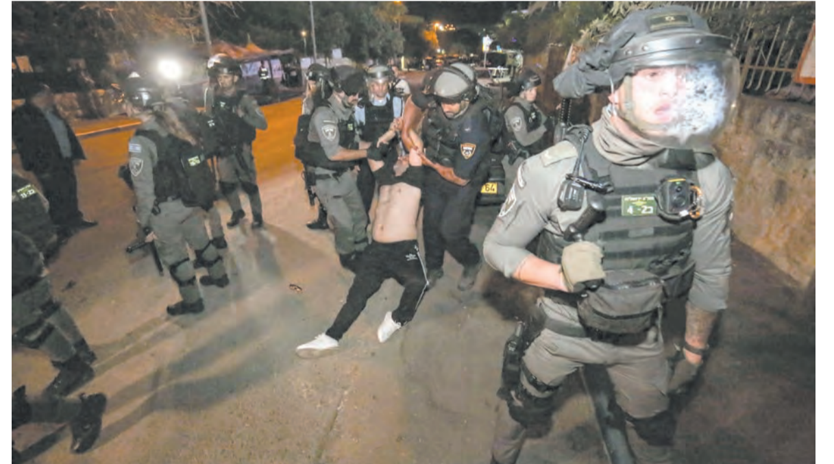
اعتداءات على فلسطينيين في الشيخ جراح

كما اعتقل جنود الاحتلال شبائين خلال المواجهات، وأفاد الهلال الأحمر الفلسطيني بتعرض سيارة إسعاف تابعة له للرشق بالحجارة من قبل المستوطنين، بينما استهدفت قوات الاحتلال سيارة إسعاف أخرى بالمياه العادمة بشكل مباشر. وفي الأثناء، أفاد نادي الأسير الفلسطيني بأن قوات الاحتلال اعتقلت أمس الأول نحو ٣٠ فلسطينيا في أنحاء الضفة الغربية، وتركزت الاعتقالات في سلفيت وطولكرم وجنين والقدس المحتلة.