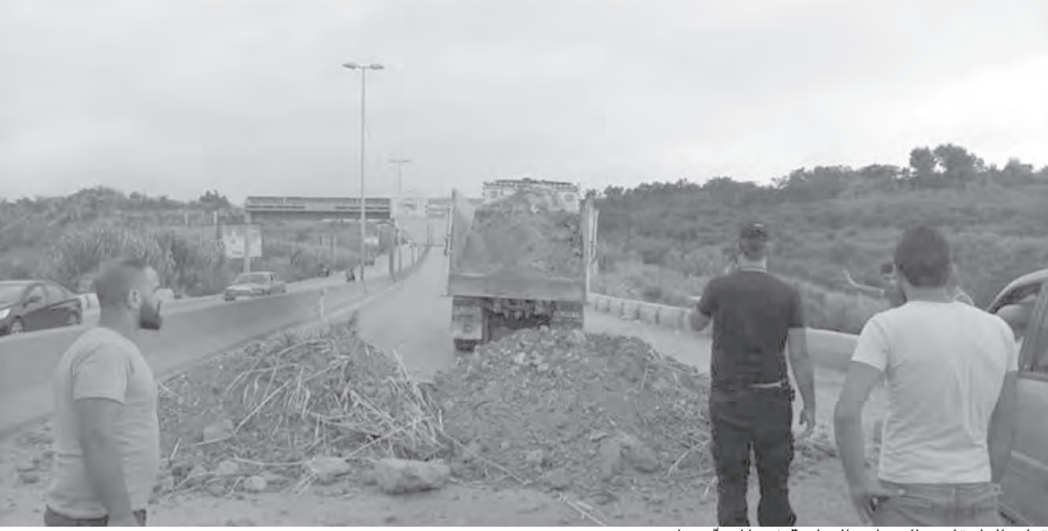
قطع الطرقات بالسواتر الترابية في المحفزة امس

شح المواد الاساسية بات يشكل خطرا على الامن الاجتماعي والسلم الاهلي، حيث ملامح الفوضى الامنية تلوح في الافق، وتحتاج الى تدخل سريع من القيادات الامنية، وعمار من اكثر المناطق التي ارهقتها الازمات التي اضافت حرمانا على حرمان وقررا على فقر، حيث طوابير السيارات امام محطات البنزين تؤدي الى اشكاليات امنية يومية والى قطع طرقات بدأ منذ يوم امس بعد عودة السواتر الترابية الى المحمرة مدخل عكار الشمالي.