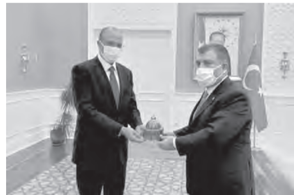
حسن ونظيره التركي يتبادلان الهدايا

المنتجات ولا سيما أدوية الأمراض المستعصية، إضافة إلى المستلزمات والمغروسات الطبية التركية العالية الجودة، وذلك باتفاقاً إيمان بين وزارتي البلدين أو بين وزارة الصحة اللبنانية والشركات التركية أو بين الشركات اللبنانية والتركية». وأكد الوزير حسن أن «المستشفى التركي في صيدا الذي تم بناؤه قبل أكثر من عشر سنوات، يحظى بمتابعة شخصية من رئيس حكومة تصريف الأعمال الدكتور حسان دياب ومنه شخصياً بهدف تشغيله في وقت قريب»، مشيراً إلى «اعتماده في الآونة الأخيرة كمركز لتلقيح لمنطقة جنوب لبنان، ما شكل دعماً أساسياً لخطة الوزارة في تمنيع المجتمع اللبناني».