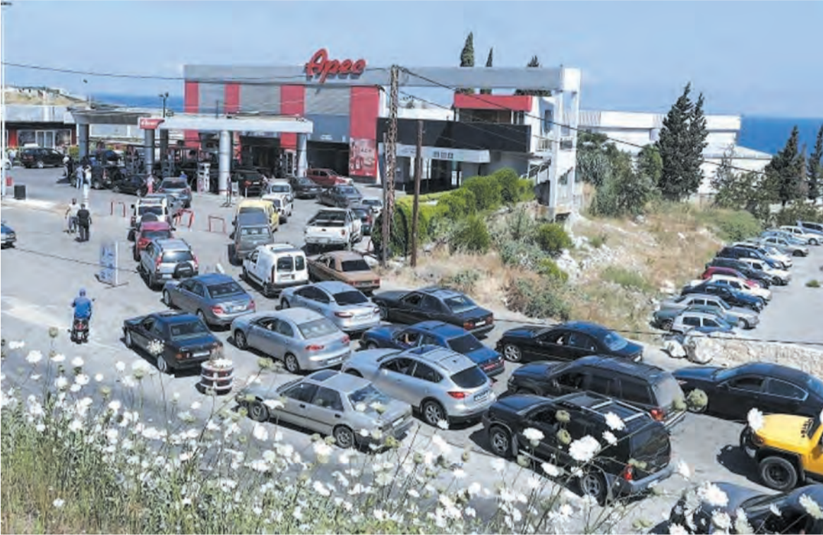
المشهد اليومي المتكرر

في لبنان، لافتاً إلى أنه «اعتباراً من اليوم (أمس الثلاثاء) ستتضخم أزمة البنزين بلبنان، في وقت كان يفترض به السير بخطة وزير الطاقة ريمون جبر برفع اعتماد شراء المحروقات من دولار ١٥٠٠ إلى دولار ٣٩٠٠ حسب الاتفاق الذي تم مع حاكم مصرف لبنان، وإلا ستكون أمام رفع الاعتمادات ونفاد المخزون». وناشد غصن، في بيان، رئيس حكومة تصريف الأعمال حسان دياب «الطلب من حاكم مصرف لبنان رياض سلامة حل المشكلة».