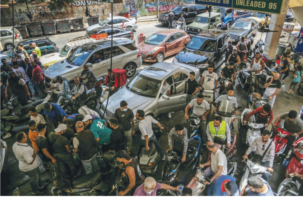
المشهد يتكرر كل يوم امام محطات الوقود