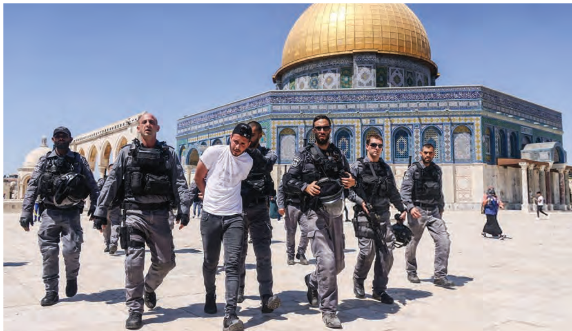
عمليات اعتقال في حرم الأقصى

اقتحمت قوات الاحتلال الإسرائيلي باب السلسلة أحد أبواب المسجد الأقصى؛ حيث قامت بإطلاق الرصاص المعدني باتجاه المصلين الفلسطينيين.