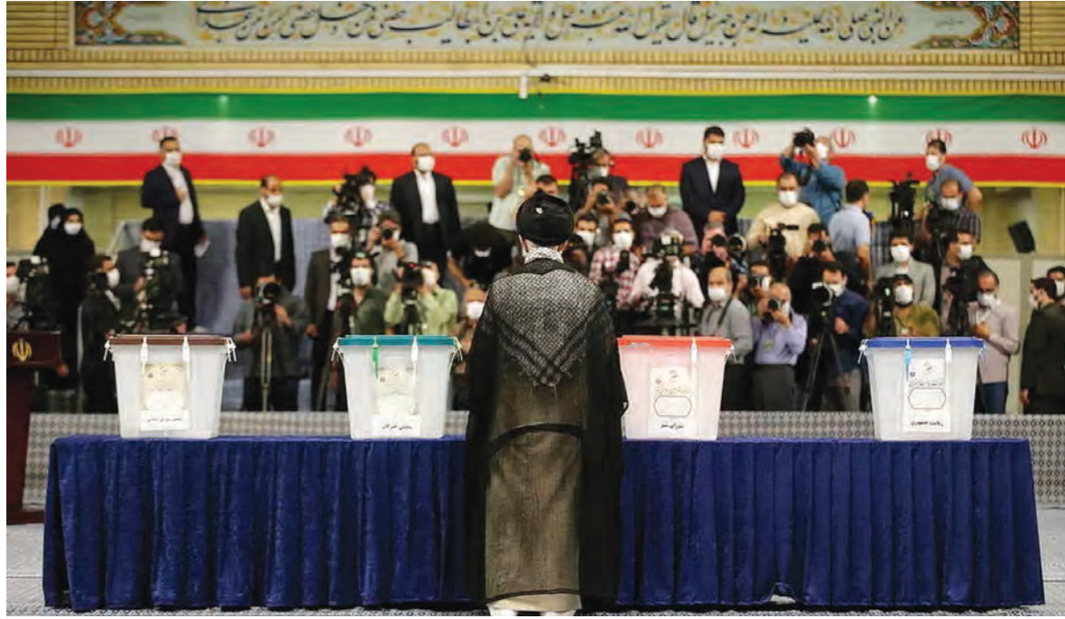
الانتخابات الرئاسية الإيرانية

توجه الناخبون الإيرانيون أمس الجمعة الى التصويت لانتخاب رئيس جديد للبلاد خلفا للرئيس الحالي حسن روحاني، في الوقت الذي تشكل فيه نسبة المشاركة التحدي الأبرز في هذه الانتخابات.