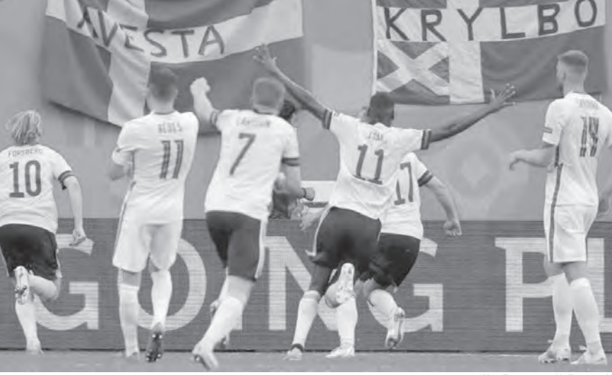
الفرحة السويدية بالهدف

يمنعه أيضاً من تقديم أداء جيد في المباراة أمام ألمانيا». وتعرض بافاردر لكدمة في الرأس خلال مباراة ألمانيا التي انتهت بفوز فرنسا ١-٠. وقال ديشامب «ولكن اللاعب ليس لديه ما تفكر فيه». وكانت هناك بعض الانتقادات بشأن العلاج السريع لبافارد وعودته العاجلة للعب خلال مباراة ألمانيا، لكن الاتحاد الأوروبي أكد أن أطباء الاتحاد الفرنسي ذكروا أن اللاعب على ما يرام. ويستطيع المنتخب الفرنسي بلوغ الدور الثاني، إذا حقق الفوز اليوم السبت في بودابست.