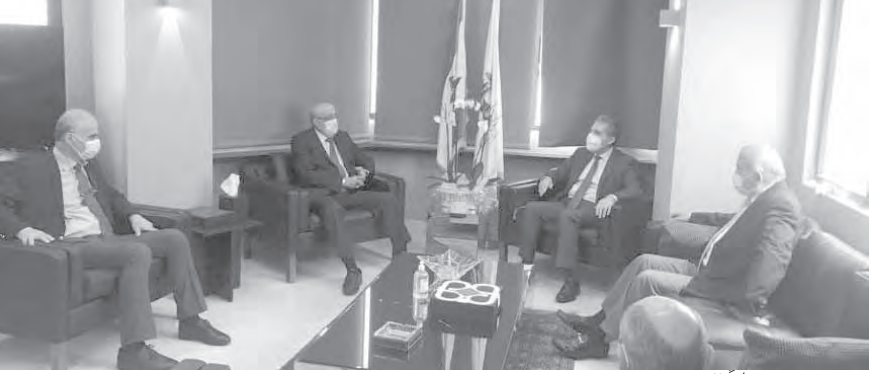
وزني مستقبلاً الوفد

وأعلن المكتب الإعلامي لوزارة المال في بيان، أن «الوزارة وضعت اليوم ٥٠٠٠٠٠٠٠ (خمسة ملايين) طابع فئة الـ ٢٥٠ ليرة قيد التداول».