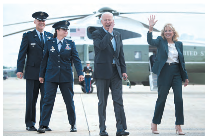
بايدن وزوجته في اول رحلة خارجية امس

توجّه الرئيس الأمريكي جو بايدن إلى بريطانيا أمس الأربعاء في أول رحلة خارجية له منذ توليه منصبه. وتستغرق الرحلة ٨ أيام، وتهدف لإعادة بناء العلاقات عبر الأطلسي التي توترت خلال عهد الرئيس السابق دونالد ترامب، وإعادة صياغة العلاقات مع روسيا. وتمثل الجولة اختباراً لقدرة الرئيس الأمريكي على إدارة وإصلاح العلاقات مع الحلفاء الرئيسيين الذين أصيبوا بخيبة أمل من الرسوم الجمركية التي فرضها ترامب وانسحابه من معاهدات دولية. (التتمتع ص ١٢)