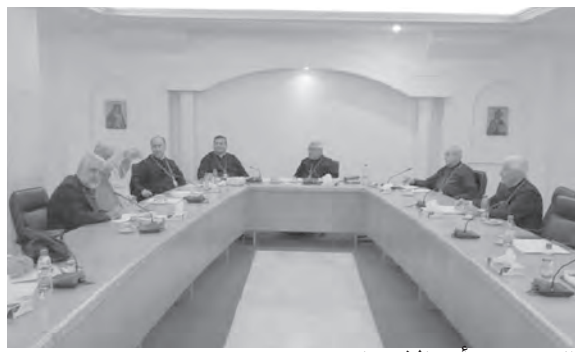
العبيسي يتراس الاجتماع

ترأس بطريرك انطاكية وسائر المشرق للروم الملكيين الكاثوليك يوسف العبيسي، اجتماع أساقفة لبنان والرؤساء العامين والرئيسات العامات في الريوثة، وتم البحث في الشأن الوطني العام إضافة إلى الشأن الكنسي.