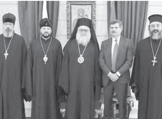
يوحنا العاشر مجتمعاً مع ليونيد والوفد المرافق

تم خلال اللقاء تداول شؤون كنسية وتأكيد «أهمية العلاقة التاريخية بين الكنيستين الروسية والأنطاكية، كما جرى عرض للوضع في المنطقة بشكل عام، وفي لبنان بشكل خاص». بعد اللقاء، جمال المطران ليونيد في أرجاء التلة البلمندية، حيث زار الدير والجامعة.