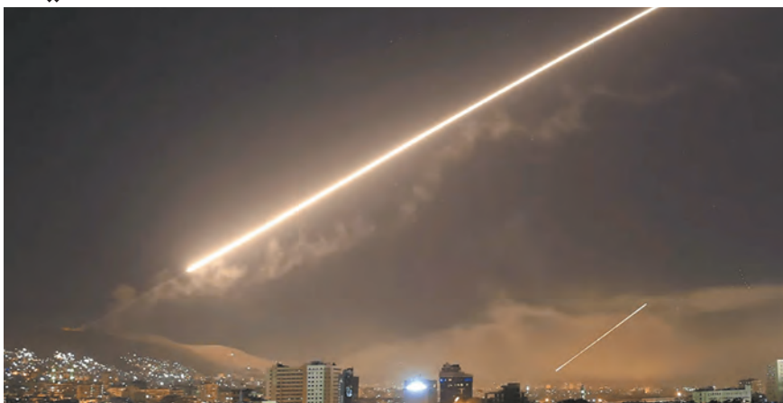
الدفاعات الجوية تتصدى للعدوان

أكدت وزارة الخارجية والمغتربين السورية أن «دمشق ترفض بشكل مطلق تصريحات وزير الخارجية الأميركي بخصوص الجولان السوري المحتل». وقال إن تصريحات أنتوني بليكن «تأتي في سياق الدعم الأميركي المتواصل للكيان الإسرائيلي المحتل وعدوانه المستمر». وأضافت أن «الجولان كان وسيبقى عربيا سوريا وهذا ما