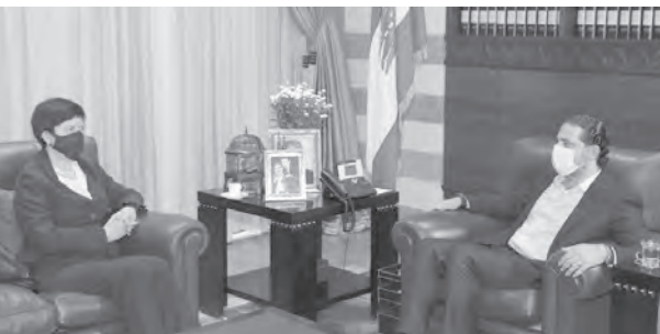
الحريري مستقبلاً فرونييسكا

استقبل رئيس الحكومة المكلف سعد الحريري بعد ظهر امس في بيت الوسط، المنسقة الخاصة للأمم المتحدة في لبنان يوانا فرونييسكا، في زيارة تعارف مناسبة تسلمها مهامها الجديدة في لبنان.