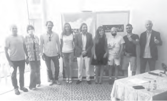
طعمة وحرب وباز مع عدد من الأبطال والبطلات