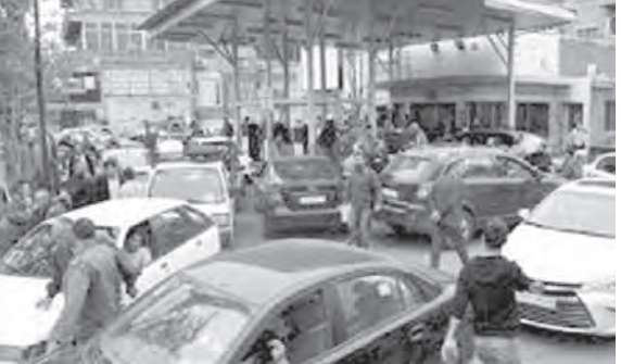
الغاز: ٢٥٢٠٠ ل.ل.

وتجدر الإشارة إلى أن الجدول لم يصدر منذ ١٩ أيار الماضي.