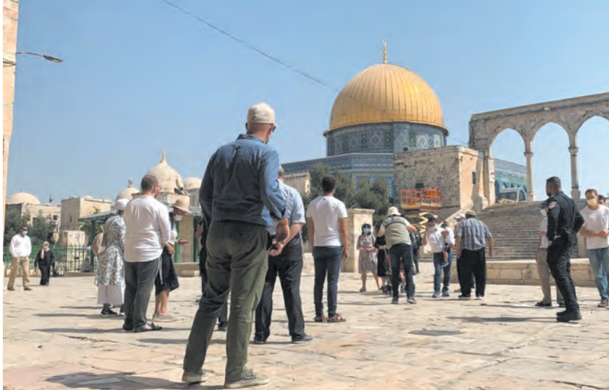
مستوطنون يقتحمون باحات الأقصى

ناشدة الأمم المتحدة العالم زيادة المساعدات لسكان غزة، وفي حين حذر مسؤول فلسطيني من كارثة إنسانية وصحية في القطاع، تحدث وزير الخارجية الأمريكي عن الحاجة لوضع آلية تمنع وصول أموال إعادة الإعمار إلى الفصائل الفلسطينية. وخلال مؤتمر صحفي في غزة أمس الأربعاء، دعت لين هاستينغز، المنسقة الأممية للشؤون الإنسانية في فلسطين، المجتمع الدولي والمؤسسات الدولية لفعل المزيد لمساعدة سكان قطاع غزة. (التتمتع ص ١٢)