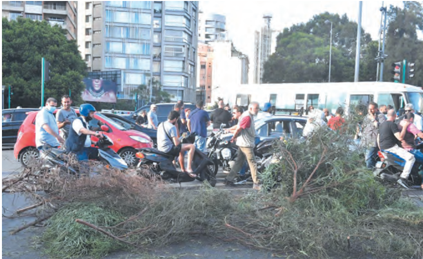
قطع طرقات في بيروت امس

واضافت انه يمكن القول ان الاجواء ايجابية الان وهي افضل مما كانت عليه مؤخرا عندما اندلعت حرب البيانات بين بعثدا والتيار الوطني الحر من جهة وبيت الوسط والمستقبل من جهة اخرى. واعربت المصادر عن ارتياحها لاجواء التهذنة التي سادت، مشيرة الى ان رئيس المجلس استأنف حركته الناشطة بعد ذلك اكان من خلال اتصالاته المباشرة التي اجراها ام من خلال حركة الخليلين، لكن الامور تبقى في خواتيمها املا في استكمال الاجواء ايجابية باتجاه التوصل الى الاتفاق الناجز على التشكيلة الحكومية. وقالت مصادر الخليلين ان اجواء اللقاء مع باسيل كانت ايجابية، لكنها اشارت الى ان هناك نقطة او نقطتين لم تحسما. واكد مصدر مطلع في هذا المجال ان هناك اتصالات (تتمتع المانشيت ص ١٢)