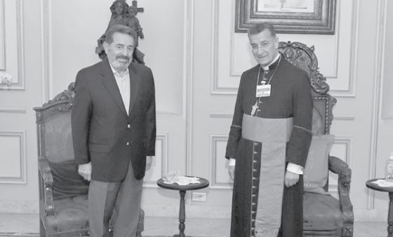
الراعي مع حرب

وختم «تناقشنا في سبل معالجة النتائج المأسوية الناتجة من الصراع على السلطة وطرق توحيد مواقف الشعب اللبناني. كما تحدثنا عن مبادرات البطريك المتعلقة بالحياد والمؤتمر الدولي من أجل لبنان».