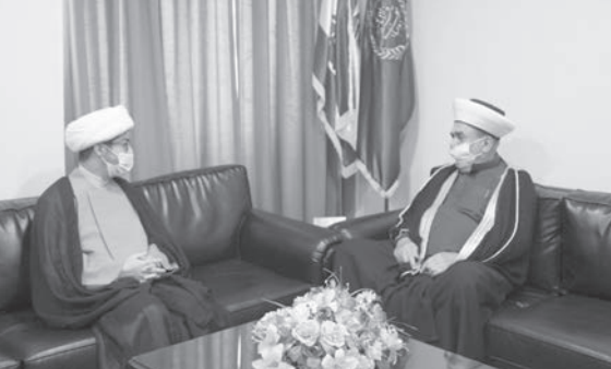
النابلسي مجتمعاً مع سوسان

من رئيس اتحاد علماء المقاومة الشيخ ماهر حمود ومفتي صيدا الشيخ سليم سوسان ورئيس مجلس أمناء تجمع العلماء المسلمين الشيخ غازي حنينه.