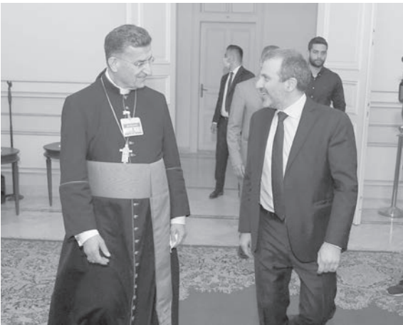
باسيل يزور الراعي

لكل اللبنانيين، ونحن نعلم أن التضحيات كبيرة ولكنها لن تكون أقوى من الصلب»، وحثم باسميل قائلا: «عندما نطالب بالحق والحقيقة، فهذا لأننا نؤمن بأنهما الطريق للإصلاح والخلاص، وسنبقى نقاتل كي تبصر الحكومة النور، وستحدث بتفاصيل الحكومة والسياسة يوم السبت في الساعة الحادية عشرة من قبل الظهر».