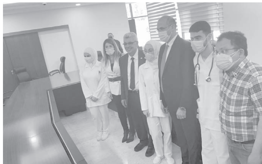
حسن افتتح مركز بخعون الطبي

قام وزير الصحة العامة في حكومة تصريف الأعمال حمد حسن، بجولة ميدانية على بلدات: البيرة ومناطق وادي خالد وجبل اكروم في منطقة الدرييب - عكار، وعابن عددا من المواقع المقترحة من عدد من البلديات بهدف إنشاء مستشفى حكومي بهبة مقدمة من دولة الكويت في هذه المنطقة .