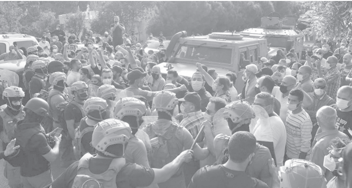
احتكاك بين مؤيدي القادية عون والقوى الامنية

وتعتبر هذه العناصر الثلاثة مهمة للغاية لانها ستمنع حزب الله من السيطرة على لبنان. ووفقاً للمعلومات، تريد «اسرائيل» من الولايات المتحدة تبني مقاربة تقوم على