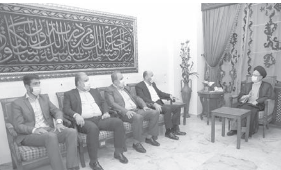
وفد «حماس» يزور فضل الله

الفلسطينية من خلال مواجهة التطبيع مع العدو. وأن وحدة الشعب الفلسطيني بكل مكوناته وقضايلها هي الأساس في عملية المواجهة». وحذر من أن «المخطط الذي يتم تحضيره على نار باردة في المنطقة العربية والإسلامية يمتثل بتجويع الناس حتى تبحث عن حاجاتها الخاصة الذي كان من أهم الشخصيات الداعمة للشعب الفلسطيني ورمزاً إسلامياً وحدوياً».