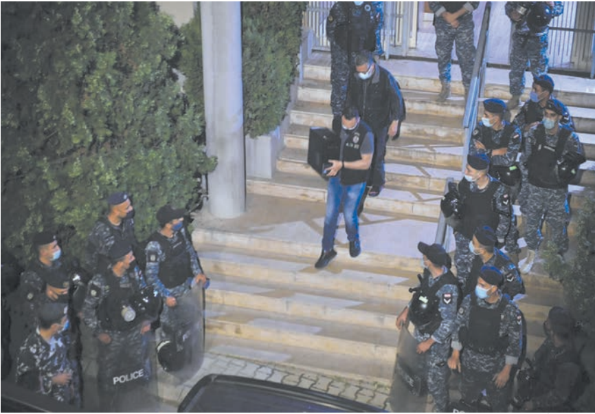
القوى الامنية تخرج اجهزة الكمبيوتر من شركة مكثف

محمد بلوط ما هي ابعاد ما جرى امس في شركة مكثف لتحويل الاموال والصيرفة ومحيطها؟ والى اين تتجه معركة التدقيق الجنائي والملفات المالية التي اشتدت مؤخراً بعد خطاب الرئيس عون الاخير؟ هل صحيح ان تطورات هذا الملف هي مجرد نزاع قضائي ام انها تلخص مشهداً اكبر يتجاوز هذه القضية ليجسد معركة سياسية شرسة تشمل الصراع على الحكومة وما بعد بعهد الحكومة؟ الوقائع والتطورات التي سجلت منذ ايام تؤكّد ان الصراع الحاد بين الرئيس عون والتيار الوطني الحر من جهة والرئيس الحريزي وتياره حول الحكومة قد توسع نطاقه لتستخدم فيه كل الاوراق المتاحة في ظل انسداد الاتفاقات امام المساعي والجهود المبذولة لحل الازمة. ووفقاً للمعلومات المتوافرة من مصادر متعددة امس، لم يطرأ اي تطور ايجابي في شأن موضوع الحكومة، لكن اوساط الثنائي