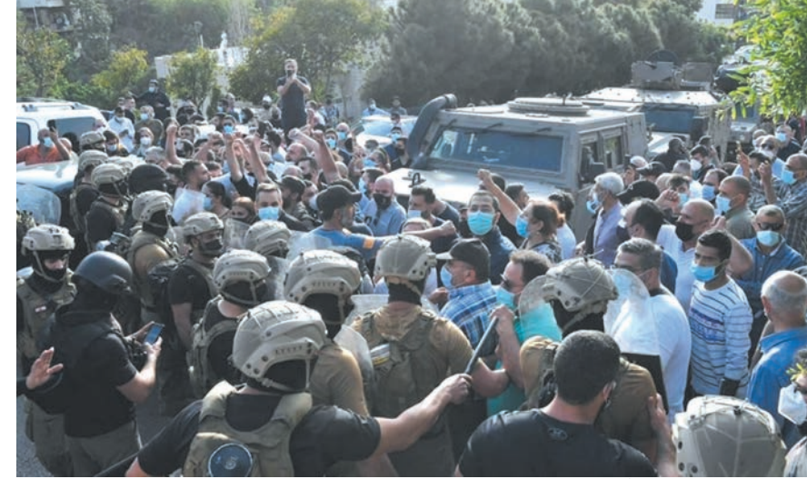
المواجهة بين القوى الامنية وعناصر من التيار الوطني الحر في عوكر

المحلل الاقتصادي من المعروف في كل دول العالم أن كيان الدولة يتجسّد بمؤسساتها. فكلما كانت هذه المؤسسات صلبة وعادلة وشفافة، كلما كان كيان الدولة بخير. إذا تفكّك الكيان في دولة مُعيّنة يبدأ بمؤسساته وهو ما يحصل حالياً في لبنان. فبعد أن عبث الأداء السياسي في مؤسسات الدولة كافة، ها هو يعبث بأهم ثلاثة أعمدة كيان الدولة.