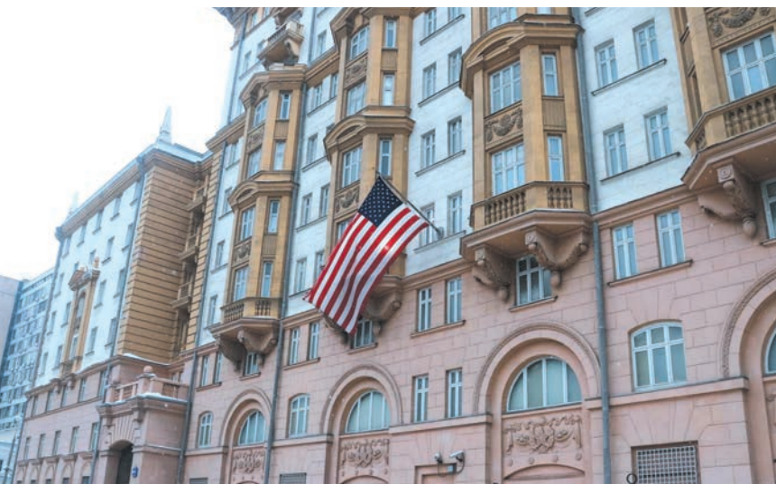
السفارة الأميركية في روسيا

أعلنت وزارة الخارجية الروسية عزمها اتخاذ العديد من الإجراءات ردا على العقوبات الأميركية التي قال الرئيس الأميركي جو بايدن إنه على استعداد للذهاب أبعد منها. وقال وزير الخارجية الروسي سيرغي لافروف إن بلادها ستطرد ١٠ دبلوماسيين أميركيين ردا بالمثل على التصرف الأميركي، وستضع ٨ مسؤولين أميركيين على قائمة العقوبات الروسية. وأشار إلى أن بلاده قد (التتمة ص ١٢)