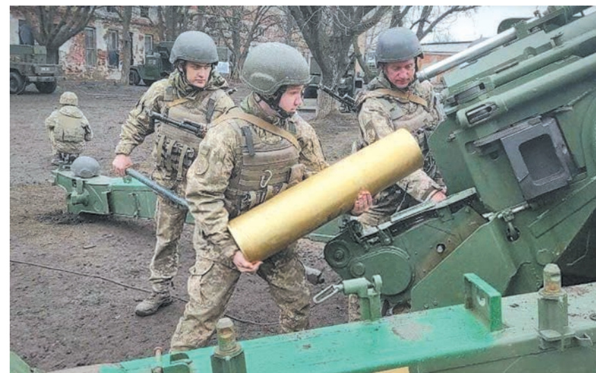
تدريبات للجيش الأوكراني

أجرى الرئيس الأوكراني فلودومير زيلينسكي أمس في باريس محادثات مع نظيره الفرنسي إيمانويل ماكرون والمستشارة الألمانية أنجيلا ميركل بشأن التوتر مع روسيا، في حين دعت موسكو كلا من باريس وبرلين إلى وضع حد لما أسمته استفزازات كييف في شرق أوكرانيا. واستبق الرئيس الأوكراني زيارته للعاصمة الفرنسية بالمطالبة بتسريع ضم بلده إلى حلف شمال الأطلسي (التتمة ص ١٢)