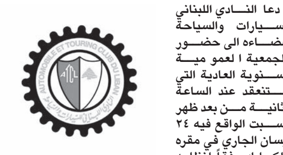
شعار النادي اللبناني للسيارات والسياحة

دعا النادي اللبناني للسيارات والسياحة اعضاءه الى حضور الجمعية العمومية الثانية من بعد ظهر السبت الواقع فيه ٢٤ نيسان الجاري في مقره بالكلية وفقاً لنظامه الأساسي. وفي ما يلي جدول الأعمال: