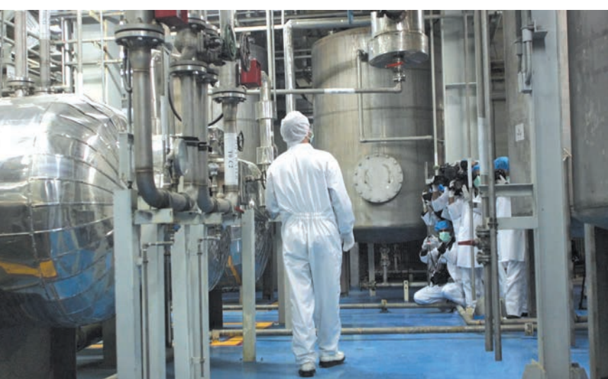
عملية تخصيب اليورانيوم

الطاقة الذرية الإيرانية أمس الجمعة الأمر، وقال إن طهران بدأت تخصيب اليورانيوم بنسبة ٦٠٪ في منشأة نطنز بعد أيام من انفجار في الموقع أقلت إيران مسؤوليته على إسرائيل. من جانبه، قال المتحدث باسم الاتحاد الأوروبي إن إعلان إيران تخصيب اليورانيوم (التتمة ص ١٢)