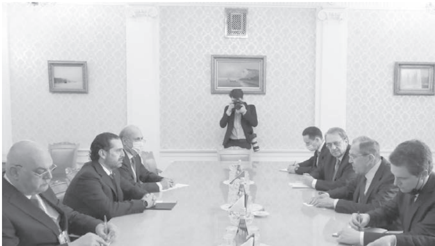
لافروف مجتمعاً مع الحريري

تري المصادر أن القيادة الروسية قادرة على لعب دور أساسي في المنطقة لأنها باتت حاضرة فيها بقوة وتحتاج إلى الإستقرار، وبالتالي هي تحاول تسهيل التسويات في لبنان، لأن إستقرار هذا البلد أساسي لسوريا، مشيرة إلى أنه انطلاقاً من الدور الروسي في المنطقة يمكن لروسيا التدخل مع السعودية لتغيير موقفها عبر تقديم فوائد في ملفات أخرى، ويعني آخر فإن روسيا قادرة على «البيع والشراء» مع كل دول المنطقة. من هنا، يمكن الحديث عن دور روسي مرتقب بشأن الأزمة اللبنانية، أما الحديث عن حجم هذا الدور فمتروك للمستقبل القريب، مع الإشارة إلى أن الملف الحكومي يعيش الجمود حالياً بانتظار أمر ما يعيد تحريكه.