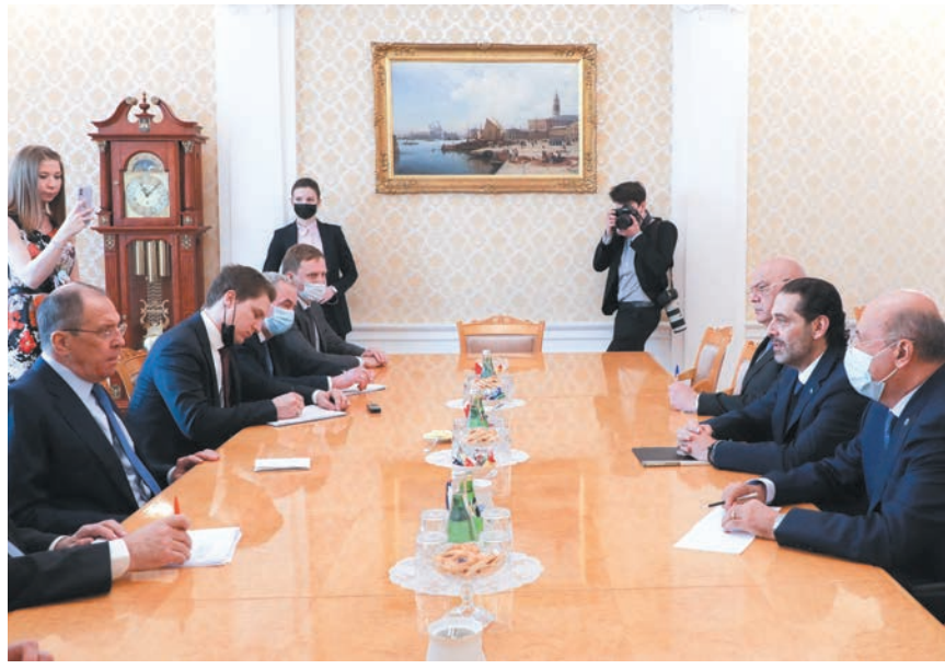
اجتماع الحريري ولافروف في موسكو

على صعيد آخر كشفت مصادر مطلعة للديار عن مراجع بارزة تخوفها من تداعيات ومخاطر الوضع في ظل التحذيرات التي ابلاغها حاكم مصرف لبنان رياض سلامة لكبار المسؤولين مؤخرا وما اعلنه وزير المال غازي وزنة مؤخرا بان سياسة (تتمة المانشيت)