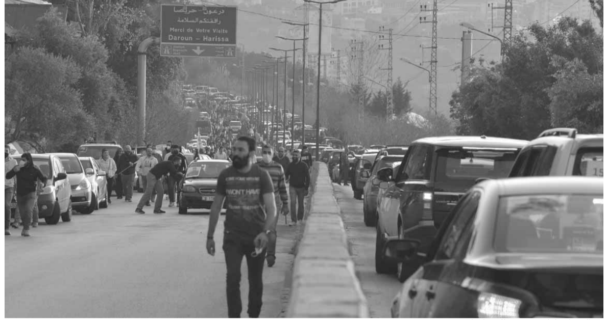
مواكب المواطنين تتجه الى بركي