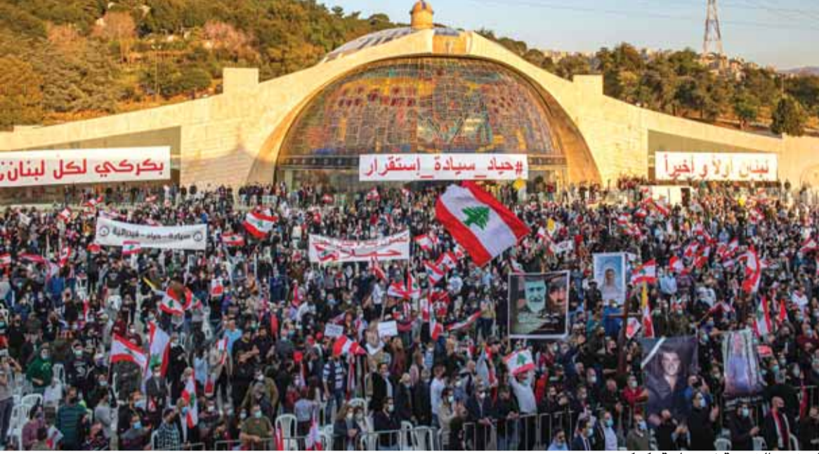
الحشود الشعبية في ساحة بكركي

الإيجابي الناشط. لا يختلف اثنان على أن خروج الدولة أو قوى لبنانية عن سياسة الحياد هو السبب الرئيس لكل أزماتنا الوطنية والحروب التي وقعت في لبنان. لقد أثبتت التجارب التاريخية، القديمة والحديثة، أن كلما انحاز البعض إلى محور إقليمي أو دولي، انقسم الشعب وعلق الدستور، وتعطلت الدولة وانتكست الصيغة اللبنانية، واندلعت الحروب. إن جوهر الكيان اللبناني المستقل هو الحياد. بل إن الهدف من إنشاء دولة لبنان الكبير هو خلق كيان حيادي في هذا الشرق بشكل صلة وصل بين شعوب المنطقة وحضاراتها، وجسر تواصل بين الشرق والغرب. واختيار نظام الحياد هو المحافظة على دولة لبنان في كيانها الحالي الذي أساسه الانتماء بالمواطنة لا بالدين، وميزته التعددية الثقافية والدينية، والانفتاح على كل الدول وعدم الانحياز. ونحن نجدد معكم الدعوة إلى اقرار حياد لبنان لكي نعطي للحياد صفة دستورية ثابتة بعدما ورد ذكره بأشكال شتى وتعايير مختلفة في وثيقة إنشاء دولة لبنان وفي خطاب رؤساء الجمهورية وفي بيان حكومة الاستقلال وبيانات سائر الحكومات المتتالية وصولاً إلى إعلان بعبدا في ١١ حزيران ٢٠١٢».