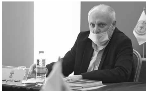
رئيس اتحاد المبارزة جهاد سلامة

يحل رئيس الاتحاد اللبناني للمبارزة المحاضر الأولمبي الدولي جهاد سلامة ضيفاً على برنامج «ريبلاي» الإسبوعي عبر شاشة تلفزيون OTV بعد ساعات قليلة على انتهاء انتخابات اللجنة الأولمبية اللبنانية واستقالته منها. ماذا سيكشف سلامة عن العملية الانتخابية، وماذا سيقول عن الاتحادات التي انقلبت على لائحته في اللحظة الأخيرة، وما هي الأسباب التي دفعتها إلى ذلك؟ هل سيبقى مستقبلاً العلاقة مع مكاتب الرياضة في الأحزاب اللبنانية الأخرى بعد كل ما جرى؟ كلها أسئلة سيجيب عليها سلامة ضمن «ريبلاي» مع الزميل أيلي نصار اليوم الأحد استثنائياً عند الساعة ١٨،١٥ مساءً.