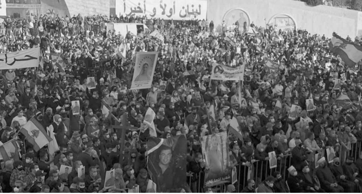
الحشود تملأ الساحة