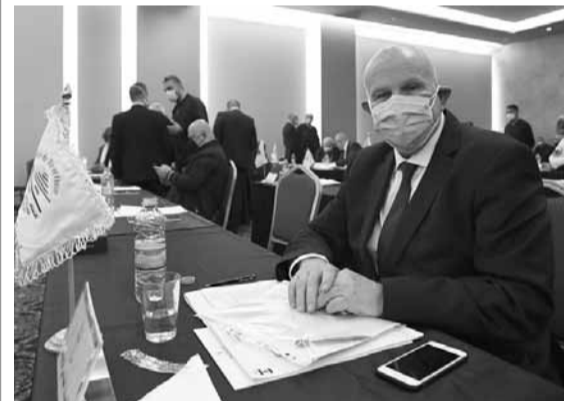
رئيس اللجنة الأولمبية بيار جليخ

حصل القسم الرياضي في «الديار»، على السيرة الشخصية للرئيس الجديد للجنة الأولمبية بيار جليخ كالآتي: ولد بيار جليخ في ٢٣ حزيران ١٩٥١ ومات له ولدان. يتقن العربية والفرنسية والإنكليزية وحائز على شهادة في إدارة الأعمال ودكتوراه فخرية من جامعة الروح القدس (الكسليك) وله عدة مناصب ضمن نقابة المستشفيات التي جانب تبوّه عدة مناصب في عدد من المصارف في ثمانينات القرن الفائت إلى جانب عدة مناصب في عهد رئيس الجمهورية السابق الشيخ أمين الجميل (١٩٨٢-١٩٨٨). يشغل جليخ منصب مدير عام «مستشفى العين والأذن»، منذ تأسيسها. على الصعيد الرياضي، شارك جليخ في أكثر من ٧٥ مسابقة دولية بالرمية واحرز لقب بطولة لبنان للرمية من الحفرة الأولمبية «قراب» عامي ١٩٨٨ و١٩٩٥ وانتخب نائباً لرئيس