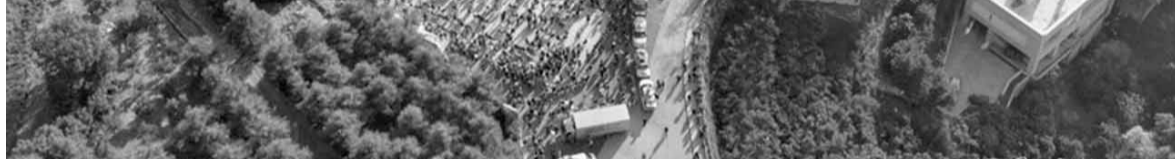
صورة جوية للصرح

وختم الراعي «لبنان شعب وليس أفرادا، وأنتم، أنتم شعب لبنان. أنتم لبنان بما يمثل من رسالة وقيم وروح، ومن تعددية ثقافية ودينية. والبطيريك لا يفرق بين لبناني وآخر، لأن التضامن أساس وحدتنا، ووجدتنا في لبنان واحد هو