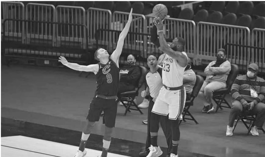
ليجيرون جيمس من ليكرز يسدد الكرة بمضايقة أحد لاعبي كليفلاند

وسجل دونسيش (٢١ عاماً) ٣٥ نقطة، ١١ متابعات و٦ تمريرات حاسمة، فيما كان مايكل بورتز الذي دخل