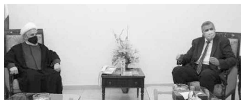
كوبيش يزور قاسم

واستقبل مفتي الجمهورية اللبنانية الشيخ عبد اللطيف دريان في دار الفتوى كوبيش، في زيارة وداعية بمناسبة انتهاء خدماته في لبنان، وتم تداول الشؤون العامة.