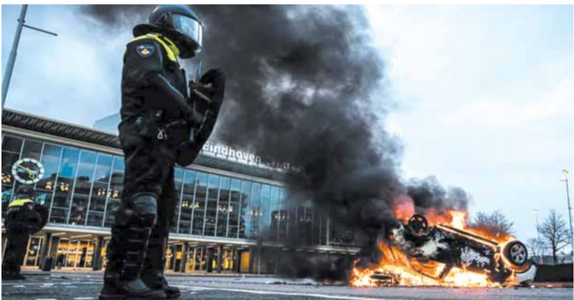
العنف يضرب هولندا

رئيس الوزراء الهولندي مارك روتيه وصف العنف الذي صاحب الاحتجاجات بأنه «غير مقبول وأن ٩٩٪ من الناس يلتزمون بالقواعد الجديدة الأكثر صرامة، بما في ذلك حظر التجول»، وتساءل: «ما الذي يمتلكه المحتجون لتبرير ما يرتكبونه من تخريب وسرقات وعنق؟ وهذا ليس له علاقة بالاحتجاج، إنه عنف إجرامي وهذا سنتعامل معه».