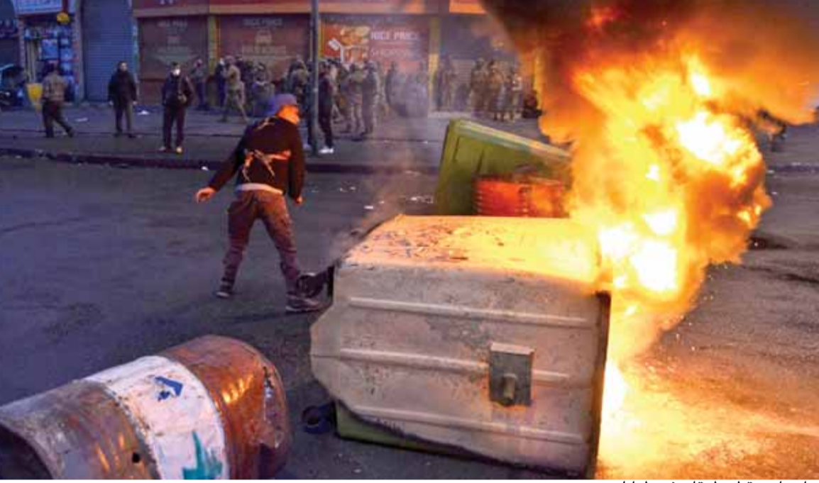
مواجهات وقطع طرقات في طرابلس