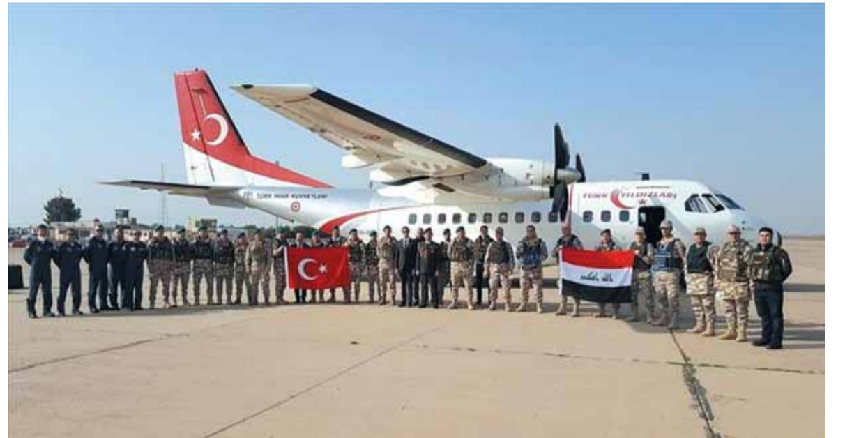
البعثة التركية في العراق

أعلنت وزارة الدفاع التركية، إرسال ٢٥ مستشارا عسكريا إلى بغداد لدعم الجيش العراقي، ضمن بعثة حلف شمال الأطلسي «ناتو».