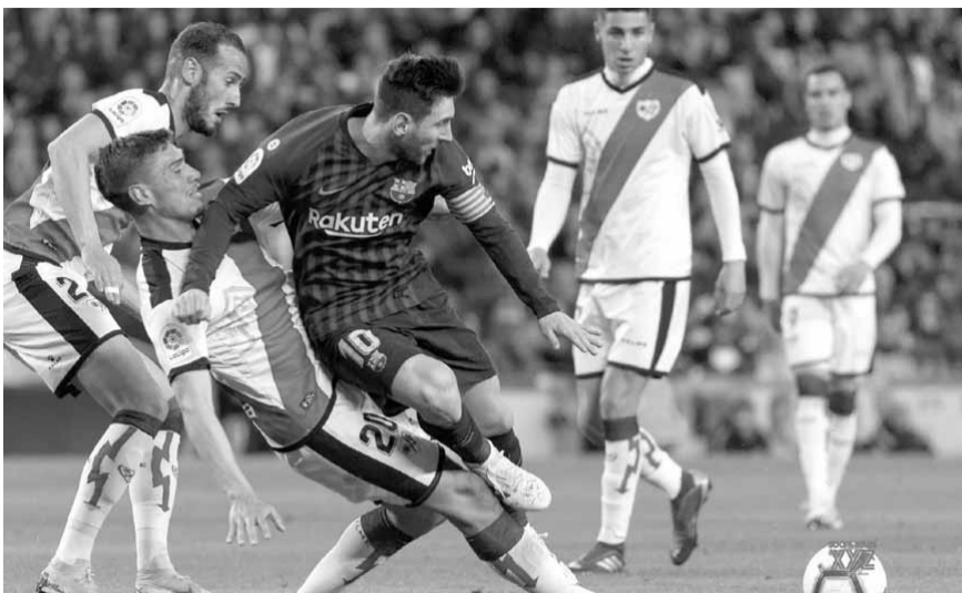
من إحدى مواجهات برشلونة ورايو فالينكانو

وقال كومان بشأن هدف بويغ «سعدت بالهدف، كان