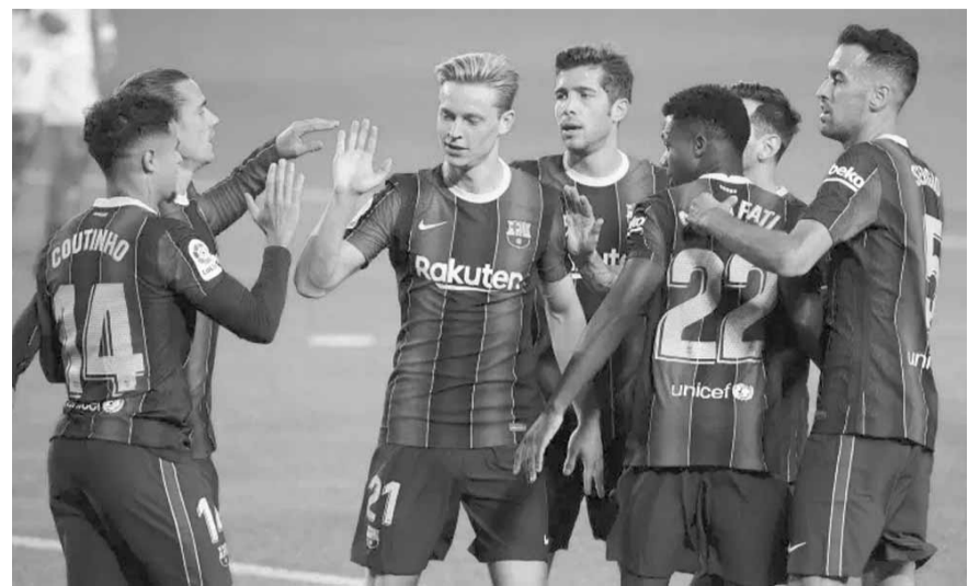
لاعبو برشلونة لم يتلقوا الدفعة الأولى من الرواتب

دخل برشلونة في أزمة اقتصادية كبيرة، بعد أن تراكمت الديون على النادي الكاتالوني.