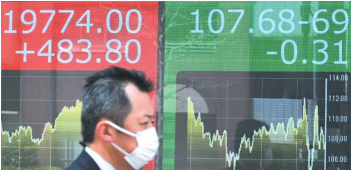
أسوأ أزمة اقتصادية منذ مائة عام

وأضافت: «سيؤدي ٢٥ عنصرنا، أحدهم برتبة عميد، مهامها ضمن بعثة الناتو في العراق».