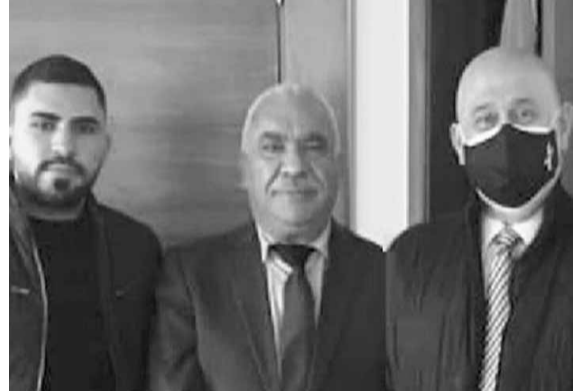
الوفد عند حب الله

وتسال بكداش: كيف سيتمكن الموظفون من قبض رواتبهم في نهاية الشهر والأذونات التي تعطى لتزيد الضعف خصوصاً ان البعض تخلى عن الكريديت كارت التي كان يحملها بعد ان تم حجز الاموال في المصارف واصبح يأخذ امواله بالقطارة كما ان اصحاب العمل هل بمقدورهم سحب الاموال كلها للموظفين من المصارف التي تحدد كمية الاموال التي يمكن سحبها.