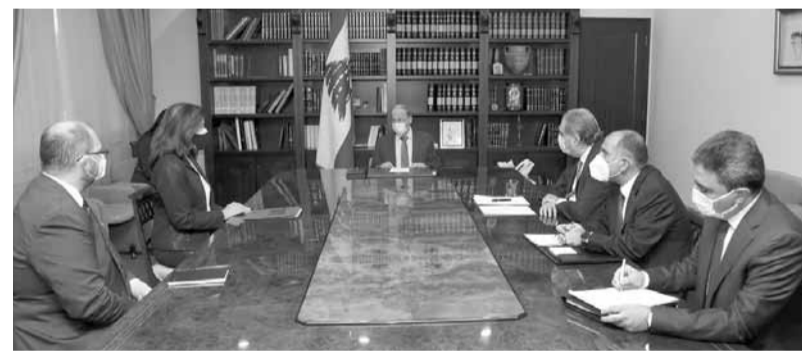
عون مجتمعاً مع شيا

عون على موقف لبنان لجهة معاودة اجتماعات التفاوض انطلاقاً من الطروحات التي قدمت خلال الاجتماعات السابقة. وحضر اللقاء عن الجانب الأميركي مستشار الشؤون السياسية والاقتصادية في السفارة الأميركية في بيروت Andrew Daehne، وعن الجانب