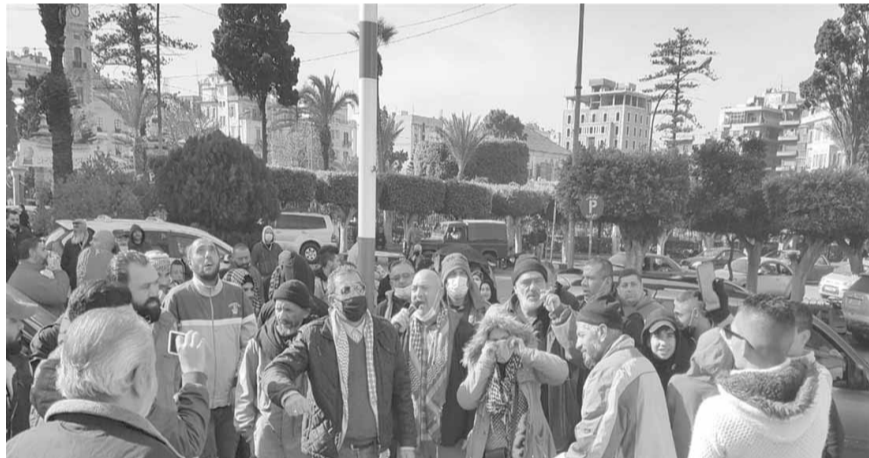
تحركات في صيدا

تحرك الشارع من جديد اليوم في اكثر من منطقة، احتجاجاً على الأوضاع المعيشية الصعبة التي فاقها الإقفال التام لمواجهة كورونا. وعمد عدد من المحتجين، الى قطع الطرق بالشاحنات وما تيسر، واحرقوا الاطارات ومستوعبات النفايات، لرفع الصوت.