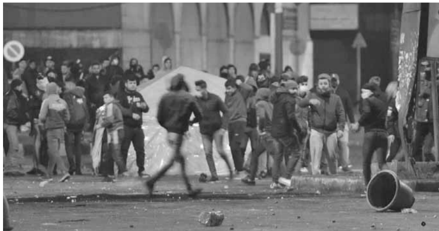
احتجاجات في طرابلس