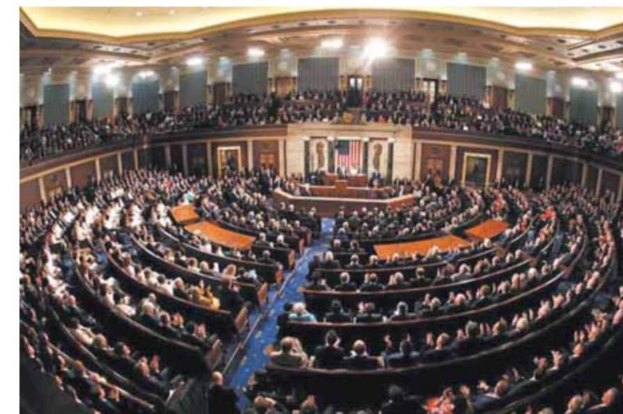
مجلس الشيوخ الأميركي

تسلم مجلس الشيوخ الأميركي، مساء الاثنين، التشريع الخاص بعزل رئيس الولايات المتحدة السابق، دونالد ترامب، في إطار قضية اتهمه بالتحريض على التمرد. وفي مشهد تم بثه على الهواء مباشرة، نقل ٩ أعضاء في مجلس النواب، الذين سيتولون مهام الادعاء في المحاكمة، لأحنة الاتهام الخاصة بعزل ترامب إلى مجلس الشيوخ، متبعين نفس المسار الذي سلكه حشد لأنصار الرئيس السابق خلال اقتحامهم مقر الكونغرس يوم ٦ كانون الثاني. ومن المتوقع أن يباشر مجلس الشيوخ محاكمة الجمهوري ترامب خلال الأسبوع الذي يبدأ يوم ٨ شباط، حسبما أعلن سابقاً زعيم الأغلبية الديمقراطية، تشاك شومر. ويتطلب نجاح عملية عزل ترامب دعماً من قبل ثلثي أعضاء مجلس الشيوخ المكون من ١٠٠ سيناتور سيلعبون دور المحلفين خلال جلسات المحاكمة.