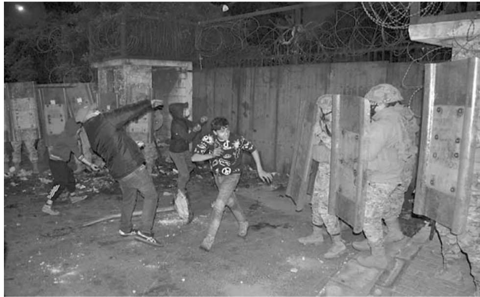
الاحتجاجات في طرابلس

وطالب البيان السلطات الأمنية والقضائية بالقيام بواجباتها والتحرك السريع