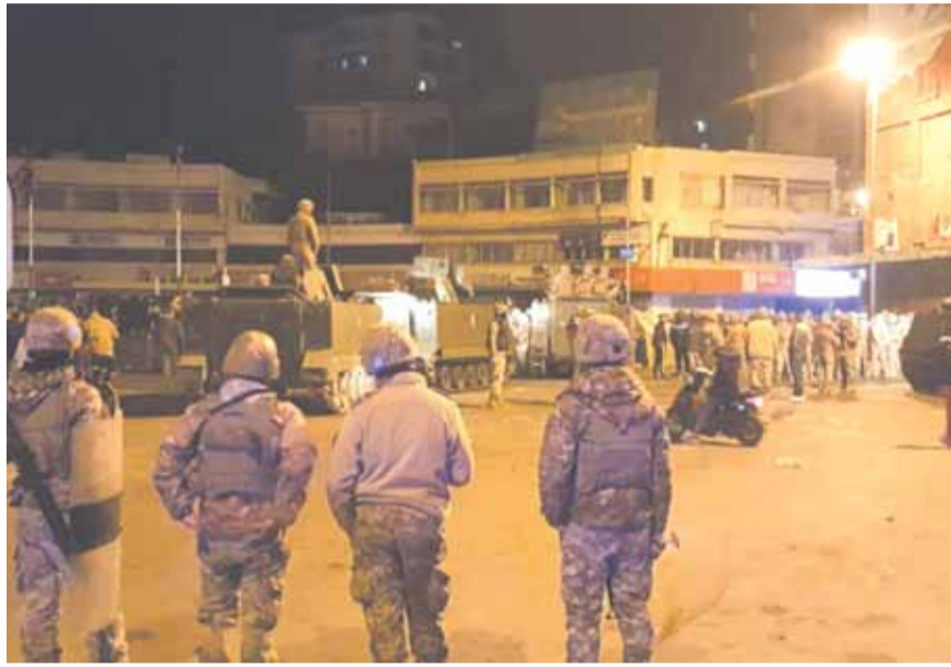
الجيش اللبناني في ساحة النور في طرابلس

١٤ شباط. وفي ظل انسداد الأفق داخليا ينتظر رئيس الجمهورية ميشال عون ايضا اتصالا من الرئيس الفرنسي إيمانويل ماكرون لاستكشاف الواقع الدولي والإقليمي ومستقبل سياسة الرئيس الأميركي جو بايدن في المنطقة خصوصا بعد الاتصال الأخير بين «البيت الأبيض» و«قصر الإليزيه» حيث كان لبنان ضمن الملفات التي تم بحثها، ووفقا للمعلومات الخاصة «بالديار» فإن رئيس الجمهورية يريد حسم ملفين أساسيين مع تظيره الفرنسي الأول محاولة اقتناعه بأن الحريري ليس رجل «المرحلة» ومستقبل التعاون ومعه لانقاذ البلاد محفوفة بالمخاطر، أما الملف الثاني فهو مستقبل حاكم مصرف لبنان، ويسعى عون إلى الاطلاع على حقيقة الدور الفرنسي في اطلاق مسار التحقيقات في سويسرا، ويعول على هذا المسار القضائي (تنمة المانشيت ص ١٢)