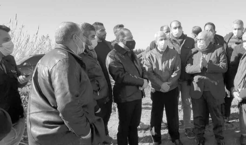
خلال جولته على الأضرار

وجه وزير الزراعة في حكومة تصريف الأعمال عباس مرتضى كتابين منفصلين إلى رئيس حكومة تصريف الأعمال حسان دياب ووزير الطاقة ريمون غجر، طالباً «تكليف المعنيين القيام بمسح عاجل للأضرار في مناطق سهل عكار نتيجة فيضان مياه نهري الكبير والأسطوان ومجرى النهر الكبير وتعويض المتضررين واتخاذ الإجراءات الفنية اللازمة على ضفاف كلا النهرين، حماية للسلامة العامة وحفاظاً على القطاع الزراعي والمزارعين وأرزاقهم»، وذلك بعد زيارة لمرتضى في المناطق المتضررة.