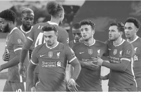
لاعبو ليفربول في اختبار صعب أمام توتنهام

ويخوض ليستر المباراة في غياب هدفه المخضرم جيمي فاردي الذي سيخضع لعملية جراحية لإزالة الفتق وسيغيب عن الملاعب لعدة أسابيع بحسب مدرب الفريق الإيرلندي الشمالي براندر رودجرز.