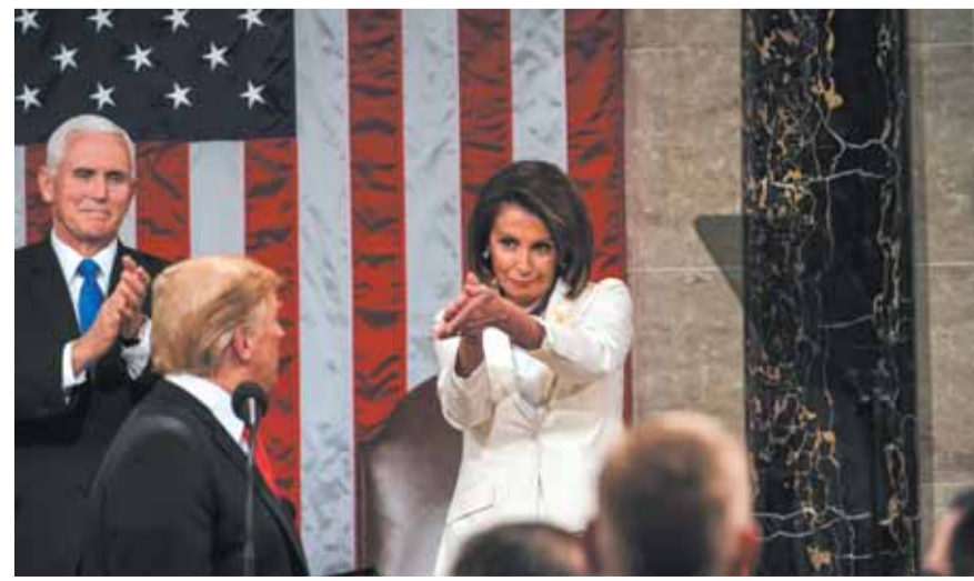
ترامب وبيلاوسي في صورة أرشيفية

تواصل في واشنطن الاستعدادات السياسية والأمنية لمحاكمة الرئيس السابق دونالد ترامب بتهمة التورط في حادثة اقتحام الكونغرس، التي خلفت قتلى وجرحى وأحدثت فوضى عارمة في عاصمة أقوى دولة في العالم. ووسط استمرار الوجود العسكري في واشنطن خوفاً من حصول هجمات، أكد الديمقراطيون أن الادعاء بحوزته ملفاً كاملاً عن حادثة اقتحام الكونغرس. كما أكد جمهوريون رفضهم للمحاكمة ولوحوا بالانتقام، وكشف محيطون بترامب عن خطط سياسية يعكف عليها لمواجهة محاكمته. وقد رفضت النائبة الديمقراطية مادلين دين الكشف عن إستراتيجية فريق الادعاء في محاكمة ترامب بمجلس الشيوخ.