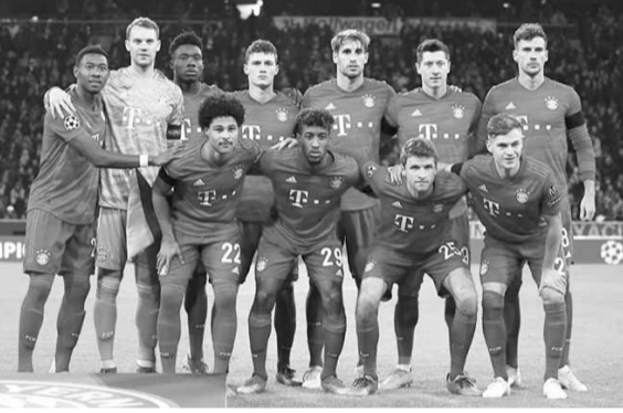
فريق بايرن ميونيخ

وقال مايكل تسورك مدير الكرة ببنادي بوروسيا دورتموند عقب الهزيمة أمام مونشنغلاذباخ ٢-٤ «عندما تسمح بثلثي الشباك ٣ أهداف من كرات ثابتة أمام مثل هذا الفريق الجيد في مباراة كهذه، يمكنك نسيان تحقيق نتيجة إيجابية، هكذا هو الأمر ببساطة».