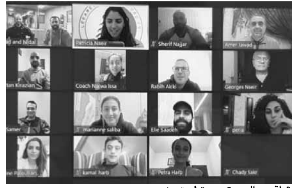
لقطة من الدورة عبر تطبيق «زوم»

شارك في الدورة مدربون من جميع المناطق اللبنانية الشوف، زحلة، البقاع، المتن، الجنوب، الشمال، بيروت وكسروان. وفي مرحلة لاحقة سيتم توزيع الشهادات على المدربين الناجحين بعد إجراء امتحان لكل درجة.