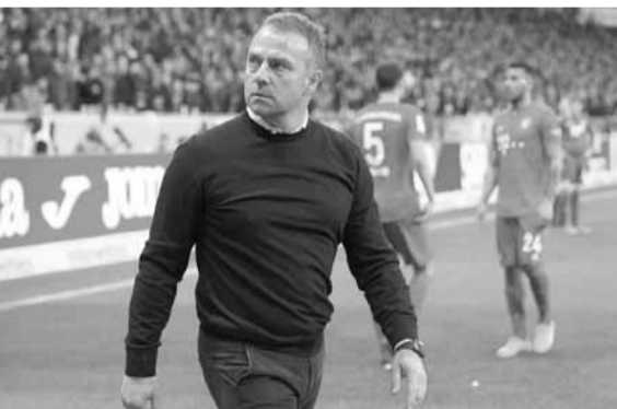
مدرب بايرن ميونيخ هانز فليك

ولم يعد أمام فليك سوى لقب مونديال الأندية، لتعويض إخفاق معلمه يوب هاينكس قبل أكثر من ٧ سنوات، ليصبح ثاني مدرب يحقق هذا الإنجاز التاريخي بعد غوارديولا.