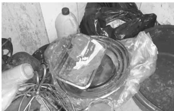
اللحوم المنتهية الصلاحية

وجال مراقبون من مديرية حماية المستهلك في وزارة الاقتصاد، بمواظرة من عناصر مكتب حلبا في مديرية من الدولة في محافظة عكار، على محطات المحرقات ومحلات بيع الأعلاف في المنطقة، للتأكد من عدم الاحتكاك. وشملت الجولة بلدة حلبا إلى الخط