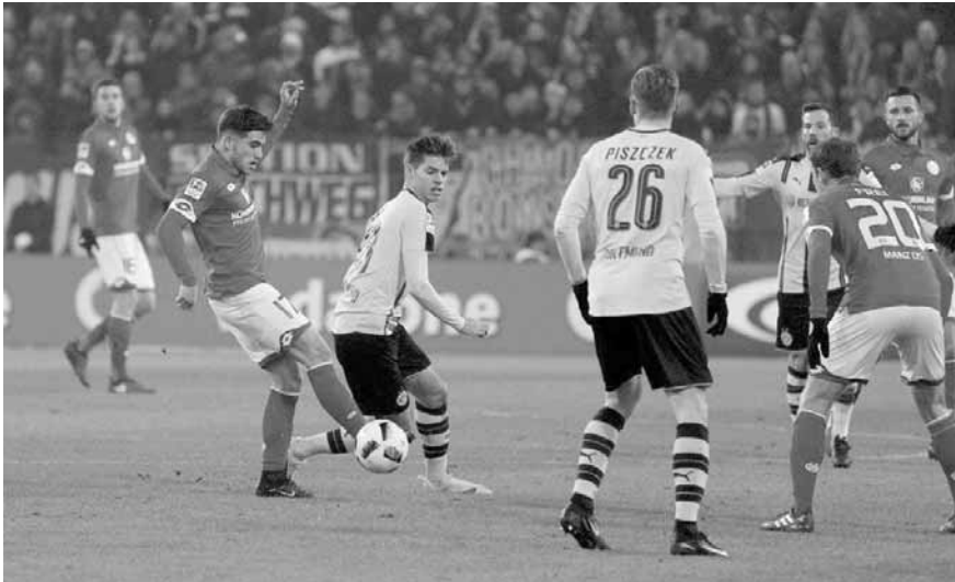
من مباراة بوروسيا دورتموند وماينتس