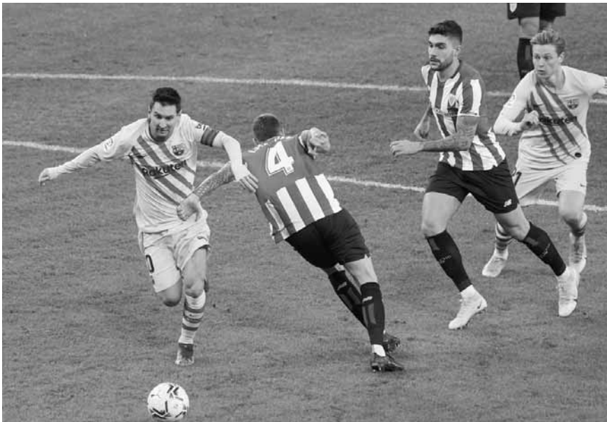
من إحدى مواجهات برشلونه وأتلتيك بيلباو

يسمح للبرغوث بالتدريب بشكل طبيعي أو اللعب دون التعرض لخطر الإصابة. وقالت الصحيفة إن ميسي ذهب للمدينة الرياضية لبرشلونه، الخميس الماضي، لاختبار نفسه، واكتشف أنه في حالة أفضل من الأيام السابقة.