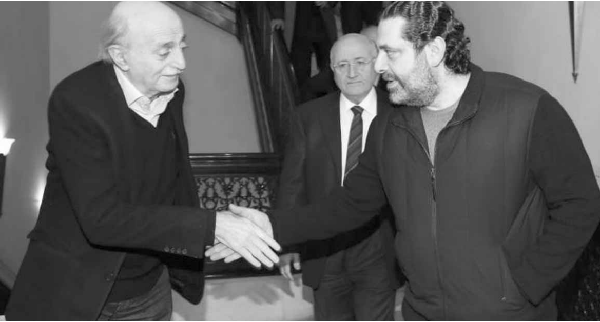
الحريري وجنبلاط من دارة سلام

المنال على الرغم من ان هدفهم واحد وهو «زكّزة» العهد. كما ان العلاقة السيئة بين الحريري وجعجع لا تزال على حالها، فلا ثقة بين الرجلين لأن كلاً منهما لم يعد يثق بالآخر، من دون ان تؤدي وساطة البعض الى اعادة المياه الى مجاريها بينهما، مما يؤكد أن هدف الثلاثي ضد العهد سيبقى صعب التحقيق.