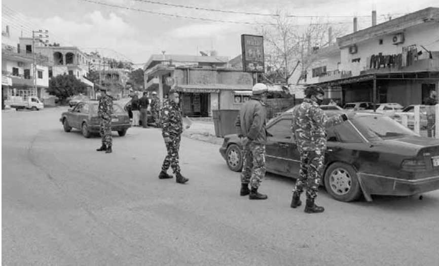
حاجز لقوى الامن في عكار

في ثالث ايام الاقفال التام، سجل التزام شعبي وتجاري مقبول واكثر.