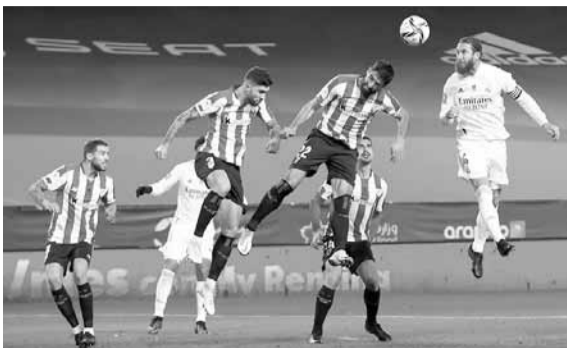
راموس في كرة رأسية