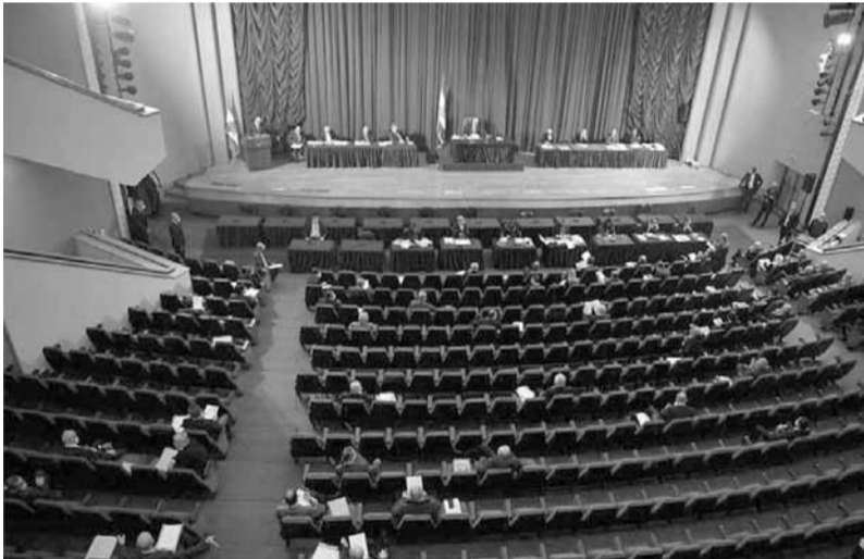
الرئيس بري مترسداً الجلسة امس

ثم انتقل المجلس الى مناقشة اقتراح قانون معجل مكرر يتعلق بتأميد التصاريح المنصوص عنها في القانون ١٨٩ حتى آخر آذار، فاقره، كما اقر اقتراحا معجلاً مكرراً يرمي الى الاجازة بجباية الواردات واتفق الدولة على قاعدة الاذني عشرية اعتباراً من شباط المقبل.