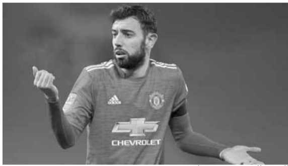
البرتغالي برونو فرنانديز

حقق البرتغالي برونو فرنانديز، لاعب وسط مانشستر يونايتد، إنجازاً تاريخياً في الدوري الإنجليزي الممتاز. وأعلنت رابطة البريميرليغ، أمس الجمعة، فوز فرنانديز بجائزة أفضل لاعب في الدوري الإنجليزي عن شهر كانون الأول المنصرم.