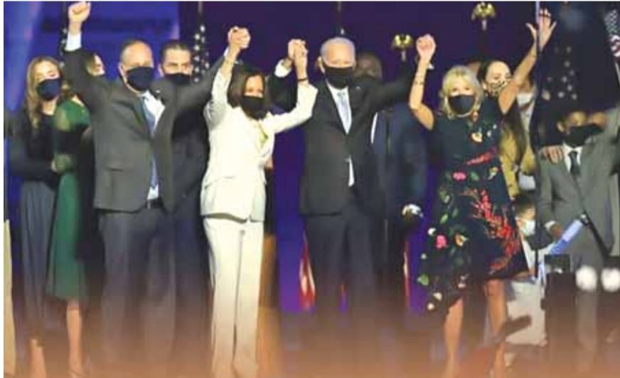
فريق الاتصال الخاص بالرئيس في البيت الابيض سيتكون من الإناث حصراً

وقالت ولاية ويسكونسن إن النتائج أكدت فوز الرئيس الديمقراطي المنتخب جو بايدن فيها، وسوف تعلن الولاية لاحقاً عن التصديق على النتائج.