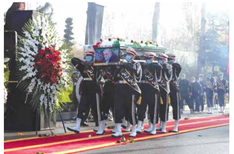
خلال تشييع العالم الإيراني «فخري زاده»