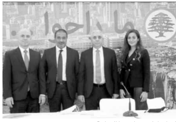
القوات اعلنت مبادرتها الدوائية

– أما الأدوية الجنيسية التي لا يمكن تصنيعها محلياً، فيستمر دعمها بنسبة ٨٥٪ للأدوية المسجلة بأدنى سعر على أن تكون مصنعة في أحد البلاد المرجعية وتستوفي شروط السلطات المرجعية الدولية. (ربطاً لألحة بالدول المرجعية المعتمدة لدى وزارة الصحة، وصورة عن المرسوم لتبنيان سلطات المرجعية الدولية المعتمدة في تسجيل الدواء). ٢ – في صناعة الدواء الوطنية: – تغطية الأدوية التي تصنع في لبنان سواء أصيلة أو جنيسية بنسبة ١٠٠٪ للمواد الأولية و٨٥٪ للمواد التصنيغية التابعة لها مثل التوليف. – إعطاء الأولوية للأصناف المصنعة محلياً على سواها في أي مناقصة محلية، بهدف وصول تغطية المصانع اللبنانية وحاجة السوق. – تشجيع معملين لبنانيين على صناعة الدواء نفسه لتلافي إي نقص في السوق مستقبلاً».