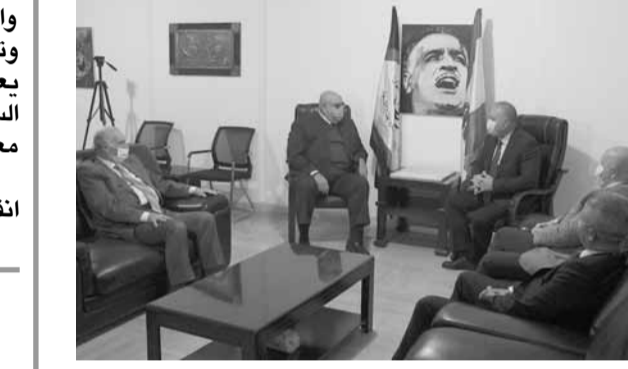
السفير الروسي يزور حمدان

استقبل من الهيئة القيادية في حركة الناصريين المستقلين- المرابطون العميد مصطفى حمدان، سفير دولة روسيا الاتحادية ألكسندر نيكولايفيتش روداكوف برفاقه المستشار ديميتري لبيديف في مقر الهيئة، في حضور أعضاء الهيئة الأمين المساعد الدكتور يوسف الطيش والدكتور محمد السليبي. وأكد روداكوف خلال اللقاء «حرص ودعم روسيا الدائم لاستقرار لبنان السياسي والاقتصادي والاجتماعي. وشكر العميد مصطفى حمدان السفير روداكوف على «زيارته للمرابطون، منمناً «الدور الروسي في الوقوف مع القضايا المحقة لشعوب المنطقة العربية وفي مقدمها القضية الفلسطينية».