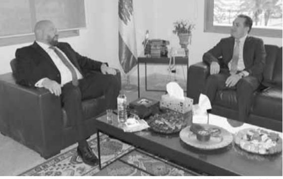
حواط في بلدية الميناء

بلدية الميناء التي تعتبر لؤلؤة طرابلس، هي لشكر المحافظ نهرًا على جهوده التي يبذلها في الشمال عموماً وفي مدينتي طرابلس والميناء خصوصاً، كما وأشكر العاملين والاداريين في البلدية ونأمل ان يستمروا في تقديمهم نحو الأفضل في المدينة. بحثنا مع المحافظ نهرًا في الأوضاع كافة من حفريات واضاءة المدينة وصولاً الى الاعمال التي تقوم بها شرطة البلدية لخدمة المواطنين ضمن نطاق المدينة». اضاف: «لاحظنا ان أعمال البلدية تدار بشكل سليم ولكننا نأمل بأن العاملين في البلدية يقومون بكل واجباتهم في سبيل الحفاظ على الصورة العامة لهذه البلدية كلؤلؤة على البحر الأبيض المتوسط». وطمان المواطنين والشمال بأنه «يعمل على تأمين الفايبر اوبتيك في الميناء وطرابلس، وان سنترالي الميناء والبصااص اصبحا جاهزين لتقديم خدمة الفايبر لكل زبائنهما، وقرىبا سننتقل الى سنترالي التل وباب القناتة».