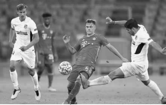
من مباراة الذهاب بين بايرن ميونخ وأتلتيكو مدريد

نجح بايرن ميونخ الألماني حامل اللقب في الفوز بصدارة مجموعته في دوري أبطال أوروبا، مما يعني أن رحلته إلى إسبانيا لمواجهة أتلتيكو مدريد ستكون مجرد مباراة أخرى يجب خوضها.