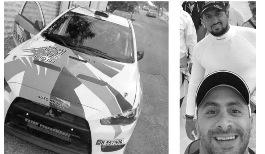
سيارة خالد وميتسوبيتشي لانسر افجو ١٠