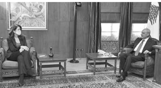
بري مستقبلاً السفيرة الأميركية

استقبل رئيس مجلس النواب نبيه بري في مقر الرئاسة الثانية في مبنى القبة، سفيرة الولايات المتحدة الاميركية دوروثي شيا التي غادرت دون الالاء بتصريح.