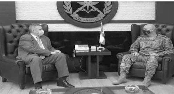
كوبيتش يزور قائد الجيش

زار المنسق الخاص للأمم المتحدة في لبنان يان كوبيتش، قائد الجيش العماد جوزاف عون في مكتبه في البرزة، وجرى التداول في شؤون لبنان والمنطقة.