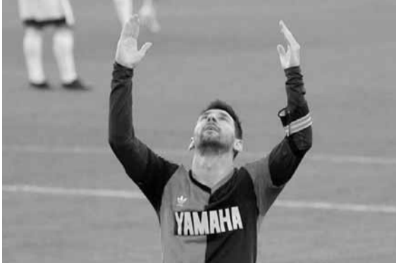
تغريم برشلونة بسبب هذه اللحظة

كرم ليونيل ميسي نجم وقائد برشلونة، مواطنه ديبغو مارادونا، الذي توفي منذ أيام قليلة بعد تعرضه لازمة قلبية. وسجل ميسي الهدف الرابع لبرشلونة في شباك أوساسونا، خلال مباراة الفريقين الأحد، وأهدى الهدف لروح مارادونا، حيث كان يرتدي قميصه مع نيولز أولد بويز. وهو فريق مشرّك لعب له التجمان.