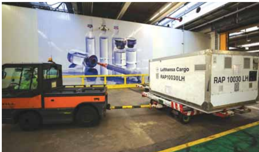
الشحنات الأولى انطلقت

تقارير صحفية تحدثت عن «شحنة كبيرة»... وصممت «فايزر» حاويات شحن خاصة بحجم حقيبة اليد، تحمل حوالي ٩ كيلوغرامات من الجليد الجاف، للحفاظ على اللقاح في درجات حرارة مناسبة. إلا أن كمية الجليد الجاف التي يمكن لأي طائرة حملها لها معايير محددة تتعلق