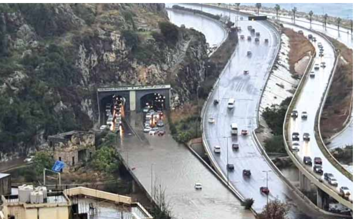
الطرق مقلوبة بسبب الامطار الغزيرة

مع شركاء دوليين يوم الثاني من كانون الأول لبحث تقديم مساعدات إنسانية للبنان الذي يعاني أزمة مالية». حيث يبدو واضحاً أن باريس تسعى جاهدة لابقاء مبادراتها السياسية-الاقتصادية على قيد الحياة عبر منع سقوط لبنان نهائياً خصوصاً بعد الإنذار الأخير الذي اطلقه حاكم مصرف لبنان رياض سلامة عن أن الدعم للمواد الأساسية من اغذية ومحروقات وأدوية لن يكون متوفراً في الأشهر المقبلة، في ظل عدم تشكيل حكومة جديدة واقرار برنامج مساعدات من صندوق النقد الدولي والمؤسسات الدولية المانحة. الي ذلك، لا تزال مسألة تشكيل الحكومة في خاتمة «مكاثك راوح»، حيث لم يطراً حتى الان اي متغير على صعيد الخلاف الحاد الذي نشأ في اللقاء الأخير بين رئيس الجمهورية العماد ميشال عون والرئيس المكلف سعد الحريري على المقاعد المسيحية واصرار الحريري على تسمية معظم الوزراء المسيحيين وترق مقعدين وزاريين لعون لكي يسميهم.