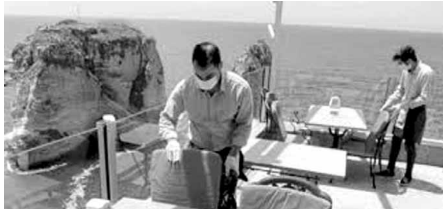
أزمة اقتصادية ووضع صحي دقيق