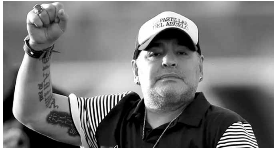
النجم الراحل ديبغو مارادونا

تندثر الحياة المضطربة لأسطورة كرة القدم الأرجنتينية والعالمية، ديبغو مارادونا، الذي فارق الحياة الأربعاء الفائت عن ٦٠ عاماً إثر انتكاسة صحية، بنزاع داخل عائلته بطل مونديال ١٩٨٦. وتوقع مصدر مقرب من العائلة، فضل عدم الكشف عن اسمه، أن «تندلع معركة كبيرة» حول تقاسم ميراثه لأنه «لم يترك وصية»، وذلك في تصريح له بعد وفاة الأسطورة الذي يصعب معرفة حجم ثروته وما إذا قام بتوزيعها قبل مماته. لكن منذ تلك الرسالة التهديدية، تصالح مارادونا وابنته كما اتضح من الرسائل العاطفية التي نشرت على وسائل التواصل الاجتماعي من قبل جانيئا وشقيقته دالما خلال عيد الميلاد الستين لوالدهما في ٣٠ تشرين الأول الماضي.