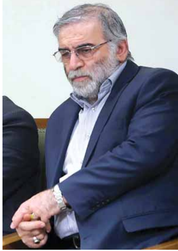
العالم الإيراني محسن فخري زاده

اتهم الرئيس الإيراني حسن روحاني، في كلمة نقلها التلفزيون الرسمي أمس السبت، إسرائيل باغتيال العالم الإيراني البارز محسن فخري زاده، في حين دعا المرشد الأعلى للجمهورية علي خامنئي إلى «معاقبة حتمية» للمسؤولين عن الاغتيال. وتوعد القادة الدينيون والعسكريون بالثأر لمقتل فخري زاده الذي ذكرت وسائل الإعلام المحلية أنه فارق الحياة في المستشفى الجمعة، بعد أن أطلق مسلحون النار عليه وهو في سيارته بمدينة أيسرد بمقاطعة دماوند شرق طهران العاصمة. ونقل التلفزيون عن روحاني قوله في بيان «مرة أخرى، تطلخت أيدي الغطرسة العالمية الخبيثة بدماء أراقها مرتزقة النظام الصهيوني المغتصب». وتابع «اغتيال الشهيد فخري زاده يظهر بأس الأعداء وشدة كراهيتهم.. استشهاد لن يبطل إنجازاتنا». وبعيد تأكيد وفاة فخري زاده، وجّه وزير الخارجية محمد جواد ظريف، عبر تويتر، أصابع الاتهام إلى إسرائيل، متحدثاً عن «مؤشرات جديدة» لدور لها في الاغتيال.