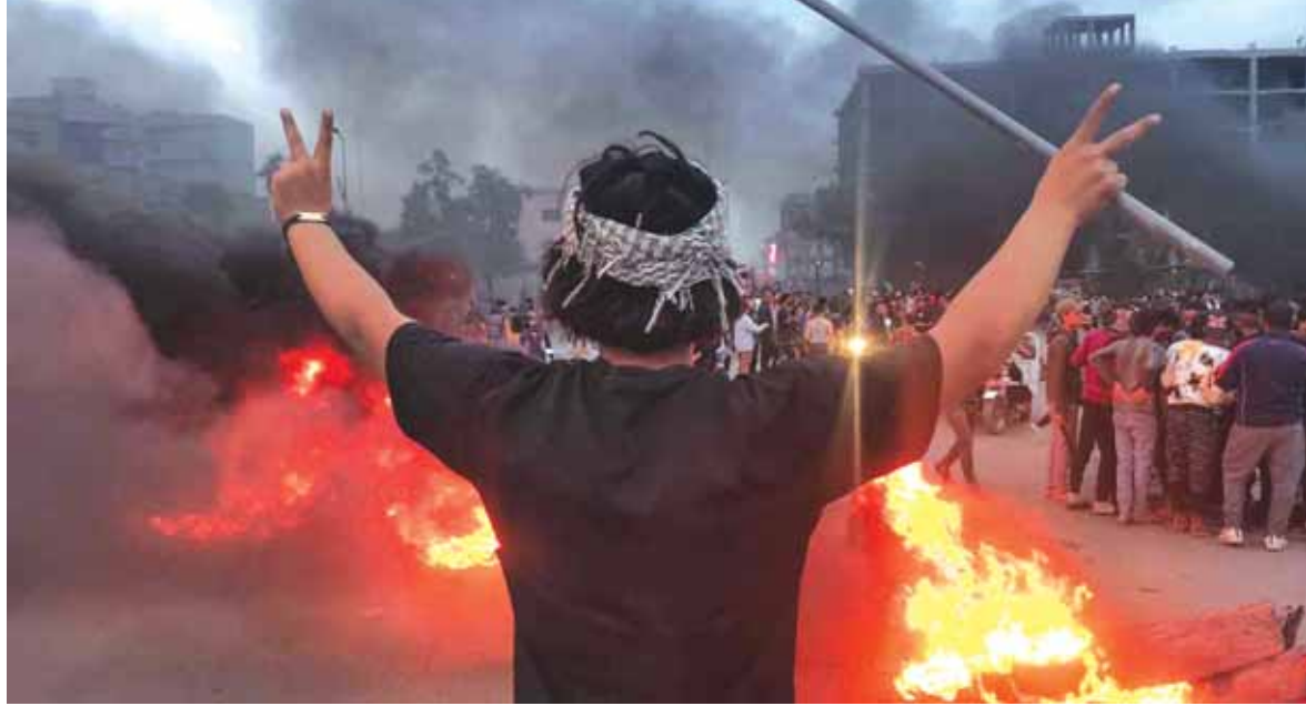
احتجاجات في العراق

تصاعدت الاحتجاجات في محافظة «ذي قار» العراقية، بعد مقتل ٣ أشخاص في مواجهات بين متظاهرين وأنصار «التيار الصدري» جنوب العراق، أمس الأول الجمعة. وقطع محتجون في «ذي قار» جسر «الحضارات» وسط مدينة الناصرية مركز المحافظة جنوب البلاد، بالإطارات المحترقة، فيما أغلقت القوى الأمنية الحواجز الخارجية