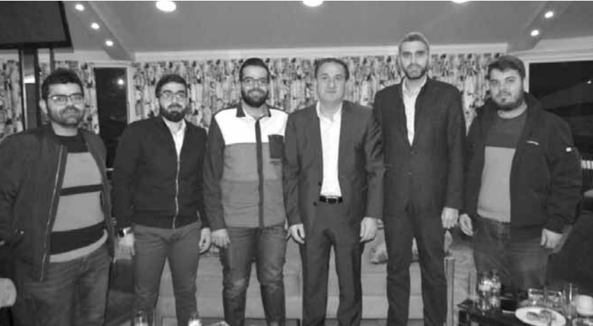
حواط مع الوفد

التي فرضتها بداية العام الدراسي في ظل جائحة كورونا، ودور وزارة الاتصالات في التخفيف من معاناة التلامذة والإهالي على مختلف الصعد.