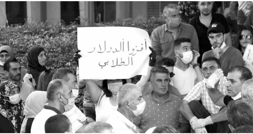
اعتصام لأهالي الطلاب اللبنانيين في الخارج

من المستحيل علينا القدرة على تغطية نفقات ابنائنا في الخارج الذين يعانون اشد الظروف، ونحن جلنا من الطبقات التي كانت وسطى (اجراء وموظفين ومتقاعدين واصحاب حرف بسيطة) واضحت الان معدومة، وقد تحركنا تجاه السلطات اللبنانية واثمرت جهودنا اقرار قانون سمي قانون الدولار الطلابي... الا ان المصرف المركزي امتنع عن تطبيق القانون».