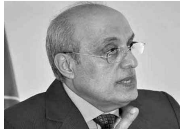
أبو شرف: الوضع دقيق

وختم «الالتزام هذه المرة بقرار الإقفال كان أكبر من السابق، ويعود ذلك إلى شموله مختلف القطاعات، وتطبيق القوى الأمنية والبلديات الإجراءات، مع زيادة الوعي لدى المواطنين وتأييد الإعلام دوراً أساسياً».