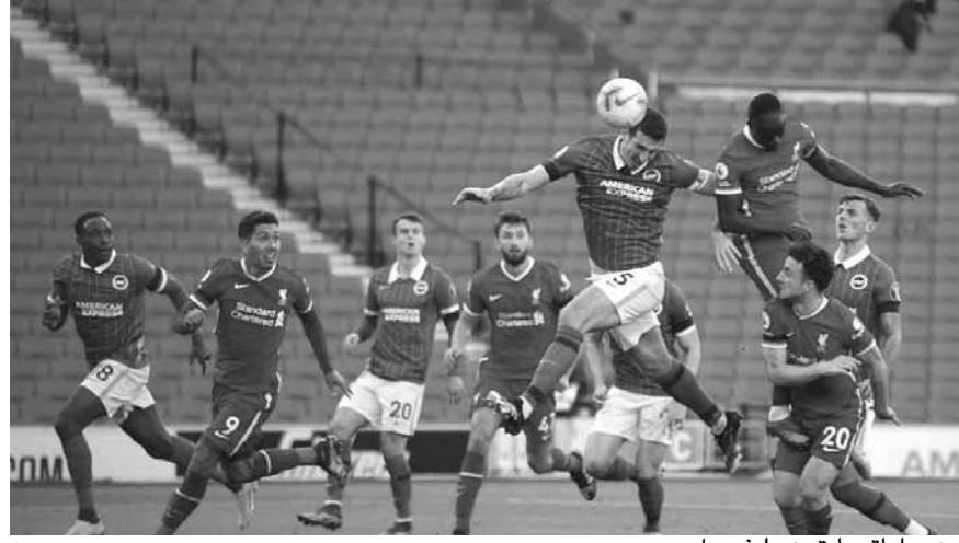
من مباراة برايتون وليفربول

فرض برايتون التعادل على ضيفه ليفربول (١-١)، في المباراة التي احتضنها ملعب فالمر أمس السبت، ضمن لقاءات الجولة العاشرة من الدوري الإنجليزي الممتاز. وسجل هدف ليفربول ديوجو جوتا (٦٠)، بينما سجل هدف برايتون باسكال غروس (٩٣). وبهذه النتيجة رفع ليفربول رصيده إلى ٢١ نقطة، ليترقى إلى صدارة جدول الترتيب، بينما رفع برايتون رصيده إلى ١٠ نقاط في المركز الـ١٦.