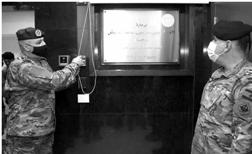
قائد الجيش يفتتح قسم العمليات الجراحية

باحدث المعدات المتطورة واستمع الى شروحات عنها. وألقى العماد عون كلمة شكر فيها أصحاب الإيادي البيضاء ومحبي الجيش «الذين يقومون دوما بدعمهم وتمويل مشاريع حيوية وهامة»، مشيراً إلى أن «هذا الدعم يلقي المزيد من المسؤوليات على عاتق الجيش».