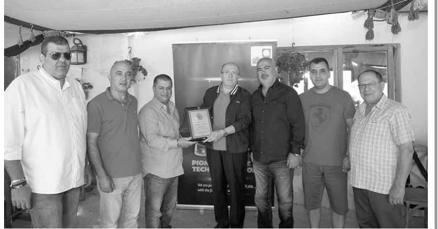
صورة تظهر ابي رميا والنخل ونصور والقاصوف وفراج وجبور