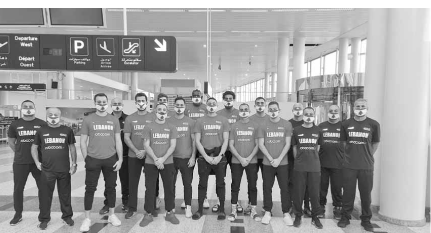
بعثة منتخب لبنان في مطار رفيق الحريري الدولي قبل المغادرة الى البحرين

غادرت بعثة منتخب لبنان للرجال بكرة السلة الى العاصمة البحرينية المنامة قبل ظهر أمس الإثنين لخوض مباراتين ضمن «النافذة الثانية»، من تصفيات كأس آسيا التي ستقام نهائياته العام المقبل. وستواجه المنتخب اللبناني مع نظيره الهندي الجمعة المقبل الواقع فيه ٢٧ تشرين الثاني الجاري ومع نظيره العراقي الأحد المقبل الواقع فيه ٢٩ من الشهر عينه.