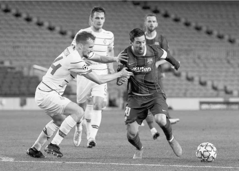
من مواجهة الذهاب بين برشلونة ودينامو كييف والتي انتهت بفوز برشلونة (٢-١)

ولدينا فحوصات الاتحاد الأوروبي الخاصة بدوري الأبطال، يمكنه التدريب معنا، هذا كل ما في الأمر». وكان صلاح قد أصيب بفيروس كورونا المستجد، لدى تواجه في بلاده للمشاركة مع المنتخب المصري في تصفيات أمم أفريقيا، وتعرض لانتقادات شديدة بعدما حضر حفل زفاف شقيقه بوجود عدد كبير من المدعوين.