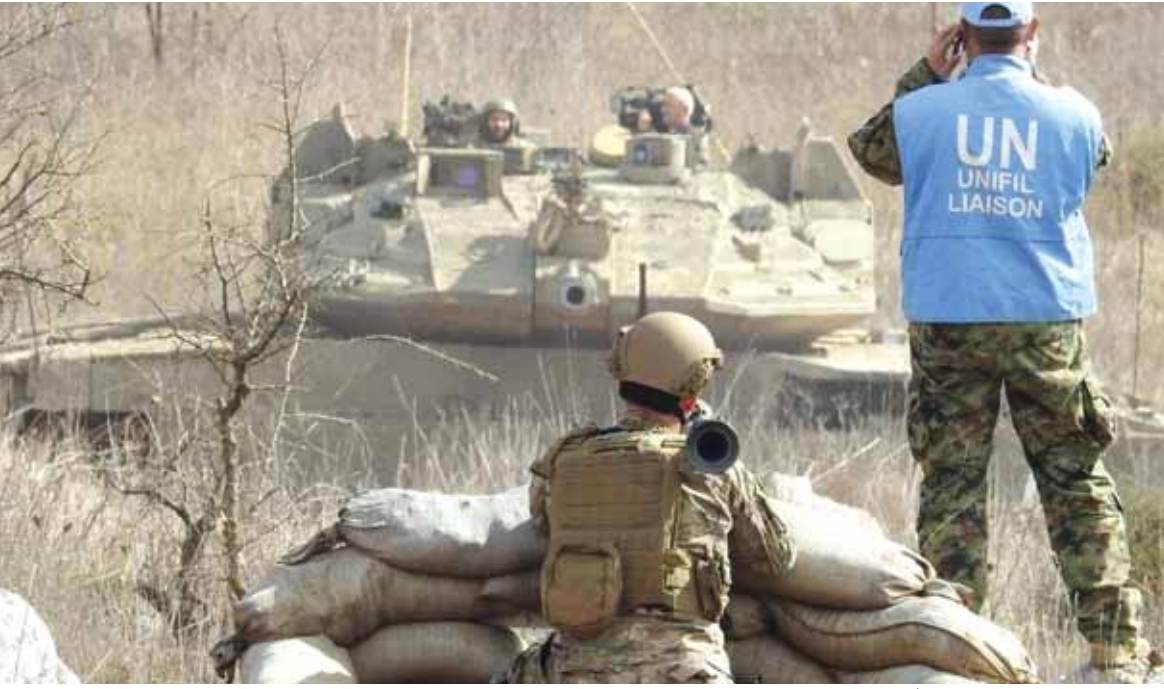
الجندي اللبناني يوجه قاذف «آر بي جي» تجاه دبابة اسرائيلية

بالمفاوضات مع رئيس الجمهورية لتشكيل الحكومة او «الاعتذار»، الى ما بعد انتهاء الفوضى الاميركية السائدة اليوم في المرحلة الانتقالية حتى يتبين «الخيوط الابيض» من «الاسود» في العشرين من كانون الثاني المقبل، خصوصا ان «الضرب» تحت «الزئار» قد بدأ يتبلور اكثر فاكتر في الاقليم، فتزامنا مع استعراض القوة الاميركية بطائرات بـ٥٢» العملاقة، والتلويح بضربة اسرائيلية لمفاعلات نووية في ايران، تجبر طهران على الرد لتدخل بعدها اميركا في المواجهة، صعّدت اسرائيل من حدة المواجهة في سوريا بسلسلة من الغارات العنيفة اعقبت زيارة قائد الحرس الثوري الجنرال اسماعيل قاتني، فيما جاء رد طهران التحذيري على اي حسابات خاطئة تجاه اراضيها من الجبهة اليمنية، حيث استهدف الحوثيون بصاروخ «قدس ٢» مجمع لشركة آرامكو النفطية في مدينة جدة.