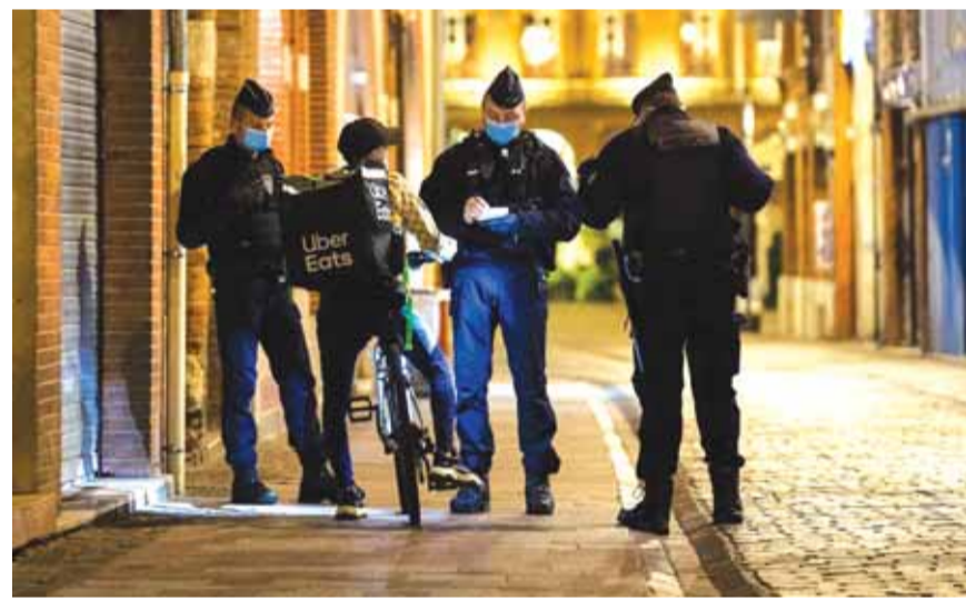
قوى الامن الفرنسية على اهبة الاستعداد

صرح المتحدث باسم الحكومة الفرنسية غابريال أتال أمس الأربعاء إن فرنسا «لن تراجع أبداً عن مبادئها وقيمها»، على الرغم من «محاولات زعزعة الاستقرار»، منوها بالموقف الأوروبي الموحد في مواجهة انتقادات تركيا ودول مسلمة حول الرسوم الكاريكاتورية للنبي محمد.