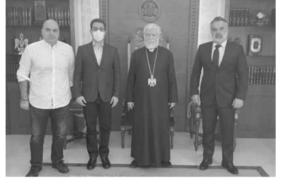
وفد «لبنان القومي» يزور آرام الاول

زار وفد من نواب كتلت لبنان القومي في بيروت المولج متابعة كارثة مرفأ بيروت، كاتوليوكوس الأرمن لبيت كيليكيا آرام الأول كيشيشيان واطلعه على الجهود لمواكبة واغاثة المتضررين بسبب الانفجار والورشة التشريعية والقوانين التي اقرت. وأعلن بيان أن «الوفد ابدى تضامنه مع الشعب الأرمني بعد الاعترافات على اقليم ناغورنو قره باخ».