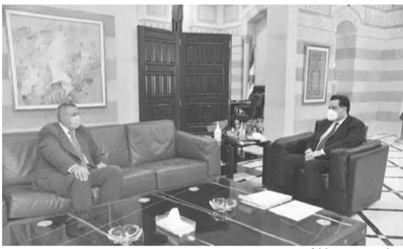
دياب مستقبلاً كويش

غرد رئيس حكومة تصريف الاعمال حسان دياب عبر حسابه على «تويتر»: «ان الحرية تصعب فوضى عندما تتجاوز حدودها وتسيء إلى حريات الآخرين، فكيف إذا تحولت هذه «الحرية» إلى اعتداء بطال المعتقدات والمقدسات الدينية؟»، مضيفاً «إن الإمعان بالإساءة للنبي محمد، هو اعتداء على المسلمين في العالم، لكن الرد عليه يكون بالتمسك بقيم الرسول وليس بالعنف».