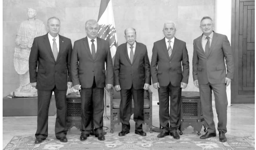
عون مجتمعا مع الوفد الروسي (الداخلي ونهرا)

■ في عين التينة ■ والتقى الوفد الروسي ورئيس مجلس النواب نبيه بري في عين التينة، وعرض الوفد الروسي خلال لقائه رئيس المجلس للمؤتمر المنوي عقده في العاصمة السورية الشهر القادم المتعلقة بعودة النازحين السوريين إلى ديارهم، وقصد اديب بري تشجيعه وتجاوبه مع كل ما يخدم المصلحة الوطنية اللبنانية، مؤكداً انه «ما زال على موقفه المعلن في هذا الاطار منذ عام في القصر الجمهوري». وكان اللقاء مناسبة وجه فيها بري الشكر لروسيا على «الدعم والمؤازرة اللذين قدمتهما للبنان في اعقاب انفجار المرفأ».