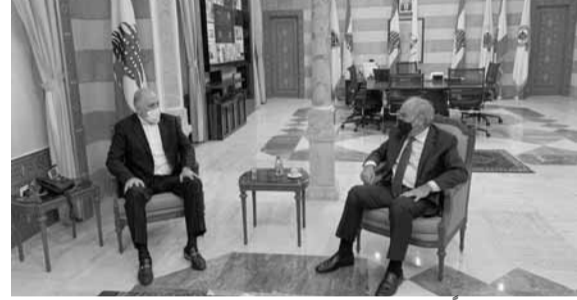
فهمي مستقبلاً رحمة

استقبل وزير الداخلية والبلديات في حكومة تصريف الاعمال العميد محمد فهمي في مكتبه في الوزارة، رئيس حزب التضامن النائب السابق اميل رحمة. وتم البحث في الأوضاع العامة على الساحة الداخلية، لا سيما موضوع تشكيل الحكومة.