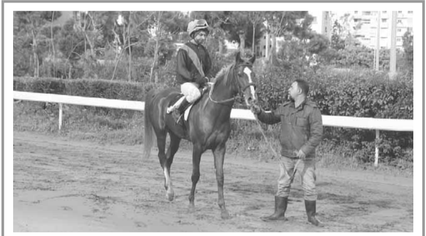
الأصهل: بحالة جيدة، وتماينه كانت رائعة ولن يخرج خياله عدنان من حفلة اليوم من أقل من انتصارين، اذا لم يفاجئنا بالانتصار الثالث

* اقدر: تاج المجد - سيف النار - نجم الخيل * اخبار الخيل: تاج المجد - نجم الخيل - بستان - الحبيب