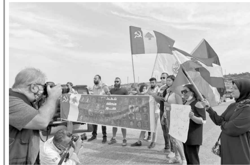
اعتصام على طريق البيضاة الناقورة

نظم الجيش جولة ميدانية للصحافيين في الناقورة لا سيما عند المنطقة والمقر الدولي التي جرت فيها المفاوضات غير المباشرة على بعد كيلومتر، من المقر، حيث تشاهد العلامات البحرية التي وضعها العدو في البحر عند رأس الناقورة قبالة نقطة الـ B1. بالتزامن، نظم الحزب الشيوعي اللبناني اعتصاماً على طريق البيضاة الناقورة – عند الشاطئ، احتجاجاً ورفضاً لمفاوضات ترسيم الحدود البحرية. وقد رفع المشاركون لافتات تندد بإجراء هذه المفاوضات، وأخرى كتب عليها «لا لترسيم الحدود».