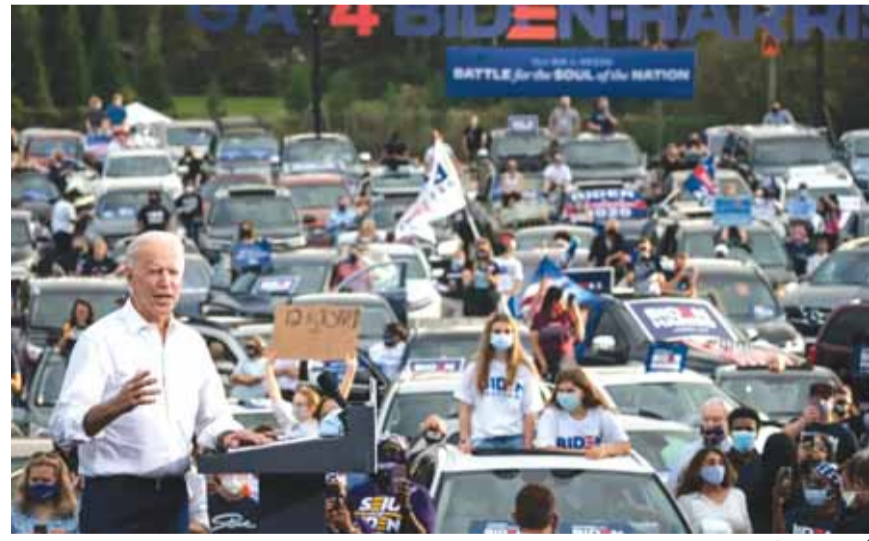
بايدن بين مؤيديه

كثف مرشحو الانتخابات الرئاسية الأميركية من تصريحاتهم وتجمعاتهم الانتخابية في الولايات الحاسمة انتخابياً، وسط تبادل الاتهامات بين المرشح الجمهوري الرئيس دونالد ترامب، ومنافسه الديمقراطي جو بايدن واحترام المنافسة بينهما. وقال الرئيس ترامب في ولاية ويسكونسن إنه إذا وصل الديمقراطيون مجدداً إلى البيت الأبيض فسيدمرون كل شيء خلال