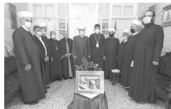
المشاركون في الاجتماع

وأكد أبو الحسن أنّ «الحزب التقدمي الاشتراكي» لا يضع عدداً او عراقيل ولا يدخل في مبدأ المحاصصة، انما يحسن تنفيذ شريحة وطنية عريضة لها تاريخها ويجب ان تتمثل وفق الدستور، مضافاً: «الحزب لا يرفض اسماء ولا يضع شروطاً تعجيزية، انما سيساعد في طرح مروحة من اسماء الشخصيات المعروفة بكفاءتها وليست بالضرورة ان تكون حزبية مما يسهل مهمة الرئيس المكلف».