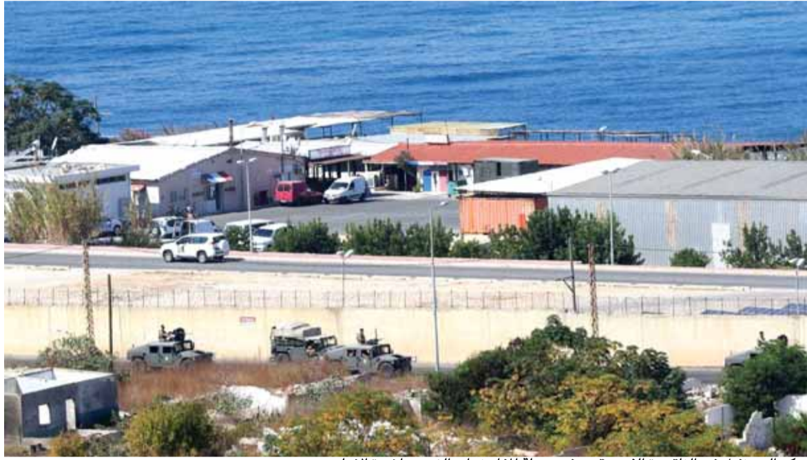
مركز اليونيفيل في الناقورة الذي عقدت فيه جولة المفاوضات الغير مباشرة الاولى

السياسي لرئيس وزراء العدو بنيامين نتانياهو وتحت رعاية الأمم المتحدة بوجود مندوبها في لبنان يان كوبيتش وحضور الوسيط الأميركي وكيل وزير الخارجية الأميركية للشرق الأوسط ديفيد شنكر ومعه السفير الأميركي في الجزائر جون ديروشر. وكانت مدة الاجتماع لفترة قصيرة وهي مخصصة لترسيم الحدود البحرية الجنوبية وتم عرض المواقف من الأطراف المشاركين في الاجتماع على أن يتم الاجتماع الثاني في الناقورة يوم الاثنين ٢٦ تشرين الأول الجاري. وحاول الوفد الإسرائيلي التوّد كثيراً باتجاه الوفد اللبناني لكن الوفد اللبناني بقي ملتزماً بالحديث مع ممثل الأمم المتحدة. أما شينكر فكان قليل الكلام لكنه قال أن الاتفاق عندما يحصل سيجعل السلام في شمال «إسرائيل» وجنوب لبنان لشعبي البلدين. وإثر انتهاء الاجتماع طلب الوفد الإسرائيلي أخذ صورة تذكارية مع الوفد اللبناني بوجود مندوب الأمم المتحدة والوسيط الأميركي الذي شجع على أخذ الصور التذكارية. إلا أن الوفد اللبناني رفض ذلك وطلب من المصورين عدم أخذ أي صورة أثناء خروج الوفد اللبناني والإسرائيلي من الخيمة حيث كان مركز الاجتماع والمفاوضات.