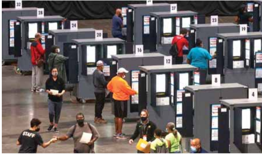
الاميركيين يدلون بأصواتهم

انطلقت في ولاية تكساس الأميركية أمس الأربعاء عملية التصويت المبكر في الانتخابات الرئاسية المقررة في الثالث من تشرين الثاني المقبل. وأظهرت استطلاعات الرأي الأخيرة لشبكة «سي بي إس» (CBS) أن الرئيس دونالد ترامب وخصمه الديمقراطي جو بايدن حصلوا بالتساوي على تأييد ٤٩٪ من الناخبين في هذه الولاية التي لم يفز بها أي مرشح من الحزب الديمقراطي منذ عام ١٩٧٦.