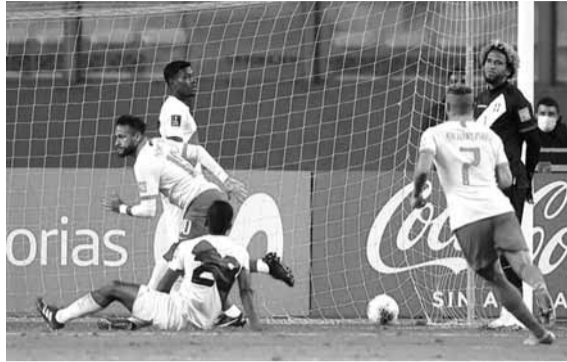
هدف برازيلي في مرمرى البيرو

وحصد المنتخب الإكوادوري، الذي خسر أمام نظيره الأرجنتيني (١-٠) يوم الخميس الماضي في الجولة الأولى من التصفيات، أول ٣ نقاط له في هذه التصفيات. كما تجدد رصيد منتخب الأوروغواي عند النقاط الثلاث التي حصدها من الفوز (٢-١) على تشيلي في الجولة الأولى. وحسم منتخب الإكوادور الشوط الأول لصالحه بهدفين نظيفين سجلهما مويسيس كابسيدو وميكايل استرادا في الدقيقتين ١٥ والرابعة من الوقت بدل الضائع لهذا الشوط. وفي الشوط الثاني، أضاف استرادا وغونزالو بلاتا هدفين آخرين للإكوادور في الدقيقتين ٥٢ و٧٥، قبل أن يسجل لويس سواريز هدفي حفظ ماء الوجه لمنتخب الأوروغواي من ضربتي جزاء في الدقيقتين ٨٤ والخامسة من الوقت بدل الضائع للمباراة.