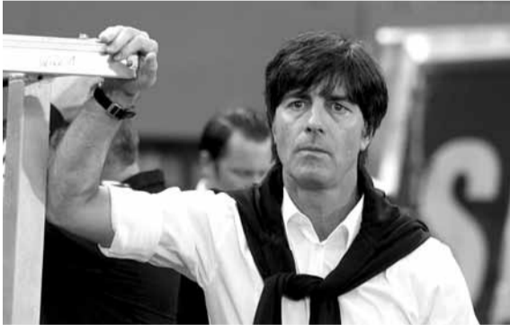
مدرب ألمانيا يواكيم لوف

بلاده أمام سويسرا، في ليلة تاريخية لنجم ريال مدريد مع المانشافت. وبحسب شبكة «أوبتا» للإحصائيات، فقد خاض كروس مباراته رقم ١٠٠ مع منتخب المايكنات الألمانية. وأوضحت، أن كروس هو اللاعب رقم ١٢ في تاريخ الكرة الألمانية الذي يصل إلى ١٠٠ مباراة مع منتخب المايكنات الألمانية. ٤ سنوات تكفي غنابري للتفوق على لاعبي ألمانيا