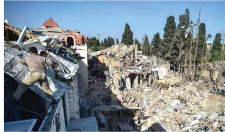
اضرار جسيمة جراء القصف الأذربيجاني

دعا الرئيس التركي رجب طيب أردوغان إلى مجموعة مينسك إلى الإسراع في حل أزمة قره باغ، في حين أعلنت أذربيجان أمس عن قصف مواقع داخل أرمينيا للمرة الأولى منذ اندلاع الحرب. وقال الرئيس التركي رجب طيب أردوغان، إن بلاده لم ترسل مقاتلين سوريين إلى أذربيجان مثلما أفادت بعض التقارير؛ لكنها تؤيد حليفها باكو بتأييد كامل.