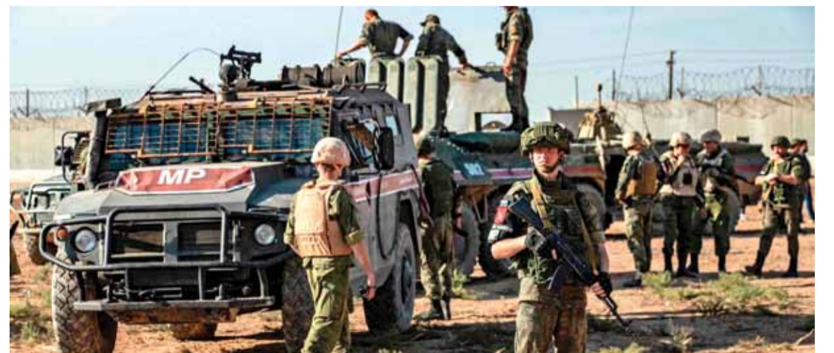
جنود روس محيط ادلب

وجاء هذا الهجوم عقب ما وصفه الناطق العسكري الإسرائيلي في بيانه بخرق الجيش السوري لاتفاق فض الاشتباك، الذي يحظر عليه التوضع العسكري في هذه المنطقة.