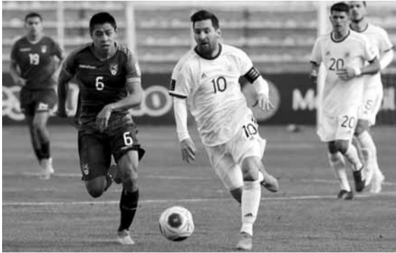
ميسي يمر عن أحد لاعبي بوليفيا