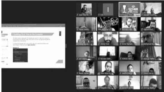
لقطة من «ورشة العمل» في اليوم الثاني