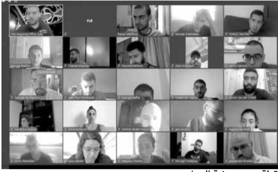
لقطة من «ورشة العمل»