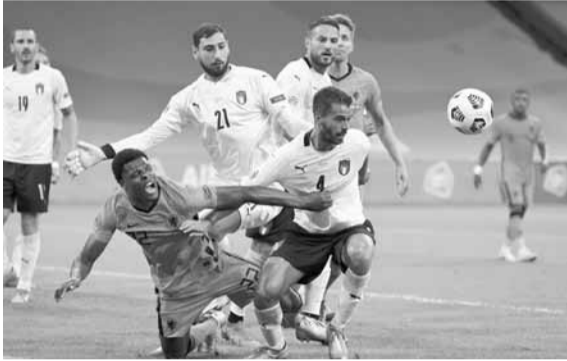
المواجهة تتجدد بين إيطاليا وهولندا

يتوجه منتخب المدرب الفرنسي ديبديه ديشان إلى كرواتيا، لتعويض تعادله السلبي أمام البرتغال، وذلك عندما يتواجه المنتخبان الكرواتي والفرنسي مجدداً اليوم الأربعاء في الجولة الرابعة من مباريات المجموعة الثالثة ضمن بطولة دوري الأمم الأوروبية لكرة القدم.