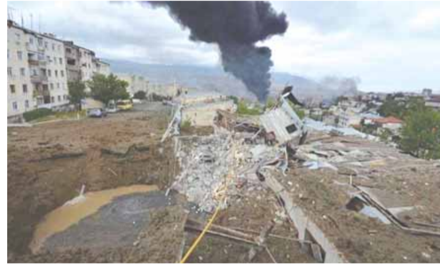
الدمار الهائل في «ناغورنو كاراباخ»

أكد رئيس وزراء أرمينيا، نيكول باشينيان، أن «الأعمال القتالية في إقليم كاراباخ ما كانت لتبدأ دون استعداد تركيا للمشاركة فيها». وجاء في بيان الخدمة الصحفية لمجلس الوزراء عن باشينيان قوله في لقاء مع دبلوماسيين أجانب معتمدين لدى البلاد، «أود أن ألفت انتباهنا جميعاً إلى حقيقة أن الأعمال العدائية بدأت كاستمرار للتدابير التركية الأذربيجانية المشتركة»، بحسب تعبيره. ووفقاً له، فإن تركيا تشارك في نزاع كاراباخ و«تعرض على الحرب علانية، وهذا لا يثبت فقط من خلال التصريحات التي قدمناها لشركائنا، إنما أيضاً من خلال التصريحات العلنية». وفي السياق، أكمل «حتى يومنا هذا تستمر تركيا في المشاركة بالأعمال العدائية، حيث قامت بتجنيد المرتزقة وأعضاء الجماعات الإرهابية في سوريا وتم نقلهم باستخدام النقل الجوي الخاص بها، إلى منطقة الصراع». ووفقاً لباشينيان فإن مثل هذه التصرفات التركية تعكس