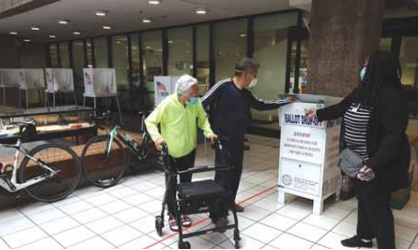
التحضيرات للانتخابات الاميركية

أدلى أكثر من ١٠ ملايين ناخب أميركي منذ الإثنين بأصواتهم، مع بدء التصويت الشخصي المبكر في الانتخابات الرئاسية، مما يشير إلى إقبال كبير على التصويت مقارنة بالانتخابات السابقة. وقال «مشروع الانتخابات الأميركية» التابع لجامعة فلوريدا إن الناخبين ادلوا بنحو من ١٠ ملايين و ٣٠٠ ألف بطاقة اقتراع في الولايات المعنية، موضحاً ان هذا العدد يزيد بأضعاف عما كان عليه عددهم في مثل هذه المرحلة قبل ٤ سنوات. واعتبر المراقبون أن هذه الزيادة مدفوعة بالارتفاع الكبير في أعداد الناخبين الذين اختاروا التصويت عبر البريد، بسبب مخاوفهم من الإداء بأصواتهم شخصياً في غمرة أزمة فيروس كورونا. وفي ولاية جورجيا، انتظر الناخبون ساعات طويلة، وواجهت مراكز الاقتراع في مقاطعتين على الأقل مشاكل إلكترونية لفترة وجيزة.