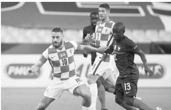
من لقاء الذهاب بين فرنسا وكرواتيا