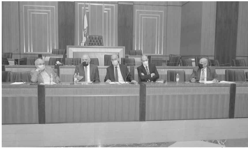
عراجي يترأس اجتماع اللجنة

عقدت لجنة الصحة العامة والعمل والشؤون الاجتماعية جلسة برئاسة النائب الدكتور عاصم عراجي وفي حضور الوزيرين في حكومة تصريف الاعمال الداخلية والبلديات العميد محمد فهمي والصحة العامة حمد حسن وعدد من النواب. بعد الجلسة، قال عراجي: