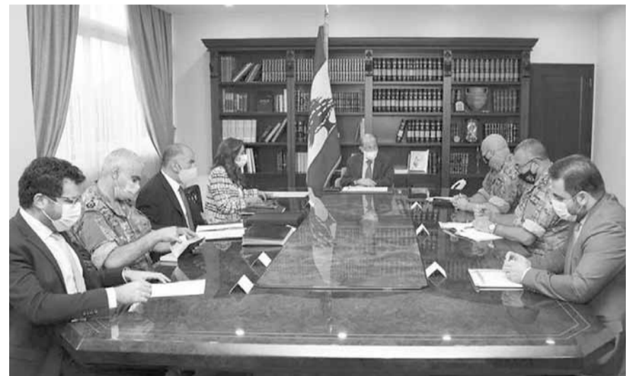
عون مجتمعاً مع أعضاء الوفد المفاوضات بحضور عكر وقائد الجيش

تركت المواقف التي أطلقها رئيس الحزب التقدمي الاشتراكي وليد جنبلاط سلسلة تساؤلات على اعتبار أنه رفع منسوب تصعيده تجاه الرئيس سعد الحريري، وبدا من الصعوبة بمكان عودة الأمور إلى مجاريها كما كانت الحال في مرحلة سابقة من التحالف بين الطرفين. وبالتالي، ينقل عن مصادر سياسية عليمة بان جنبلاط يعيش منذ فترة طويلة مرحلة غير