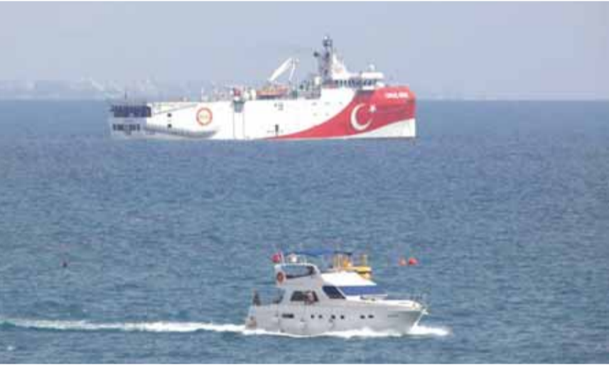
باخرة التنقيب التركية شرقي المتوسط

انضمت ألمانيا إلى أطراف أوروبية أخرى في التنديد بإعلان تركيا استئناف أنشطتها الاستكشافية قرب سواحلها، ليخيم التصعيد مجدداً بعد تهدئة لم تدم طويلاً بين أنقرة وأثينا المنخرطتين في نزاع حول مخزونات موارد الطاقة شرق البحر المتوسط. ففي بيان أصدره أمس الثلاثاء قبيل سفره إلى اليونان وقبرص، طالب وزير الخارجية الألماني هايكو ماس تركيا بالكف عما وصفه بالاستفزاز، وذلك بعد يوم من إعلان أنقرة عودة السفينة «عروج ريس» لأعمالها الاستكشافية للتنقيب عن الغاز. وأعلن ماس تضامن بلاده مع قبرص واليونان كشريكين في الاتحاد الأوروبي، قائلاً ان تركيا ان تظل منفتحة على المحادثات، والاستئناف للتنقيب عن الغاز في المناطق البحرية محل النزاع. وكانت الحكومة الألمانية حذرت مما اعتبرته استفزازاً من جانب أنقرة، ووصفت الخطوة التركية بالامرؤسف للغاية. ودعا المتحدث باسم الحكومة شتيفن زايبيرت جميع أطراف