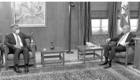
بري مستقبلاً اللواء ابراهيم