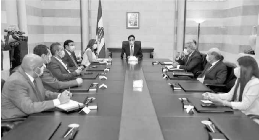
دياب يترأس الاجتماع

ترأس رئيس حكومة تصريف الأعمال حسان دياب في السراي الحكومي، اجتماع اللجنة الوزارية لتتباينة ملف وباء كورونا. وجرى عرض للتدابير والإجراءات اللازمة، التي من شأنها أن تحد من ارتفاع أعداد الإصابات. وقررت اللجنة «اعتماد معيار عدد الإصابات في المناطق اللبنانية نسبة لعدد السكان للتعامل مع انتشار وباء كورونا، بحيث يُصار إلى إجراء التصنيف البوائي وفقاً لمعايير محددة في الجدول المرفق أدناه،