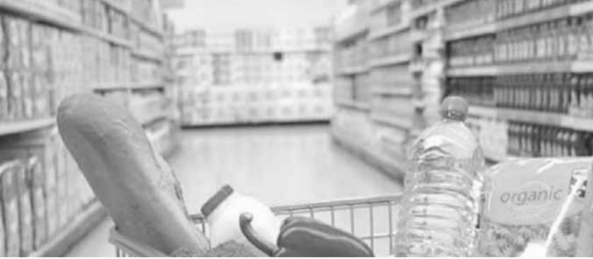
الدعم باق للمواد الغذائية

تجار الجملة». ولفت إلى أن «موضوع العرض والطلب يتأثر بحالة الاستقرار في البلد ولا يوجد لغاية الآن أي شيء في موضوع البطاقة التموينية».