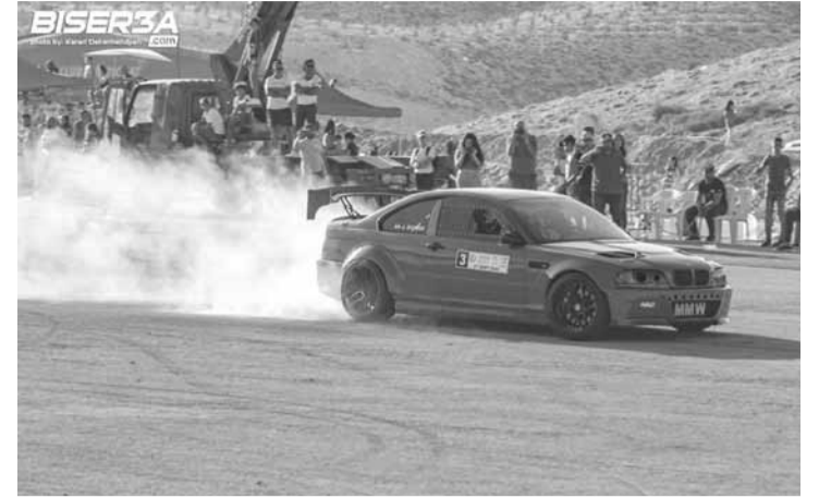
بطل فئة المحترفين جلال دعيبس