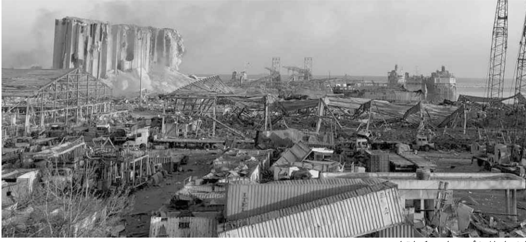
انفجار المرفأ بعده ليس كما قبله