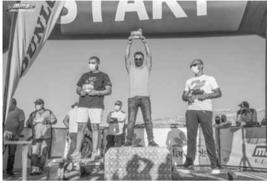
ابطال فئة الهواة للسيارات المعدلة