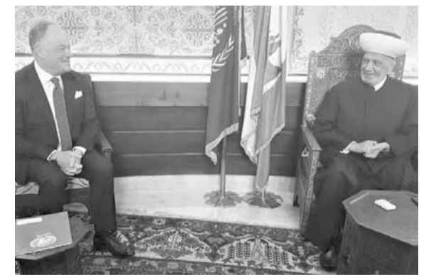
دل كول عند دريان

زار القائد العام لقوات الطوارئ الدولية العاملة في لبنان اللواء ستيفانو دل كول رئيس مجلس النواب نبيه بري في مقر الرئاسة الثانية في عين التينة وعرض معه التطورات جنوباً .