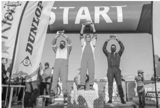
تتويج ابطال فئة المحترفين