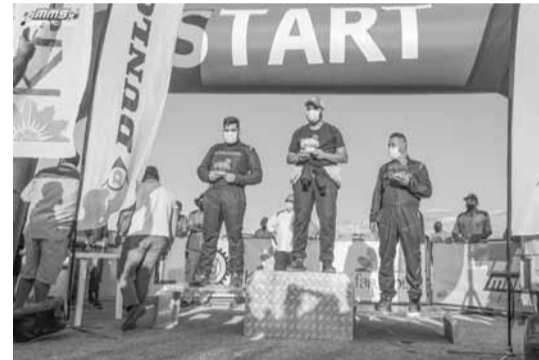
ابطال الـ (Hybrid)