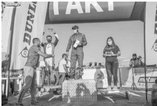
...ابطال الهواة على منصة التتويج