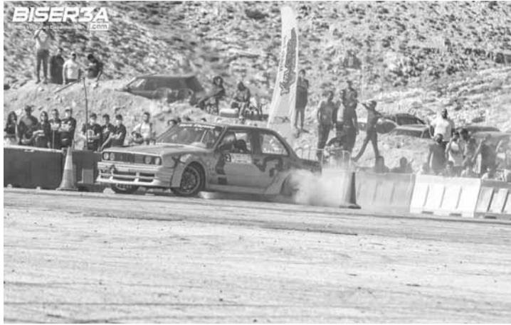
وصيف بطل المحترفين ماريو قليعاني