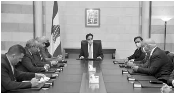
دياب مجتمعاً مع رابطة اساتذة التعليم المهني

كلف رئيس حكومة تصريف الاعمال الدكتور حسان دياب، وزير الخارجية شربل وهبه إجراء الاتصالات اللازمة مع السلطات القبرصية لمتابعة قضية اللبنانيين المفقودين في البحر من مدينة طرابلس. كما كلف دياب وزير الداخلية محمد فهمي متابعة القضية مع الاجهزة الأمنية.