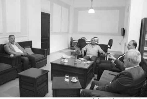
ضاهر في احد الاجتماعات

مختلف التحديات التي تعترض تطوير قطاع المياه وسبل التخفيف من معاناة المواطنين.