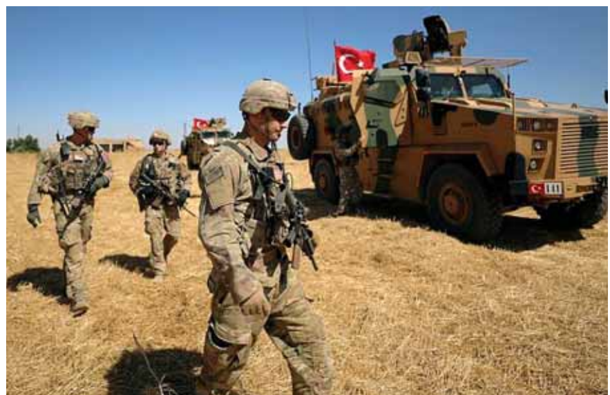
الجيش التركي في شمال سوريا

أكد وزير الخارجية الروسي سيرغي لافروف عن رؤية موسكو للعقوبات الأميركية المفروضة على دمشق. واعتبر لافروف ان «قانون قيصر يتضمن فرض عقوبات يرغبون في رؤيتها كإداة خنق للقيادة السورية»، مؤكداً ان «هذه العقوبات أصابت، في المقام الاول، المواطنين السوريين». وعن الجلسة التي اجريت في مجلس الأمن لمناقشة الوضع الإنساني في سوريا، قال لافروف «دافع زملاؤنا