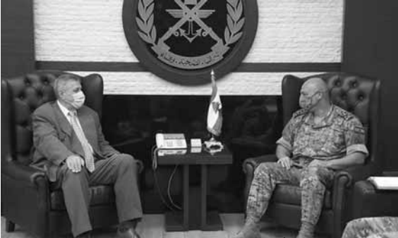
قائد الجيش مجتمعاً مع كوبييتش

زارالمنسق العام للامم المتحدة في لبنان يان كوبييتش قائد الجيش العماد جوزاف عون في مكتبه في اليرزة، وتناول البحث الاوضاع العامة في لبنان والمنطقة كما زار كوبييتش رئيس لجنة المال والموازنة النائب ابراهيم كنعان في دارته في البياضنة، وجرى البحث في موضوع الاصلاحات المطروحة بالورقة الفرنسية والملف الحكومي في ضوء الاهتمام الدولي بلبنان، والحاجة إلى حكومة انقاذ في شكل عاجل لتعالج المشكلات المالية والاقتصادية والاجتماعية، وتسهم في استعادة التقّين المحلية والدولية بلبنان.