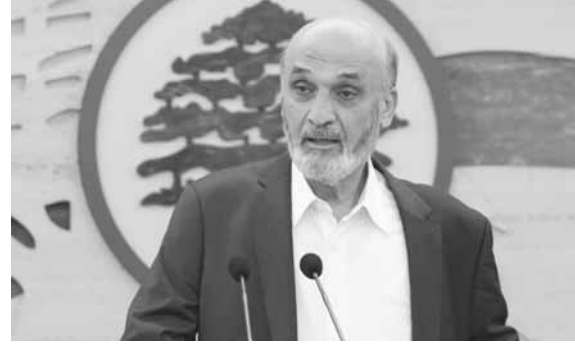
جعجع يتحدث خلال في مؤتمره الصحافي

قال رئيس حزب «القوات اللبنانية»، سمير جعجع: «إذا ما بقيت وزارة المال مع الفئائي الشيعي فإن ذلك سيُعطل تطبيق الإصلاحات لأنه إذا ما أراد حزب الله وحركة «أمل» التسمية سيطلب غيرهما بذلك أيضاً، وفي هذه الحال إذا ما سمي كل فريق وزراه له في الحكومة فستعود إلى نفس الدوامّة التي رأينا إلى أين وصلت البلاد»، مضيقاً «لو