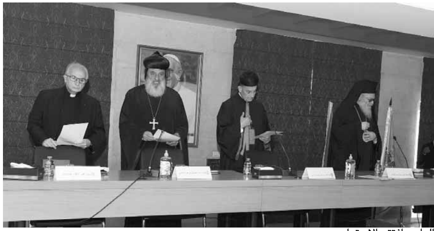
الراعي افتتح الاجتماع

تعلن المبادئ الأخلاقية، والثوابت الوطنية، وتعزز الحوار مع الثقافات والأديان». وتابع «الرياح الشديدة والأمواج ترمز أيضا إلى ما يواجهه الإنسان في ذاته من أنانية وأهواء ومصالح شخصية وحسابات ومشاريع وعادات وأولويات، تحجب عنه الخير العام، خير كنيسة المسيح الواحدة، وخير المؤمنين. لا يلبث كل واحد يدرك خطر هذه الرياح والأمواج الشخصية، وليجأ إلى المسيح الفادي ملتسما تهنيتها، وتصويب مسار حياته». وختّم الراعي «نسالك يا رب، بشفاعة أمنا مريم العذراء، نجمة البحر في العاصفة، أن تقود أوطاننا وكنائسنا وشعبنا إلى ميناء الأمان».