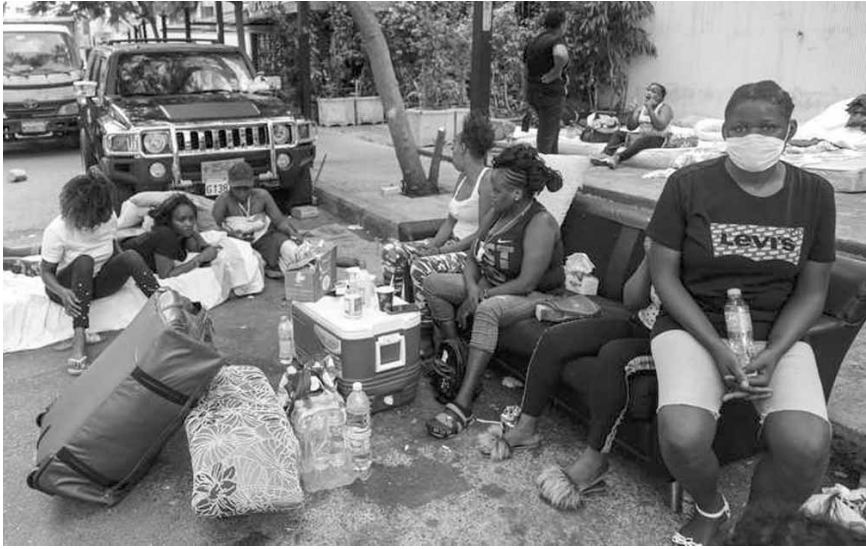
عاملات كينيات تجتمعن أمام سفارتهم في بيروت للمطالبة بالعودة الى بلادهن

مع النقابة وأرسلت مسودة العقد قبل إصداره. وذلك بعدما قدمنا كتاب يتضمن كل الملاحظات لدينا، فأخذ ببعضها ولم يأخذ بالبعض الآخر».