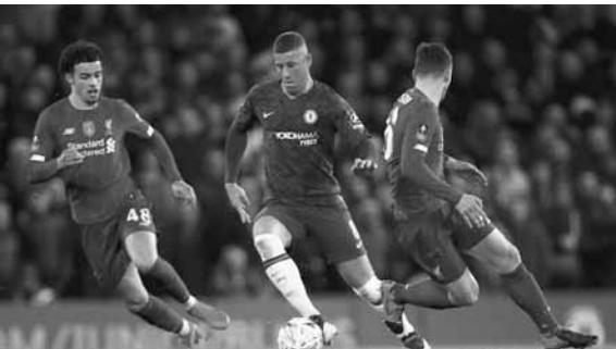
من إحدى مباريات تشلسي وليفربول

بعد ارتباطه بالرحيل لمجموعة من الأندية الكبرى. وألح أوباميانغ الى إنه اتخذ هذا القرار لأنه يرى مستقبلًا كبيراً للنادي. وقال أوباميانغ لمهاجم أرسنال السابق إيان رايت، في مقابلة جرت بموقع النادي «انظر الى اللاعبين الذين جاءوا هذا الصيف». وأضاف «اللاعبون الشباب أيضا باتون كالنار وهذا هو سبب بقائي. لأنني أعلم ان لدينا شيئاً نقوم به. لقد قلت قبل بضعة أشهر ان الأفضل سيأتي بالتاكيد بالنسبة لأرسنال. حان الوقت على الجميع احترام نادينا». ويخسر مانشستر سيتي لملاقاة وولفرهامبتون بعد غد الإثنين، في حين يستضيف مانشستر يونايتد، كريستال بالاس، وسيحاول توتنهام هو تسبير التعافي من خسارته الافتتاحية أمام إيفرتون، بالفوز على مضيغه ساوثمبتون. ويلتقي ليستر مع ضيفه بيرنلي، في حين يلعب ليدز مع ضيفه فولهام، في مواجهة بين فريقين صاعدين من دوري الدرجة الأولى، ويواجه إيفرتون ضيفه وست بروميتش البيون، ويلتقي نيوكاسل مع ضيفه برايتون، وأستون فيلا مع شيفيلد.