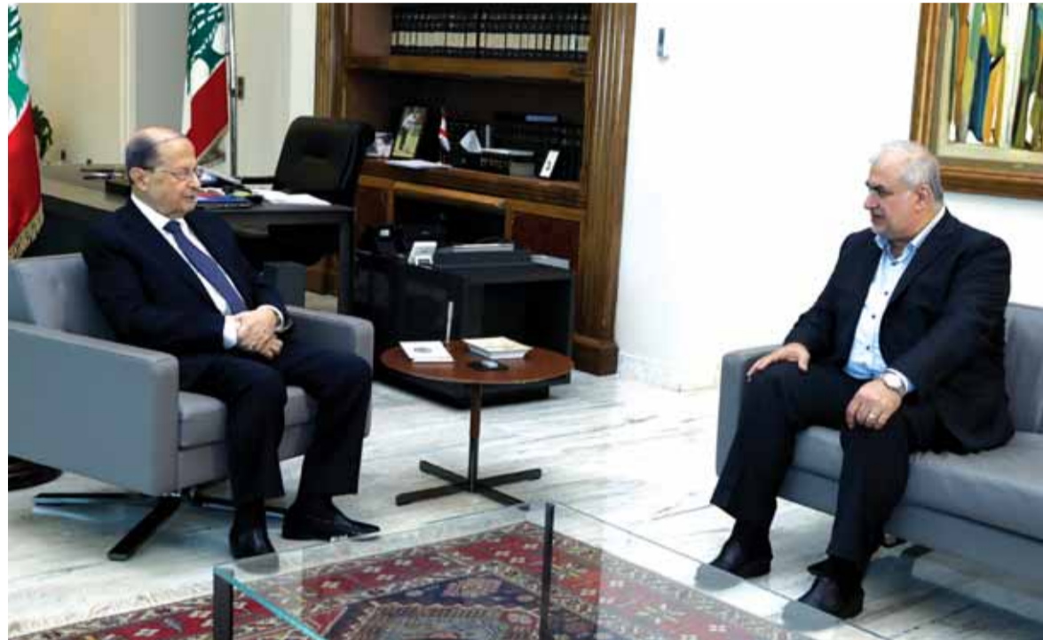
الرئيس عون مجتمعاً مع النائب زعد

للمبادرة الفرنسية وعدم إفشالها، لا سيما بعد تصب «الثنائي الشيعي» وتمسكه بمواقفه.