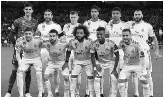
فريق ريال مدريد

أكد تقرير صحفي إسباني، أمس الثلاثاء، أن لاعبي ريال مدريد قد يتعرضون لازمة جديدة بسبب فيروس كورونا المستجد.