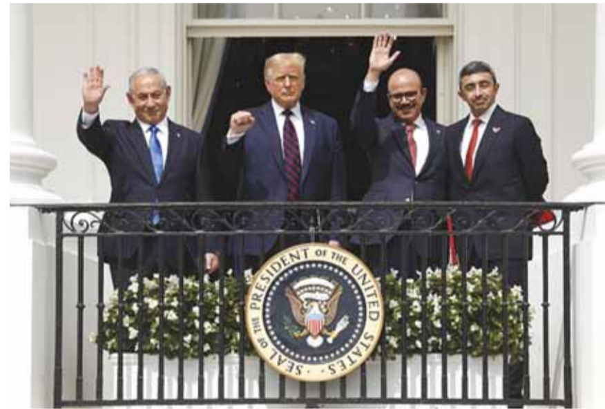
اتفاق التطبيع الإماراتي والبحريني مع «إسرائيل»

وصف وزير الخارجية الأميركي مايك بومبيو الاتفاقيات، التي ستوقع في البيت الأبيض بين الإمارات والبحرين من جهة و«إسرائيل» من جهة ثانية، بالإنجاز الرائع، فيما يصفها الفلسطينيون بالبطعنة في الظهر، أما تل أبيب فتقول إنها ستند على اقتصادها مليارات الدولارات.