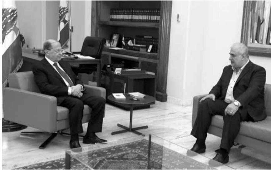
عون مجتمعاً مع رعد

وفي اليوم العالمي للديموقراطية، غرّد الرئيس عون: «فلنتذكر جميعاً ان حلول المشاكل لا تكون الإبتفاهم وليس بالعناد والتصلب، وما خلا ذلك الفشل الذريع والخسارة للجميع».