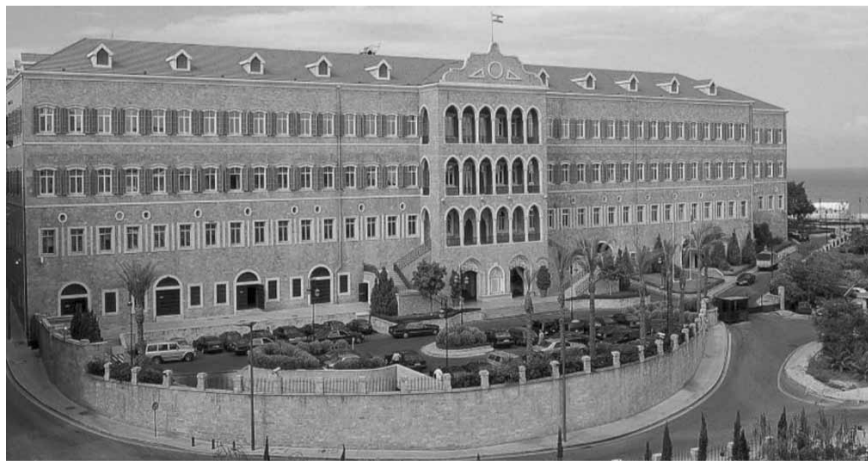
والاتي ونهرا) وفي اليوم العالمي للديموقراطية، غرّد

وتلفت اوساط ان الساعات المقبلة والفاصلة بين عصر امس وصباح الخميس ستكون للتشاور وجولة حصيلة المواقف التي أدلت بها الكتل ووضعتها في عهدة الرئيس عون والذي سيناقشها مع الرئيس المكلف ومع الفرنسيين. وتشير الى ان الاتصالات التي اجراها الجانب الفرنسي مع