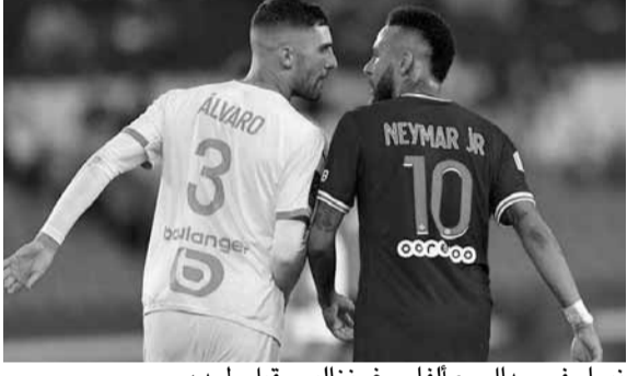
نيمار في جدال مع الفارو غونزاليس قبل طرده

أصدر البرازيلي نيمار نجم باريس سان جيرمان الفرنسي، بياناً رسمياً، للرد على واقعة العنصرية التي تعرض لها خلال مواجهة الكلاسيكو ضد مارسيليا. ونال نيمار بطاقة حمراء في مباراة الكلاسيكو، مؤكداً أنه اعتدى على ألفارو غونزاليس مدافع مارسيليا، لأن الأخير وجه له إساءات عنصرية.