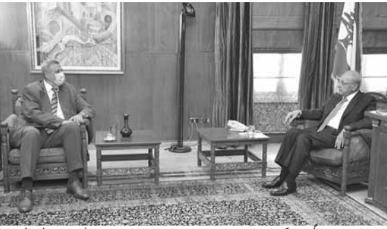
بري مجتمعاً مع كوبيتش (حسن ابراهيم)

استقبل رئيس مجلس النواب الاستاذ نبيه بري، في بعين التينة، بعد ظهر أمس، نائب رئيس مجلس النواب بايلي الفرزلي، في حضور النائب بعلي حسن خليل، حيث تم عرض للاوضاع العامة وشؤون مجلسي البعثة واللقاء قال الفرزلي حول الشأن الحكومي