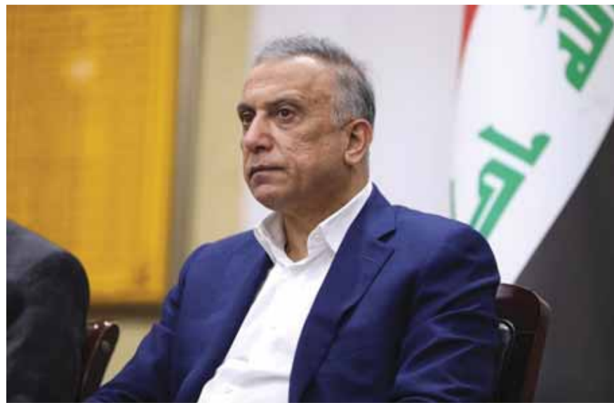
رئيس الحكومة العراقي مصطفى الكاظمي

في السياق، أعلن رئيس «تحالف الفتح» هادي العامري تبرؤ التحالف من هذه التغييرات، مشدداً على مطلب انسحاب القوات الأميركية وخلق مناخات مناسبة لانتخابات نزيهة.