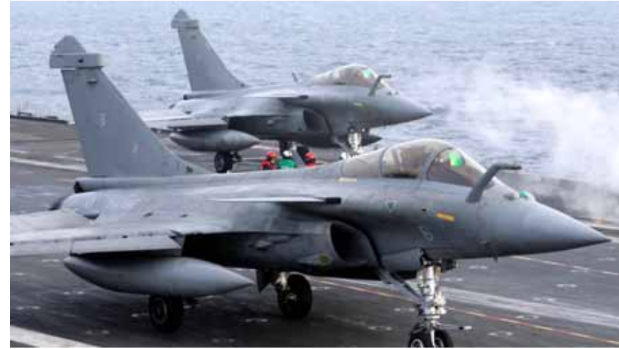
طائرات «أفال» فرنسية

على خلفية تصاعد التوتر بين أثينا وأنقرة، قررت اليونان إبرام صفقات أسلحة ضخمة لتعزيز قواتها العسكرية إضافة إلى إصلاح شامل للجيش.