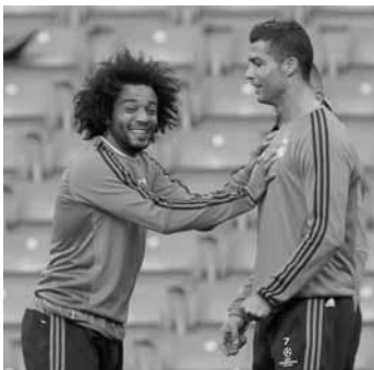
كريستيانو رونالدو ومارسيلو

كشفت تقارير صحفية إسبانية، أمس الأحد، عن تطور جديد بشأن الميركاتو الصيفي في يوفنتوس، وكانت تقارير إسبانية قالت إن البرازيلي مارسيلو، ظهير ريال مدريد، قد يرحل عن النادي الملكي هذا الصيف. ووفقاً لشبكة «ديفنسا سترال» الإسبانية، فإن البرتغالي كريستيانو رونالدو، نجم يوفنتوس، ضغط على مسؤولي السيدة العجوز مؤخرًا، للتعاقد مع مارسيلو. ويتمتع رونالدو بعلاقة رائعة مع مارسيلو منذ مزاملته في «سانتياغو برنابيو»، ويريد اللعب بجواره مرة أخرى. وأشارت الشبكة إلى أن أندريا بيرلو، مدرب يوفنتوس، يضغط أيضا على الإدارة الإيطالية لحسم صفقة مارسيلو. وأوضح أنه من الصعب موافقة بفلورنتينو بيريز، رئيس ريال مدريد، على أي عرض لرحيل مارسيلو، لكن يوفنتوس يحاول بكل الطرق. وذكرت «ديفنسا سترال» أن يوفنتوس سيلعب على حاجة ريال مدريد لحني الأموال، هذا الصيف، ما سيدفعه للاستغناء عن مارسيلو الذي بات بديلاً في مركزه لزميله الفرنسي فيرلاند ميدي.