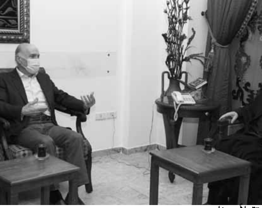
فضل الله مستقبلا مهنا

اللبنانيين على الخارج، فلبنان ليس معزولا عن محيطه القريب والبعيد، ولكن علينا أن نعي أن الخارج ليس جمعيّة خيرية فله مصالحه وحساباته وعلينا أن لا نكون طمية لمصالحه على حساب مصالح الوطن».