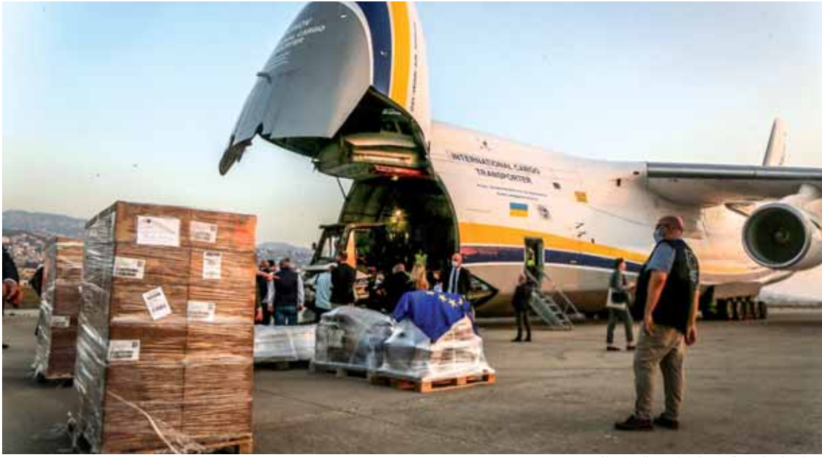
مساعدا المانية وصلت امس الى المطار

جاء فيه أن «المشكلة ليست مع الفرنسيين المشكلة الداخلية ومن الداخل» محملاً البعض مسؤولية الإستقواء بالخارج وعدم إجراء مشاورات مع القوى السياسية بحجة حكومة اختصاص من دون ولا حزبي أو نيابي. وأضاف البيان «لذا بلغنا رئيس الحكومة المكلف من عندنا ومن تلقائنا عدم رغبتنا بالمشاركة على هذه الاسس في الحكومة، وبلغنا استعدادنا للتعاون الى اقصى الحدود في كل ما يلزم لإستقرار لبنان وماليته والقيام بالإصلاحات واناخذ اقتصاده».