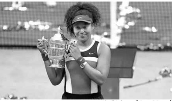
أوساكا مع كأس بطولة فلاشينغ ميدوز

كشفت تقارير صحفية إسبانية، أمس الأحد، عن تطور جديد بشأن الميركاتو الصيفي في يوفنتوس، وكانت تقارير إسبانية قالت إن البرازيلي مارسيلو، ظهير ريال مدريد، قد يرحل عن النادي الملكي هذا الصيف. ووفقاً لشبكة «ديفنسا سترال» الإسبانية، فإن البرتغالي كريستيانو رونالدو، نجم يوفنتوس، ضغط على مسؤولي السيدة العجوز مؤخرًا، للتعاقد مع مارسيلو. ويتمتع رونالدو بعلاقة رائعة مع مارسيلو منذ مزاملته في «سانتياغو برنابيو»، ويريد اللعب بجواره مرة أخرى. وأشارت الشبكة إلى أن أندريا بيرلو، مدرب يوفنتوس، يضغط أيضا على الإدارة الإيطالية لحسم صفقة مارسيلو. وأوضح أنه من الصعب موافقة بفلورنتينو بيريز، رئيس ريال مدريد، على أي عرض لرحيل مارسيلو، لكن يوفنتوس يحاول بكل الطرق. وذكرت «ديفنسا سترال» أن يوفنتوس سيلعب على حاجة ريال مدريد لحني الأموال، هذا الصيف، ما سيدفعه للاستغناء عن مارسيلو الذي بات بديلاً في مركزه لزميله الفرنسي فيرلاند ميدي.