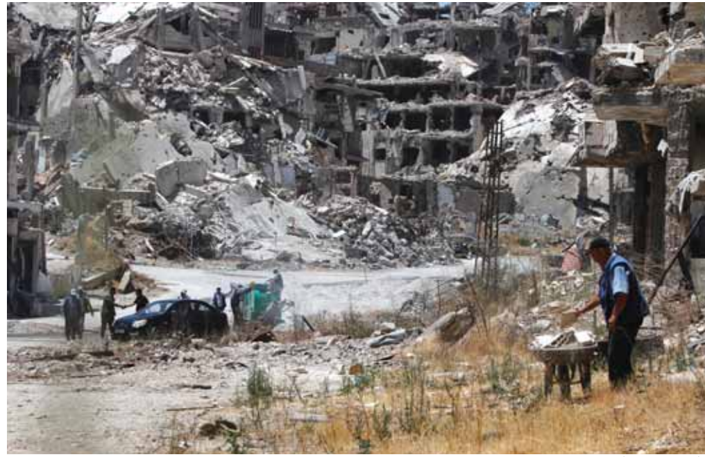
دمار في سوريا

أعربت بكين عن معارضتها الشديدة لتقرير نشرته مؤخرا وزارة الدفاع الأميركية تحت عنوان «تطورات عسكرية وأمنية تتعلق بجمهورية الصين الشعبية لعام ٢٠٢٠».