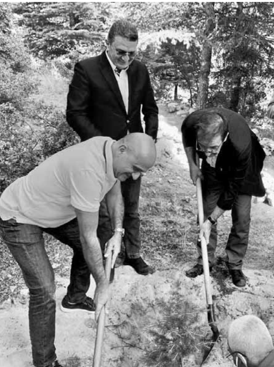
فوشيه وأبي رميا يغرسان أرزة الصداقة

أولم رئيس لجنة الصداقة النيابية اللبنانية - الفرنسية النائب سيمون أبي رميا على شرف السفير الفرنسي برونو فوشيه بمناسبة انتهاء مهامه في لبنان، في حضور النواب ياسين جابر، قاسم هاشم، اغوب بقرادونيان، عنابة عز الدين، الاني عون، سليم عون ورولا الطيش، ممثل رئيس الجمهورية لدى الدول الفرنكوفونية جرجورة حردان، رئيس بلدية إهمج نزيه ابي سمعان ومختاري البلدة مورييس غبريل وشربل زيادة.