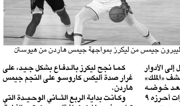
ليبرون جيمس من ليكرز يواجه جيمس هاردن من هيوستن

بلغ لوس أنجلوس ليكرز نهائي المنطقة الغربية في دوري كرة السلة الأميركي للمحترفين للمرة الأولى في عشر سنوات، بعد تفوقه السهل على هيوستن روكتس ١١٩-٩٦ وحسمه السلسلة الصحية بسبب فيروس كورونا المستجد.