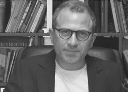
باسيل في مؤتمره الصحافي

ليس لدينا شرط يعني مشاركتنا بالحكومة ليست شرطا لدعمها، لا بل أكثر من هذا، نحن ليست لدينا رغبة في المشاركة بالحكومة، ولا نرغب في أن نشارك فيها. كثيرون يتكلمون معنا لضرورة مشاركتنا وأن لا حكومة تتشكل من دوننا، ونحن نجيبهم أن رئيس الجمهورية بتمثيله وميثاقته يغطي الحكومة ويعوض عنا في هذه الظروف الاستثنائية . وفي الاستشارات بلغنا هذا الموقف الى رئيس الجمهورية والى رئيس الحكومة، وقلته انا في الإعلام في بعيدا وفي عين التينة، وأن لا مطلب ولا شرط لدينا في الحكومة سوى قدرتها على تنفيذ البرنامج الإصلاحي المحدد. لا نشارك ولكننا نساعد الحكومة في إنجاز الإصلاح، ونواكفها ونساعدها من المجلس النيابي نحن نعرف ماذا نريد، ونسهل تأليف الحكومة بكل ما يتطلبه الأمر. ولكن بدافع الحرص على حسن التأليف ونجاح المهمة، وسنبقى على موقفنا المسهل».