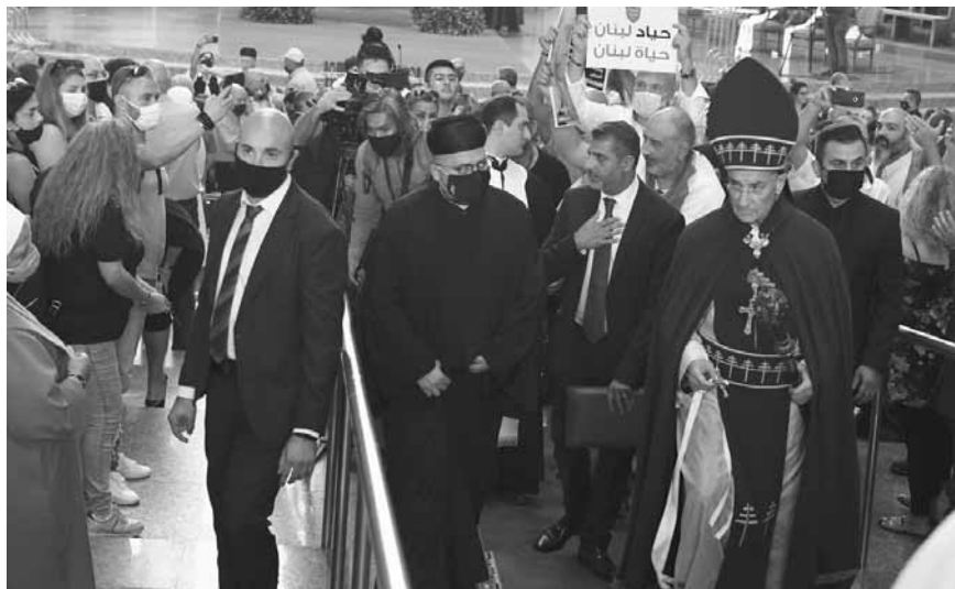
الراعي خلال القداس

الذي كان يحتقر رمال الصحراء ويدوسها بأخفافه العريضة مستقويا عليها بضخامة جنفته ونقله. وكيف ذات يوم عصفت الريح وقالت لحبات الرمل: «تجمعا وتوحدا وتعالوا نسحق الجمل معا، فكلمت عاصفة من الرمال شديدة طمرت ذاك الجمل ولم تترك له أثراً ينظر.