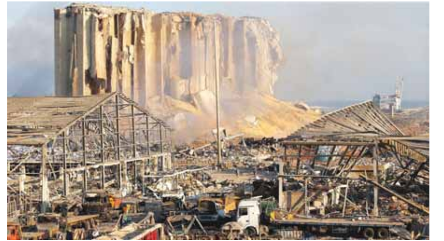
الدمار في مرفأ بيروت

أما الأضرار غير المباشرة مثل الخسائر في القطاع السياحي والضرر في الشركات التي كانت في