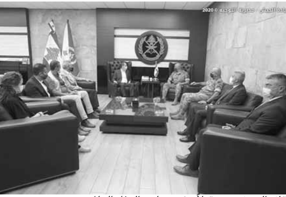
قائد الجيش مستقبلاً وفد برنامج الغذاء العالمي

أطلع قائد الجيش العماد جوزاف عون ومدير المخابرات العميد أنطوان منصور، رئيس الجمهورية العماد ميشال عون بعد زيارتهم قصر بعبدا، على المراحل التي قطعتها عمليات البحث والإنقاذ في مرفأ بيروت، ورفع الانقراض وانتشال الضحايا، وعمل الفرق العربية والدولية التي أتت لمساعدة الجيش في هذه المهمات التي تشمل أيضا تنظيف المرفأ. كما أطلع الرئيس عون منبها على مسار عمليات استقبال المساعدات الطبية والغذائية التي ترد الى مطار رفيق الحريري الدولي - بيروت من دول عربية وأجنبية وتوزعها على مراكز الخزن وعلى الجهات المستفيدة منها، وفق تنظييم دقيق لضمان وصولها الى المتضررين المحتاجين. هذا ويعمل الجيش على توزيع مساعدات عينية على العائلات المتضررة.