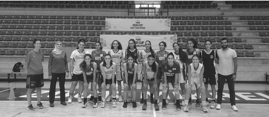
منتخب الاناث تحت الـ ١٧ سنة مع الجهاز الفني

يشارك منتخب لبنان لكرة السلة دون ١٧ سنة لفئتي الذكور والاناث في التحدي الذي ينظمه الاتحاد الآسيوي لكرة السلة الذي ينطلق اعتباراً من اليوم الخميس بمشاركة ٢٠ منتخباً (١٠ منتخبات للذكور و١٠ منتخبات للاناث).