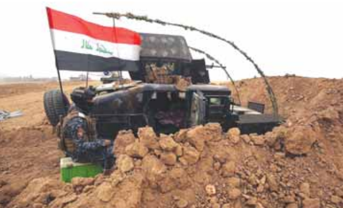
الحدود العراقية الإيرانية

وأضافت الخارجية العراقية أنه سيتم استدعاء السفير التركي في بغداد لتسليمه رسالة احتجاج على هجوم تركي بطائرة مسيرة على قوات حرس الحدود شمالي البلاد، ما أسفر عن مقتل قائدتين عسكريين