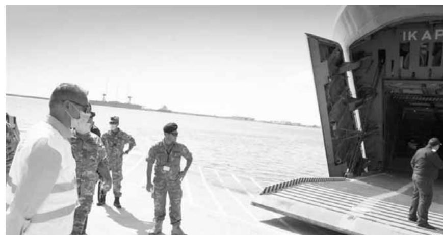
وصول المساعدات القبرصية بحراً

وقعت الحكومة الإيطالية امس من خلال الوكالة الإيطالية للتعاون للتنمية (AICS) هبة بقيمة /٧٢٦,٠٠٠/ يورو للصليب الأحمر اللبناني. الصليب الأحمر اللبناني هو الكيان المسؤول عن نقل حالات كوفيد -١٩ وهو إحدى الجهات الرئيسية الفاعلة على الأرض التي تقدم خدمات الطوارئ الطبية وإدارة الكوارث بعد الانفجار في مرفأ بيروت. تهدف هذه الهبة إلى المساهمة في الاستجابة لوباء كوفيد -١٩ وانفجار بيروت من خلال دعم قدرة الصليب الأحمر اللبناني لتوفير خدمات الطوارئ الطبية. ستساعد المساهمة في حشد سيارات الإسعاف والفرق اللازمة نظراً للعدد الكبير من المصابين إثر الانفجار مع الحفاظ على استجابتها لحالة الطوارئ كوفيد -١٩ والزيادة الكبيرة في الإصابات التي سُجّلت أخيراً.