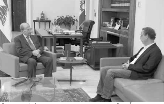
عون مستقبلاً نعمة (الدايتي ونهرا)

اطلع رئيس الجمهورية العماد ميشال عون من وزير الاقتصاد والتجارة في حكومة تصريف الأعمال راوول نعمة، خلال استقباله قبل ظهر امس في قصر بعبدا، على الوضع التمويني في البلاد بعد التطورات التي تلت الانفجار في مرفأ بيروت. وشدد عون على «ضرورة العمل لتأمين الامن الغذائي وتوفير المواد الغذائية، لاسيما منها القمح والخبز، ووجوب الاستمرار في ضبط نقلت أسعار السلع ومعاقبة المخالفين الذين يستغلون الظروف الراهنة لتحقيق مكاسب مالية غير مشروعة.» ■ نعمة ■ بعد اللقاء تحدث الوزير نعمة عن الواقع التمويني في البلاد راهنا، فقال: «بداية أقول انه سقط لنا شهدا في الاهراءات في مرفأ بيروت، ونحن متضامون بشكل كامل مع ذويهم.» أضاف: «في اليوم التالي للانفجار اجتمعت مع أصحاب المطاحن وتأكدت ان لديهم ما يكفي من مخزون الى شهر، وهناك بواخر محملة بالقمح والعلف في طريقها الى بيروت، ويمكنني القول ان لدينا ٣٢ ألف طن من القمح لدى مخازن المطاحن. وهناك بواخر بعضها وصل بعضها الى بيروت، والبعض الآخر في طريقه اليها بمدى أسبوعين، محملة بنحو ١١٠ ألف طن، ما يعني ان لدينا نحو ١٤٠ ألف طن من الآن حتى نهاية الشهر، وهي تكفينا لمدة ٤ اشهر، لأن استهلاكنا هو بنحو ٣٥ ألف طن في الشهر. والمواطن بحاجة أيضا الى سلع أخرى غير القمح، وقد اجتمعت لهذه الغاية أيضا مع المستوردين وأصحاب السوبرماركت لتتأكد ان لديهم ما يكفي من مخزون من كافة السلع، وما يكفي من طلبات خارجية تستصل الى بيروت. وقمت لهذه الغاية بزيارة مرفأ طرابلس، واليوم كنت صباحا في مرفأ بيروت حيث هناك ١٢ رافعة