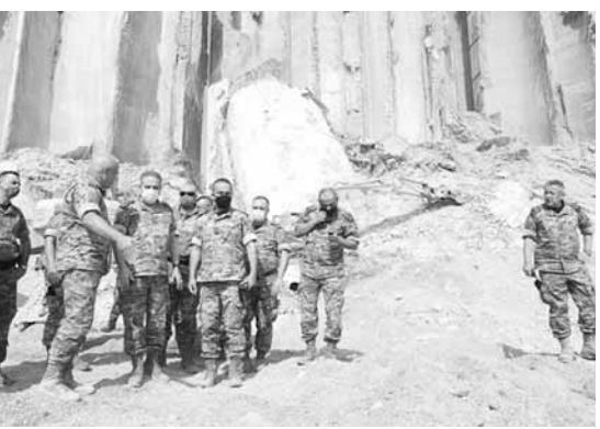
العلم يتفقد المرفأ

أمل اللبنانيين ورجاؤهم، وبفضل تضحياتكم اللامحدودة ستمر هذه المحنة وسيبقى الوطن مهما غلت التضحيات».