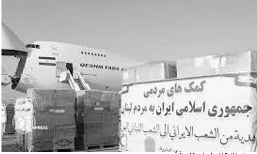
وصول طائرة المساعدات الايرانية

ساعات ومستلزمات وأجهزة طبية مقدمة من مملكة البحرين الى الدولة اللبنانية، في إطار المساعدات الدولية والعربية التي تأتي الى لبنان لمساندته جراء الانفجار الذي حصل مساء الثلاثاء في مرفأ بيروت.