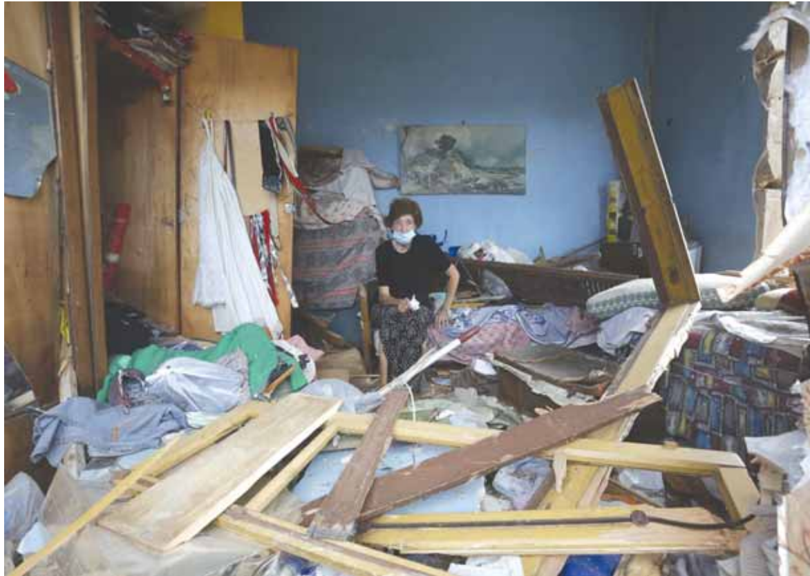
مسنة تجلس في ما تبقى من منزلها

تحمل في طياتها اتهام حزب الله بانفجار مرفأ بيروت ان اجوبة الرئيس الفرنسي كانت موضوعية غير ظالمة وغير مستتقة للتحقيق حول هذا الحادث. وفي هذا السياق، خيب الرئيس الفرنسي آمال «الثلاثي المعارض» حيث كشفت اوساط بارزة في ٨ آذار لـ «الديار» ان ماكرون لم يتجاوب اجابا مع طرح حكومة الحيا والمستقلين والانتخابات النيابية المبكرة اذ شدد على ان لبنان دولة مستقلة ولديها سيادة وان اي تغيير سياسي يجب ان يمر عبر المؤسسات الدستورية والداخلية وان لا يمكن لفرنسا ان تفرض على اللبنانيين مسؤولين وشعباً اية سيناريوهات. اما في شأن التحقيق الدولي حول انفجار المرفأ فكان موقف الرئيس الفرنسي واضحاً حيث قال: «ادعو لإجراء تحقيق دولي مفتوح وشفاف لمنع إخفاء الامور وأولاً ومنع التشكيك ثانياً». وقالت اوساط سياسية ان مطالبة بعض الجهات الداخلية بتدويل التحقيق في انفجار مرفأ بيروت لا تنبع من عدم ثقتهم بالقضاء او التحقيق اللبناني بل لاعتبارهم ان التدويل هو الوسيلة الوحيدة والقاعة لمحاربة حزب الله واضعافه. ولكن حرص الفرنسيين على توجيه رسالة مفادها انهم لا يقاطعون «حزب الله» وان التواصل ليس ممنوعاً معه، حرص ماكرون على لقاء النائب محمد رعد والقوى النيابية الأخرى في الموالات والمعارضة. في المقابل، الناس يريدون ان يكون التحقيق دولياً في قضية انفجار المرفأ، ولكن دون خلفية سياسية بل لانعدام (تتمة المانشيت ص ١٢)