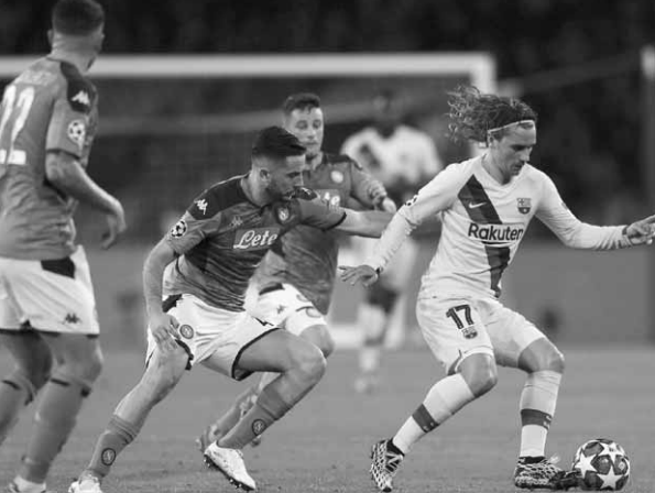
مباراة الذهاب بين نابولي وبرشلونة

ولاشك ان غياب الجماهير عن المباراة بسبب البروتوكول الصحي المفروض من الاتحاد القاري بسبب كورونا، سيقلل حجم الضغوط عن كامل لاعبي برشلونة الذين سيحاولون تقديم لمحة عن الفريق الذي سيطر على الكرة الأوروبية مطلع العقد الماضي مع المدرب بييب غوارديولا.