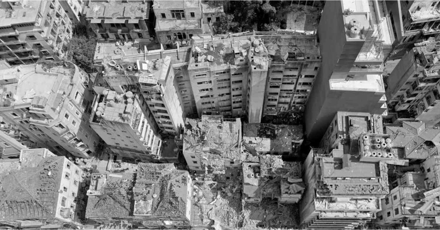
أبنية متضررة في بيروت