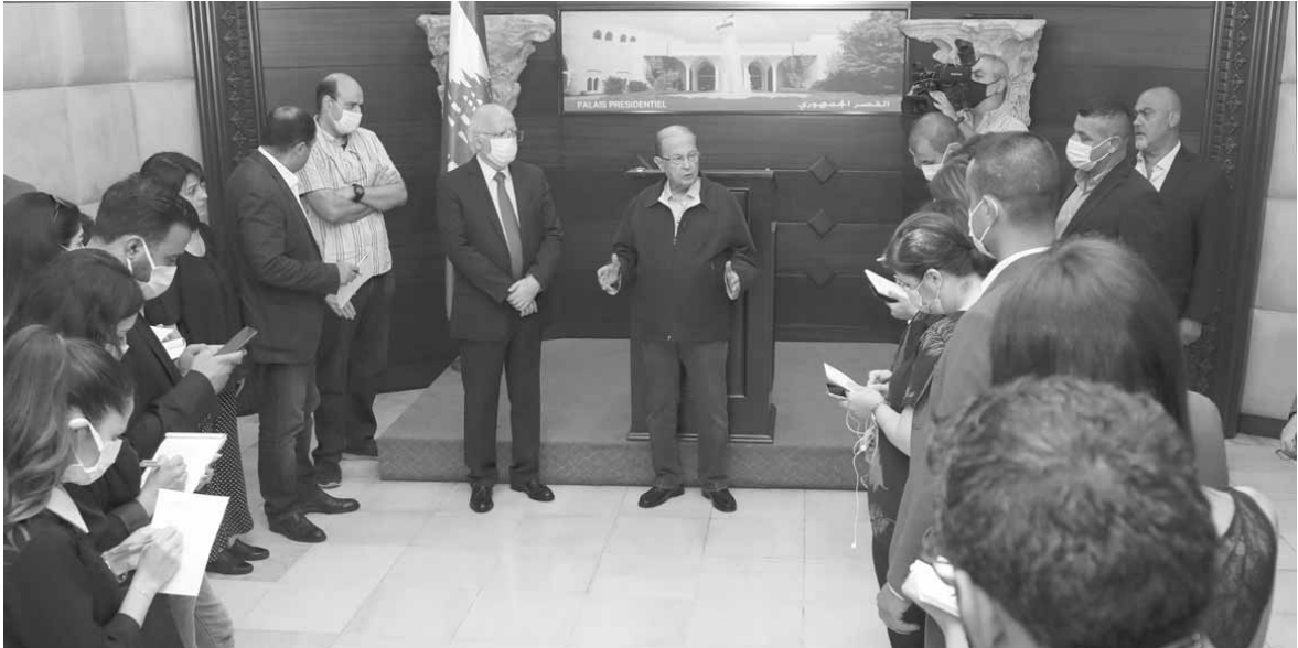
عون يتحدث الى الاعلاميين

بالحديث عن مسؤولية حزب الله، أوضح الرئيس عون أن «التحقيق لم يظهر أيا من ذلك، وهو يتم مع المسؤولين عن المرفأ، وهناك تقرير من جهاز أمن الدولة يتم التحقيق على أساسه وتحديد المسؤولية»، مؤكداً أن «التحقيقات لم تصل إلى أي رئيس حكومة بعد وإن هناك مسؤولين مباشرين يتم التحقيق معهم رهناء».