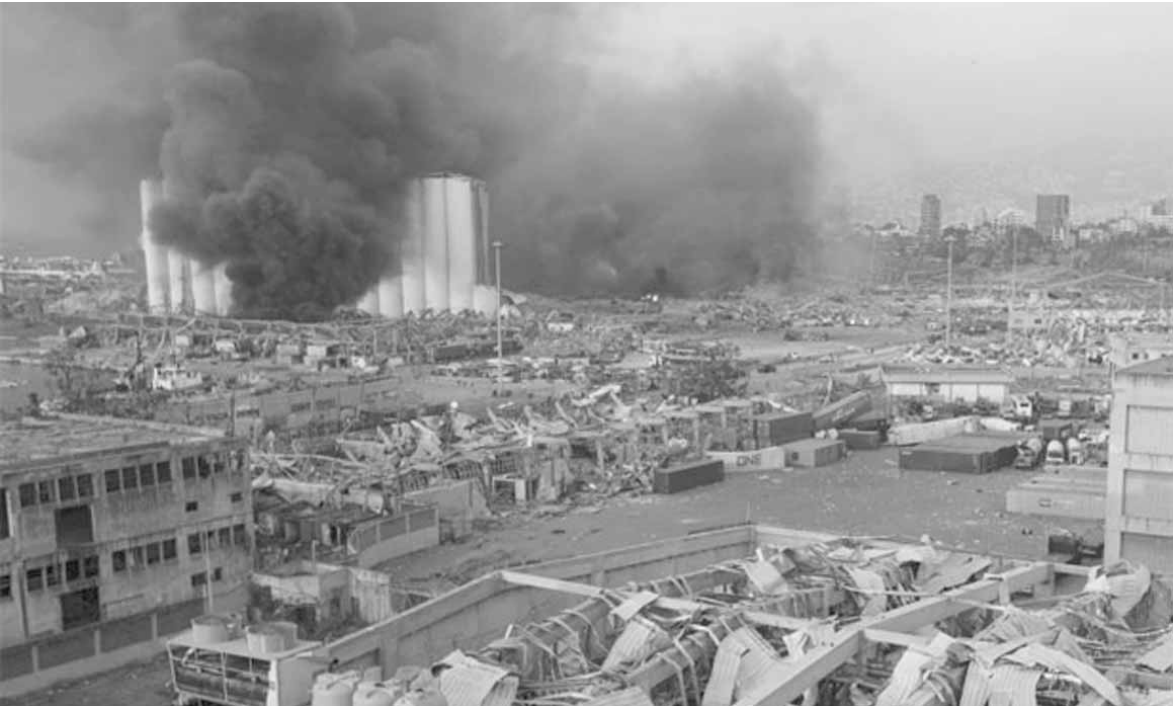
مرفأ بيروت بعد الانفجار

في هذه المطاحن وهذا ما ادى اليوم الى عدم وجود ازمة طحين بسبب هذا الاجراء لان الكميات الموجودة في المطاحن تكفي لمدة شهر واكثر. خصوصا ان بواخر عدة من القمح وصلت وسنفرغ حولئها في مرفأ طرابلس المجهز لاستقبال مثل هذه البواخر. مما سيؤدي الي تموين كاف لمدة ثلاثة اشهر.