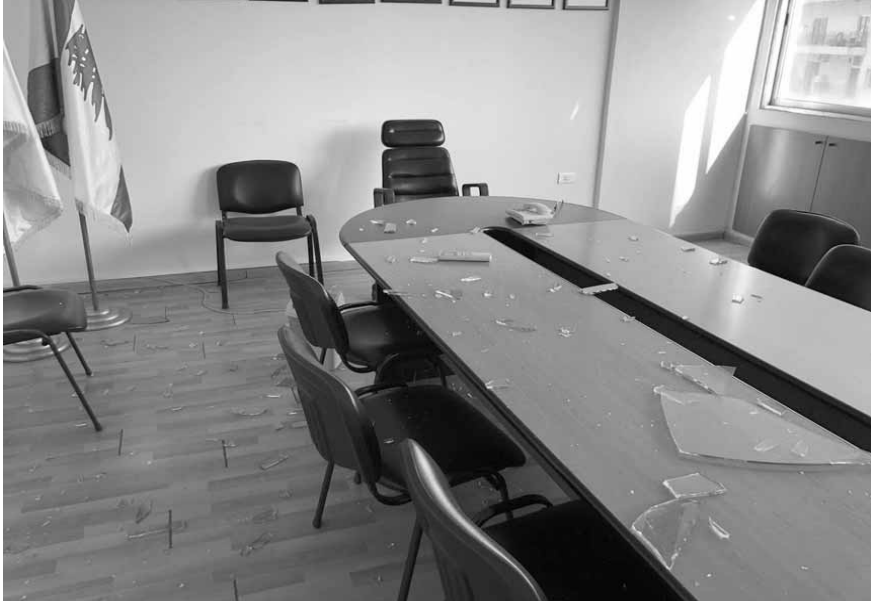
جانب من الدمار في مقر الاتحاد اللبناني للكرة الطائرة