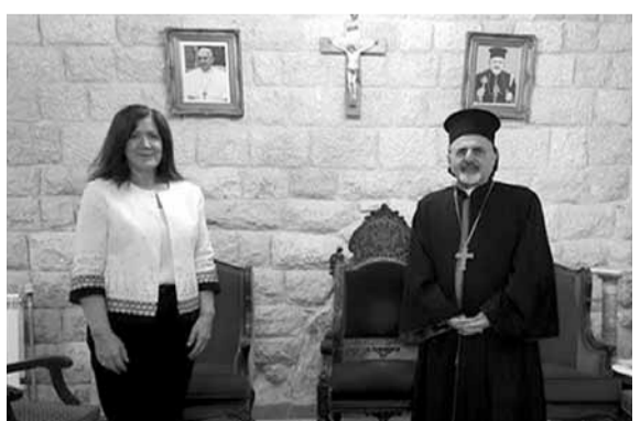
يونان مستقبلاً شيا

العماد ميشال عون والدكتور سمير جعجع حينها، وثالثهما كاس المصالحة المسيحية، فأحدثنا صدمات متتالية للجميع ضمن المشهد السياسي، الذي قلب كل المقاييس وأشعل لبنان سياسياً إيجابياً وسلبياً، بحيث كان بعض المتابعين يرون بأن العلاقة المستجدة بين «التيار الوطني الحر» و«القوات اللبنانية»، لن تتعدى ورقة إعلان النوايا، التي وقعت في حزيران ٢٠١٥، أي أنها ستكون في بطنية الشارع المسيحي والتخفيف من الاحتقان، كما لن جرى بعد أشهر من ذلك التاريخ خلط كل الأوراق السياسية في لبنان، خصوصاً بعد دعم جعجع لعون لوصوله إلى بعيدا، إذ إعتقد البعض بأن تحالفهما الجديد سيكون أقوى في ٦ ايار ٢٠١٨، أي خلال مرحلة الانتخابات النيابية الأخيرة، وسوف يقضي على الجميع.