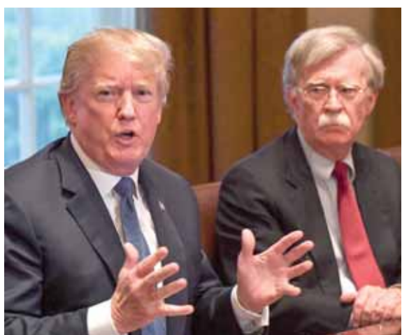
بولتون وتراهب

وصف مستشار الأمن القومي الأميركي السابق جون بولتون، رئيس بلاده دونالد ترامب، بـ«زعيم البيت الأبيض عديم الأخلاق»، الذي يركز اهتمامه على كل ما يساعده في إعادة انتخابه لولاية ثانية.