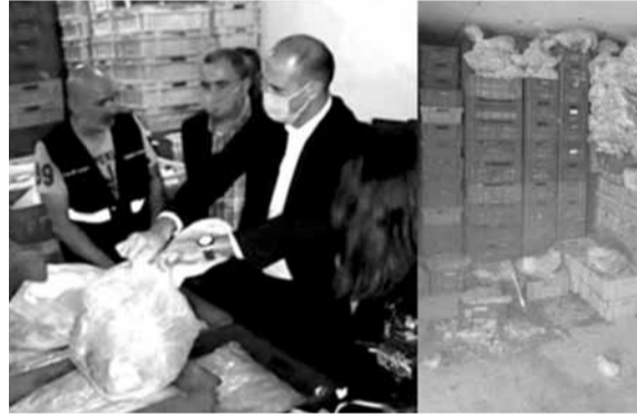
مستودعات الغذاء الفاسد

الدولة، «أسفاً» لترهل الأخيرة يوماً بعد الآخر وتراجع قدرتها على التنفيذ في كل المجالات». وأمل «إقرار الهيئة قريباً، لكن الأهم السماح لأكثر كفاءة وملاءمة بإشغال هذا المنصب، لأن يكون التعيين سياسياً»، لافتاً إلى «أننا نحائي أزمة كبيرة في البلد متمثلة بانعدام الثقة في الطاقم السياسي الذي يبدي دائماً الولاءات على حساب القدرة والكفاءة. هذه النقطة أساسية وشديدة الأهمية ونحتاج إلى تجسدها في كلّ مفاصل الدولة».