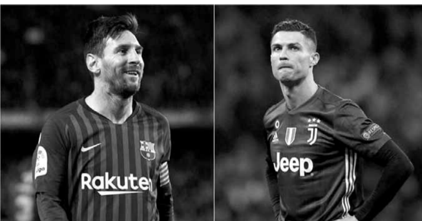
ولاشك أن ليونيل ميسي وكريستيانو رونالدو

ويهدف ميسي إلى إضافة نابولي إلى الفرق الإيطالية التي زار شبكها وإنقاذ موسم برشلونة الذي لم يتبقى فيه سوى لقب الأبطال، بعد خسارته