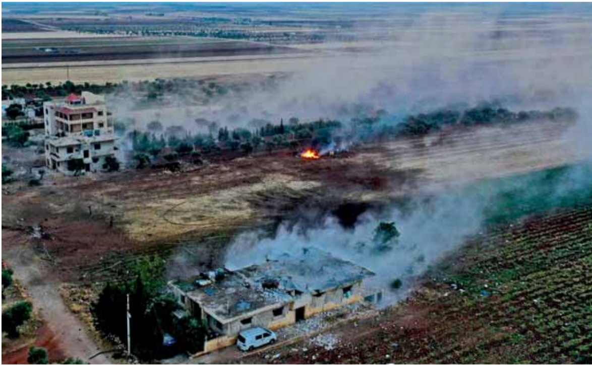
الغارات على مواقع النصرة في ادلب

نشر المتحدث باسم جيش العدو الإسرائيلي أفياخي أدري، في حسابه على تويتر، أمس، مقطع فيديو، لما قال إنه «أحباط محاولة لزرع عبوات ناسفة على الحدود السورية»، مؤكداً أنه «تم القضاء على خلية تخريبية