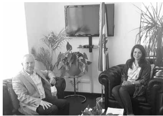
شريم مجتمعة مع حبشي

استقبلت وزيرة المهجرين الدكتورة غادة شريم في مكتبها في الوزارة، النائب انطوان حبشي مع وفد من بعض بلديات البقاع الشمالي وتم التداول في شؤون عامة، وتطرق البحث للملفات النهجير والاضرار في المنطقة.