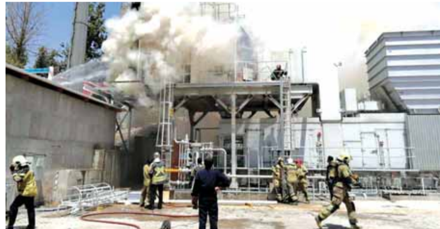
عمليات التخريب في إيران

المعقدة والناجحة، لكوادر الأمن في القاء القبض على زعيم هذه الخلية. ووردت الوزارة مجموعة من الحوادث التي قالت إن المتهم المقبوض عليه متورط فيها، ومنها تخطيط وتفجير «حسينية سيد الشهداء» في مدينة شيراز، بمحافظة فارس جنوبي البلاد، في ٢٠٠٨، الذي أسفر عن مقتل ١٤ شخصاً وإصابة ٢١٥ آخرين.