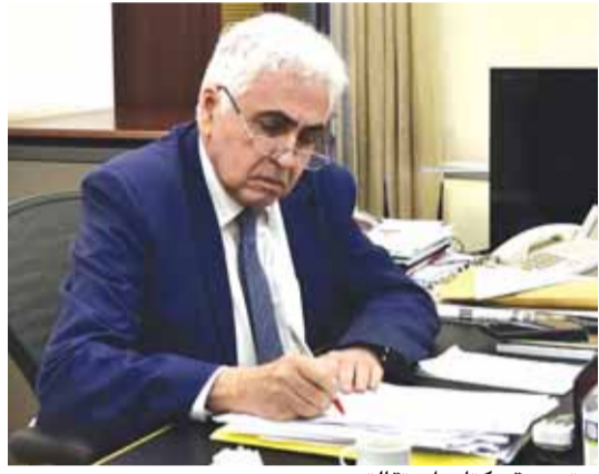
حتى يوقع كتاب استقالته