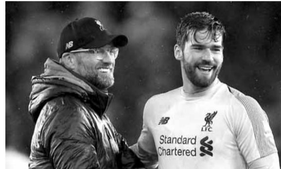
يورغن كلوب و أليسون بيكر

الصعب الفردى كان أحد المواسم التي لعبت فيها مباريات أقل بسبب الإصابات..