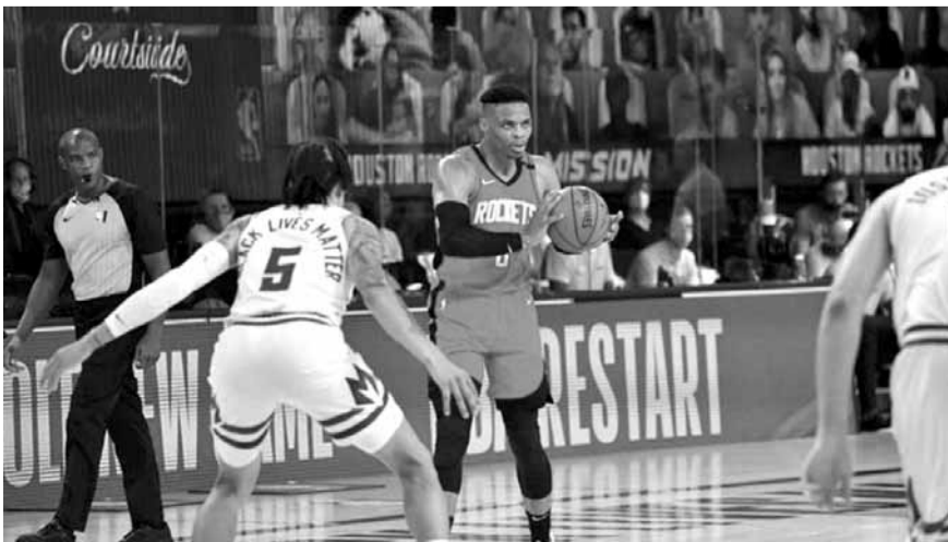
وستيروك من هيوستن بمواجهة أحد لاعبي دالاس

وانتهت مباراة الذهاب بالتعادل الإيجابي ١-١، ما يعني أن برشلونة بحاجة إلى التسجيل في لقاء الإياب لتجنب خطر أي زيارة مفاجئة لشبك مارك أندريه تير شتيجن قد تطيح بالبارسا خارج البطولة.