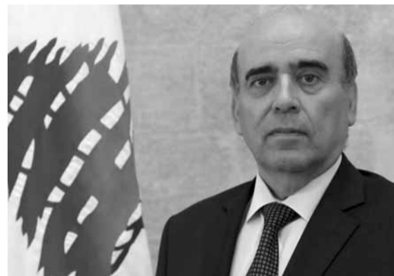
وزير الخارجية الجديد شربل وهبه