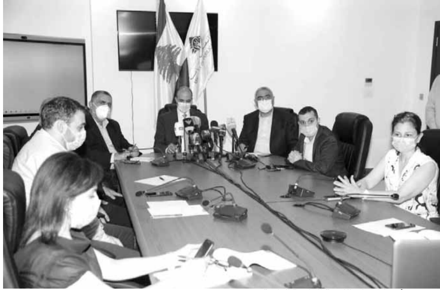
حسن يترأس اجتماع اللجنة العلمية الطبية

أعلنت وزارة الصحة العامة عن تسجيل ١٧٧ إصابة جديدة بفيروس كورونا في لبنان (١٥٩ من المقيمين و١٨ من الوافدين) ليصبح العدد الإجمالي للإصابات ٥٠٦٢ إصابة.. وأعلنت الوزارة في تقريرها عن «تسجيل ٣ حالات وفاة جديدة ليصبح العدد الإجمالي للوفيات ٦٥ حالة».