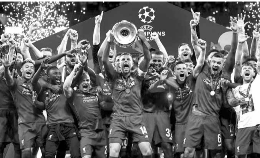
من يخلف ليفربول البطل

بالنظر إلى الفرق التي تمكن من تعويض خسارتها بفارق هدفين في الذهاب، هناك العديد من الأمثلة، ولكن يبقى مانشستر يونايتد، الفريق الوحيد الذي عوض خسارته ذهاباً بفارق هدفين على أرضه. وجاء ذلك بعدما خسر الشياطين الحمر في ذهاب دور الـ٦ من الموسم الماضي أمام باريس سان جيرمان على ملعب