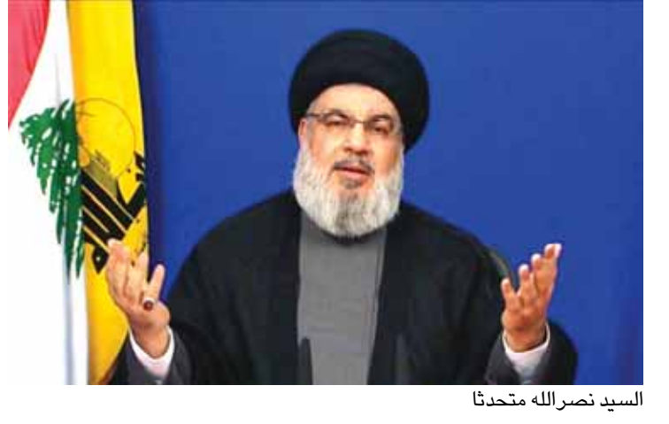
السيد نصرالله يتحدث

أطل الأمين العام لحزب الله السيد حسن نصر الله أمس على اللبنانيين في كلمة متلفزة تناول فيها الوضع الحالي في لبنان وما يعيشه اللبنانيون على المستوى الاقتصادي والمعيشي، وذكر أن مقاربة الوضع الاقتصادي يجب أن تكون مقارنة وطنية تشمل كل اللبنانيين وأيضاً المقيمين في لبنان. كما توجه للادارة الاميركية وسفيرتها في لبنان دوروثي شيا مطالباً بعدم التدخل في الشؤون اللبنانية وعدم لعب دور الناصح والحريص على اللبنانيين وحقوقهم كون الولايات المتحدة هي من تقف وراء الحصار المالي الذي يتعرض له لبنان. وفي بداية كلمته، أشار السيد نصر الله أننا على ابواب ذكرى حرب تموز والتي يسميها العدو