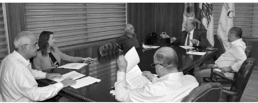
دبوسي مترشداً الاجتماع

عقد مجلس إدارة الصندوق التعاضدي لأعضاء الغرف اللبنانية أقر جدول أعماله