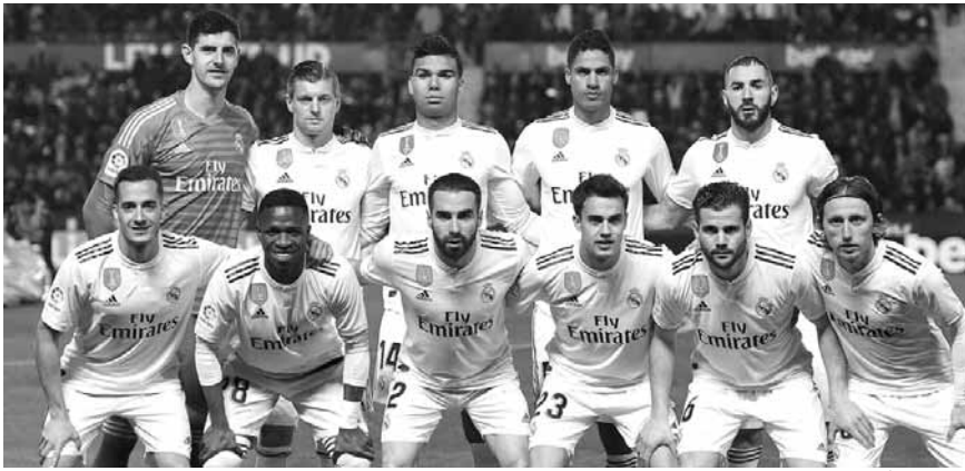
فريق ريال مدريد

وعن الخلافات ميسبي وسواريز وغريزمان، علق: «في المباراة الماضية كانوا رائعين للغاية، وانتهت الفرص في شباك الخصم، لكنني لا أسير وفق أداء