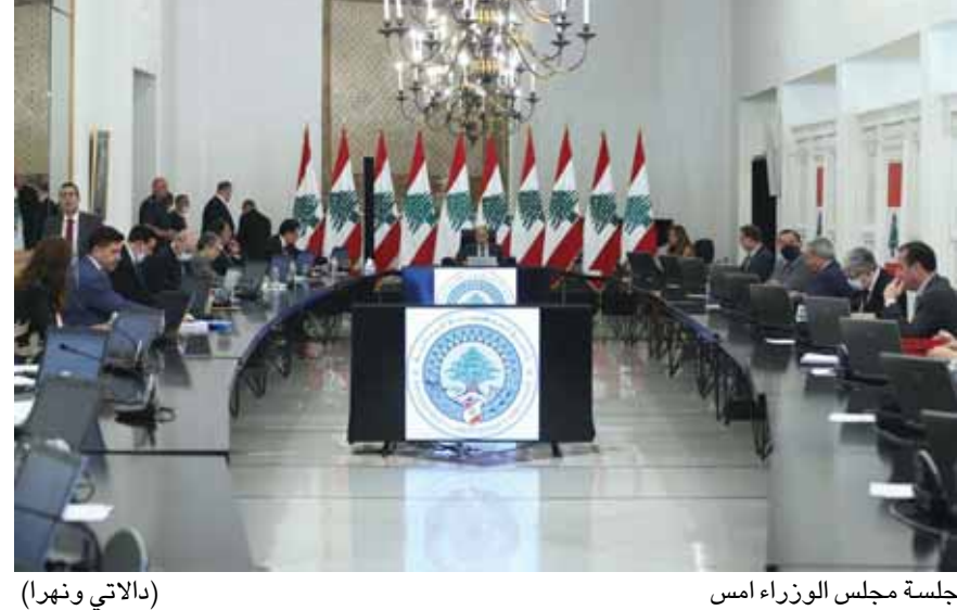
جلسة مجلس الوزراء امس (الاتي ونهرا)

السادس من تموز ١٩٤٩ ولحظات الخيانة الكبرى د. ميلاد سبيلي ص ٥