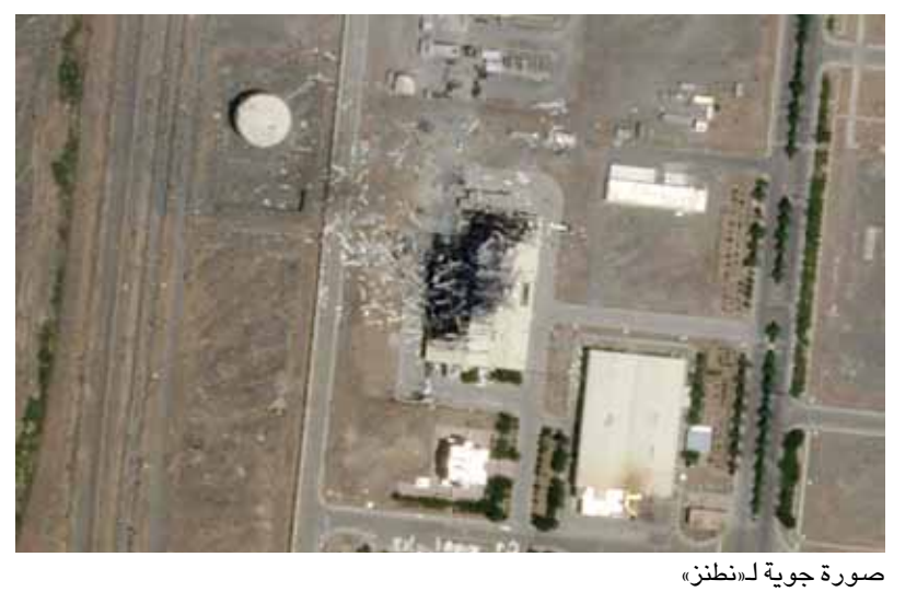
صورة جوية لنطنز

وجه رئيس حزب «إسرائيل بيتنا» أفيغدور ليبرمان اتهاماً ضمنياً لمدير الموساد يوسي كوهين بتسريب دور إسرائيل المزعوم في انفجار وقع داخل منشأة نووية إيرانية الأسبوع الماضي، للصحافة. وألح ليبرمان إلى كوهين دون أن يذكره بالاسم خلال مقابلة مع اذاعة الجيش، قائلاً في إشارة إلى مصدر تقرير صحيفة «نيويورك تايمز» يوم الأحد: «يقول مسؤول في المخابرات إن إسرائيل مسؤولة عن انفجار في إيران يوم الخميس. القيادة الأمنية بأكملها في البلاد تعرف من هو». وأضاف ليبرمان: «أتوقع أن يغلق رئيس الوزراء قم (المسرب)، خاصة منذ أن بدأ حملته لانتخابات الليكود التمهيدية»، علماً بأن كوهين يُنظر إليه كخليفة محتمل لنتنياهو. ونقلت الصحيفة الأمريكية عن «مسؤول استخبارات شرق أوسطي» قوله إن «إسرائيل» السبب وراء حريق أضر بمبنى يستخدم لإنتاج