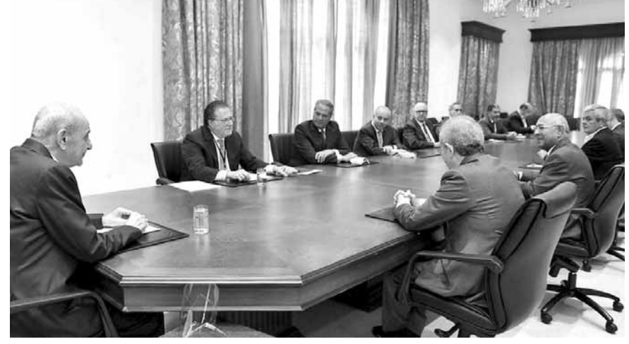
بري مستقبلاً الهيئات الاقتصادية

وفي موضوع عمل لجنة تقصي الحقائق البرلمانية قال بري: «ان تحرك المجلس النيابي من خلال لجنة تقصي الحقائق وما انجزته اللجنة رئيسا واعضاء بالتنسيق مع السلطات والجهات المالية المختصة لم يكن انتقاصا من دور احد، انما كان من اجل تصويب البوصلة بالاتجاه الصحيح ولحفظ ما تبقى من ماء وجه لبنان تجاه المجتمع