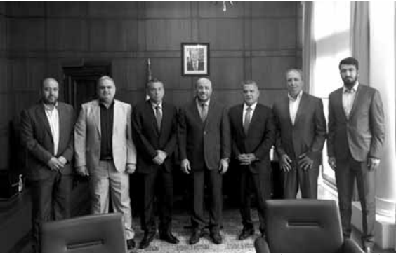
ابراهيم مع وفد حماس