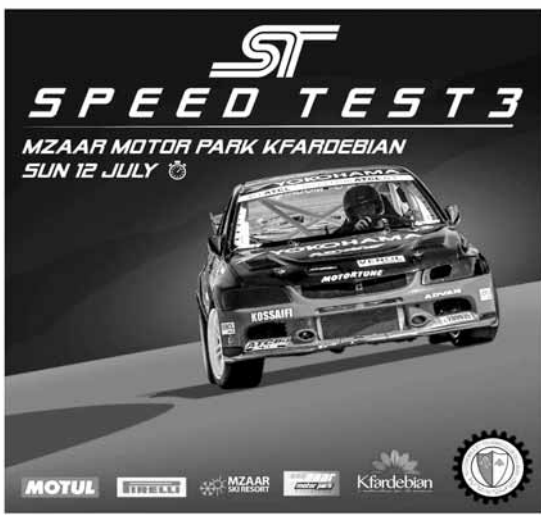
بوستر السباق الثالث للسرعة