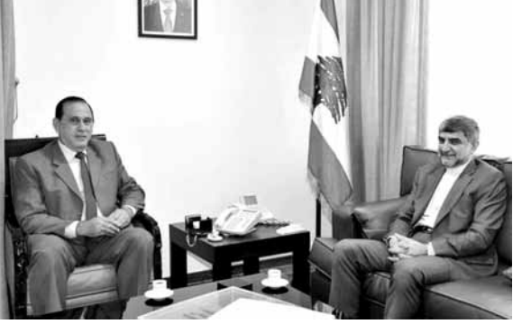
حب الله مع السفير الإيراني

اضاف: «لم يكن عندنا مطالب، الا مطالب الحفاظ على الموظف وبقائه بمكانه وكلنا يعرف الوضع الاقتصادي الصعب الذي نمر به اذا لم نضع أيدينا بأيدي بعض، لا نلقد ان نتقذ ما تبقى من مؤسسات بهذه الدولة، كان دولته دائما مستمعا الى الهيئات الاقتصادية فهو يعلم ان الوضع الاقتصادي صعب، وخائف على الوضع، واتفقنا على اجتماعات دائمة».