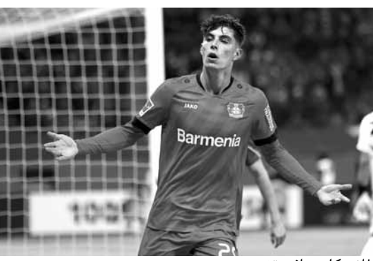
الألماني كاي هافيرتز

وتشير تقارير صحفية عديدة إلى رغبة ليفركوزن في الحصول على ٨٩,٥ مليون جنيه إسترليني (١٠٠ مليون يورو) نظير بيع هافيرتز، إلا أن تشلسي يقيم اللاعب بحوالي ٢٠ مليون جنيه إسترليني أقل. وتأتي هذه الرغبة من جانب الدولي الألماني بعد إعلان بايرن ميونخ عدم عزمه على التقدم بأي عرض رسمي لضم اللاعب هذا الصيف.