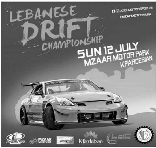
... و بوستر المسابقة الأولى للانجراف

الكسليك، وحدت آخر مهلة التسجيل عند الساعة الرابعة من بعد ظهر بعد غد الجمعة.