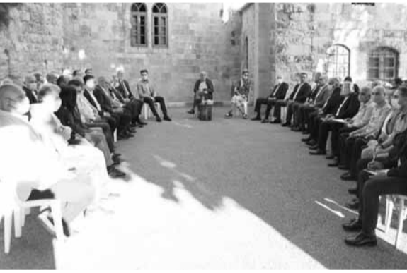
جنبلاط في لقاء من المخاترة

شهد رئيس الحزب التقدمي الاشتراكي وليد جنبلاط، على أن «المعركة في المرحلة الراهنة، معركة وجود وصدوم في وجه هذه الأزمة الخائفة التي ستزداد من دون ألق».