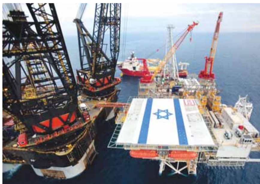
منصة بحرية إسرائيلية

صادقت الحكومة الإسرائيلية على التنقيب عن الغاز في «ألون دي» وهو البلوك ٧٢ السابق، الأمر الذي من شأنه أن يشعل النزاع مع لبنان، وفق ما ذكر موقع «إسرائيل ديفنس» الإسرائيلي. وأضاف الموقع أن البلوك المذكور يقع بمحاذاة «البلوك ٩» اللبناني الشهير، وفي قراءة قرار الاستئناف بخصوص رخصة «ألون دي» من العام ٢٠١٧، يتبين أن الحكومة الإسرائيلية امتنعت عن مدي ترخيص التنقيب في هذا البلوك بسبب الخشية من تفاقم النزاع مع لبنان. وتابع: «يبدو أن جهود إدارة الرئيس الأميركي دونالد ترامب أدت إلى اتفاق صامت بين لبنان وإسرائيل بهذا الشأن. والسؤال هو: عما تنازلت «إسرائيل»؟ وفي وثائق الاستئناف، غطت الحكومة الإسرائيلية على كل ما يتعلق حول هذا النزاع مع لبنان».