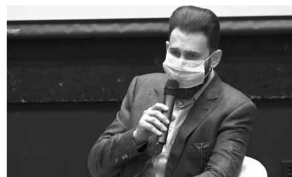
تيممور يلقي كلمته

رأى رئيس «اللقاء الديموقراطي» النائب تيممور جنبلاط، أنه «في تاريخ لبنان لم نمر بالذي نمر به الآن»، مشيراً إلى أنه في ظل السياسة التي تطبقها الحكومة اليوم من الطبيعي أن نتوقع أن نستبعد من الدعم العربي». وأشار النائب جنبلاط، خلال لقاء جمعه مع كوادر الحزب في وكالة داخلية