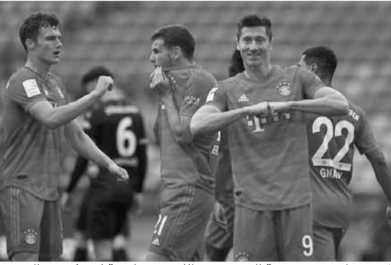
لاعبو بايرن في مهمة السير نحو اللقب بمواجهة ليفركوزن اليوم

وأضاف: «أزمة كورونا ستواصل التأثير على حياتنا جميعاً لفترة طويلة، نحن نشعر بهذا في كل يوم، لذلك لا يزال من المهم للغاية تقديم المساعدة المباشرة أينما توجد الحاجة الملحة».