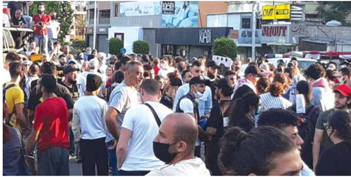
مسيرة لصيدا تنتفض «امس»

والى جانب الخلاف حول هذا الشعار المفخ والمثير لمزيد من الانقسام والفتنة، يبرز شعار اجراء انتخابات نيابية مبكرة الذي لم يستحوذ على توافق او اجماع بين الاحزاب والتيارات وجماعات الانتفاضة بكل ألوانها وفتاتها. ووفقاً للمواقف والوقائع التي سجلت عشية الدعوة الى التظاهر والاعتصام في ساحة الشهداء في بيروت وفي مدن وبلدات اخرى، بدا واضحا ان هناك خلافات وانقسامات واضحة بين هذه التيارات والمجموعات التي كانت توحدت في انطلاق شرارة الانتفاضة.