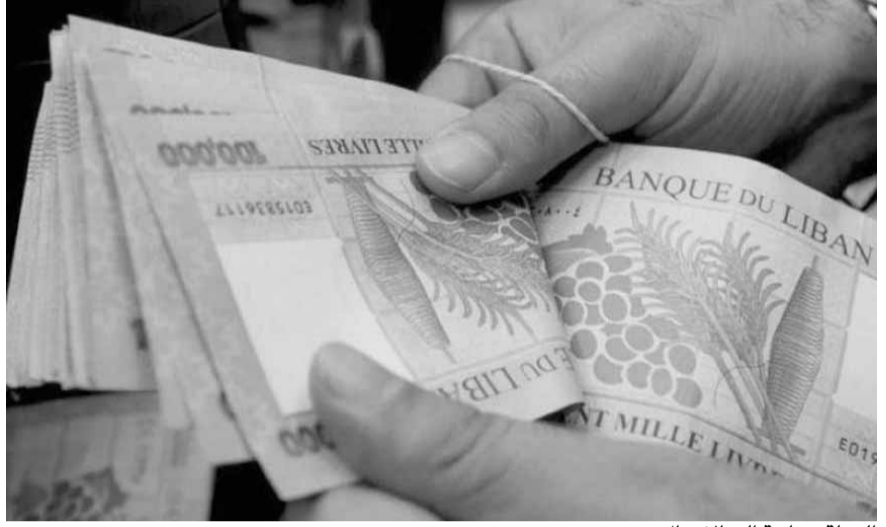
الدولة بحاجة الى الاموال

اذا كانت الحكومة تريد الاموال لتعبئة الخزينة الفارغة بسبب سياسة الإنفاق التي اعتمدها الحكومات السابقة والديون المتعاظمة، فلها بعهذ الطريقة التي تتنم عن عدم اي احساس بما يتعرض له المواطن المتروك لوحش «الغلاء» المتصاعد، وارتفاع الدولار على سعر صرف الليرة وتآكل راتبه بنسبة ٦٠ في المئة، وليس بعهذ الطريقة «البوليسية» التي اعتمدها هؤلاء سارعوا منذ اليوم الاول لعودتهم الى مزاولة اعمالهم، اولا الى قطع خطوط الهاتف للمواطنين الذين لم يتمكنوا من تسديد متأخرات الثلاثة اشهر الماضية وجتبهتم ان هذه الادارات كانت مقفلة والموظفون قابعون في منازلهم رغم ان وزير المالية القديم والمؤمن على خزينة الدولة اصدر قراراً بتعلق بعدم احتساب فترة تعليق المهل التي نص عليها القانون رقم ١٦٠ تاريخ/٥/٢٠٢٠ (تعليق المهل القانونية القضائية والعقدية) ضمن مدة المتأخر عن قيام المكلفين بالموجبات الضريبية كافة المتعلقة بكل انواع الضرائب والرسوم التي تحققها وتحصلها مديرية المالية العامة، سواء لجهة احتساب غرامات التحقق او غرامات التحصيل، كما لا تتحسب تلك الفترة ضمن مدة التأخر عن ممارسة هؤلاء المكلفين لحقوقهم الضريبية كافة.