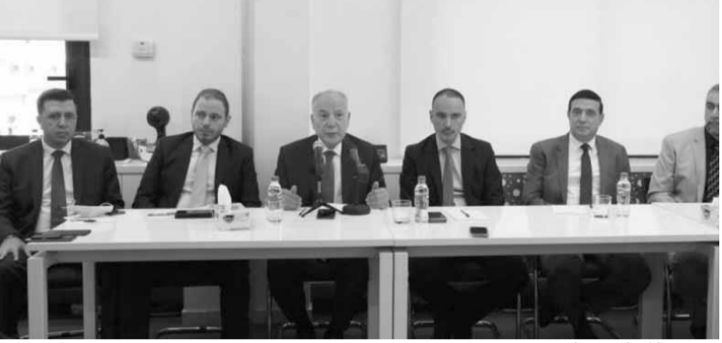
ييمين خلال الاجتماع

الحكومة، وعقد اجتمع بين مدراء الشركات والوزراء المعنيين، وتؤكد على بيئة نظيفة وعلى المعايير الدولية، التي تلتزم بها دائماً، ونجدد القول إن الشركات التي لا تلتزم بالمعايير يجب إقفالها، لأن ما يهمنا العمل في بيئة نظيفة، ما توقفت الشركات عن العمل، سنتشرد وهذا ما لنقبله لانحن ولا الوزيرة».