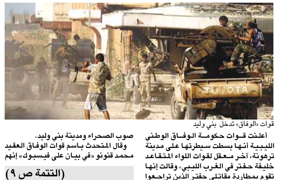
قوات «الوفاق» تدخل بنين وليد

أعلنت قوات حكومة الوفاق الوطني الليبية أنها سيطرت على مدينة ترهونة، آخر معقل لقوات اللواء المتقاعد خليفة حفتر في الغرب الليبي، وقالت إنها تقوم بمطاردة مقاتلي حفتر الذين تراجعوا (التتمة ص ٩)