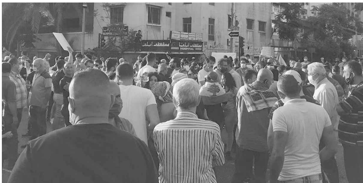
حراك «صيدا تنتفض» أمس

«كورونا»، ولبنان لم يكن في حالة انهيار وافلّس مالي مشابه. وتضيف هذه الأوضاع ككل من جهة ستفاجئ الهمة على لبنان و«حزب الله»، ومن جهة ثانية ستتمكن المقاومة وحلفاؤها ومحور المقاومة من مواجهة الهجمة الثلاثية الأميركية-الإسرائيلية-الخليجية. وعلى المستوى السياسي، تؤكد الأوساط ان المواجهة ستكون من داخل الحكومة لوقف أي تأثير غربي وأميركي على الحكومة وقراراتها ولا سيما المتعلقة بشروط أميركية-إسرائيلية مفخخة من خلال صندوق النقد الدولي أو من خلال قانون «قيصر» والعقوبات التي ستطال لبنان في حال لم يلتزم بالقانون أو استمر في أن يكون حليفاً طبعياً وواقعياً بفعل التاريخ والجغرافيا لسوريا وبالتالي عدم الانتم به أو «كشتم» ومهما يحصل يحصل لن يجري أكثر من الذي جرى وتختتم ان خيار المواجهة دائماً هو خيار منقذ على خيار الاستسلام أو المهادنة المذلة. وبالتالي لن يكون هناك أي تنازلات أمنية أو سياسية أو عسكرية للمقاومة وحلفاؤها في لبنان والمنطقة.