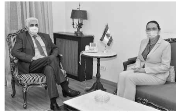
حتى مع سفيرة الدانمارك

انتقد بطريك أنطاكية وسائر المشرق والإسكندرية وأورشليم للروم الكاثوليك بطريك غريغوريوس الثالث لحام في بيان انتقد سياسة الرئيس الأميركي تجاه دول المنطقة، متناسلاً «هل قيامة الأصوات تشمل المجرمين»، مضيفاً: «الآية الأخيرة من قانون الإيمان المسيحي هي «أترجى قيامة الموتى والحياة في الدهر الآتي آمين». وأضاف: «أَسْأَلُ وأنا أتأملُ في تاريخ البشرية الذي يسجّل لنا أخبار الحروب والغزوات، التي رُزعت في بلاد أمانة، هنا وهناك، في الشرق والغرب، الدمار والخراب والحرائق والويلات والملايين من الضحايا: حرائق أكلت الأخضر واليابس»، مذكراً أنه «من بين هذه الحروب والغزوات، ما قبل عن المجرم أتيللا، لا يبقى ولن يبقى عشب أخضر بعد أقدام خيلي وأقدام جيشي وهذا ما عرف في التاريخ بسياسة الأرض المحروقة»، مشدداً على أنه «وهو يتأمل في هذا التاريخ المظلم، سمع في وسائل الإعلام، أخبار الحرائق التي على ما تذكر الأخبار، أمر بها الرئيس جيتشي وهما ما عرف في التاريخ بسياسة المتحدة الأميركية! تلك الحرائق التي أحرقت حقول القمح في شمال سوريا»، مضيفاً: «اسمع عن سرقة النفط السوري، واسمع عن تصاريح هذا الرئيس: إنه يحب رائحة البترول، وأنه دخل سوريا ليسرق هذا البترول، وماذا نقول عن «قانون القيصر»، الذي يزيد العقوبات على سوريا، ويفرض عليها حصاراً اقتصادياً، وطبياً.