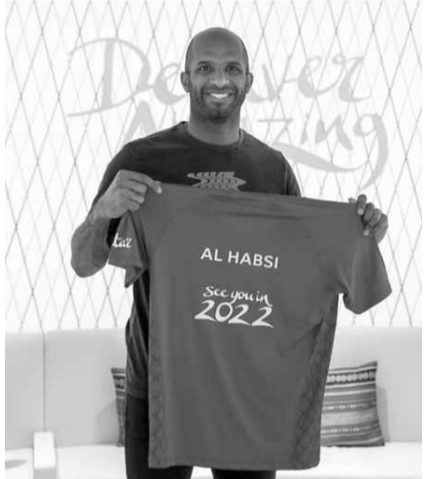
الحارس علي الحبسي

يشارك النجم علي الحبسي، حارس المرمى السابق للمنتخب العماني، وسفير للجنة العليا للتفاعلية والإرث، في جلسات البث المباشر التفاعلية التي أطلقها برنامج الجبل المبهر عبر الإنترنت في نيسان الماضي، لتعزيز اللياقة البدنية والصحية لدى أفراد المجتمع، والتواصل مع متابعيه خلال فترة البقاء في المنزل للحد من انتشار فيروس كورونا المستجد، وتابعه إلى الآن أكثر من ١٠٠ ألف شخص.