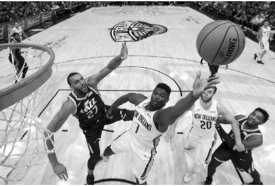
من إحدى مباريات الدوري الأميركي قبل فترة التوقف بسبب كورونا