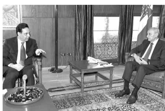
بري مستقبلاً دياب

وعصراً، عرض رئيس المجلس الاوضاع العامة وآخر المستجدات السياسية لاسيما الاقتصادية والمالية وخطط عمل الحكومة خلال استقباله رئيس مجلس الوزراء حسان دياب على مدى ساعة من الوقت، غادر بعدها دون الادلاء بأي تصريح.