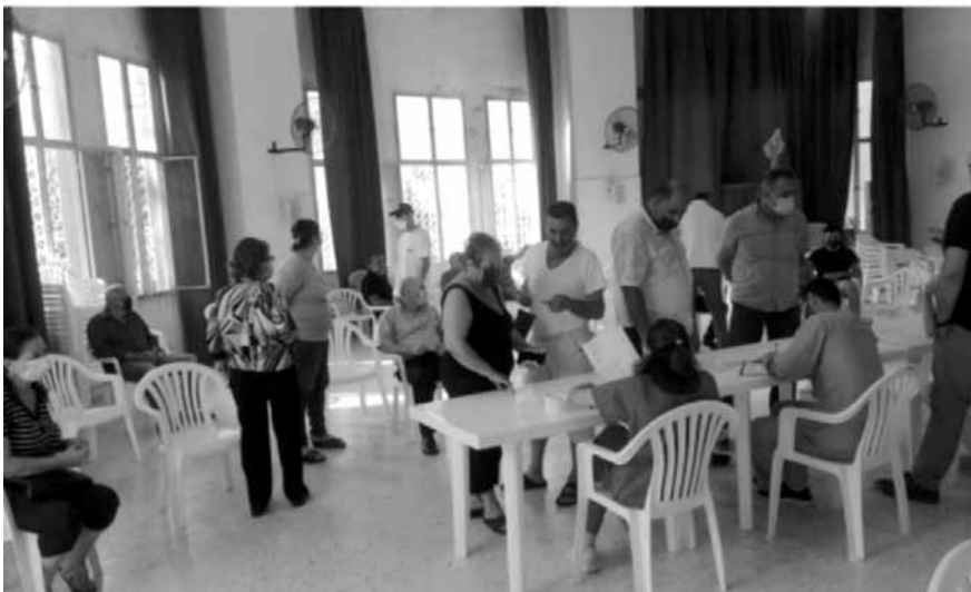
فحوص «PCR» في عقنتيت

ولذلك اتخذت القرارات الآتية: اعلان حال الطوارئ وعزل البلدة / الإلتزام التام بالحجر المنزلي، وعدم الخروج إلا للضرورات القصوى / اقفال جميع المحلات والمؤسسات، باستثناء المراكز الطبية والصيديات ومحطات الوقود ومحلات بيع المواد الغذائية، شرط الإلتزام بالإجراءات