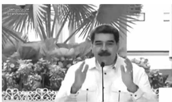
BisimchiMedia DA DE SALUD

العام في الخارجية بهذا الشأن العام الماضي ضمن إطار التحقيق في تحركات بومبيو لتسريع صفقة الأسلحة. وأوضحت مصادر «سي إن إن» أن المسؤولين في وزارة الخارجية اضطروا، بناء على طلب بومبيو، إلى تهيئة الوضع لتقديم مبرر لقرار اتخاذ طريقة عدوانية وغير تقليدية». وأثار التحقيق في ضغط بومبيو من أجل تسريع صفقة الأسلحة مع السعودية جدلاً واسعاً في الولايات المتحدة، لاسيما وعلى خلفية قرار الرئيس دونالد ترامب إقالة المفتش العامة في الخارجية ستيف لينيك بناء على طلب من بومبيو الأسبوع الماضي.