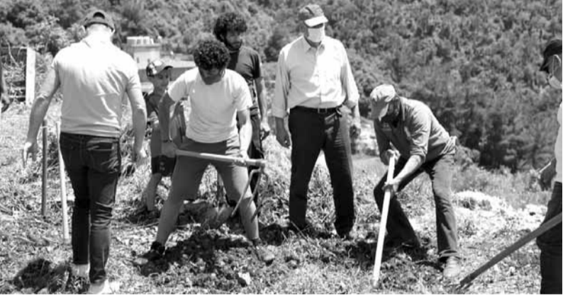
احدى المشاريع الزراعية لـ«غلّتنا»

لعل هذه المبادرة – الرسالة تلقي الدعم اللازم لكي تتمكن من تحقيق هدفها الأساسي ألا وهو تمكن كل شخص من تأمين إكتفاء غذائي ذاتي بأقل كلفة ممكنة، لنعود بذلك ونربي الأجيال الناشئة على التعلق بالأرض، حيث لا تزال جذور أجدادنا ضاربة في عمق الجغرافيا وصلب التاريخ، فلا تقتلنا منها الأزمات كأكانت إقتصادية أو معيشية أو غذائية أو من أي نوع آخر.