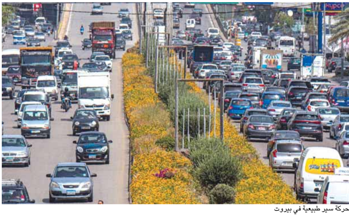
حركة سير طبيعية في بيروت

ماذا بعد مهلة المئة يوم للحكومة؟ التطورات والموقف التي سجلت في الساعات الماضية تؤشر الى ان الاسبوع المقبل سيشهد مرحلة جديدة من العمل لمواجهة تداعيات الازمات المتلاحقة التي عصفت وتعصف ببلدان بسبب انهيار الوضع الاقتصادي والمالي والتداعيات السلبية اللاحقة الناجمة عن كورونا. وغداة اعلان رئيس الحكومة حسان دياب انجازات حكومته منذ ولادتها وحتى اليوم برزت امس مواقف لرئيس مجلس النواب نبيه بري في كلمته بمناسبة عيدي المقاومة والتحرير والقطر، والتي تضمنت رسائل مهمة في كل الاتجاهات، ورسمت عناوين اساسية او خريطة طريق للمرحلة المقبلة. والى جانب ذلك، برزت وتبرز أيضاً معالم إعادة تصويب العلاقة بين الحكومة ومصرف لبنان على قاعدة التعاون وتوحيد الارقام والمواقف ليس في المفاوضات مع صندوق النقد الدولي فحسب بل ايضا لمواجهة ومعالجة الاوضاع والمخاطر المحدقة بالامن الغذائي للبنانيين وتدهور سعر صرف الليرة بطريقة دراماتيكية تذر بعواقب وخيمة على كل المستويات. وتقول المعلومات ان تدهور الاوضاع والتصدعات التي برزت في الاسبوع والايام الماضية جعلت الرئيس بري يوسع