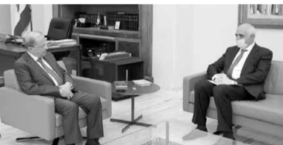
عون مجتمعاً مع القضيبي

وخلال اللقاء الذي حضره الوزير السابق سليم جريصاتي، تم التطرق الى «ضرورة اعتماد خطط اقتصادية لقطاعات التجارة والسياحة والزراعة والصناعة والتكنولوجيا»، حيث أكد عريبيد «اهمية وجود عملية تشاركية في اتخاذ القرارات على مستوى قطاعات الانتاج»، وتناول البحث ايضا «اهمية معالجة الشأن التربوي وما يتصل باوضاع المدارس في ضوء الازمة التي يواجهها القطاع التعليمي في لبنان على صعيد المدارس والعلمين والطلاب وذويهم».