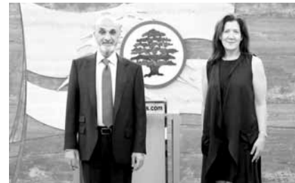
جعجع مستقبلاً شياً

بحث رئيس حزب «القوات اللبنانية» سمير جعجع، في مرعاب، مع سفيرة الولايات المتحدة الأميركية دوروثي شيا في التطورات السياسية والاقتصادية في البلاد، في حضور مستشاره لشؤون العلاقات الخارجية إيلي خوري، رئيس جهاز العلاقات الخارجية في الحزب إيلي الهندي، ومدير مكتب رئيس الحزب إيلي براغيدي.