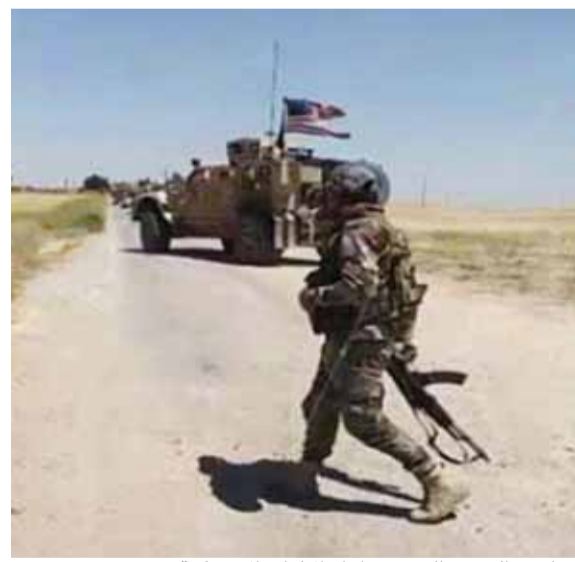
عناصر الجيش السوري امام الاليات الاميركية

قال نائب وزير الخارجية الروسي أوليغ سيرومولوتوف، إن «الإرهابيين في منطقة ادلب يدعمون إمكاناتهم القتالية، كما تُبذل جهود لتعطيل الدوريات الروسية-التركية». وقال سيرومولوتوف في مقابلة مع وكالة إنترفاكس الروسية، «نواصل العمل على تنفيذ البروتوكول الإضافي الروسي التركي في منطقة خفض التصعيد في ادلب»، مضيفاً أنه «وفقاً للبيانات الواردة، فإن الوضع في هذه المناطق لا يزال متوتراً». وأشار إلى أن «الاستفزازات من مختلف الجماعات المسلحة غير الشرعية تسجل بانتظام في منطقة خفض التصعيد». نائب الوزير الروسي شدد على أن «مقاتلي هيئة تحرير الشام والجماعات المرتبطة بها تتعرض بنشاط جهودنا لفتح الطريق السريع، في محاولة لتعطيل الدوريات الروسية-التركية المشتركة». من جهته أكد السفير الروسي في دمشق الكسندر يفيموف أن