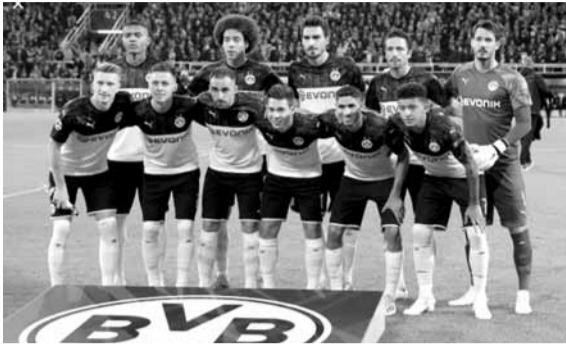
فريق بوروسيا دورتموند