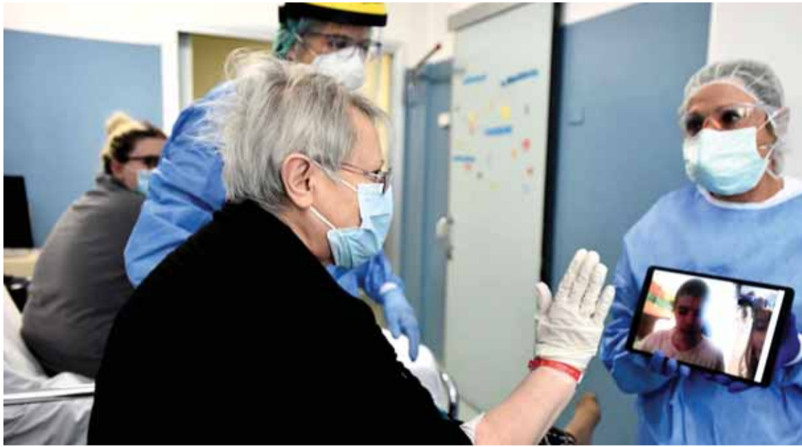
مصاب بالفايروس يتواصل مع زويه عبر الانترنت

كورونا في عين العاصفة وبولسونارو يتجاهل التحذيرات قلق أوروبي من تخفيف القيود والصين تستعد لإعلان الانتصار على الوباء