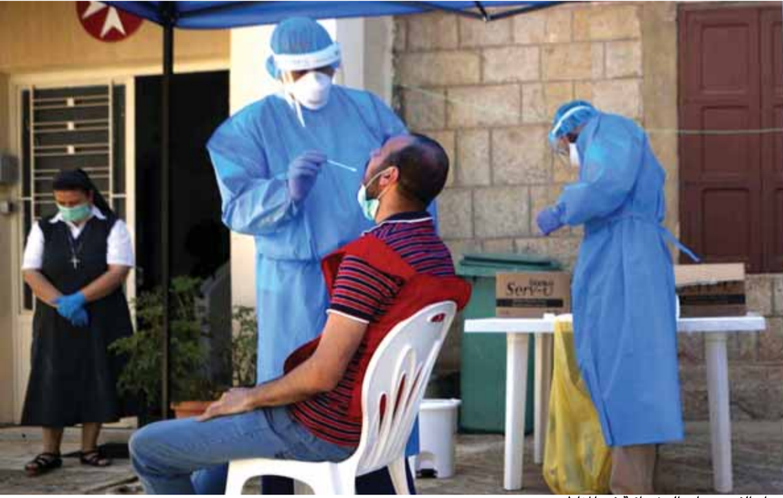
استمرار الفحوصات العشوائية في المناطق

ملف الفيول المغشوش واللعب بسعر صرف الليرة الى «الرووس الكبيرة» على وقع «كباش» سياسي في البلاد اطرافه جزء من مكونات الحكومة.. في هذا الوقت تتجه الانظار الى الاتفاق بين مصرف لبنان والحكومة على التدخل في السوق لحماية الليرة بدءاً من ٢٧ الجاري، وفيما رشحت اجواء ايجابية عن المفاوضات مع صندوق النقد الدولي الذي وصف رئيسه المحادثات «بالبناءة»، شهدت الساعات القليلة الماضية اتصالات رفيعة المستوى بين حزب الله والتيار الوطني الحر لمعالجة التباين حول بعض الملفات والتي