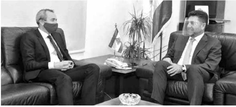
عجر مستقبلا سفير بريطانيا

وبالنسبة للقبض على سعر صرف جديد لدى شركات التأمين، قال: «نحن سمعنا من الاعلام بهذا الامر. في انتظار ان تقدم شركات التأمين دراسة عن الموضوع، وفريق من الخبراء من لجنة الرقابة على هيئات الضمان يراقب السوق واغلبية الشركات ما زالت تستوفي على ١٥٠٠ ليرة لبنانية».