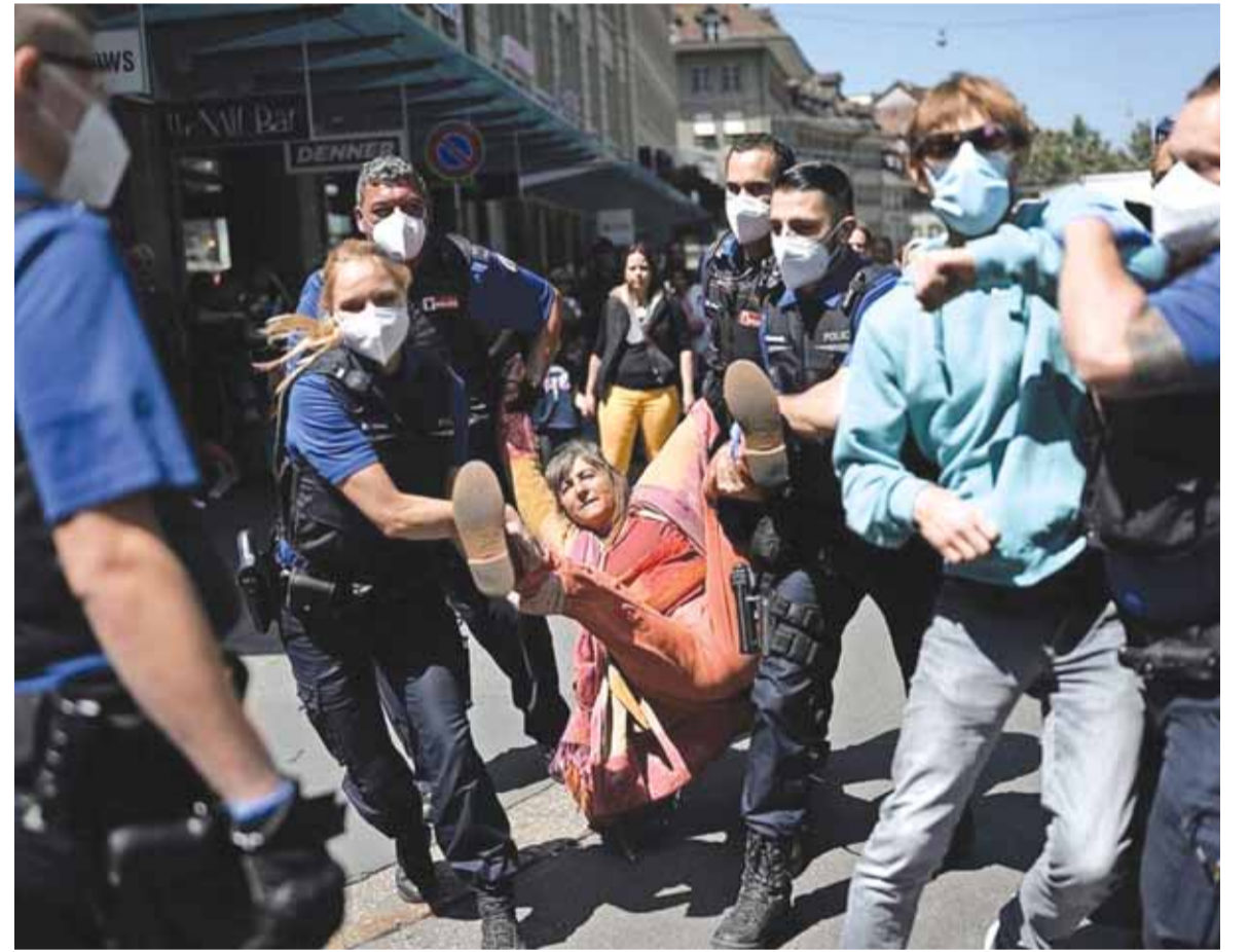
شرطة لندن تفرق متظاهرين ضد الحجر الصحي امس

الراعي: أين أصبحت التبعيات؟ وهل تحول نظامنا من ديموقراطي لديكتاتوري يطيح ببدء العدل أساس الملك؟