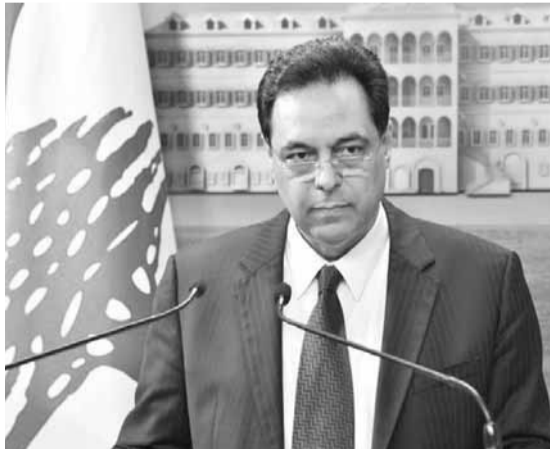
دياب يلقى كلمته (دالاتي ونهرا)

الحالات الداخلية الجديدة بنسبة خمس مرات تقريبا مقارنة بعشرة أيام سابقة. وقد ارتفع المعدل اليومي للإصابات عما كان عليه قبل إعادة الفتح. وفقا لذلك قررنا العودة إلى الإغلاق الكامل لمدة ٤ أيام. وخلال هذه الفترة، قامت فرق وزارة الصحة بإجراء اختبارات مكثفة وتتبع وعزل لجميع الحالات».