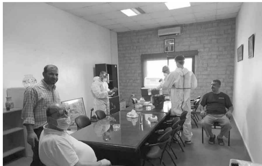
فحوص PCR في عنقون

هذه النتيجة الخبيرة في جديدة القبيطع دفعت بمحافظ عكار عماد لكي الى اتخاذ قرار فوري وسريع قضي بعزل البلدة عزلاً شاملاً واقفال جميع الطرقات الرئيسية والفرعية المؤدية اليها واقفال تام لجميع محلاتها ومؤسساتها وتكليف الاجهزة الامنية من قوى امن داخلي وامن عام وامن دولة بهذه التدابير الاحترازية ومنع الدخول والخروج منها فيما تولى عناصر الصليب الاحمر اللبناني نقل المصابين الى مستشفى حلبا الحكومي ..