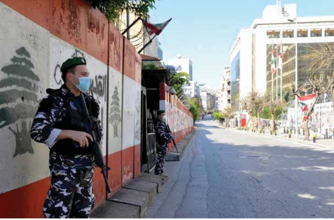
شوارع بيروت خالية

يدور الاجتماع حول واقع القطاع المصرفي ومصرف لبنان في ظل ما يحكى عن خسائر تصل الى حدود الـ ٨٣ مليار دولار حسب ما ذكرت الخطة الاقتصادية للحكومة. ويتوقع مصدر حكومي أن يكون الوفد اللبناني المفاوض مع الصندوق منقسماً على نفسه بين من يقر بالخسائر اي وزير المال ومن معه ومن يرفض الاعتراف بالخسائر في القطاع وفي المركزي اي الحاكم سلامة. كما سيبدو واضحاً امام وفد الصندوق عدم موافقة مصرف لبنان ومعارضته للخطة الحكومية ما يجعل من الصعوبة التكهّن بنتائج الاجتماع مع صندوق النقد الدولي.