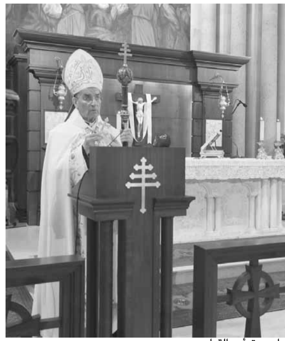
الراعي يترأس القداش

ترأس البطريك الماروني الكاردينال مار بشارة بطرس الراعي، قداس الأحد في كنيسة السيدة في الصرح الطبريكي في بكركي، وألقى عظة الأحد السادس من زمن القيامة – تذكار سيدة الزروع، بعنوان «الحب الذي وقع في العنب الجيدة أثمر ثلاثين وستين ومئة». وقال: «نحيي اليوم تذكراً سيدة الزروع الذي تعيده الكنيسة في الخامسة عشر من هذا الشهر. فقتالتم في إنجيل الزارع، حيث الرب يسوع يشبه كلمة الله التي يكرز بها بحسب الحكمة التي إذا وقعت في الأرض الجيدة أثمرت ثلاثين وستين ومئة. في ليتورجيتنا المقدسة نشبهه أماً مريم العذراء بالأرض الطيبة التي قبلت