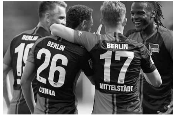
لاعب هرتا برلين خرقوا قواعد عدم الاحتفال بالهدف

بعض المشاهد، مثل سماع صافرة البداية من خارج ملعب سينغال إيدونا براك الذي أشار إليه الكاتب الرياضي جيمس إلينغورث حين قال إنها لحظة مؤثرة أن تسمع الصافرة من خارج ملعب كان هديره يصل لكل حدود المدينة، لاشك إنها مؤثرة ونادرة بالفعل.