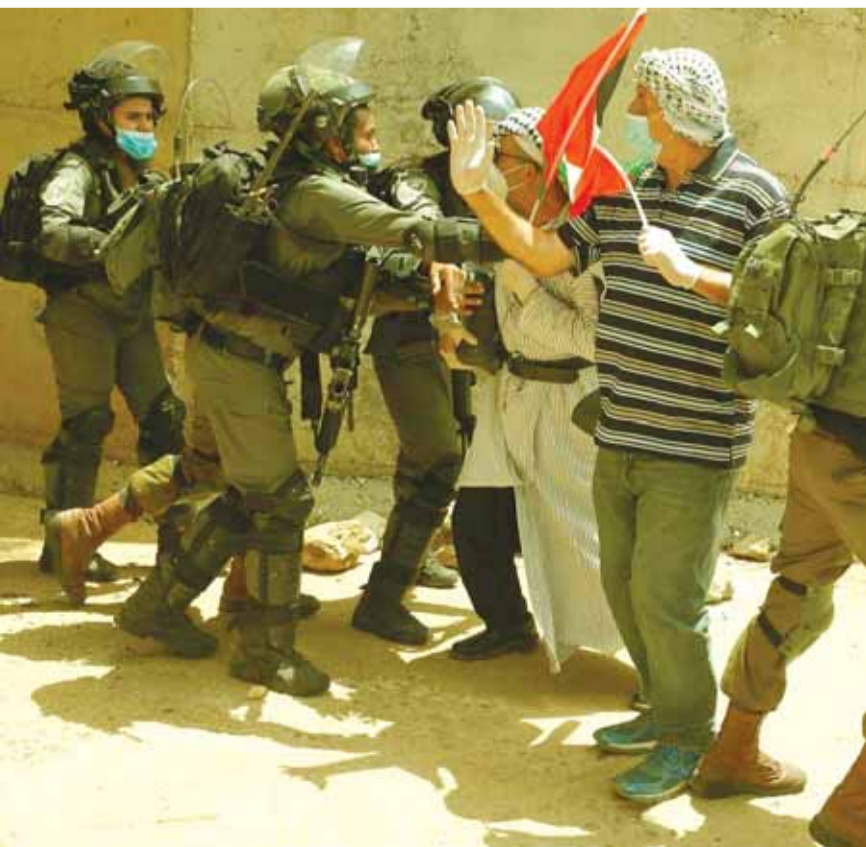
المواجهات مستمرة بين الفلسطينيين والاحتلال

تتحضّر القوى الفلسطينية الى الاعلان الاهم من قبل حكومة الاحتلال عن سيادة الضفة الغربية الى سيادة الاحتلال الاسرائيلي، بما يوصف بالنكبة الكبرى أو نكبة القرن الواحد والعشرين. ولا يبدو حتى الان عن وجوب تحريك فلسطيني جدي لمواجهة هذه الجريمة الموصوفة بالقضاء على آخر شبر من فلسطين، اذ تركزت معظم تهديدات السلطة الفلسطينية على توقيف العمل بالاتفاقيات الأمنية وغيرها، ومن جة أخرى لم يخرج عن العرب سوى تصريح اوحد للملك الاردني عبدالله الذي هدد بصراع كبير مع الاردن في حال اقدمت اسرائيل على خطوتها... واعتبر رئيس الحكومة الإسرائيلية بنيامين نتنياهو، أمس الأحد أن «الوقت قد حان لتطبيق