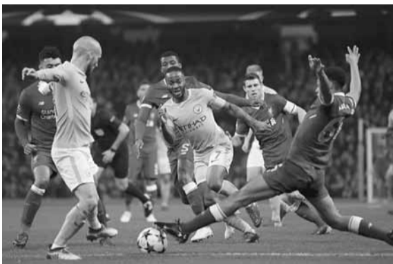
من إحدى مباريات الدوري الإنكليزي

وتابع «لن أضع عائلتي في خطر، ماذا سيفعلون،