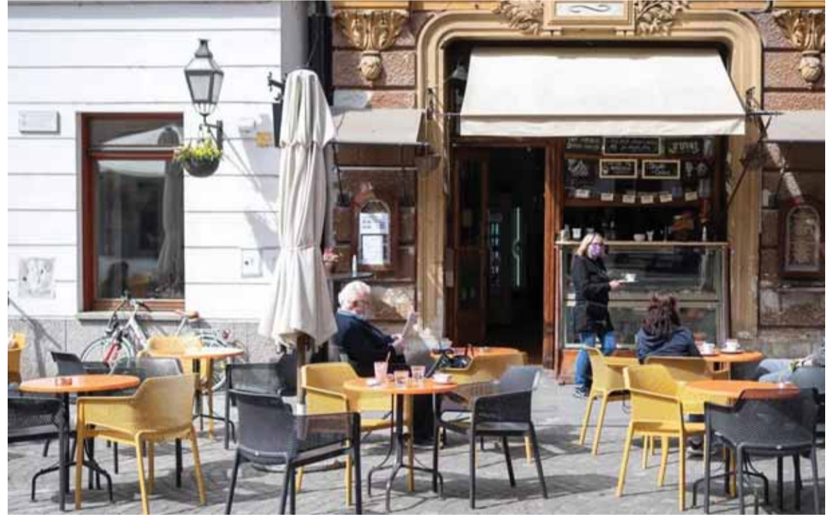
سلوفينيا والعودة الى الحياة الطبيعية

تطعيم محتملة أو رقابة مفترضة من الدولة. وفي ٦ أيار الجاري أيضا فضت الشرطة الألمانية مظاهرة احتجاجية ضد التدابير المعلنّة لمواجهة كورونا في برلين.