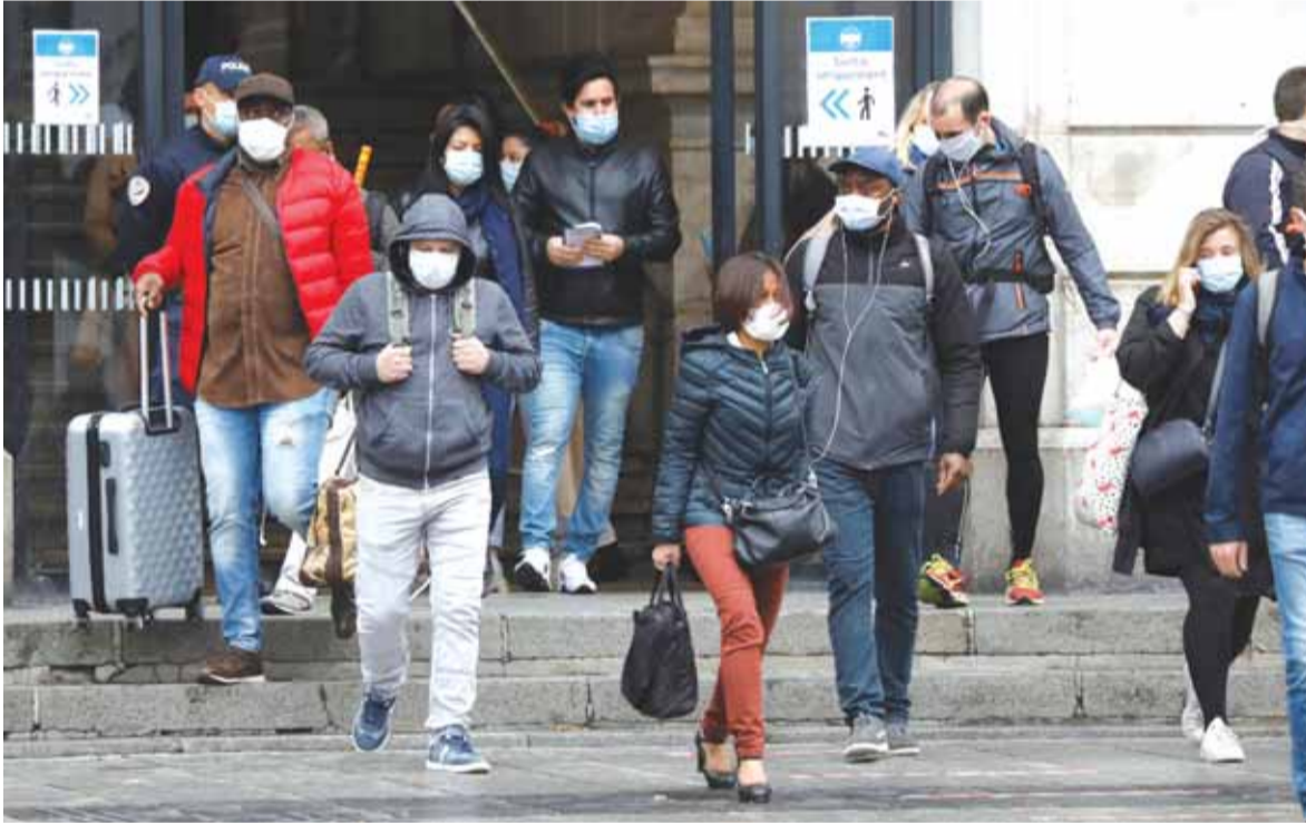
... وأوروبا تخفف القيود

واحتشد مئات المحتجين في وارسو حاملين لافتات تقول «العمل والخبز»، و«ستعود الأمور الى طبيعتها مجدداً». وخففت بولندا بشكل مطرد القيود في الأسابيع الأخيرة في محاولة للحد من آثارها على الاقتصاد، ومن المتوقع أن تعيد صالونات تصفيف الشعر والمطاعم فتح أبوابها اعتباراً من اليوم الاثنين، في ظل إجراءات جديدة للسلامة.