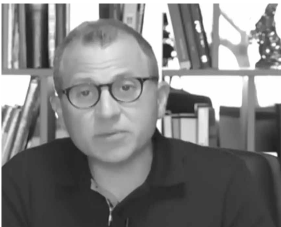
باسيل في مؤتمره الصحافي

باسيل: رئيس الجمهورية لا يسقط.. والفساد أقوى مما أَدعو الراعي الى دعوتنا في إطار خطة طوارئ