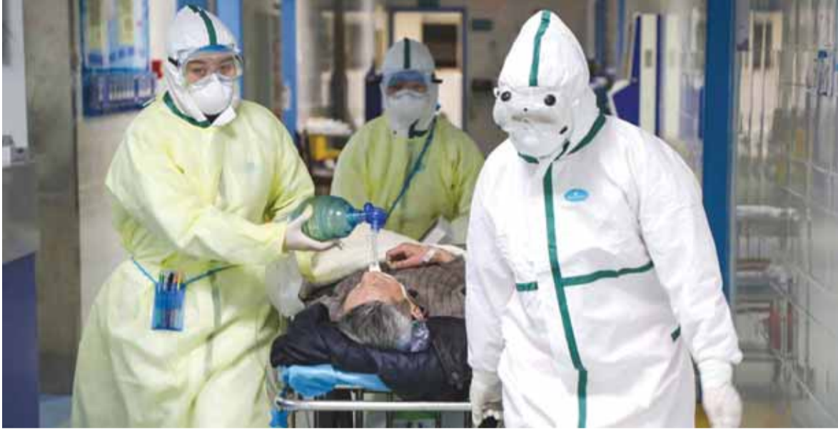
كورونا بلغ مرحلة حرجة

وزير الخارجية تسوغتاتار دامدين وغيره من كبار مسؤولي الدولة عادوا من بكين أمس الاول، بعدما عقدوا اجتماعاً مع الرئيس الصيني شي جين بينغ ورئيس الحكومة لي كه شيانغ.