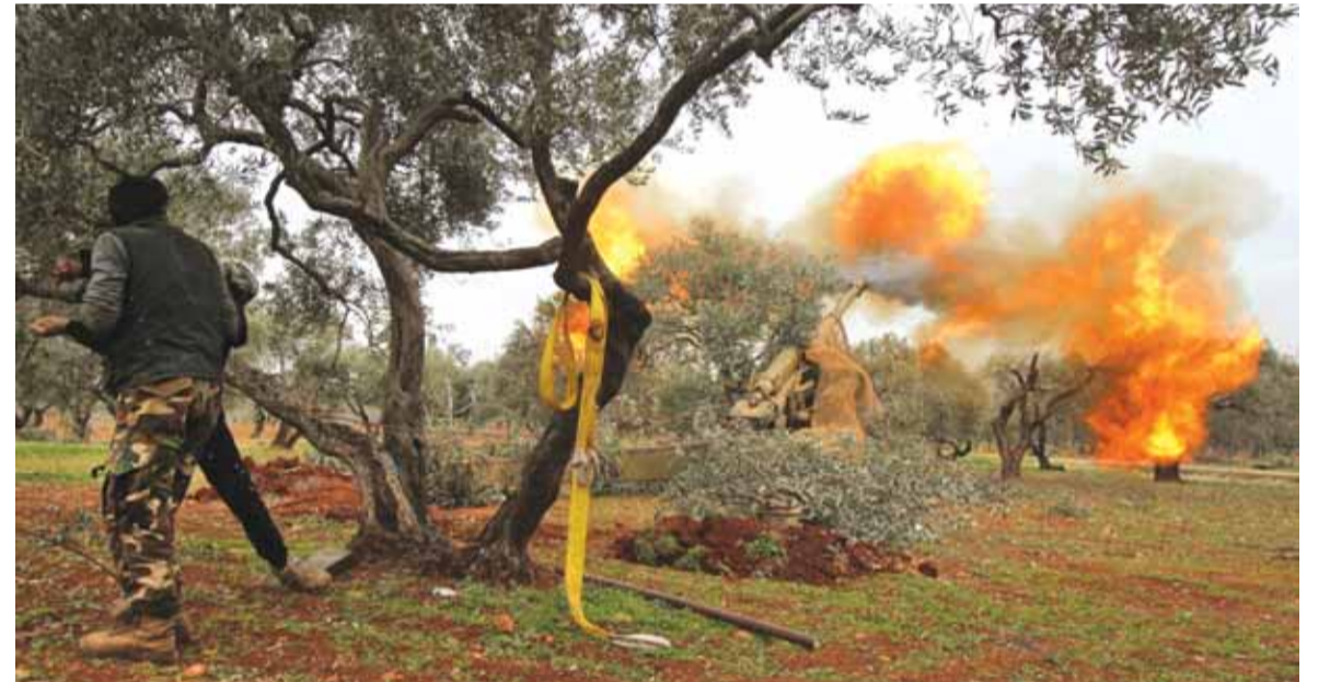
معارك ضارية في ادلب

وأعلن حاكم محافظة هاتاي الحدودية التركية رحمي دوغان،