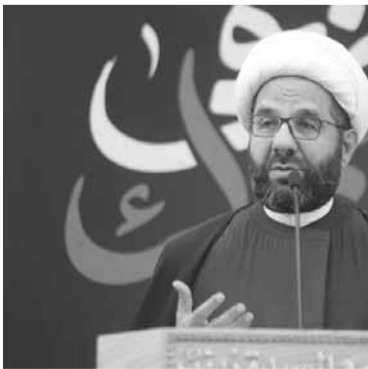
دعموش يلقي خطبة الجمعة

وجرى خلال اللقاء البحث في العلاقات الثنائية بين البلدين. وأكد السفير الفرنسي «دعم فرنسا للبنان ووقوفها الى جانبه». كما جرى التأكيد على «الدور الذي تقوم به الحكومة لناحية عملية الإصلاح والمهمة الإنقاذية التي تتولاها، ودور فرنسا في مساعدة لبنان خاصة عبر ترجمة مقررات مؤتمر سيدر».