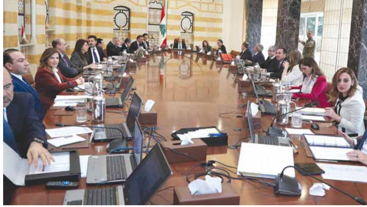
جلسة مجلس الوزراء امس

المواجهة الأميركية الإيرانية مُستمرة منذ انسحاب الولايات المتحدة الأميركية من الاتفاق النووي في الثامن من أيار ٢٠١٨