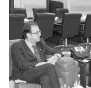
دياب مجتمعاً مع فوشيه (اللاتي ونهرا)

استقبل رئيس مجلس الوزراء حسان دياب قبل ظهر امس في السراي، السفير الفرنسي برونو فوشيه ترافقه المستشارة الاولى في السفارة ساليانا غرونويه كاتالانو، في حضور المستشار الديبلوماسية للرئيس دياب السفير جبران صوفان ومدير مكتبه القاضي خالد عكاري.