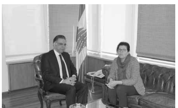
قطار مجتمعاً مع مويرو

التقى وزير الدولة لشؤون التنمية الإدارية دميانوس قطار في مكتبه في الوزارة سفير الإتحاد الأوروبي في لبنان رالف طراف على رأس وفد من البعثة، حيث تم استعراض المشاريع المشتركة بين وزارة التنمية الإدارية وبعثة الإتحاد الأوروبي في لبنان وكانت مناسبة تطرق فيها الطرفان إلى سبل