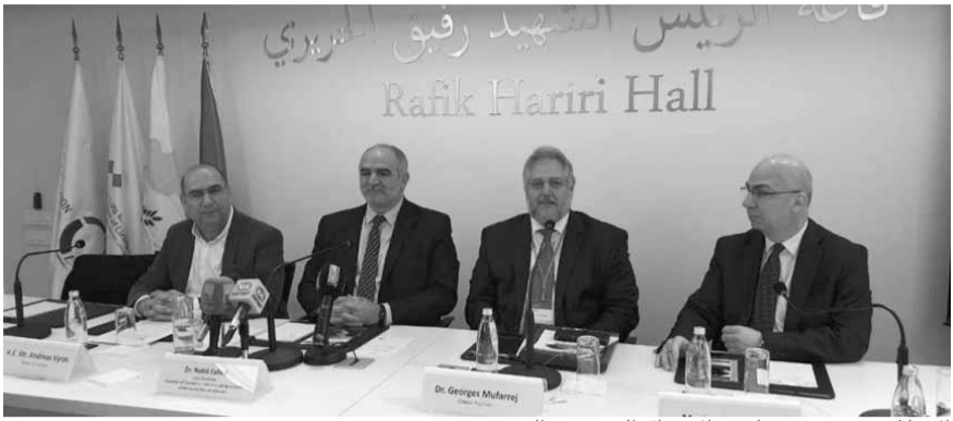
الإعلان عن مؤتمر ملتقى الأعمال العربي - القبرصي

عقد قبل ظهر امس مؤتمر صحفي، بدعوة من غرفة بيروت وجبل لبنان للتجارة والصناعة و Pavilion Cedars، بالتعاون مع غرفة تجارة وصناعة لارنكا - قبرص، في مقر الغرفة في الصنائع للإعلان عن «مؤتمر ملتقى الأعمال العربي - القبرصي ٢٠٢٠»، في لارنكا برعاية رئيس جمهورية قبرص نيكوس أناستاسيادس، في حضور نائب رئيس الغرفة