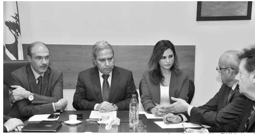
الوزراء الثلاثة خلال المؤتمر الصحفي

وقال: «في العام ٢٠١٩، سافر ٢٠ مليون سائح إلى بلد آخر للحصول على العلاجات الطبية، حسب معلومات «Be-Patients Beyond Borders» الدول العشر المقصودة للعلاجات الاستشفائية