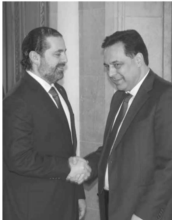
الحكومة الثقة في مجلس النواب، قد ساهم في تكوين مناخ اعتراضى وضغط على حكومة الرئيس دياب، التي تواجه مرحلة تحتاج إلى قرارات مصيرية.

ولذا، ترى المصادر السياسية المطلعة نفسها، أن الرئيس دياب حرص على عدم تسمية هذه