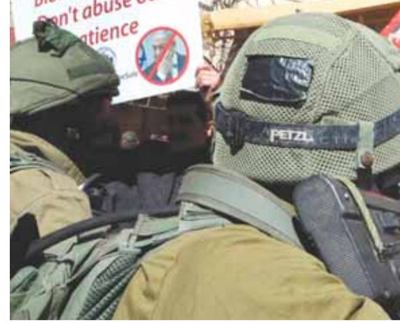
المواجهات في نابلس

لوكسمبورغ: لا يمكن الاعتراف قانونياً بالمستوطنات