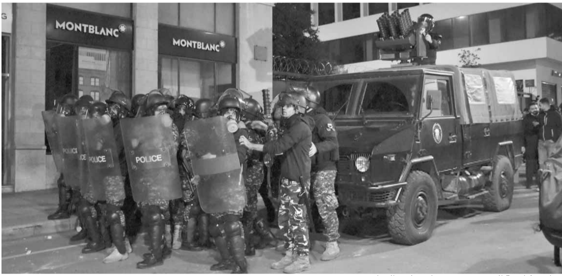
قوات مكافحة الشغب في محيط مجلس النواب

وصولاً إلى خفض المساعدات العربية، وتردي الأوضاع الاقتصادية والمعيشية والتربية والتعليم في المخيمات، مما يساعد على بقاء الأمور تحت السيطرة حتى الآن. وفي موازاة هذا الواقع، أشارت المراجع نفسها إلى خشية من تردي الأوضاع الاجتماعية نحو الأسوأ الذي ينذر بظورة إجتماعية أو ما يسميها البعض بـ«ثورة الجيعان»، وفي هذه الحال، فإن الأمور قد تخرج عن السيطرة ويزداد منسوب القلق من انكشاف الأوضاع الأمنية، ولهذه الغاية فإن هذه الخلايا النائمة والإرهابيين والتكفيريين قد يستغلون تلك الظروف من أجل إحداث بلبلة عبر رسائل تأتي في سياق تصفية الحسابات الإقليمية، واستدراكاً لذلك تزدت بعض المعلومات عن تغيير مرتقب في استراتيجية الحراك، من خلال بنك أهداف قد يكون مغايراً بكل أشكاله عما سبقه، لا سيما وأن هناك الكثيرين من الطبقة السياسية وعلى رغم خلافاتهم، يركزون على استغلال ما يجري لقمع المنتفضين واتهامهم بالقيام بأعمال الشغب.