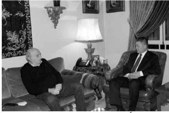
جنبلاط مجتمعاً مع سفير الصين

الملك سلمان بن عبد العزيز معزياً بوفاة الأمير بندر بن محمد آل سعود.