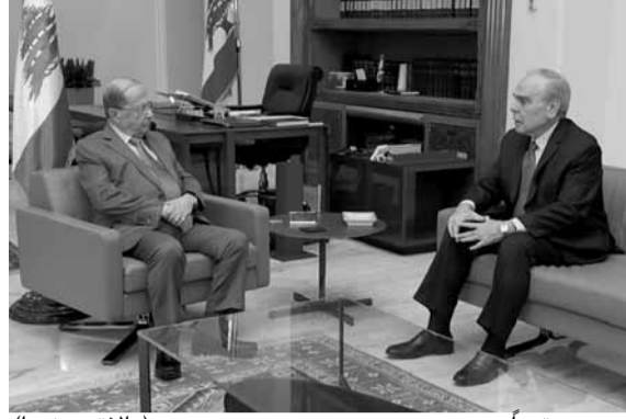
عون مجتمعاً مع رحمته