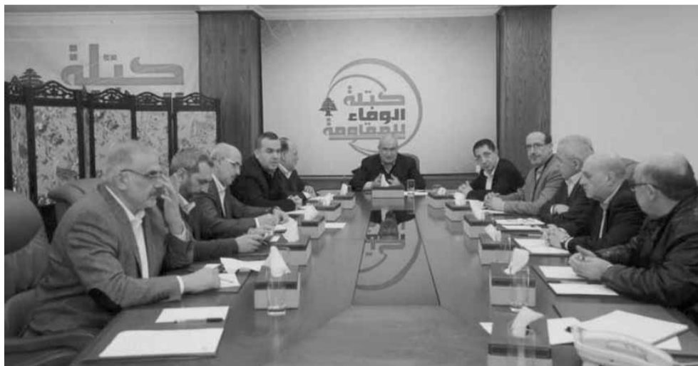
رعد يتراس الاجتماع

أشارت كتلة «الوفاء للمقاومة» في اجتماعها الدوري الذي عقد بمقرها في حارة حريك، بعد ظهر أمس، برئاسة النائب محمّد رعد، الى ان «الحكومة الثالثة في العهد الرئاسي الحالي، أبصرت النور خلال مهلة شهر تقريباً تجاوز فيها الرئيس