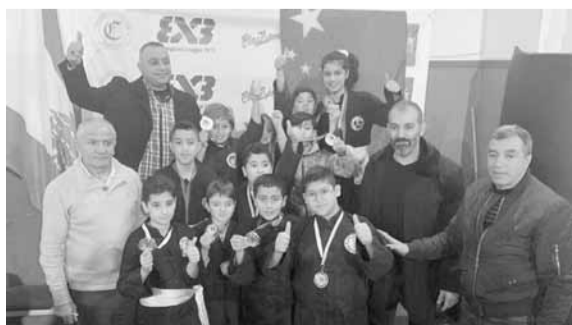
كبار الحضور يتوجون الابطال