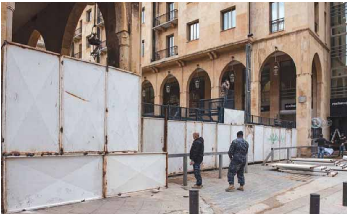
الواح اسمنتية أمام مجلس النواب

بيروت، اما «الترسيم» الدولي فترجم داخليا بموقف رئيس الحكومة السابق سعد الحريري الذي أكد انه من السابق لأوانه إطلاق الأحكام في شأن الحكومة، وقوله ان البلاد تحتاج إلى فرصة للتقاط الأنفاس دون ان ينسى التأكيد انه لن تصح مقاربة الوضع الحكومي بمعزل عن رصد مواقف الأشقاء والأصدقاء، فيما سبق لرئيس الحزب التقدمي الاشتراكي وليد جنبلاط ان اتخذ موقفا مماثلا، لكن اللافت في هذا السياق موقف حزب الله الواضح عبر كتلة الوفاء للمقاومة التي وجهت «رسالة» واضحة الى المجتمع الدولي عموما والولايات المتحدة خصوصا، بالتاكيد انه لن تكون هناك اي مجاملة مع أحد في السيادة والقرارات الوطنية واستثمار مواردها..