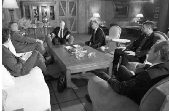
كوبيش عند فرنجيه

نوه وكيل الأمن العام للأمن المتحدة يان كوبيتش، خلال زيارته تقييد المحامين في بيروت ملحم خلف مهنتها بانتخابه تقييداً في مكتبه في نقابة المحامين، بمبادرات خلف «لجهة دعم استقلالية السلطة القضائية والمساواة أمام القانون، والحماية القانونية لحرية التعبير»، وشدد على «أهمية دعم الدولة اللبنانية وتعاون المنظمات الأممية الدولية مع نقابة المحامين في بيروت، لما فيه خير البلد ونظامه الديموقراطي».