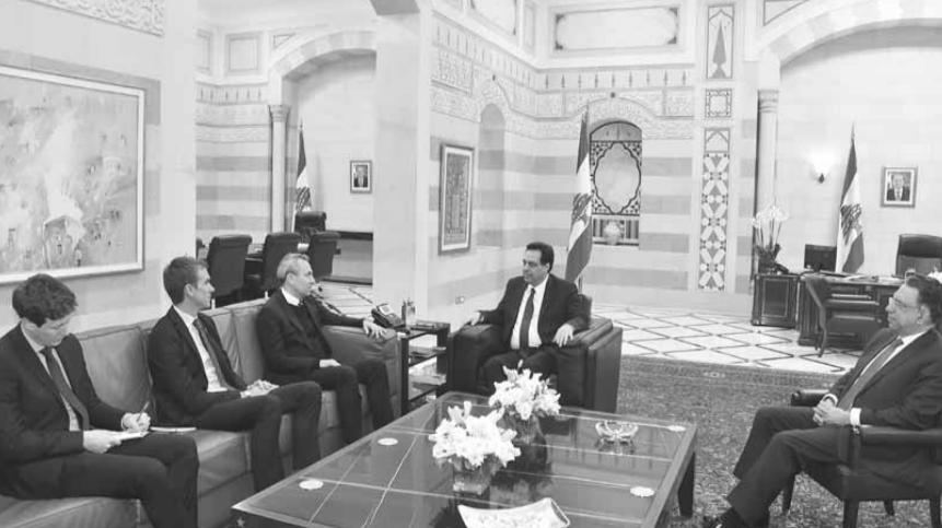
دايب مجتمعاً مع رامبلينغ بحضور قطار

أوضح المكتب الاعلامي لرئيس مجلس الوزراء حسان دياب ان «اللجنة الوزارية المكلفة صياغة البيان الوزاري ستعقد اجتماعها اليوم، عند العاشرة صباحا وحتى الحادية عشرة والنصف من قبل الظهر، على أن تتوقف اللجنة عن الاجتماع وقت صلاة الظهر، وستتابع اجتماعها اعتباراً من الواحدة والنصف بعد الظهر».