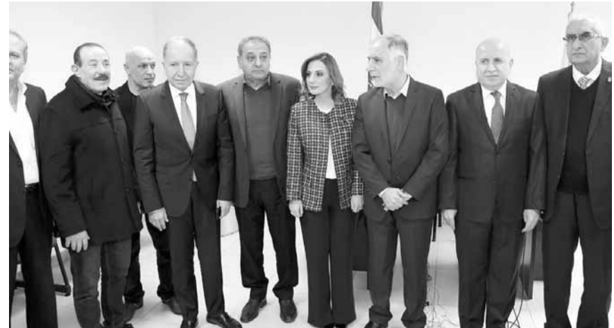
الوزيرة اوهانيان والوزير فنيش مع كبار الحضور