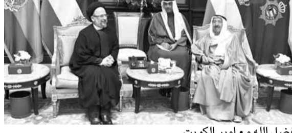
فضل الله مع امير الكويت

فقيهي والدكتور محمد حسن صادقي، حيث وضعه في أجواء عمل المؤسسة وخصوصاً في مجال حفظ تراث الشخصيات العلمية والأدبية وسيرهم. وأشدد فضل الله خلال اللقاء على «أهمية افتتاح العمل على عصرهم لتقديم الصورة الحضارية عن الإسلام التي تعالج مشكلات الإنسان وقضايا الحياة».