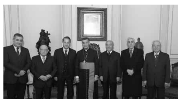
الراعي مع وفد الرابطة

«المواقف الوطنية التي اطلقها ولا يزال الراعي»، مشددين على «دوره في توحيد اللبنانيين وسط الظروف الصعبة التي يمر بها لبنان لما يمثله من هامة وطنية لا يهيمها إلا المصلحة اللبنانية العامة وخالص لبنان». ودانوا ما «تعرض له بيروت من اعمال شغب»، مؤكداً أنها «لكل اللبنانيين من دون استثناء، ومن يعنيه لبنان فعلاً لا يمكن ان يعيث الخراب والدمار في قلبه، فالإعتداء على البشر والحجر ليس باللمعة المقبولة ولا يمكنه ان يؤدي الا الى مزيد من التشنج والفوضى