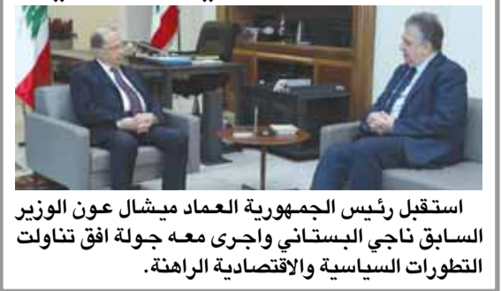
استقبل رئيس الجمهورية العماد ميشال عون الوزير السابق ناجي البستاني وأجرى معه جولة افق تناولت التطورات السياسية والاقتصادية الراهنة.

حسنا فعلت القوى الأمنية بمنع المشاغبين والمندسين من الوصول الى ساحات التظاهر السلمية، وهي تكون بذلك حافظت على الطابع الديموقراطي للبنان والذي يسمح به دستورنا بحق التظاهر السلمي دون التعرض للاملاك العامة ولحرية الآخرين بالتنقل وابداء الرأي بكل حضارة. لبنان يحتاج الآن الى الاستقرار كي تنهض الحكومة الجديدة بالاقتصاد الوطني وتعالج الازمة الحادة التي يعاني منها الوطن. «الديار»