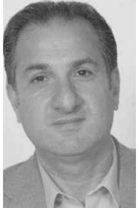
وزير الاتصالات طلال حواط