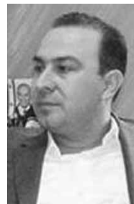
وزير الزراعة عباس مرتضى