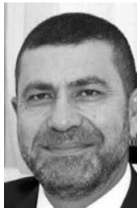
وزير الطاقة والمياه ريمون غجر