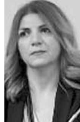
نائب الرئيس وحقيبة الدفاع زينانا عكر