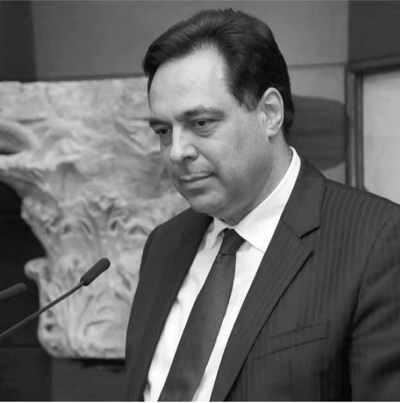
دياب يتلى البيان

لبنان والاعتراب، للنهوض بلبنان الوطن، لبنان الجريح، لبنان المهرق، لبنان المتنوع في حنيته، لبنان المبدع في استمراره، والمنصر الفائر على الظلم والفقر والفساد. لدينا القدرات، والكفاءات، والهمة، والإصرار، والالتزام الوطني، والعزيمة... لدينا الإمكانيات التي نستطيع استثمارها في ورشة الإنقاذ.