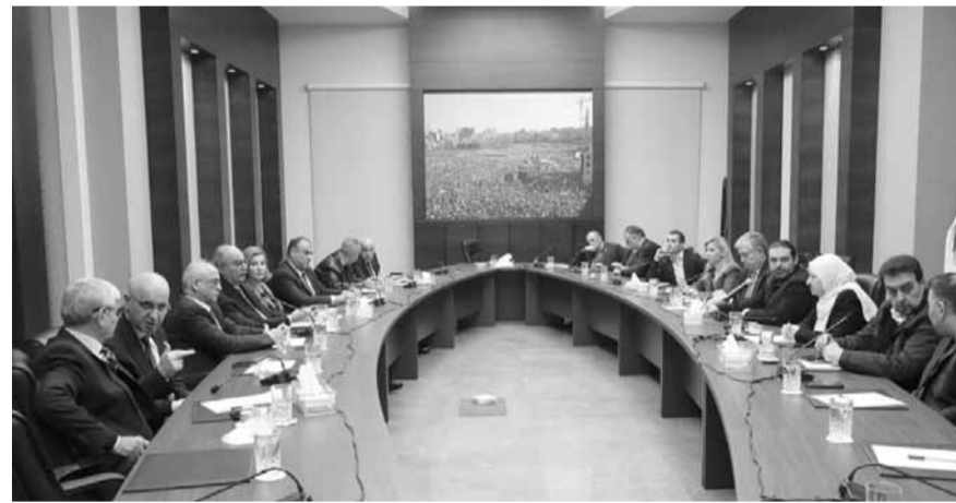
الحريري يترأس الاجتماع

تشريعية مقبلة للتصويت عليه لما لهذا الطرح من آثار ايجابية على الشارع الناظر والأمل بولادة لبنان جديد»، ورأى ان «أحزاب السلطة تستمر في لعبة المحاصصة التي تمتعها»، ودعا الى «استمرار الضغط بكل الوسائل السياسية والسلمية لبحار الى تشكيل حكومة كفوءة ومستقلة عن كل الأحزاب والسياسيين»، محذراً من «استمرار لعبة الألقعة المستعارة فالشمس شارقة واللبنانيون باتوا يدركون الالاعيب السلطوية الفاشلة