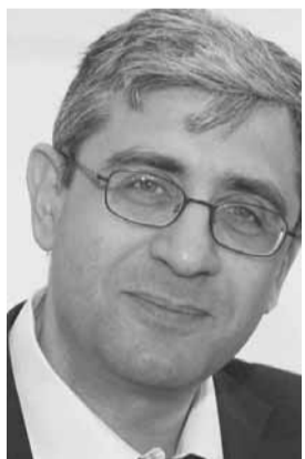
وزير الزراعة طارق المجذوب