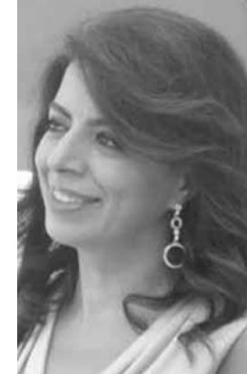
وزيرة المهجرين غادة شريم