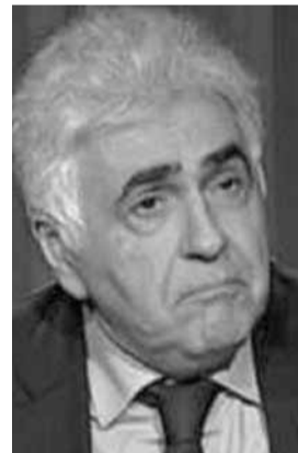
وزير الخارجية ناصيف حتي