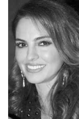
وزيرة التعليم منال عبد الصمد