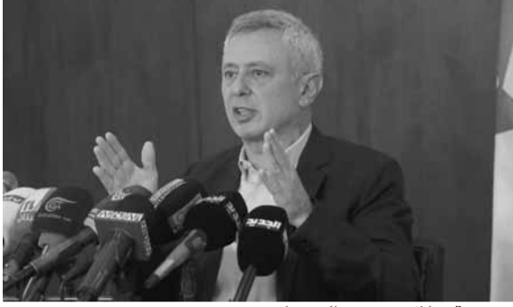
فرنجية خلال مؤتمره الصحافي

٢٠ وزيراً، عدم مشاركتنا يفسر بأنه تهرب من المسؤولية ومن الوقوف الى جانب الحلفاء. وأنا أقول أفق الى جانبيكم وأنا لا أبتر أحداً بل أحافظ على كرامتي، وأحافظ على كرامة الناس التي أمثلها لذلك يجب أن أرضي ضميري، وعندما أرضي ضميري أرضي الناس. في الوزارات قلنا وزارة درجة فالثلة ورابعة لا نريد، نحن طلبنا عمل بيئة ثقافة وليس دفاع أو نائب رئيس حكومة. إعملوا الحكومة ١٠ وزراء اذا أردتم، كل طلبنا كان أن نبقى خارجاً ونعطي الثقة»، مشدداً على «أنا لا نتهرب بل نقف الى جانب حلفائنا بكل الظروف ونحن نريد أن نكون الى جانب رئيس الجمهورية لأنه بحاجة الى حلفاء حقيقيين وليس الى ناس تكسر له مشروعه، بحاجة الى اصدقاء يقفون معه في المرحلة».