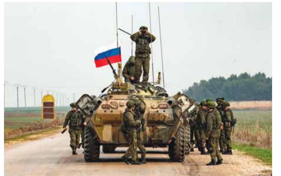
الجيش الروسي على اطراف ادلب

كشف وزير التركي مولود تشاوشو أوغلو، أن الرئيس التركي رجب طيب أردوغان، دعا نظيره الروسي فلاديمير بوتين إلى المساعدة في وقف زحف الجيش السوري على منطقة وقف التصعيد في ادلب. وأضاف أوغلو، أن الحوار بهذا الصدد تم بين الرئيسين على هامش المؤتمر الدولي حول ليبيا في برلين في ١٩ كانون الثاني، وأن أردوغان طالب بالتدخل «لوقف هجمات النظام» / السوري / على منطقة وقف التصعيد في ادلب. وأشار الوزير التركي إلى أردوغان أطلع الرئيس الروسي على بيانات إحصائية، وشرح مدى جدية الوضع في ادلب. وقال أوغلو، إن الرئيس التركي أبلغ نظيره الروسي «صراحة بأن الهجمات يجب أن تتوقف... لقد وجهنا للمجتمع الدولي نفس النداء». هذا وذكرت صحيفة «الوطن» أن مندوب سوريا الدائم في الأمم المتحدة بشار الجعفري، شارك بحفل خاص لتلبية لدعوة