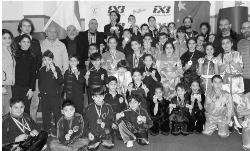
رئيس وأعضاء الاتحاد مع الفائزين والفائزات

شارك في المسابقة أكثر من ٨٠ لاعب ولعبة مثلوا النوادي التالية: آبا برج حمود، بل ايريزون ادما، الصدقة عنجر، الانطوني بعيدا، هومتتمن انطلياس، سكوبر فيت بعيدات، الشبيبة الشياح، زله، المركزية جونه و اللوزة ذوق مصبح، وجاء الترتيب العام النهائي كالآتي: