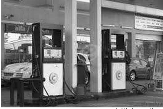
محطات تنتظر القرار