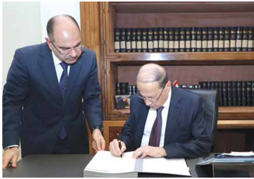
الرئيس عون يوقع مرسوم تشكيل الحكومة