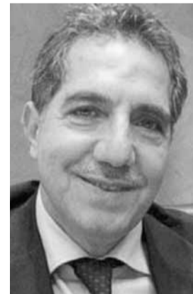
وزير المالية غازي وزنة