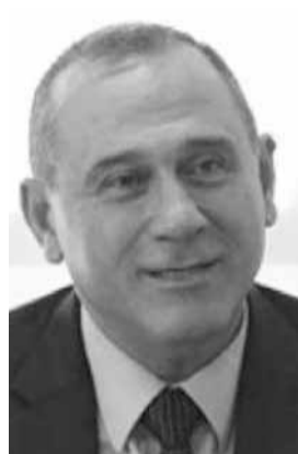
وزير الصناعة عماد حب الله