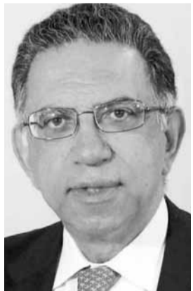
وزير البيئة وشؤون التنمية الإدارية دميانوس قطار