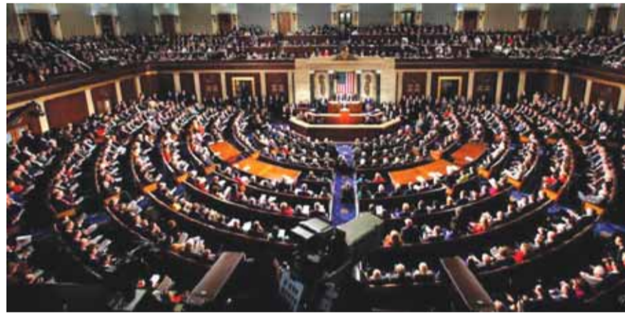
مجلس الشيوخ الاميركي

القواعد الاساسية التي تضع قيوداً صارمة على الشهود والأدلة للمرحلة الاولى والمضي قدماً في المحاكمة سريعاً، قائلاً إنه سيتمح أي محاولات ديمقراطية لتغيير قواعده. وقال ماكونيل: «الهيكل الاساسي الذي