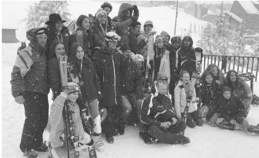
صورة تذكارية لكبار الحضور والفائزين والفائزات