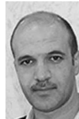
وزير الصحة حمد علي حسن