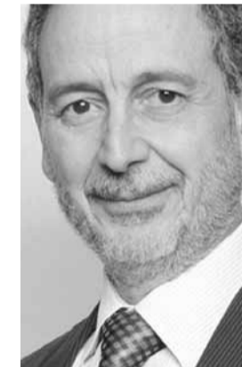
وزير الاقتصاد راوول نعمه