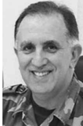
وزير الداخلية والبلديات اللواء محمد فهمي