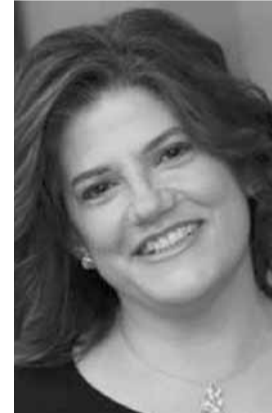
وزيرة العمل لميا طنوس يمين