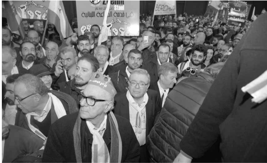
الجميل في مقدمة الحضور

الخارج. لتوضيح الامور أكثر، ان جل ما نطلبه هو السماح للصناعيين بتحويل أموالهم من المصارف الى الخارج لاستيراد مواد أولية صناعية بـ ٣ مليارات دولار في السنة التي توازي قيمة الصادرات اللبنانية، ما يعني ان القطاع الصناعي قد آمن حاجاته من العملات الاجنبية من الخارج واللازمة لاستيراد المواد الأولية دون المسه بالاحتياطات اللبنانية.