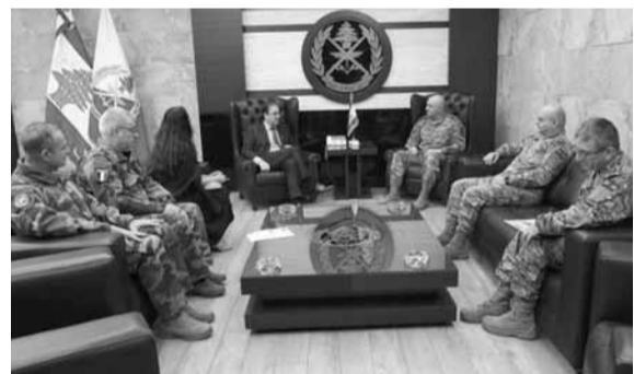
قائد الجيش مجتمعاً مع سفير كوريا

التقى قائد الجيش اللبناني العماد جوزاف عون في مكتبه في اليرزة، السفير الكوري في لبنان «Kwon Young - dae» يرافقه المحقق العسكري المقدم «Hyokeun Jee»، وجرى التداول في علاقات التعاون بين جيشي البلدين.