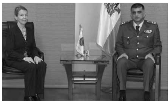
عثمان مجتمعاً مع هيلتون

المستشارة الأعلى في بعثة الامم المتحدة لمراقبة الهدنة في لبنان (UNTSO) جودي هيلتون، في زيارة جرى خلالها البحث في سبل تعزيز التنسيق القائم بين قوى الامن الداخلي والبعثة.