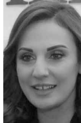
وزيرة العدل ماري كلود نجم