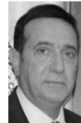
وزير الأشغال العامة والنقل ميشال نجار