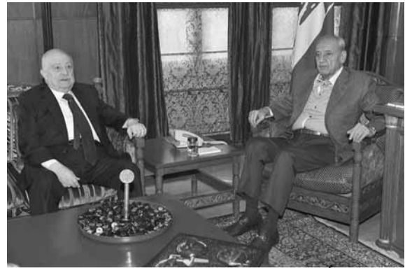
بري مجتمعاً مع منصور (حسن إبراهيم)

استقبل رئيس مجلس النواب نبيه بري في مقر الرئاسة الثانية في عين التينة النائب البير منصور حيث تم عرض للوضع المالي والاقتصادية والمستجدات السياسية. على صعيد آخر، أرحاً رئيس المجلس الجلسة النيابية التي كانت مقررة في الساعة الحادية عشرة من قبل ظهر يومي الأربعاء والخميس في ٢٢ و٢٣ من الشهر الحالي لمناقشة الموازنة العامة والموازنات الملحقة لعام ٢٠٢٠ إلى الساعة الحادية عشرة من قبل ظهر يومي الإثنين والثلاثاء في ٢٧ و٢٨ كانون الثاني عام ٢٠٢٠ ومساء اليومين المذكورين وذلك للموضوع نفسه.