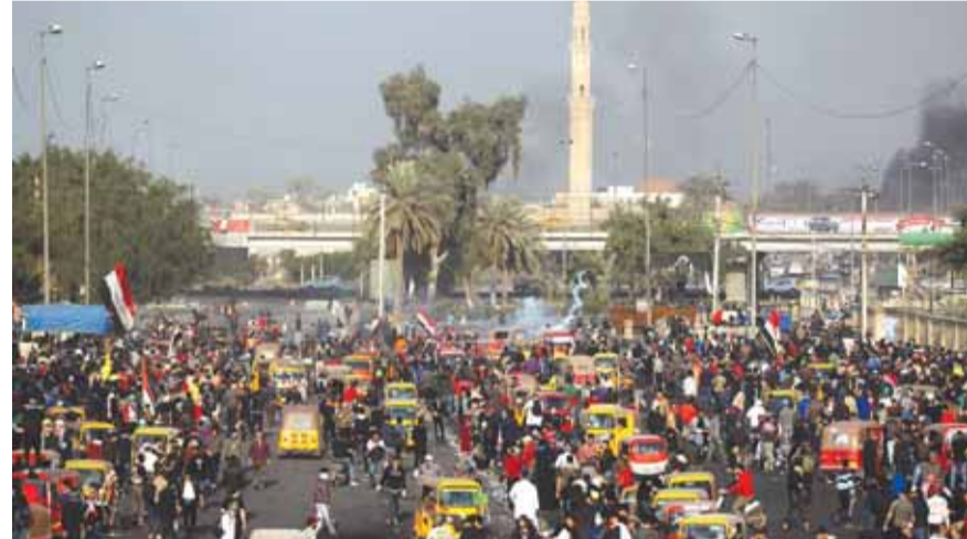
الاحتجاجات في العراق مستمرة

أعلنت قيادة عمليات بغداد، أمس، عما وصفته بـ«تطور خطير» داخل صفوف المتظاهرين، بعد إصابتهم بأسلحة كاتمة للصوت، وأكدت القيادة في بيان لها أمس، إصابة جندي من القوات الأمنية بأسلحة كاتمة للصوت من مندسين، بحسب وكالة الأنباء العراقية. وقالت في البيان: «لليوم