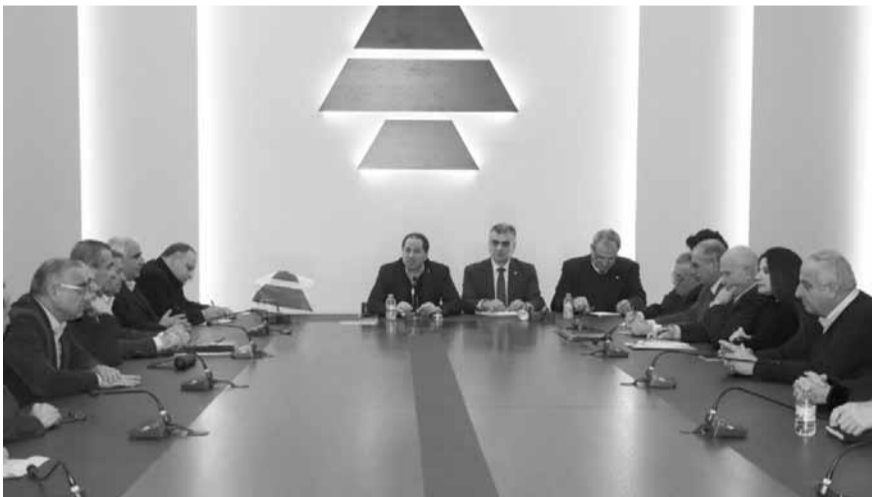
الجميل يترأس الاجتماع

وسيعملون على اسقاطها»، ورفض «اقدام السلطة على وضع القوى الأمنية في مواجهة المتظاهرين والسماح لبعض العناصر غير المنضبطة باستعمال الرصاص المطاط مصوباً الى الوجوه»، وأن «قدر شعور القوى الأمنية التي اجبرت على مواجهة ناسها»، اعتبر أنها «تماماً كما المتظاهرين ضحية هذه السلطة التي تستعملها كدروع بشرية لتنفيذ مآربها وتحتمي خلفها في مواجهة غضب الناس».