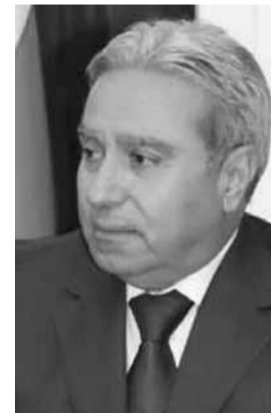
وزير السياحة والشؤون الاجتماعية: رمزي مشرفية