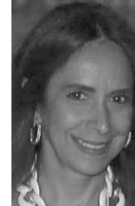
وزيرة الإعلام منال عبد الصمد