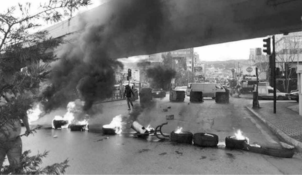
اشعال الاطارات في فرن الشباك