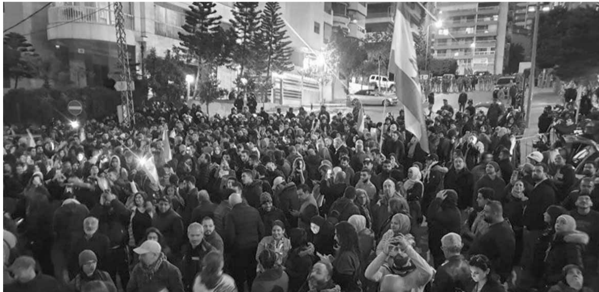
محتجون امام منزل الرئيس المكلف حسان دياب

حرج المواجهة الداخلية بين (حزب الله والحريري والسنة) على خلفية المواجهة الأميركية – الإيرانية – السعودية المستمرة.