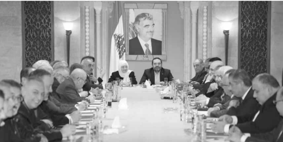
وصل رئيس حكومة تصريف الأعمال سعد الحريري إلى مطار الدولي آتياً من عمان بعدما قدم لسلطان عمان هيثم بن طارق بن تيمور، واجب التعزية بالسلطان قابوس بن سعيد، وعصرا ترأس الحريري في «بيت الوسط» اجتماعاً لكتلة «المستقبل»

الي ان رئيس حكومة تصريف الاعمال سعد الحريري لم ولن يتخلى عن مهمته في تصريف الاعمال.. وأشار الحريري في دردشة مع الصحافيين بعد اجتماع الكتلة الى ان «لتصريف الاعمال صلاحيات معينة ونحن نستخدم صلاحياتنا ضمن المعقول»، معتبراً ان هناك بعض الامور لا يمكن اقرارها في ظل حكومة تصريف الاعمال.. وتابع: «أقوم بعملية ونقطة على السطر وأنا مع تعويم حكومة جديدة وليس حكومة استقالت بعدما طلب منها الشارع ذلك»، مضيفاً: «يعرقلون ويتهموني بالعرقلة وبأنني أضع سداً سنياً طويلاً»، وشدد على أنه «يجب حلّ الأمور وفق الدستور وساتحدث مع رئيس مجلس النواب نبيه بري بخصوص جلسة الموازنة وسالتقيه بالناكيد».