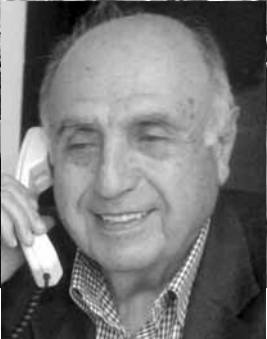
اعداد : لوران ناكوزي