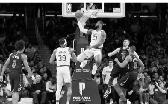
ليبرون جيمس من ليكرز في سلة استعراضية

وسجل لاعبو كافاليرز الخمسة الذين بدأوا اللقاء ١٠ نقاط، أو أكثر إذ أحرز كولين سيكستون ١٦ نقطة، وجارلاند (١٦)، وسيدي عثمان (١٥)، بالإضافة إلى لاف وطومسون. وسجل لافيلا دلفينا سيفنتي سيكسز، مسلسل التراجع بخسارته أمام إنديانا بيسرز (٩٥-١٠١)، لتكون الهزيمة السادسة للفريق في آخر ٨ مباريات خاضها بالمسابقة. وأصبح سيكسز مهدداً بفقدان المركز الثالث في جدول مجموعة الشرق، الذي يحتله خلف ميلواكي باكس وميامي هيت، بفارق نقطة واحد فقط أمام بوسطن سلتيكس الذي حقق الفوز على شيكاغو