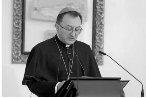
... والسفير البابوي

وقال السفير البابوي أن «الحوار مستحيل إذا لم نعتبر بعضنا البعض متساوين. هذا الحدس الأساسي يكمن في عمق مبادرة فخامتكم في إنشاء «أكاديمية اللقاء والحوار»، التي أقرتها الجمعية العامة للأمم المتحدة في ١٦ أيلول ٢٠١٩. نرجو فخامتكم قبول آصدق تهانينا، وأفضل تمنياتنا لتنفيذ سريع لهذا المشروع الخير في خدمة الأخوة الإنسانية في لبنان وفي العالم كله». ولفت إلى أن «المجتمع الدولي، المتمثل هنا برؤساء البعثات الدبلوماسية ومسؤولي المنظمات الدولية، لا زال يشدد على ضرورة حوار صادق قائم على الاحترام بين القادة السياسيين أنفسهم، كما بينهم وبين أولئك الذين يطالبون بالتغيير الحقيقي». وأمل «أن يؤدي الحوار إلى تشكيل سريع لحكومة يُكتب لها الحياة، لكي تقرر الإصلاحات الطارئة والضرورية وتوضع حين التنفيذ، ولكي تُستعاد الثقة لدى جميع اللبنانيين ولدى جميع أصدقاء لبنان».