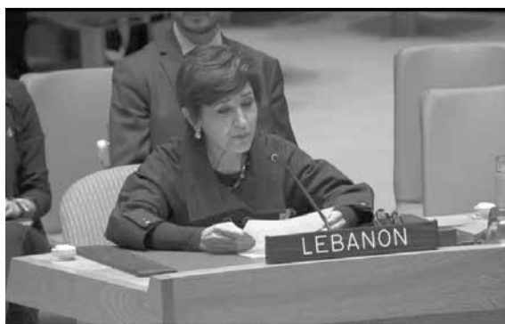
مدللي تلقي كلمتها في جلسة للأمم المتحدة

واعترفت، في خلال جلسة عقدت أمس بشأن شرعة الامم المتحدة حول صون الامن والسلم في مجلس الامن الدولي، أن «لبنان واقع في أزمة لكنه سينهض منها مثل طائر الفينيق».