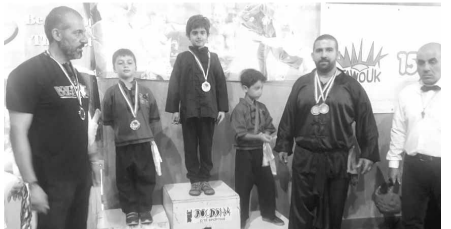
تتويج إحدى الفئات