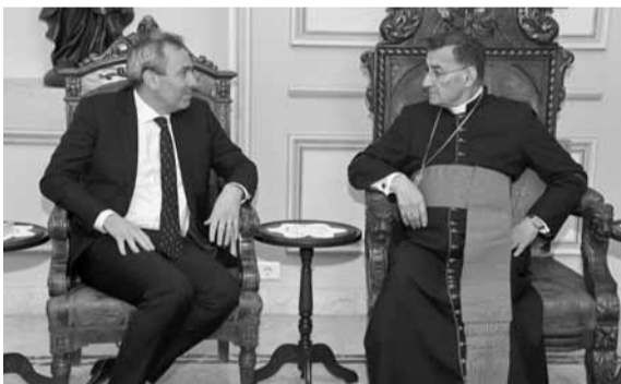
الراعي مجتمعاً مع رامبلنج

زار سفير بريطانيا في لبنان كريس رامبلنج البطريرك الماروني الكاردينال مار بشارة بطرس الراعي في الصرح البطريركي في بكركي وعرض معه التطورات. كما زار رامبلنج رئيس حزب «القوات اللبنانية» سمير جعجع في معراب وتباحثا في آخر التطورات على الصعيدين في المحلي والإقليمي.