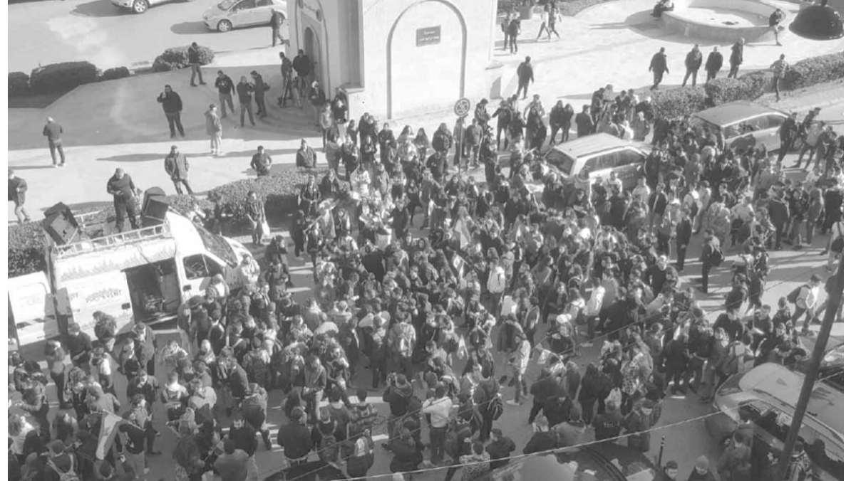
محتجون يقطعون ساحة الجديدة