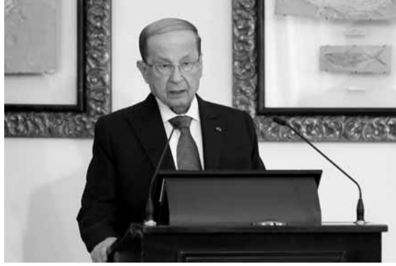
عون يلقي كلمته

من جهته، شدد عميد السلك الدبلوماسي السفير البابوي المونسنيور جوزف سببتييري، على أهمية الحوار وخصائصه التي تحترم الآخر ورأيه ولا تقصي أحداً من المعارضين أو الموالين أو غير الراغبين بأخذ أي طرف. وشدد على أن «آفة