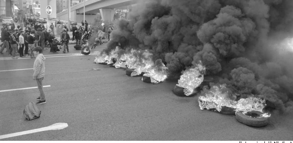
اشعال الاطارات في جل الديب

بـ«جمهور المقاومة»، وهو أمر حدث في بداية الحراك فقط، والسبب لا يمكن أن يكون الا شعور هذا الجمهور بخيبة أمل جراء فشل قيادته بالوصول الى حكومة تُنجز حلولاً، مع العلم أن إيمان جمهور هذا الفريق بقيادته كان مطلقاً. لم تتعاط قيادة فريق ٨ آذار، ولا التيار الوطني الحر بمسؤولية في هذه المرحلة، وبالتالي عليها بحسب المصادر التحرك بشكل فوري لتدارك هذا الوضع، مما يجعل هذا الفريق أمام ثلاثة خيارات هي: معالجة الخلافات القائمة بين أقطابه والذهاب الى تشكيل حكومة تحدد من الإزمات، أو الخروج من المشهد الحكومي وترك دياب بشكل حكومة تكنوقراط مع إعطاء الثقة بالمجلس النيابي ومراقبة عمله، أو مصارحة اللبنانيين بوجود تسوية جديدة يجري العمل عليها مع سعد الحريري أو غيره وتشكيل حكومة بأسرع وقت ممكن، مشيرة الى أن أي توجه آخر سيعني المزيد من الفشل مما سينعكس مزيداً من السلبية على صورة هذا الفريق بالسياسة والشارع، خصوصاً بظل «لامبالاة» الفريق الآخر.