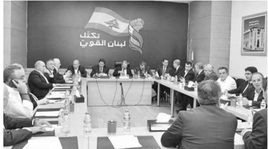
أعلن رئيس «التيار الوطني الحر» جبران باسيل، بعد اجتماع تكتل «لبنان القوي»، «أننا وجّهنا كتاباً إلى حاكم «مصرف لبنان» رياض سلامة حول التحويلات المالية، وما تشكّله من استنسابية في حقّ المواطنين، طالبناه فيه بالإفصاح عن الأرقام وأبدينا كلّ استعداد للتعاون». ورأى أنه «يجب وضع قواعد واضحة لاجراءات

النيابية تناول عرض الاوضاع العامة، لا سيما التطورات التي حصلت خلال غيابه في اجازة خاصة، وموقف التيار من التطورات الحكومية. بعد اجتماعها شددت الكتلة على ان «الحاجة ملحة لتأليف الحكومة ولا يصح العودة الى تصريف الاعمال الى ما لا نهاية». ورأت ان التخطي في موضوع تشكيل الحكومة يتحمل مسؤوليته رئيس الجمهورية ميشال عون، ورئيس الحكومة المكلف حسان دياب، والأولوية يجب أن تتركز على لالة الحكومة سريعاً والتوقف عن الدوران في حلقة المحاصصات الوزارية، وان العودة الى نعمة التجاذب تشكل ذروة الإنكار للمخاطر التي تواجه البلاد والهروب من المتغيرات التي فرضتها التحركات الشعبية، مشيرة