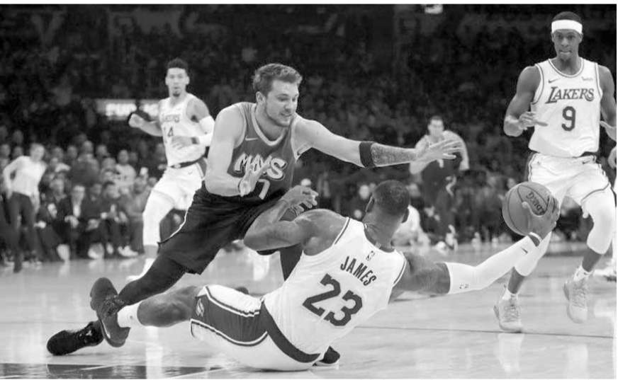
صراع بين ليبرون جيمس من ليكرز ولوكا دونسييتش من دالاس

وسجل بوسطن سيلتيكس ١٢ نقطة دون أي رد من منافسه في أواخر الربع الرابع، ليحقق الانتصار الثالث في أربع مباريات ويخزل مستضيفه نيويورك نيكس الهزيمة السادسة على التوالي بالفوز عليه ١١٣-١٠٤.