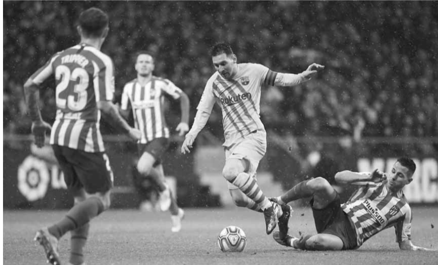
ميسي يتعرض للعرقة في لحظة من المباراة