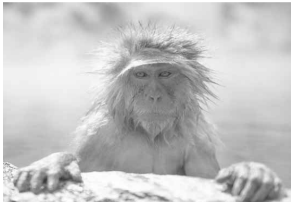
جميع أنحاء العالم خلال ٨٨ عامًا.

وأصيب معظم هؤلاء المرضى بعد تعرضهم للعض أو الخدش من قرد. وفي عام ١٩٩٧، توفيت باحثة جراء عدوى فيروس B، بعد تسرب سائل جسدي من قرد مصاب، في عينها مباشرة. ويقول مركز السيطرة على الأمراض «CDC» الأميركي، إن خطر العدوى البشرية منخفض للغاية، حتى لو تعرض الفرد للعض والخدش من قرد القرد البرية.