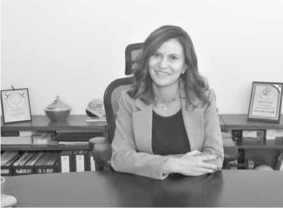
البستاني في مؤتمرها الصحافي

وأبدت هذه المصادر المؤيدة لاستيراد الدولة للنفط، تخوفها من «أن تنصاع الشركتان العنيتان اللتان تقدمتا للمناقصة، للضغوط وتنسحب بالتالي من المناقصة التي اتفق على