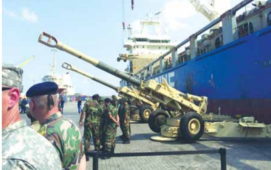
مدافع حربية يستلمها الجيش اللبناني من الولايات المتحدة الأميركية

الاتنين. جدير بالذكر أن البيت الأبيض لم يقدم أي تفسير لهذا التأخير على الرغم من التبريرات المتكررة من الكونغرس ووسائل الإعلام.