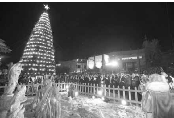
أضاءة شجرة الميلاد في جبيل

ترأس راعي ابرشية جبيل المارونية المطران ميشال عون، وبدعوة من بلدية جبيل، رتبة تبريك مغارة الميلاد، على نية السلام في لبنان، وأضاءة شجرة العيد، في الشارع الروماني وسط المدينة.