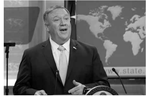
دعا وزير الخارجية الأميركي، مايك بومبيو، الدول الأوروبية للإنسحاب من الإتفاق مع إيران حول برنامجها النووي. وقال بومبيو في كلمة له بجامعة لويفيل، أمس: «دعوا (الأوروبيين)

للتخلي عنهم (الإيرانيين)، لأن هذا الأمر (البقاء ضمن الإتفاق) غير بناء..» وأضاف أن «الخبراء أخطأوا عندما اعتبروا أن العقوبات الأميركية الجديدة ضد إيران ستكون عقيمة إن لم تنسحب الدول الأوروبية من الإتفاق»، واصفا «فعله» العقوبات الأميركية على طهران بأنها «بذرة» الرئيس الأميركي، دونالد