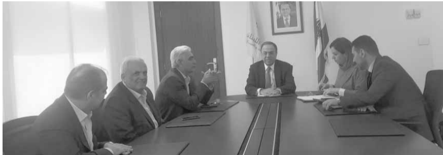
بطيش مع نقابة الافران

شكل سعر ربطة الخبز محور لقاءات وزير الاقتصاد والتجارة في حكومة تصريف الأعمال منصور بطيش، أمس، فالتقى على التوالي وفدا من تجمع أصحاب المطاحن ووفدا آخر من أصحاب الأفران.