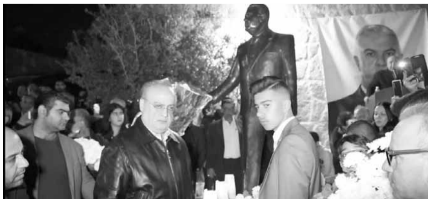
أكاليل من الزهر وإضاءة الشموع امام مجسم أبو ذياب ويدير وهاب ونجل الفقيد

من القممق ولن يعودوا إليه، ولنخرج من هذه التحالفات الفوقية». وناشد «الأقرقاء غير المتورطين في الفساد للتحالف جميعاً مع هذا الحراك الموجود ليس فقط في الشارع، بل في كل منزل، لأن ليس فقط من ينزل إلى الشارع يريد أن يسمع صوته، كل الناس كانت تتن، وتصرخ»، موضحاً أنه «عندمما بدأنا نحن انتفاضتنا، الفرق بيننا وبين