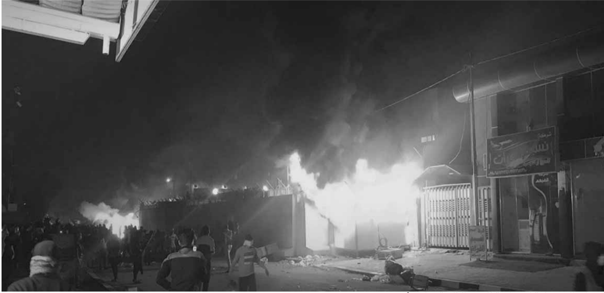
إحراق القنصلية الإيرانية للمرة الثانية خلال أسبوع

في أول حكم من نوعه منذ انطلاق الاحتجاجات الشعبية العارمة في البلاد قبل نحو شهرين، التي قتل فيها المئات، قضت محكمة عراقية امس، بإعدام ضابط عراقي، ويسجن آخر لمدة ٧ سنوات، لثبوت إدانتهما بقتل متظاهرين في محافظة واسط، خلال الاحتجاجات التي يشهدها العراق منذ مطلع تشرين الأول الماضي. وقال مصدر قضائي، لوكالة «سبوتنيك»، إن «محكمة استئناف واسط تحكم بالإعدام على ضابط وبالسجن ٧ سنوات على آخر بتهم قتل المتظاهرين في التظاهرات السلمية في محافظة واسط».