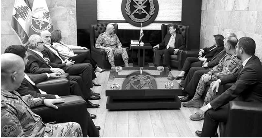
قائد الجيش مستقبلاً الوغد

وفد من مستوردي الأدوية والمعدات الطبية، استقبل قائد الجيش العماد جوزاف عون في مكتبه في اليرزة، نقيب أصحاب المستشفيات الخاصة سليمان هارون يرافقه القطاع في الوقت الراهن.