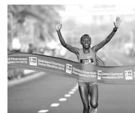
لقطة من أحد السباقات

بن محمد بن راشد آل مكتوم ولي عهد دبي. وقد قدمت الرابطة الدولية للماراثونات وسباقات المسافات الطويلة الـ «AIMS» جائزة أفضل عداة للماراثون ٢٠١٩ لكل من ديسيسا وشيبينغتشيش في نهاية العام مضيقين القاب بطولة العالم للماراثونات للسير الذاتية الملية بالإنجازات.