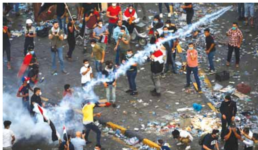
كر وفر بين المحتجين العراقيين وقوى مكافحة الشغب

العراقية انسحبت من ساحة الخلاني وجسر السنك، وسط استمرار إطلاق الغازات المسيلة للدموع. وقال المصدر، في حديث لـ «بغداد اليوم»، إن «المتظاهرين أجبروا قوات مكافحة الشغب على الانسحاب إلى وسط جسر السنك»، مشيراً إلى «استمرار إطلاق قنابل الغاز والصوت باتجاه ساحة الخلاني».