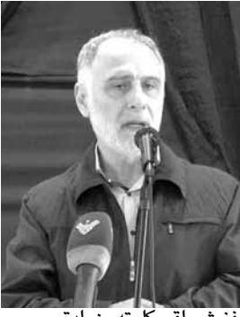
فنيش يلقي كلمته من بلدة معروب

من مطالب إصلاحية واقتصادية واجتماعية وادارية، هي مطالب حزب الله منذ سنوات، حزب الله هو صاحب هذه المطالب في مشروع السياسة وفي برنامجه الانتخابي، وفي برنامجه النيابي والوزاري، ان كان من خلال مشاركته بمجلس الوزراء، أو من خلال مشاريع واقتراحات القوانين في المجلس النيابي، أو من خلال الأداء اليومي».