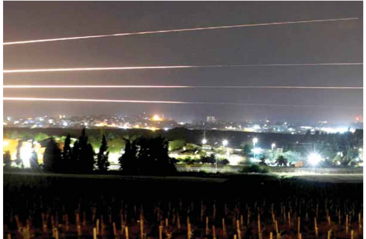
الصواريخ الفلسطينية مستهدفة المستوطنات الاسرائيلية

السبع، أكبر مدن جنوب إسرائيل والتي تبعد نحو ٣٥ كيلومترا عن حدود غزة محذرة من صواريخ قادمة. وقال الجيش إن الدفاعات المضادة للصواريخ اعترضت الصاروخين.