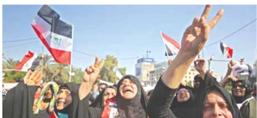
نساء عراقيات يتظاهرن في كربلاء

شهد محيط القنصلية الإيرانية في مدينة كربلاء جنوب بغداد مواجهات عنيفة بين متظاهرين حاولوا اقتحام القنصلية وقوات الأمن العراقية، نتج عنها وقوع ٣ قتلى وعدد من الجرحى وقالت مفوضية حقوق الإنسان العراقية امس في