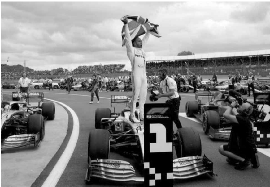
هاميلتون يحتفل فوق سيارته