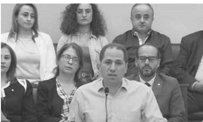
الجميل خلال المؤتمر الصحافي

لحكومة حيادية ووزراء اخصائيين يديرون البلد، ويقومون باصلاح وينظّمون انتخابات مبكرة لتغيير من خلال الأليات الدستورية». وقال: «نتوجّه الى كل الكتل والاحزاب للقول ان لبنان بحاجة الى حكومة حيادية وكفوءة وخذوا فرصة ٦ اشهر لترتاحوا وتقوموا بمراجعة وخوضوا انتخابات بعدها، كما مددتم بتمكّن ان تقصروا الولاية وتسّمحوا للناس بالتعبير»، مضيفاً «قدمنا القانون وجاء في المجلس النيابي، والمطلوب اقراره لاجراء انتخابات في ٦ اشهر وتكون بذلك أعدنا الكلمة الى المؤسسات وارجنا الناس».