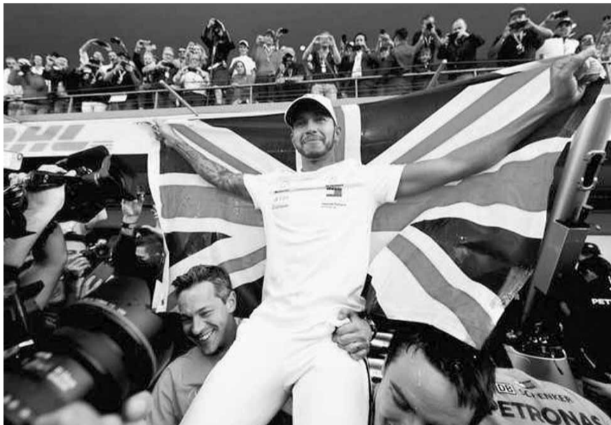
لويس هاميلتون على الكاتاف بعد تتويجه بطلاً للعالم

حيث اجاب حين سُئل إن كان الفوز في السباق قد خفف من وطأة خسارته للقب: «خلال هذه الجولة، الفوز كان الطريقة الوحيدة التي بوسعي من خلالها إبقاء آمالي في اللقب أو تأخيرها». وأكمل: «لقد قمتُ بعملي. وذلك شعور جيد. لكن لويس قدم أداءً قويا كما يفعل على الدوام». وتابع: «تخامرنى مشاعر مختلطة في الحقيقة، بالنظر إليه كسباق قدمت أداءً قويا. لكن من جهة أخرى، أن أكون أفضل البقية (خلف هاميلتون) ليس شعوراً رائعاً». وأردف: «عليك النظر إلى النواحي الإيجابية كذلك. إنه أفضل موسم لي في الفورمولا واحد حتى الآن، وذلك أمر جيد». واسترسل: «بالنظر إلى النواحي الإيجابية الأخرى، لقد تحسنت بشكل هائل في نواحٍ عدة فيما يتعلق بوتيرة السباق». واستكمل: «لكن الفوز بالسباق بهذه الطريقة... لويس، أنا واثق أنه أزد حسم للقب بفوز في السباق هنا». وأضاف: «نجحتُ بإيقاف ذلك، وذلك يبعثُ في شعوراً جيداً». ويمتلك بوتاس عدداً أكبر من هاميلتون لناحية أقطاب الانطلاق من المركز الأول في ٢٠١٩ بواقع خمسة إلى أربعة، كما أنه قريب منه في عدد منصات التتويج مع ١٥ مقابل ١٦ لبطل العالم.