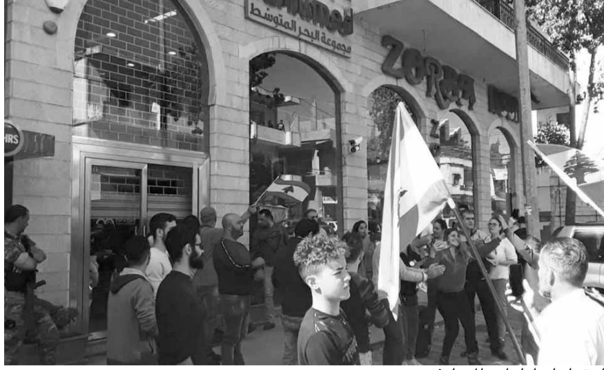
احتجاجات أمام أحد المصارف

وفي حين حافظ سعر صرف الليرة في مقابل الدولار الأميركي على سعره الرسمي في المصارف، تراوح في السوق الموازية ما بين ١٥٥٠ و ١٦٥٠ ليرة، بتسجيل انخفاض ولو طفيف عما كان عليه في الفترة السابقة. وكشف مصدر مصرفي عن اتجاه إلى «تجنب إقبال المصارف عند حصول تطورات ميدانية بفعل الانقفاضة الشعبية، حيث في حال تفاقم الوضع لا تسمح الله، سيتم اللجوء إلى إقبال المصارف التي تشهد أماكن وجودها توترات واحتجاجات صاخبة، وضم الموظفين العاملين فيها إلى الفروع التي في منأى عن تطورات الشارع»، موضحاً أن «اعتماد هذا الخيار يصب في مصلحة تيسير شؤون اللبنانيين خصوصاً ومصحة البلاد واقتصادها عموماً».