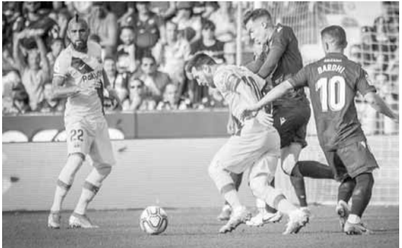
من مباراة ليغانتو وبرشلونة وبدا ميسي يحاول التخلص من مدافعين

وأصبح مصير مدرب مانشستر يونايتد، النروجي أولي غونار سولسكاير محل شك، وربما تتم إقالته قريباً في ظل النتائج السلبية.