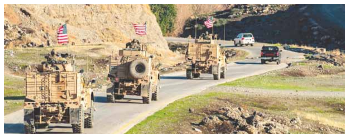
قوات اميركية في سوريا