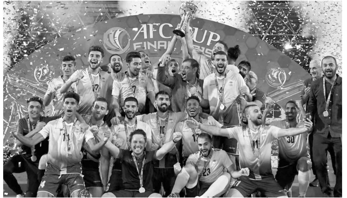
فريق العهد مع كأس الاتحاد الآسيوي