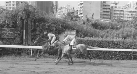
جوكر (اسمر) ضارباً رفيقه سام (بدر) بفارق نصف طول