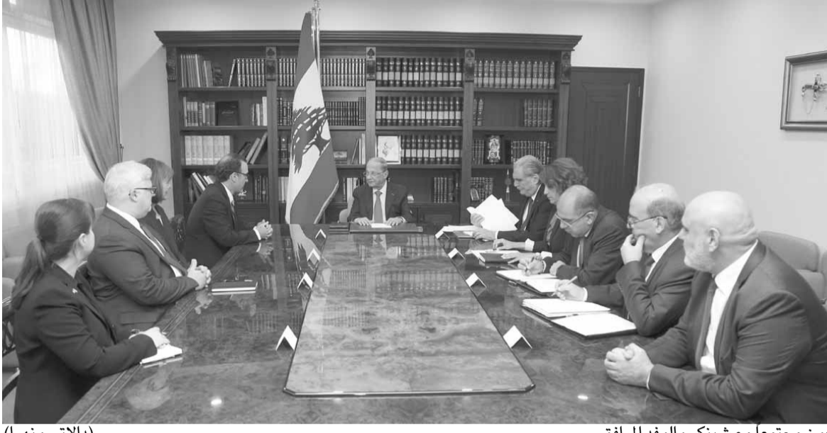
عون مجتمعاً مع شينكر والموفد المرافق (الدايتي ونهرا)

وتساءلت الأوساط في الوقت نفسه، عما سيكون عليه أداء شينكر بعد أن يبدأ مفاوضاته غير المباشرة من خلال زيارة تل أبيب سيما وأن جولته الحالية هي دول المنطقة لم تشملها، ما يعني بأنه سيقوم بزيارة إليها في وقت لاحق للإطلاع على موقفها من المفاوضات غير المباشرة التي بدأها ساترفيلد. وأكدت الأوساط، بأن لقاءات الموفد الأميركي مع عدد كبير من المسؤولين اللبنانيين من مختلف التيارات والإنتهاعات عكست إيجابية لدى هؤلاء بأنه قد يتمكن من استئناف المفاوضات قريباً وتتوصل الى حلول للخلافات القائمة بين لبنان والعدو الإسرائيلي حول تلازم مساري الترسيم أو عدمه، وحول تحديد فترة معينة لإنهاء المفاوضات أو عدمه وغير ذلك. وإذ يسعى شينكر خلال جولته الإقليمية الحالية على بعض