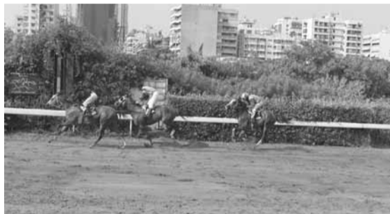
صخر فائزاً ومطارداً من (ممونك) وعفيف