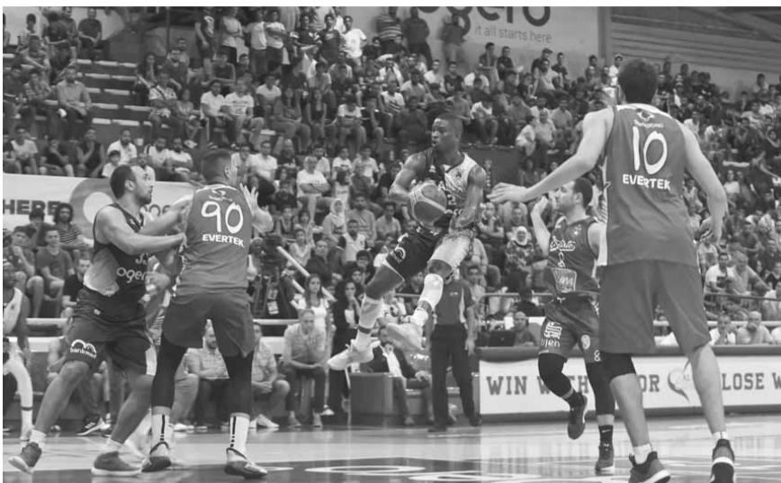
من المباراة الافتتاحية بين الرياضي والنجم الساحلي

برعاية رئيس مجلس الوزراء سعد الحريري ممثلاً برئيسة كتلة المستقبل النيابية النائب بهية الحريري افتتحت «دورة حسام الدين الحريري الدولية التاسعة والعشرين بكرة السلة» التي ينظمها نادي الفساد الرياضي - صيدا تحت اشراف الاتحاد اللبناني لكرة السلة من ١٠ الى ١٧ أيلول ٢٠١٩ في قاعة صائب سلام بالنادي الرياضي في المنارة وبدعم من الراعين الرسميين - بنك ميد وشركة الفت، وأسفرت المباراة الافتتاحية عن فوز الرياضي حامل اللقب على