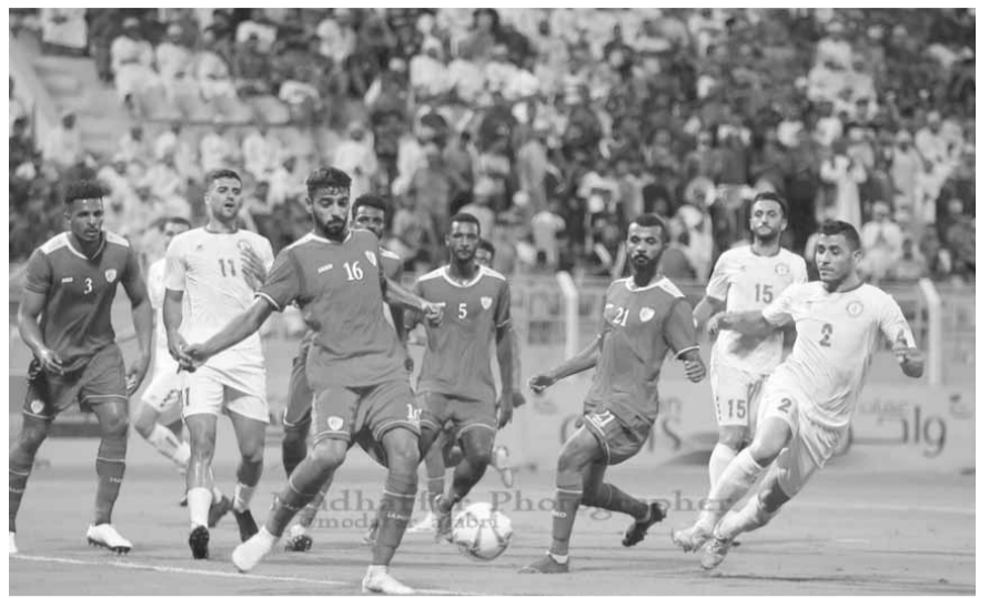
من مباراة لبنان و عمان