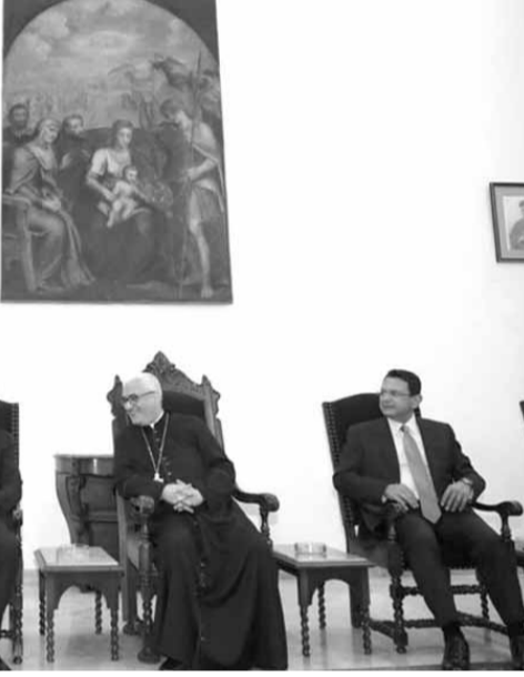
عيد الساتر مجتمعاً مع فرنجية والخازن

وعن ملف التعيينات، قال: «بالمبدأ اذا كان هناك شيء يرضينا فلن نعترض انما نعرف كيف يطرح هذا الامر عند الآخرين، والهدف منه اسكات سليمان فرنجية وهذا لا نقبل به، نحن لا نريد شيئاً ولاي مركز، ونحن نذكر ان هذا العهد ليس عهدنا، ونعرف ان هذه التعيينات يستأثر فيها فريق معين، واذا لم تكن شركاء اساسيين فيها لن نقبل، ولكن بالمقابل نحن في وزارة الاشغال لدينا ٥ ٦٠ مراكز في الإدارات، وكما هي السياسة في الدولة؟ كل واحد يباخذ حصته وان وزير الاشغال ينتمي الى تيار المردة لن يقدم