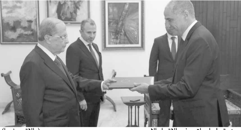
عون يتسلم أوراق سفير الاتحاد الأوروبي (الاتي ونهرا)

تسلم رئيس الجمهورية العماد ميشال عون قبل ظهر امس في قصر بعبداء، أوراق اعتماد سبعة سفراء معتمدين في لبنان، يشكلون دفعة جديدة من رؤساء البعثات الدبلوماسية الذين يقدمون أوراق اعتمادهم الى رئيس الجمهورية. وتضمنت هذه الدفعة، سفراء جمهورية كولومبيا فرناندو ايلو يامهور «Fernando Helo YAMHURE» جمهورية قبرص بنايوتيس كرياكو Panayiotis KYRIACOU مملكة النروج ليني ستانست «Lene STENS» جمهورية سرى لاتكا ETH «جمهورية سرى لاتكا الديموقراطية الاشتراكية دييتيكا بريادارشاني كاليانثيراتني ويكراماشي كارونارنتي Deepthika» جمهورية كورنارنتي Priyadarshani Calyanerante Wickramarante rachchi KARUNARANTE والاتحاد الأوروبي والـ جوزف طراف Ralph-Joseph TARRAF جمهورية فييتنام الاشتراكية تران ثان كونغ «Tran Thanh CONG» وجمهورية التشاد الامين الدودو عبدالله الخاطري. وحضر تقديم أوراق الاعتماد وزير الخارجية والمغتربين جبران باسيل، الامين العام لوزارة الخارجية السفير هاني شميطلي، المدير العام للمراسم