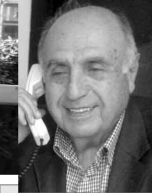
اعداد : لوران ناكوزي