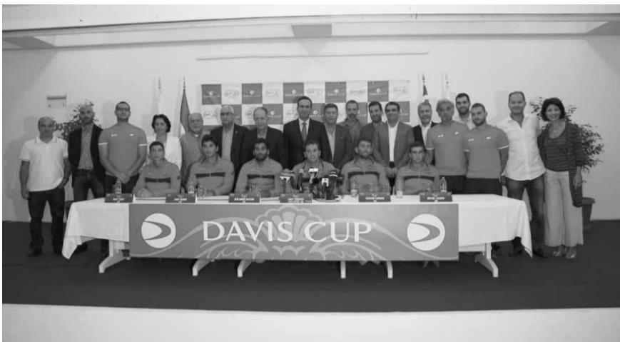
كبار الحضور مع الفريق اللبناني