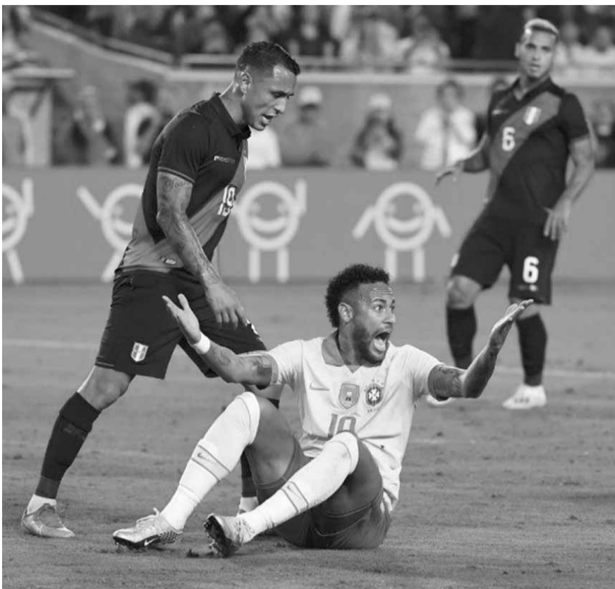
نيمار يعترض امام انظار لاعب بيروفي

كاسحا على نظيره المكسيكي ٤-صفر في سان أنتونيو (تكتساس) بفصل ثلاثية مهاجم إنتر ميلان الإيطالي لوتارو مارتينيز.