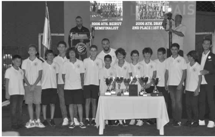
تكريم احد فرق النادي