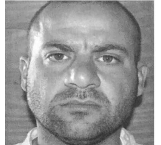
زعيم الراهبيين الجديد