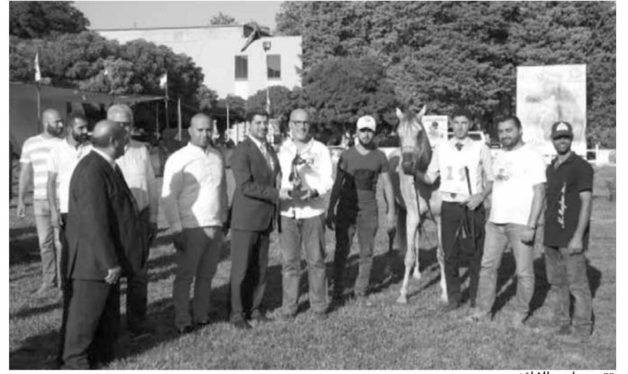
تتويج أحد الفائزين