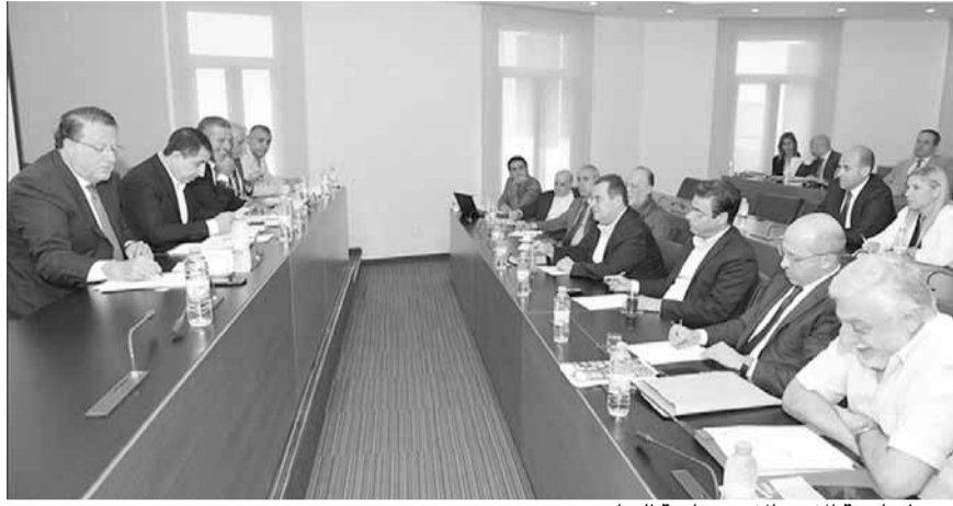
اجتماع لجنة الاتصالات برئاسة الحاج حسن

عقدت لجنة الإعلام والاتصالات جلسة عند الساعة الثانية عشرة من ظهر امس، برئاسة رئيس اللجنة الدكتور حسين الحاج حسن، وتم تعيين النائب هاني قببسي مقرراً عن اللجنة بسبب غياب المقرر الاساسي. كما حضر الجلسة: وزير الاتصالات محمد شقير، رئيس ديوان المحاسبة القاضي احمد حصران، رئيس هيئة المالكين في وزارة الاتصالات ناجي عبود، الإن باسيل عن هيئة المالكين في وزارة الاتصالات. اثر الجلسة قال الحاج حسن: «جرى اليوم، نقاش حول موضوع مبنى «تاتش» والذي استأجرته السنة الماضية اجري عليه في الفترة الاخيرة الوزير شقير عقد شراء، اليوم اجرينا نقاشا استمر بحدود الساعتين».