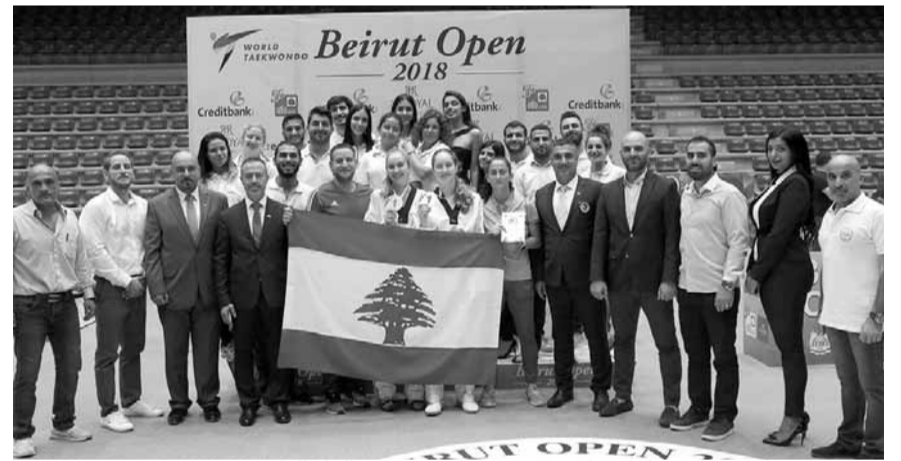
رئيس واعضاء الاتحاد وديوار خلال تتويج لاعبات في دورة العام الفائت

ثم جرت عملية تكريم الفرق الرياضية لختلف الفئات العمرية التابعة للنادي والتي احرزت كؤوس خلال بطولة لبنان للفئات العمرية