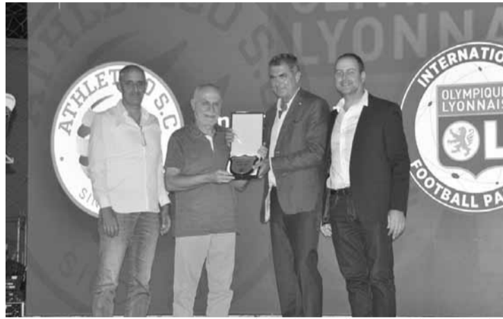
جائزة افضل اكاديمي من الشحف الى باولي ومتي

القدم جاء فيها، لقد كلفني امين عام الاتحاد جهد الشحف القاء الكلمة. بداية اود ان اشكر نادي اتلتيكو على دعوته. ولقد وضع الاتحاد استراتيجيه ورؤيا طويلة الأمد عبر اقامة بطولة الأكاديميات والتدريب والتطوير للفئات العمرية. هناك ٣٢ أكاديمية تشارك في بطولات لبنان والحبل على الجرار ولقد وعدنا ووفينا. ما حققه نادي اتلتيكو انجاز كبير واستحق جائزة افضل أكاديمية للبراعم الى جانب الروح الرياضية التي يتمتع بها لاعبوه بفضل ادارة النادي والأهالي..