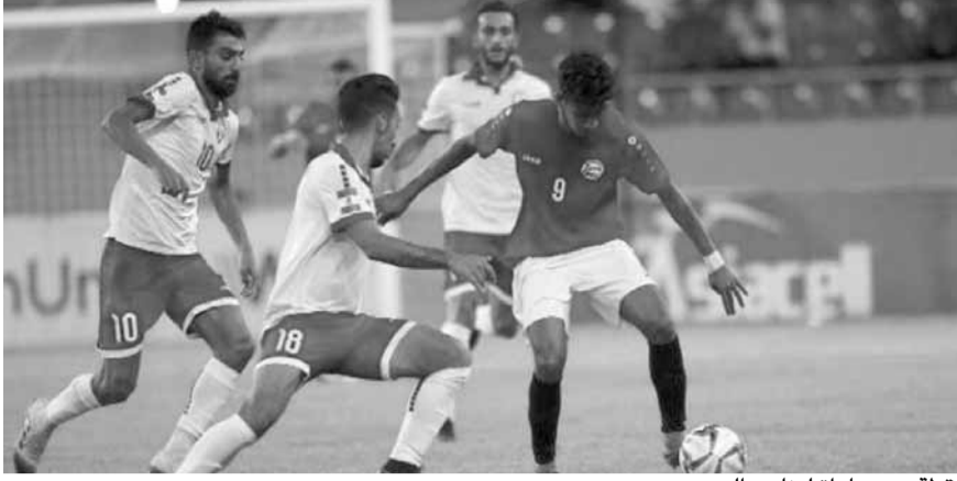
لقطة من مباراة لبنان واليمن

ولم تفلح تبديلات ليفيو تشويبوتاريو الهجومية بتنشيط الجبهة الهجومية للبنان في ظل صلابه دفاعية للمنتخب اليمني.