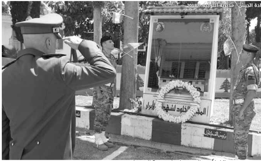
بو حيدر يضع اكليلاً من الزهر على اضرحة الشهداء

برعاية قائد الجيش العماد جوزاف عون، أقيم ظهر امس في ثكنة بيجت غانم - الشمال حفل تكريمي لعائلات شهداء لواء المشاة الثاني عشر والذين استشهدوا في مدينة طرابلس، حضره العميد الركن فادي بو حيدر ممثلاً العماد قائد الجيش، بالإضافة إلى عدد من كبار الضباط وعائلات الشهداء.