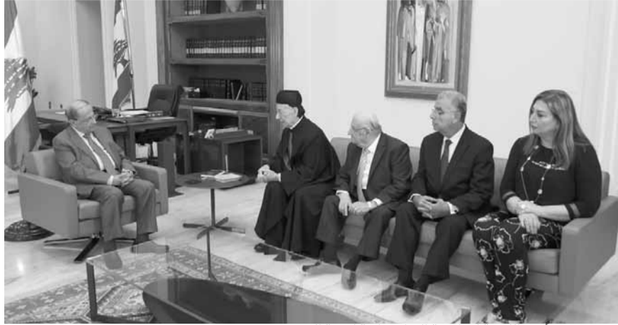
عون مجتمعاً مع اللجنة المركزية البطيركية لسنة الحويك

عرض رئيس الجمهورية العماد ميشال عون مع وزير الدفاع الوطني الياس بو صعب خلال استقباله له قبل ظهر أمس في قصر بعبدا، الأوضاع الأمنية في البلاد واوضاع مؤسسات وزارة الدفاع وحاجاتها. واستقبل الرئيس عون النائب ماريو عون، وأجرى معه جولة أفق تناولت شؤون الساعة في ضوء التطورات الأخيرة. كما تطرق البحث الى حاجات منطقة الشوف الإنمائية، والتحضيرات الجارية