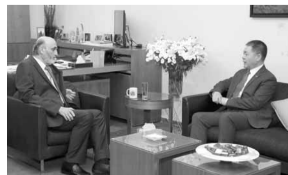
جعجع مجتمعاً مع سفير الصين

وحيثيات وبراهين كثيرة ومتنوعة عن مئات من اللبنانيين كانوا في فترة من الفترات معتقلين في السجون السورية إن «القوات»، وهو حزب مقاوم مختلف أنواع السيطرة الخارجية على لبنان إذ يتشرف بأن يعرض على سعادتكم قضية المعتقلين والمفقودين اللبنانيين في السجون السورية، يطالب الأمم المتحدة بالتدخل الملح من أجل كشف مصير المئات منهم بعد سنوات طويلة من الإخفاء القسري، وختتم «وعليه، نضع أنفسنا وكل الإمكانيات المتوفرة لدى «القوات» ووزرائه ونوابه في تصرفكم للمساهمة في تسهيل حصولكم على الأدلة المتوفرة لدى أهالي المغفودين والجمعيات التي تابعت هذا الملف، وللضغط على القوى المعنية المحلية والعربية والدولية كي يتم إدراج هذا الملف كجزء من مهامكم وجهودكم التي تلقى لدينا كل التقدير، آملي أن تكمل مساعيكم بالنجاح في وقف هذه الجريمة المتنامية واقفال جرح ينزف منذ أكثر من أربعة عقود».