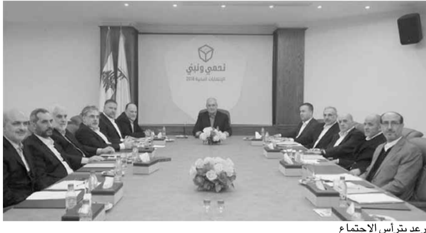
رعد يترأس الاجتماع

ثم التقى سفيرة الولايات المتحدة الأميركية في لبنان إليزابيث ريتشارد مع وفد من لجنة النواب المعنية بالإشراف على أجهزة المخابرات الأميركية، وجرى البحث في التطورات المحلية والإقليمية والتعاون القائم بين الأمن العام والأجهزة الأميركية.