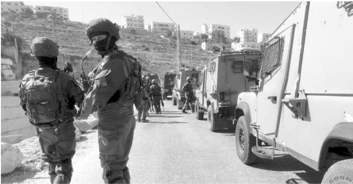
قوات الاحتلال خلال عمليات الدهم

الأممية ضرورة إنسانية ملحة»، يأتي ذلك بعد صدور تقرير سري عن مكتب الأخلاقيات التابع للأمم المتحدة يفيد بأن أعضاء الإدارة العليا للوكالة «أساؤوا استغلال سلطتهم وسط ممارسات تشمل المحسوبية والتمييز وسوء السلوك الجنسي».