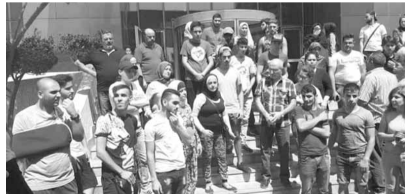
خلال الاعتصام أمام «التربية»

وأوضح أن «الوزارة تتيح أمام المرشحين الإجماع بالمعنيين ابتداء من صباح اليوم وبحسب ارقام المرشحين التسلسلية، وذلك لمدة يومين، فكل السجلات الورقية والرقمية متاحة للاطلاع عليها والتأكد من شفافية العمل وصحة العلامات والنتائج بالتفصيل، وهي موثقة، فعلى الرغم من أن النتائج بحسب القانون تبقى نتائج أولية وغير نهائية قبل صدور الشهادة الورقية الموقعة، إننا نشعر بمرارة الأهل ومرارة المرشحين ونحترم شعورهم، وإن سجلات الوزارة مفتوحة أمام أي مرشح معني بهذه القضية».