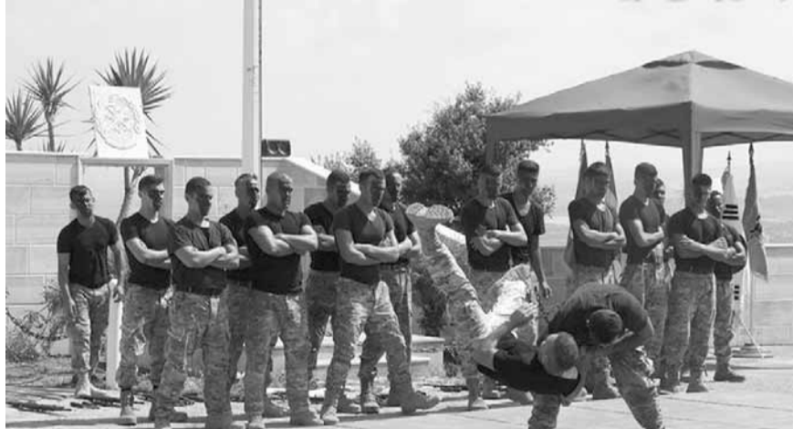
خلال العرض القتالي

وفي الختام قدم عناصر من الكتيبة الكورية عرضاً قتالية بمشاركة عناصر من لواء المشاة الخامس.