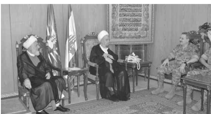
قربان مع اللواء الركن أمين العرم

لتيمان حقيقة الاديان التي جاءت لخدمة الانسان وهدايته وإرشاده الى الصلح، بعيدا عن التعصب والعنف»، مضيفاً أن «ترسيخ العيش المشترك في لبنان يستحق من اللبنانيين بذل الجهد لتحسينه وتعزيزه بالتعاون والتواصل والتشاور لتحقيق مصلحة الوطن والمواطن».