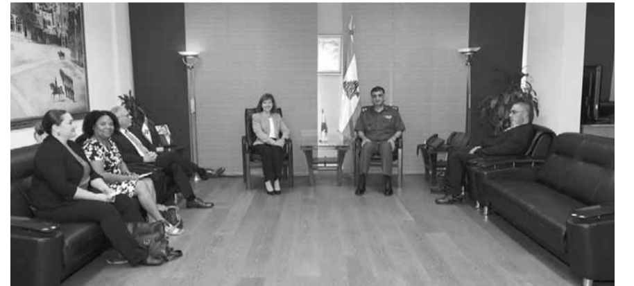
مع الوفد برفقة ريتشارد

استقبل المدير العام لقوى الأمن الداخلي اللواء عماد عثمان قبل ظهر امس ٢٠١٨/٨/٨ في مكتبه بتكنة المقر العام، السفارة الأميركية في لبنان إلبزابيث ريتشارد، برفاقها وفد من كبار