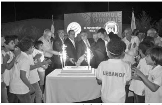
كبار الحضور يقطعون قالب الحلوى

وفي الختام قطع كبار الحضور قبال حلوى بالمناسبة وسط أجواء احتفالية.