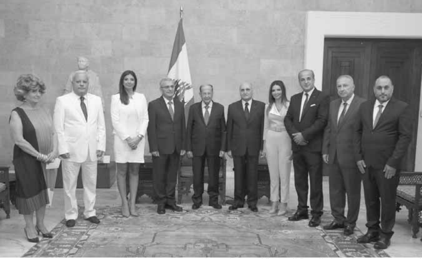
الرئيس عون مع أعضاء الهيئة الوطنية لحقوق الانسان

في تراثها بمقدار ما هي وافية لكل لبنان..