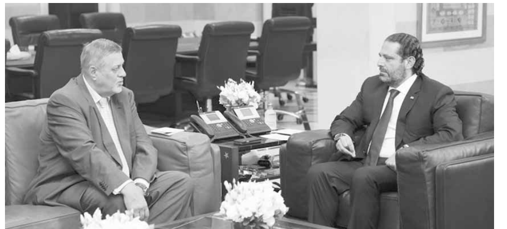
العماد عون مع الوفد الاسباني استقبل رئيس مجلس الوزراء سعد الحريري عصر امس في السراي الحكومي، المنسق الخاص