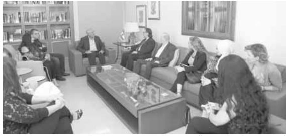
الرئيس سليمان مع الوفد

شدد الرئيس العماد ميشال سليمان على «أهمية المجاهرة بضرورة تغليب سيادة لبنان على ما عداها من سياسات عامة أو خاصة، لأن سيادة الدولة هي المدخل الوحيد لاستعادة ثقة الداخل والخارج، وتحسين ظروف الدورة الاقتصادية وانعكاسها الإيجابي على النمو المنخفض إلى أدنى مستوياته، بسبب إظهار لبنان وكأنه «هانوي».