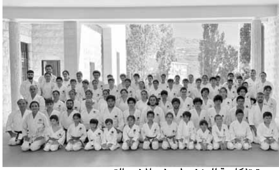
صورة تذكارية للمنخرطين في المخيم التدريبي

وحسب النظام الجديد المتبع في الإتحاد الدولي للرماية يتأهل في التصفيات المؤلفة من ثلاث جولات الرماة الستة الذين أحرزوا أعلى مجموع أهداف من أصل ٧٥ طيق ومن ثم يدخلون الجولة النصف نهائية يرمي كل من الرماة طلقة واحدة على ٢٥ طيق. بعدها تجري المرحلة النهائية لأحرز المركز الأول والثاني والثالث، إذ تضاف على النتيجة المحققة في المرحلة النصف نهائية نتيجة