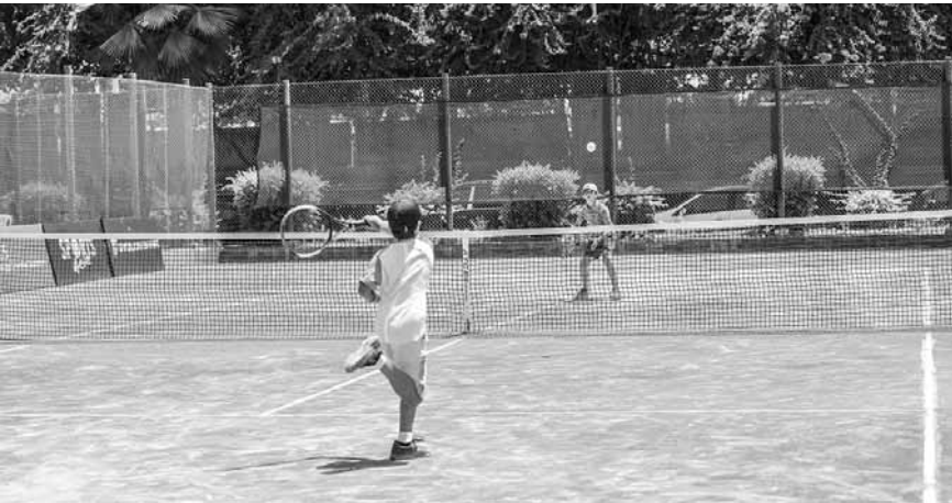
لقطة من إحدى مباريات أمس