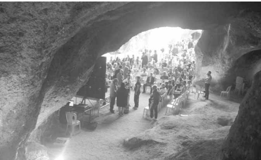
رحلة استكشافية في «مغر الطحين»

بعلبك الغنية بأثارها تضع «مغر الطحين» بعهدتها مديرية الآثار وبلدية بعلبك، في مدينة تروي حكايا الماضي وتاريخ بناء قلعة بعلبك الأثرية.