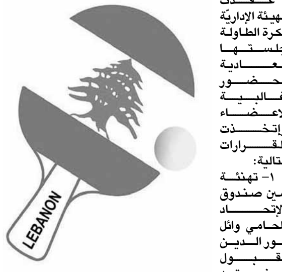
شعار الاتحاد اللبناني لكرة الطاولة