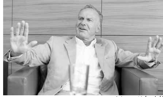
كارل هاينز رومينغه

رومينيغه: «نحن حريصون على منح المدرب فرصة للاستمرار لفترة كافية، وأتمنى له موسماً ناجحاً كما حدث في الموسم المنصرم، بحصد الثنائية المحلية، إلى جانب النجاح على مستوى دوري الأبطال».