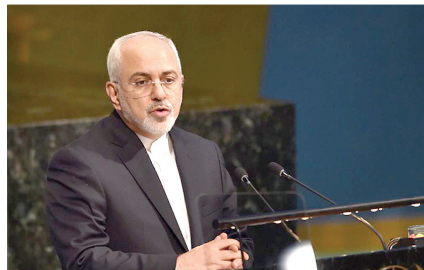
وزير الخارجية الإيراني محمد جواد ظريف في مقر البعثة الإيرانية بالأمم المتحدة

اعتبر الرئيس الأميركي، دونالد ترامب، أنه تم إحراز تقدم كبير في إطار قضية إيران، مشيراً إلى أن الولايات المتحدة لا تسعى إلى تغيير النظام في الجمهورية الإسلامية.