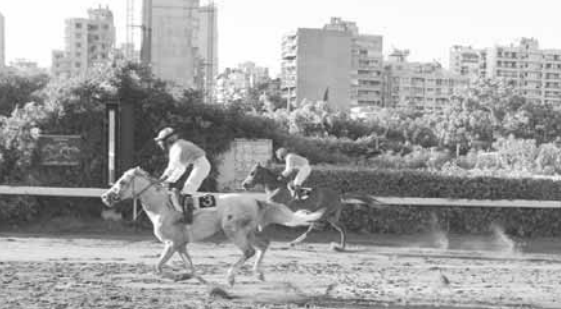
المريخ غرلي فائزاً على مياسة عدنان