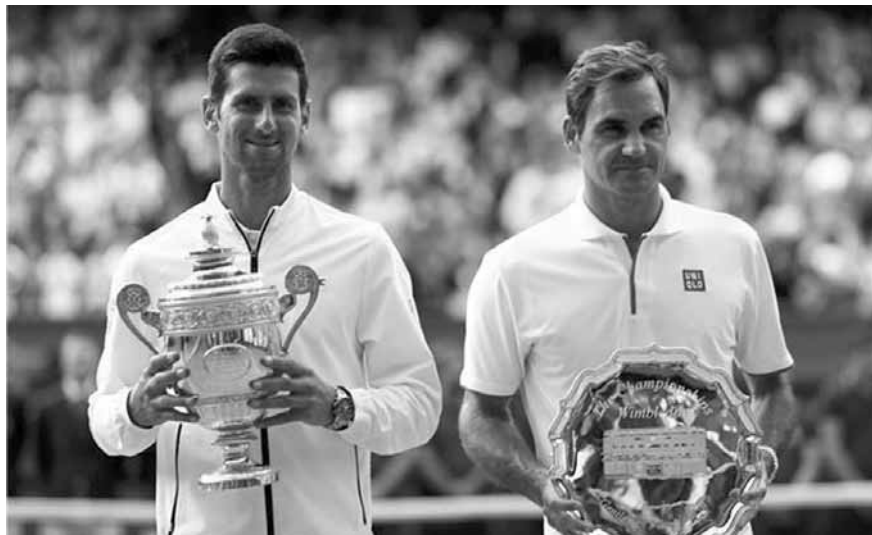
ديوكوفيتش وفيدرر مع جائزتهما

احتفظ الصربي نوافك ديوكوفيتش المصنف اول بلقب بطولة ويمبلدون، حارما السويسري روجيه فيدرر الثاني من انجاز أن يصبح أكبر بطل في تاريخ الفراند سلام، وذلك بالفوز عليه الأحد بعد النهائي الأطول في تاريخ البطولة الإنكليزية ٦-٧ (٥-٧) و٦-١ و٦-٧ (٤-٧) و٤-٦ و٦-٣ و٧-٣ (٧-٣).