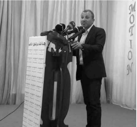
... ومتحدثاً في إحدى محطاته