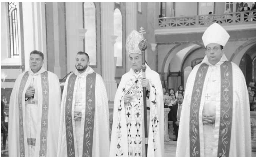
الراعي مترثسا القداس

وقال: «أمر البلاد تحلها السلطة الإجرائية لا الوساطات المشكورة وحدها التي ربما لا تنتهي، وبالتالي تبقى الحكومة ممنوعة من الاجتماع أو مقيدة بمطالب الأفرقاء المتناقضة، فيما هي المسؤولة أولاً وأخراً عن طرح المعضلات ودرسها واتخاذ القرار الحاسم الأخير. وفي كل حال، الممارسة الشاذة عندنا تشوه مفهوم الديموقراطية التوافقية»، مضيفاً «يدعونا الرب يسوع لتتحلى بالوداعة التي توحى الثقة للغير، وتعطيهم الطمأنينة، فلا تضرر أي غش وازدواجية. وهذه أيضاً فضيلة مطلوبة لدى كل مسؤول، فهو ليس ناظرًا، وليس من أصحاب النهج البوليسي، ولا هو مجرد مراقب. مثل هذه التصرفات لا توحى بالثقة لدى من هو مسؤول تجاههم وعينهم، المسيح المعلم والرب يدعونا باستمرار «للذهاب إليه، في هومونا وصعوبات مسؤولياتنا ومتعاب الحياة، ونتعلم منه أنه وديع ومتواضع القلب، فنجد راحة لنفوسنا». الوداعة وإيحاء الثقة وإعطاء الطمأنينة لا تعني إهمال السهر المطلوب من المسؤول، لكي لا تدب الفوضى، ويطاح بالقانون، ويتصرف كل واحد على هواه. غير أن الوداعة تعني أساساً التجرد من المصلحة الذاتية. عندما يتجرد المسؤول من مصالحه الخاصة، يتصرف بالتواضع، ويكون قدوة ومثالاً، ويصبح قويا حقاً لأنه لا يريد إلا الخير للعوام الذي منه خير كل إنسان وكل المواطنين. ويكون المسؤول أضعف المواطنين عندما يناسر لمصلحه الخاصة أو القوية أو العائلية أو الحزبية؟ ويدعونا الرب يسوع أخيراً لتتحلى بالصبر وبوجه المحن. إن فضيلة الصبر هي الفبات في الإيمان والرسالة والشهادة. وهي التمسك بالحق والعدل. فبهذه القيم نستطيع المواجهة ونقاوم الشر، ونبدل وجه المجتمع، ونبنى عالماً أكثر إنسانية وجمالاً».