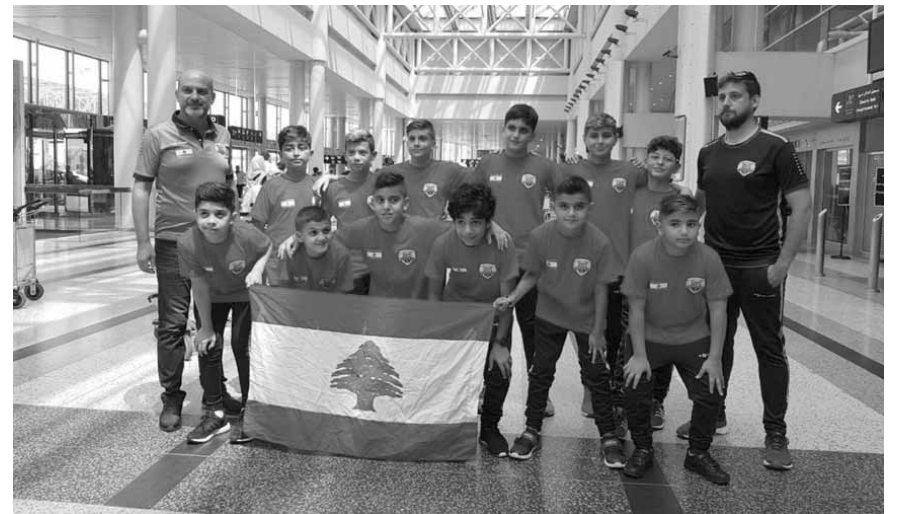
بعثة نادي هوبس

تنطلق اليوم الاثني دورة النادي اللبناني للسيارات والسياحة (ATCL) السنوية المفتوحة بالتنس على ملاعبه الستة في الكسليك والتي تستمر حتى ٢٧ تموز الجاري تحت اشراف الاتحاد اللبناني للتنس. واقتل باب المشاركة على ٢٠٨ لاعب ولاعبة في ١٧ فئة عمرية للذكور والإناث. تبلغ الجوائز المالية للدورة ثمانية آلاف دولار أميركي إضافة الى الجوائز العينية. برنامج اليوم وفي مسالي برنامج