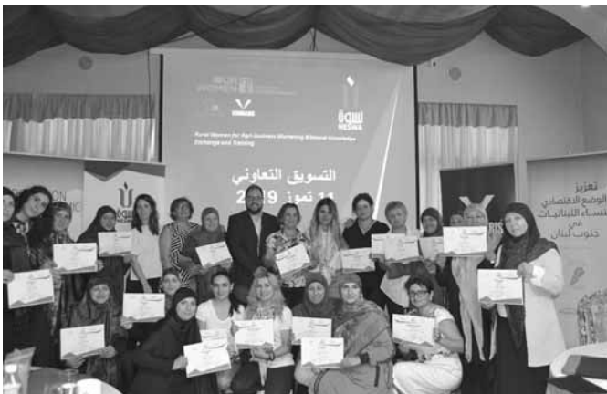
اعلن «صندوق المساواة بين الجنسين» (EGE) انه اختتم «بالشراكة مع منظمتين من المجتمع المدني - إحداهما من أرمينيا وتدعى Green Lane Agricultural Assistance» والأخرى «tanceA» من لبنان وتدعى «جمعية تنظيم الأسرة في لبنان للعمل على التنمية وتمكين المرأة» -

أسف في صور، لقاء «التبادل المعرفي الثنائي بين النساء الريفيات في مجال الأعمال الزراعية الريفية وتسويقها». واختتم بقاء تبادلتي إستمتر أسبوعاً وشمل التبادل المعرفي وتبادل الدروس المستفادة وأفضل الممارسات بين منظمّتين من المجتمع المدني تتمتعان مجال التمكين الاقتصادي للمرأة من خلال دمج رؤية المرأة الديناميكية ومقارنتها الميدانية في شأن نماذج بناء القدرات العملية».