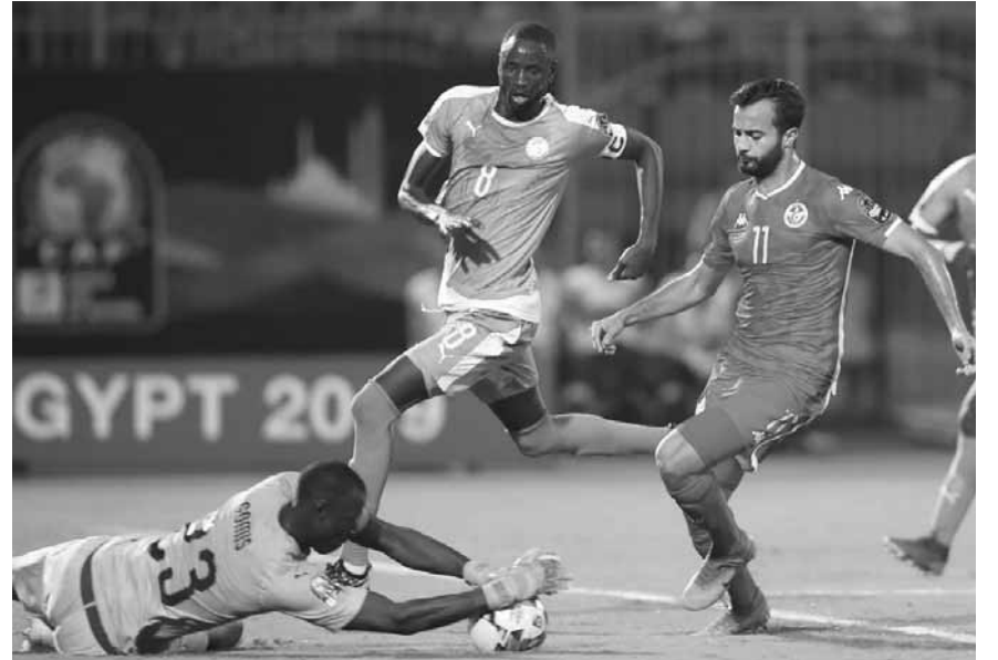
من مباراة تونس والسنغال