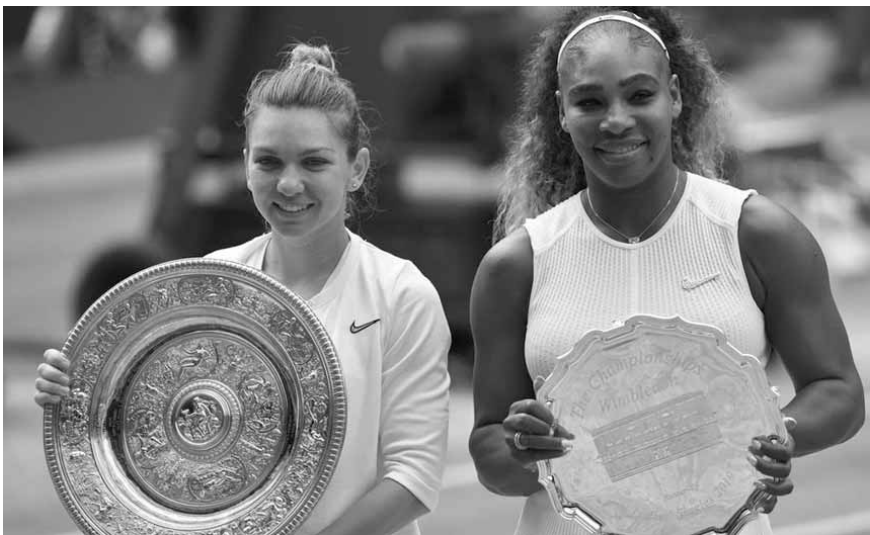
هاليب وسيرينا وليامس مع جائزتهما

وقالت كوماتشي: «بعد لحظات من تتويج هاليب باللقب، لقد قدمت أداء مذهلاً. هذا رائع، ليست مفاجأة أنها فازت لأنها من الناحية الذهنية كانت مستعدة لهذا الانتصار، وأن حان الوقت لاحتفال الجميع في رومانيا وهي تستحق