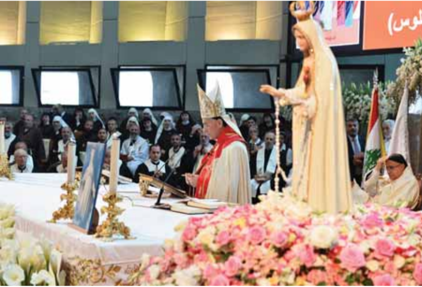
الراعي يترأس القداس

ترأس البطريرك الماروني الكاردينال مار بشارة بطرس الراعي، قداس أحد العنصرة في بازيليك سيدة لبنان - حريصاً، محتفلاً أيضاً بالعيد الـ ٢٩ لـ «تيلي لوميبار»، والـ ١٨ لنورسات، وذكرى إطلاق مجموعة فضائياتها، وتزامناً مع العيد السابع لتكريس لبنان والشرق إلى قلب مريم الطاهر.