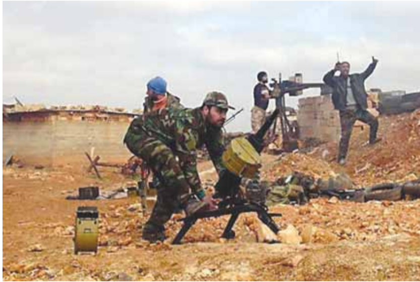
قصف للجيش السوري بالرشاشات الثقيلة

تراقب عن كذب العمليات العسكرية التي تقوم بها القوات السورية في شمال غرب سوريا، بما في ذلك مؤشرات على أي استخدام جديد للأسلحة الكيميائية. وتابعت بالقول: «ما زلنا نجمع معلومات عن هذا الحادث»، في إشارة إلى الهجوم المزعوم على بلدة كباتي بريف اللاذقية. وكان مصدر عسكري سوري قد نفى،