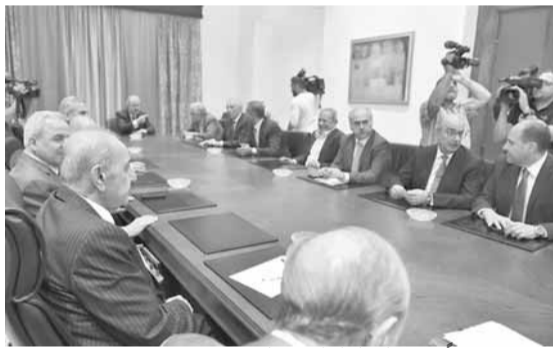
بري مجتمعاً مع نواب لقاء الأربعاء