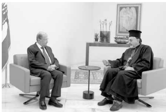
عون مجتمعاً مع يونان (الدايتي ونهرا)