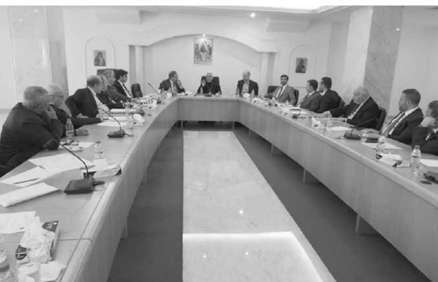
العيسبي يترأس الاجتماع

درست الهيئة التنفيذية للمجلس الأعلى لطائفة الروم الكاثوليك في إجتماعها الدوري الشهري في المقر البطريركي بالربوة، الذي عقد برئاسة غبطة البطريرك يوسف العيسبي جدول أعمالها المقرر واتخذت بشأنه القرارات المناسبة، ثمّ استمعت إلى العيسبي حول أجواء اللقاءات التي أجراها في فرنسا، لا سيما لقاءه مع الرئيس الفرنسي إيمانويل ماكرون وما تخلّله من مواضيع أثيرت تخص لبنان والمنطقة، وكان لافتاً حسن الاستقبال الذي لقيه من قبل المسؤولين الفرنسيين، وأعرب المجتمعون في بيان اصدره عن حزنهم لفقدان هامة كنسية ووطنية كبيرة، المثلث