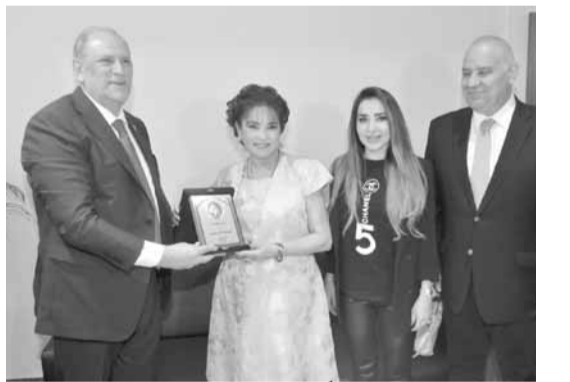
الجراح قدم لعفايش درعاً تكريمية