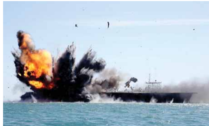
مناورات إيرانية تستهدف تفجير زوارق معادية

يستعد الجيش الإيراني لإرسال قطع من الأسطول الحربي رقم ٦٢ إلى المياه الدولية، خلال الأيام المقبلة. وذكرت وكالة «فارس»، أن الأسطول كان قد أنجز مهمات لحماية السفن التجارية وناقلات النفط الإيرانية إلى مياه خليج عدن. وأوضحت أن الأسطول مكون من المدمرة «بايندر» والبارجة «بوشهر» والبارجة «لاوان»، وأن الأسطول سيقوم بمهام بحرية ودوريات تفقد أمنية والتصدي للقرصنة في المياه الدولية. ورست مجموعة القطع البحرية الإيرانية الواحدة والستين التابعة للقوة البحرية للجيش الإيراني في ميناء بندرعباس (جنوب) بعد إنجاز مهمتها التي استغرقت ٦٧ يوما، وفقا لوكالة الأنباء الإيرانية. وقال قائد مقر أسطول الجنوب التابع للجيش، الأدميرال