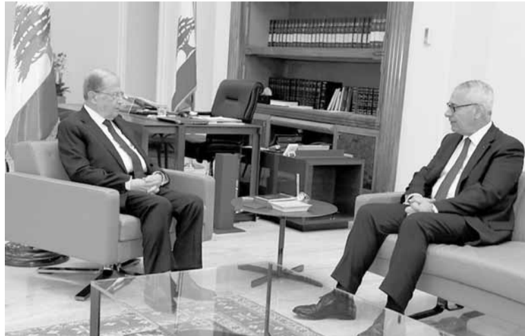
عون مجتمعاً مع فهد (اللائي ونهرا)

استقبل رئيس الجمهورية العماد ميشال عون قبل ظهر أمس في قصر بعداء، رئيس مجلس القضاء الأعلى القاضي جان فهد، وبحث معه في التحضيرات الجارية للاحتفال بمئوية محكمة التمييز في شهر حزيران المقبل.