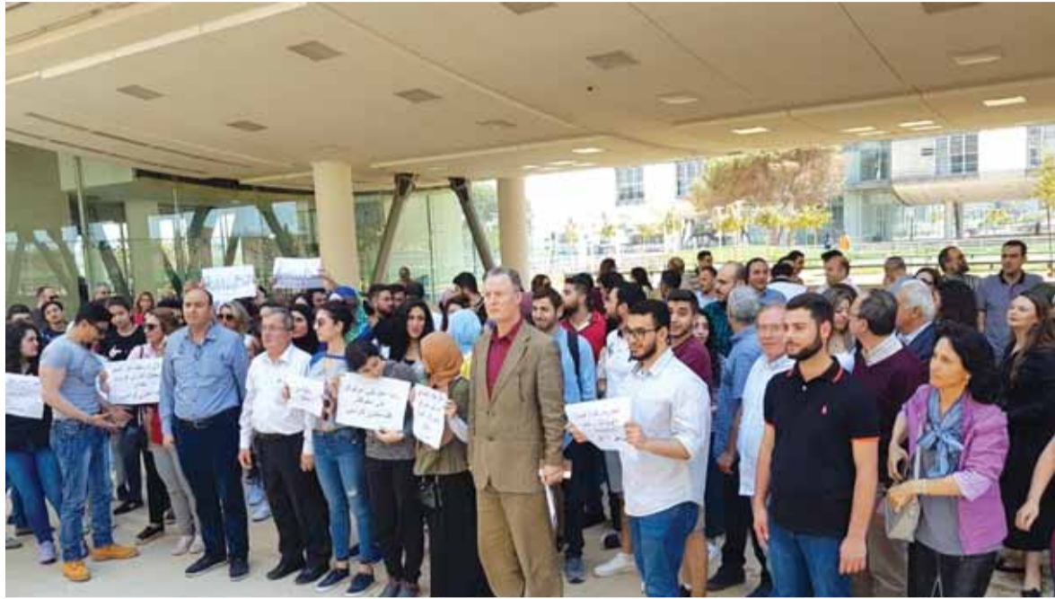
اضراب اساتذة الجامعة اللبنانية

اليوم يأتي ساتفيلد مرة اخرى الى لبنان حاملا معه اقتراحات جديدة، ولكن في المضمون تبقى نفسها طالما هي اقتراحات غير عادلة تجاه لبنان ومنحازة لاسرائيل. والهدف من زيارة ساتفيلد الحالية هو تسهيل طريق لاسرائيل في ما يتعلق بالنفط والحصول على حصة من المثلث البحري، علماً ان هذا المثلث تابع للبنان.