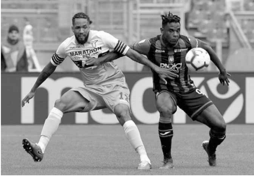
من مباراة الفريقيين الأخيرة في الدوري الإيطالي

وسكون هذا الأسبوع مصيريا بالنسبة لأتالانتا ليس بسبب إمكانية فوزه بلقبه الأول على الإطلاق منذ ١٩٦٣ وحسب، بل لأنه يخوض مواجهة مفصلية أيضا الأحد في المرحلة قبل الأخيرة من الدوري حيث يحل ضيفا على يوفنتوس المتوج بطلا للموسم الخامن تواليها في لقاء فاري للأخير كونه تنازل عن لقب الكأس نتيجة خسارته القاسية في ربع النهائي ضد رجال غاسبيريني.