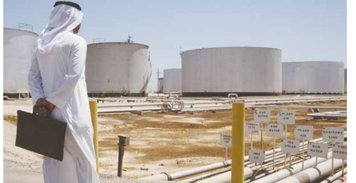
شركة ارامكو السعودية

وقد أعلنت جماعة «انصار الله» (الحوثيين) مسؤوليتهم عن الهجوم على مضختي نطف رئيسيتين في منطقة الرياض بالسعودية بواسطة ٧ طائرات دون طيار. وقال المتحدث باسم وزارة الدفاع التابعة للحوثيين في صنعاء بحبي رسول، في مؤتمر صحافي «نقد سلاح الجو المسير عملية على منشآت حيوية للعدو في محافظتي الدوادمي وعفيف بـ ٧ طائرات دون طيار تابعة لسلاح الجو المسير». وأوضح المتحدث ان «العملية استهدفت محطتي الضخ البترولية في الخط الأنبوب الرئيسي للنطف الـ ٧ الذي