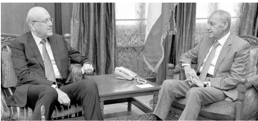
بري مجتمعاً مع ميقاتي (حسن إبراهيم)

زار الرئيس نجيب ميقاتي، رئيس مجلس النواب نبيه بري بعد ظهر امس في عين التينة، وعرض معه الأوضاع العامة.