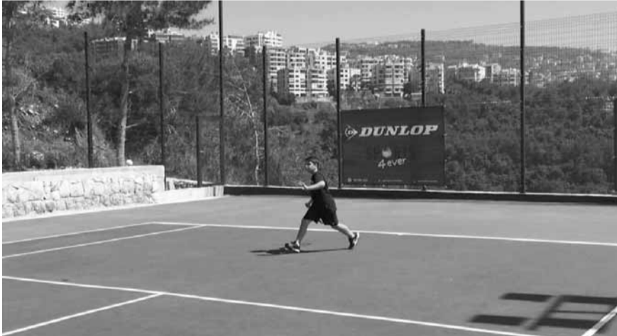
أحد اللاعبين خلال إحدى المباريات