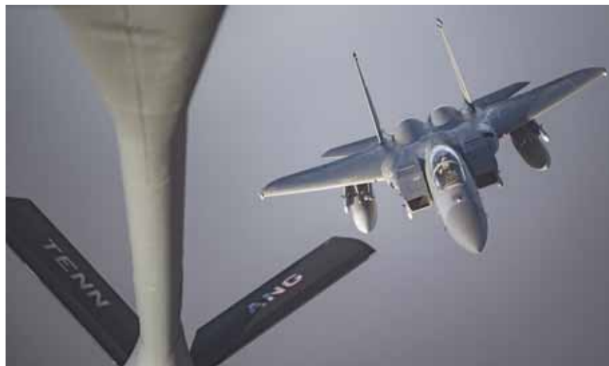
طائرات اميركية في سماء الخليج

أجرت مقاتلات أميركية، أمس، طلعات ردع فوق الخليج، موجهة ضد إيران.