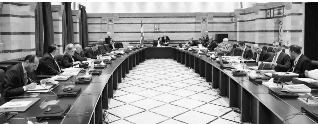
خلال انعقاد جلسة مجلس الوزراء

مغادرته الجلسة: «مطالعتي حول الموازنة تتشكل من خمسة محاور وتشمل كل شيء ولأقت أصداء إيجابية داخل مجلس الوزراء»، وسأل «لماذا التصور دائماً أن هناك فريقاً ضد فريق آخر، فيما نتجج سوا أو نسطج الويا؟» ورداً على سؤال قال باسيل: ما يقوله قومجيان خارج الجلسة لا يجرو على قوله داخلها.