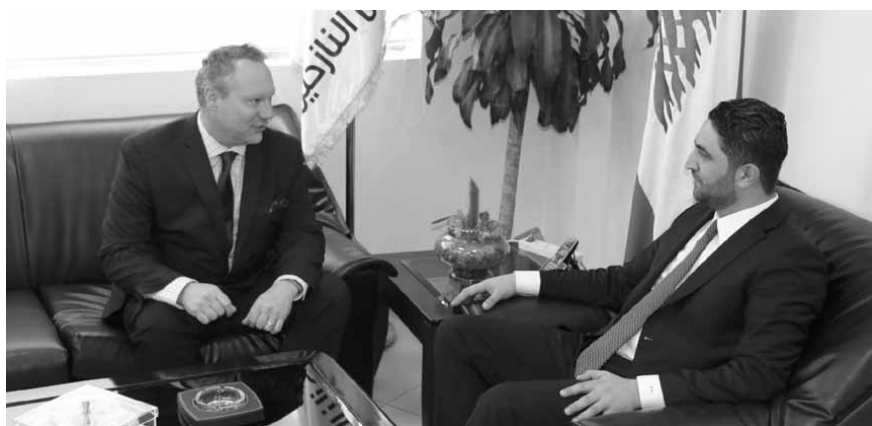
الوزير الغريب وسفير النمسا

استقبل وزير الدولة لشؤون النازحين صالح الغريب، في مقر الوزارة، سفير قطر في لبنان محمد حسن جابر الجابر وسفير النمسا ماريان ألكسندر ورنا، وعرض معهما ملف النزوح السوري، وسبل تأمين العودة الكريمة والآمنة للنازحين. وبحث الغريب مع محافظ الجنوب منصور وضو وضع الخيّمات النازحين السوريين في نطاق المحافظة.