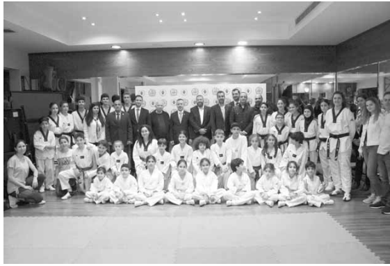
كبار الحضور مع لاعبي ولاعبات النادي