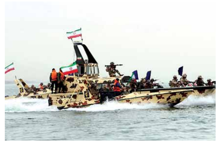
السفن الإيرانية في مياه الخليج

بالمقابل، كشف الرئيس الإيراني حسن روحاني عن رسالة من الرئيس العراقي الراحل صدام حسين إلى نظيره الإيراني آنذاك رفسنجاني طلب فيها مساعدته في احتلال دول الخليج.