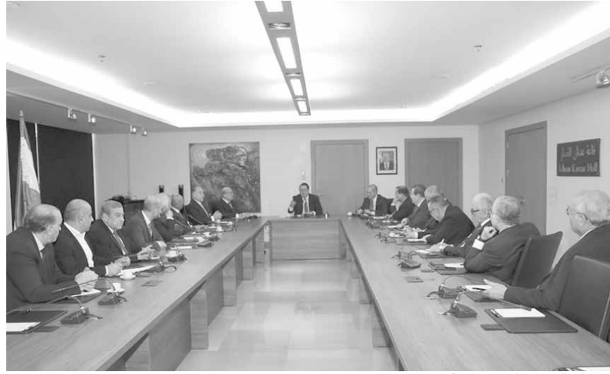
اجتماع الهيئات الاقتصادية

هيكلية للنقابات العامة، لأن هذا الخيار يشكل حلاً مستداماً»، محذرة من أن «اللجوء إلى زيادة الضرائب كوسيلة لخفض عجز الموازنة من شأنه ارسال رسائل سلبية إلى الأسواق، كما أن التجارب الماضية أظهرت أن زيادة الضرائب لم تكن في مكانها حيث أتت النتائج معاكسة لكل التوقعات بإرهاقها الاسر والمؤسسات وضرب النمو الاقتصادي واضعاف المالية العامة». وأكدت أن «هوامش الوقت تضيق جداً، فيما الحلول الحقيقية معروفة من الجميع، ولا ينقص سوى اتخاذ قرارات شجاعة ومسؤولة تنقذ الوطن».