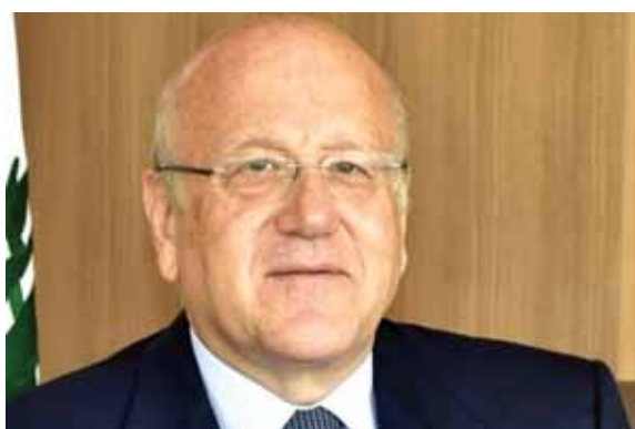
الرئيس مياقتي (ص ٨)