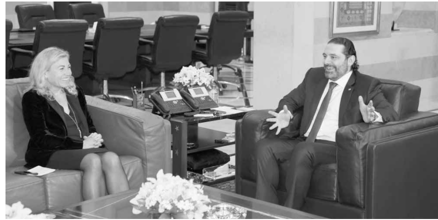
الحريري مستقبلاً سفيرة النروج

«ان القرار السعودي برفع حظر السفر الى لبنان ساهم في زيادة عدد الوافدين»، من جهته، أكد الربيعه، «ان المملكة العربية السعودية تقدر الدور الذي يقوم به لبنان في استضافة عدد كبير من النازحين السوريين، والظروف تقتضي تضافر الجهود لتخفيف العبء عن المجتمع المضيف». وقال: «العمل الاغاثي من مسؤولية الجميع، ويجب المساهمة في العودة الآمنة ودعم المجتمعات الحاضنة لهؤلاء النازحين».