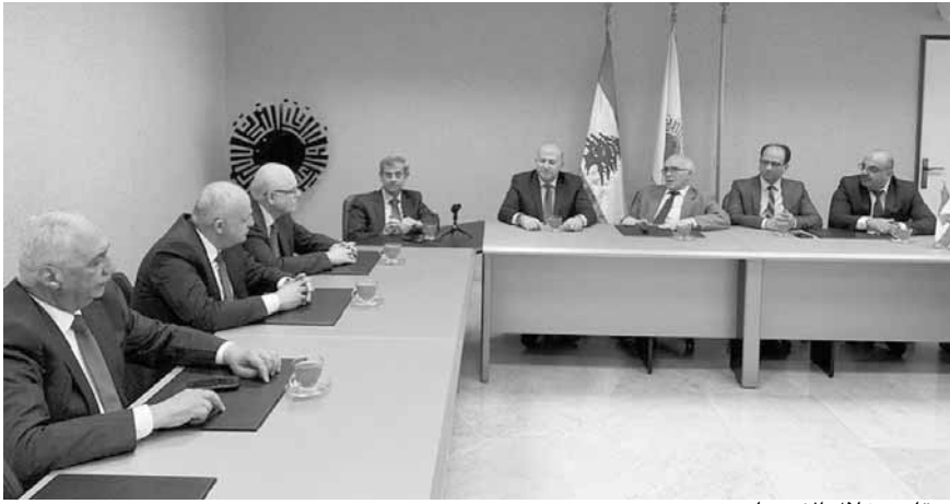
ميقاتي خلال الاجتماع

طرابلس. حيث من المقرر أن يعقد سلسلة من الاجتماعات مع الجهات الفاعلة بهدف ضمان إعداد الخارطة الاستثمارية بشكل يتوافق وتطلعات تلك الجهات»، لافتاً إلى «أن فريق المعهد قام بتنظيم ورشات عمل حول إعداد الخارطة الاستثمارية وذلك لشرح أهدافها ومخرجاتها ومنهجية إعدادها».