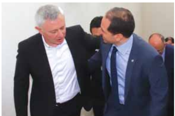
الجميل وفرنجية (ص ٤)