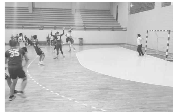
من مباراة الصداقة والشباب مار الياس

٢٣ نقطة في الصدارة، بينما صار رصيد حارة صيدا ١٩ نقطة في المركز الثاني. وحفل اللقاء بالكثير من الإثارة والندية بين الطرفين، وهذا ما يبرر الخسوة التي اتسم بها الأداء، وفي الحصيلة العامة عوقب ٦ لاعبين من الجيش بالخروج مدة دقيقتين، مقابل ٥ لاعبين من الفريق المضيف.