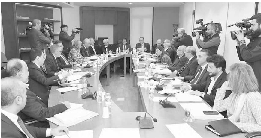
اجتماع لجنة المال النيابية

المقبلة»، وقال: «كان يفترض بموازنة العام الأول ٢٠١٩، وقد بنتنا في نهاية نيسان ولم نتخذ الحكومة أي جلسة لمناقشة الموازنة».