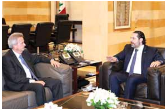
الحريري مستقبلاً رياض سلامة

عرض رئيس الحكومة سعد الحريري في السراي مع حاكم مصرف لبنان رياض سلامة، الأوضاع المالية والاقتصادية في البلاد.