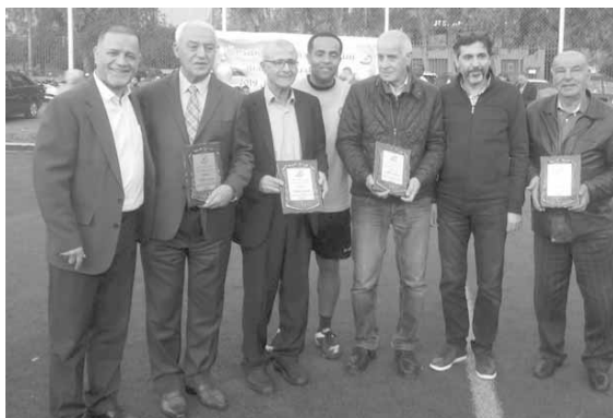
خلال الاحتفال التكريمي

تقديراً لمسيرتهم المحلّية في ملاعب كرة القدم، واعتراًفاً بأفضالهم في دفع مسيرة اللعبة الشعبية نحو الأفضل مع انديتهم ومع المنتخبات الوطنية وفي بلدات ساحل المتن الجنوبي، كرمّت بلدية برج البراجنة نخبة من نجوم الزمن الجميل، وذلك بين شوطي المباراة التي جمعت بين قدامي اللاعبين في برج البراجنة والغبيري على ملعب بلدية المريجة وانتهت نتيجتها لمصلحة «البرجيين» بنتيجة ٥ - ٣.