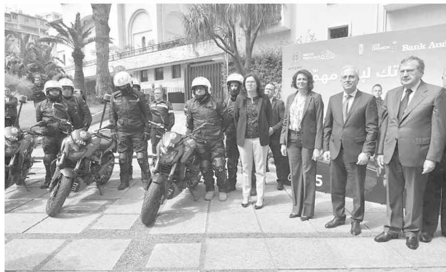
خلال الاحتفال في بنك عودة

سنعرضها على اللجنة الوزارية للسلامة المرورية للبدء في تنفيذها. واقترحنا نصاً على وزارة المالية لقراره في الموازنة يستهدف خفض رسوم الكيانك والتسجيل بالنسبة إلى الدراجات النارية الصغيرة لما له من انعكاس إيجابي على السلامة المرورية».