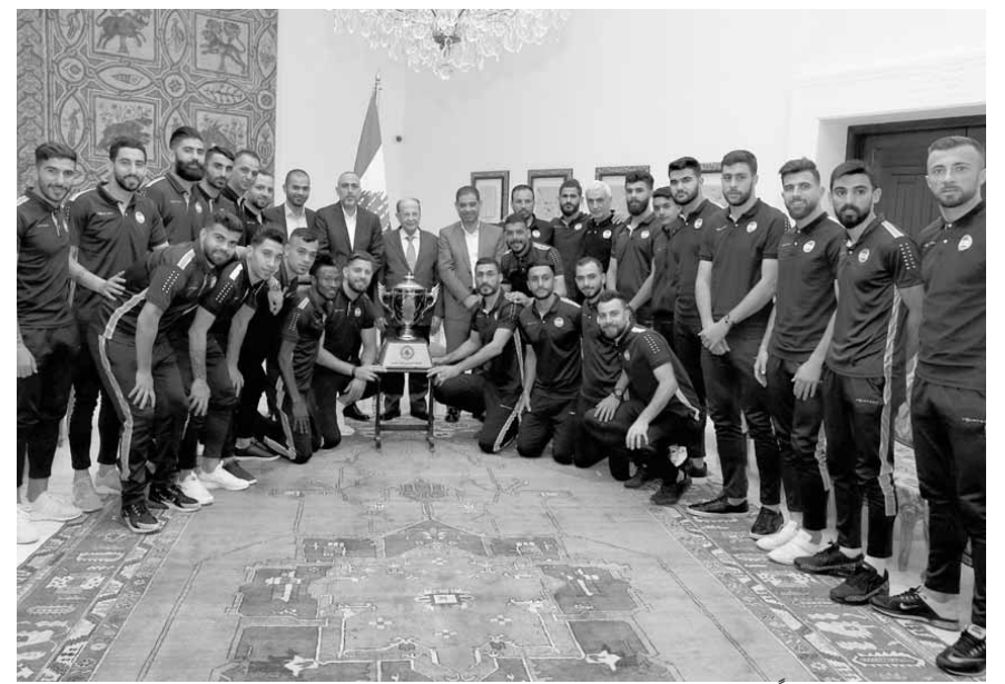
الرئيس عون مستقبلاً وفد نادي العهد البطل

استقبل رئيس الجمهورية العماد ميشال عون وفداً من نادي العهد الرياضي بطل لبنان في كرة القدم للعام ٢٠١٩ ضمّ الاداريين واللاعبين، الذين سلموا رئيس الجمهورية كأس البطولة.