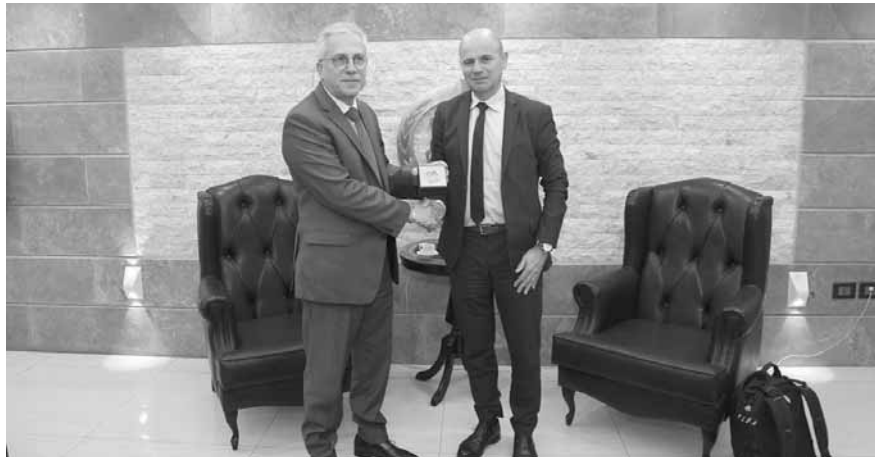
روكايرول يقدم لخطار درعا تذكارية

البناء مع الدولة الفرنسية عبر سفارتها في بيروت لا سيما لجهة البرامج التدريبية الهادفة إلى تعزيز قدرات عناصر الدفاع المدني اللبناني.