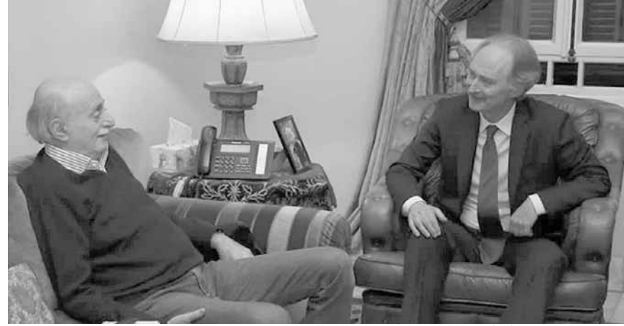
بيدرسون عند جنبلات

التي يقوم بها في سوريا وموضوع النازحين السوريين في لبنان، ومساءً التقى بيدرسون إلى سوريا، رئيس مجلس الوزراء سعد الحريري، في «بيت الوسط»، في حضور الوزير السابق غطاس خوري.