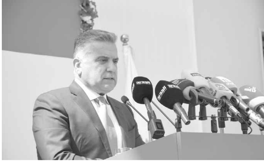
ابراهيم يلقي كلمته

أعلن المدير العام للأمن العام اللواء عباس ابراهيم أن «الأمن العام سيواصل تنظيم وتسهيل عودة اللاجئين السوريين بالتنسيق مع السلطات السورية، بما يضمن سلامتهم وعودتهم الآمنة»، مشدداً على «تأمين هذه السلطات كل الاحتياجات اللوجستية لهذه العملية تخفيفاً لمعاناتهم». كلام اللواء ابراهيم جاء خلال رعايته حفل تدشين المبنى الجديد لدائرة ومركز أمن عام النبطية الإقليميين والذي أنجز بناءه مجلس الجنوب في حضور رئيس كتلة الوفاء للمقاومة النائب محمد رعد، وعضاء كتلة التنمية والتحرير