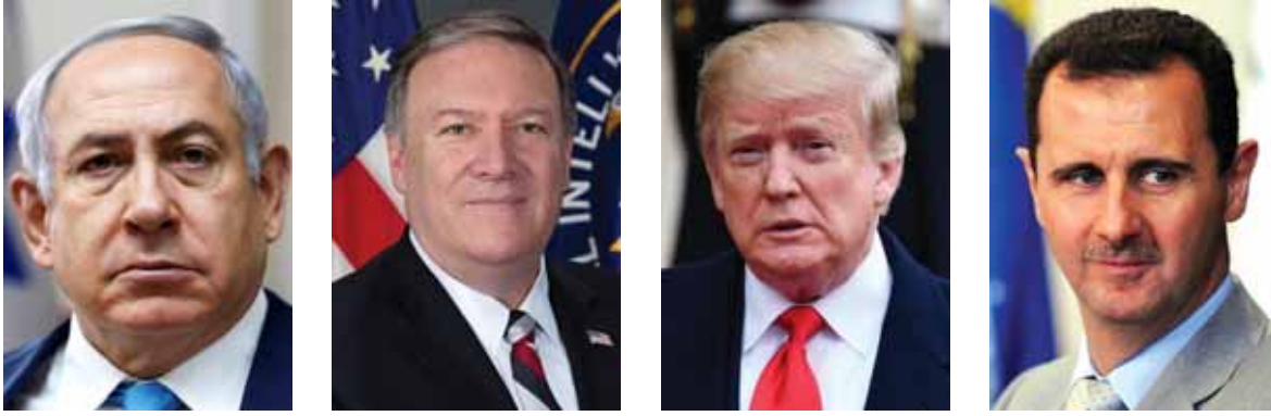
نتنياهو بومبيو ترامب الأسد العنصرية عبر اعلان اسرائيل انها دولة قومية يهودية وسكانها الفلسطينيين وعددهم ٧ (تتمة المانشيت ص ٢٠)

سيد بومبيو و انت وزير خارجية الولايات المتحدة و انت محام لامع و تعرف دستور الولايات المتحدة و مبادئ و اخلاق الشعب الاميركي، و نوجه لك سؤالاً، هل الدستور الاميركي و اخلاق و مبادئ الشعب الاميركي يسمحان و يقبلان باحتلال ارض عربية لدول عربية ذات سيادة، اضافة الى اغتصاب فلسطين و تشريد شعبها، و بقاء قسم كبير منه تحت الاحتلال. سيد بومبيو اهلا بك و انت تزور بيروت عاصمة لبنان هل تعرف ان اسرائيل احرق بيروت سنة ١٩٨٢ و هي لؤلؤة الشرق و شعبها نموذج للتعايش السلمي بين كل طوائفه و الاسلاميه و المسيحية و الاقليات و غيرها، سيد بومبيو ماذا جئت تطلب ، هل تطلب تجريد المقاومة اللبنانية من سلاحها فيما اسرائيل مدججة بالاسلحة الاميركية الاحدث في العالم و اسرائيل تملك السلاح النووي و هي الدولة النووية الوحيدة في المنطقة كلها. سيد بومبيو الولايات المتحدة صوتت على القرارات الدولية ٢٤٢ و ٣٣٨ و قرار ٤٢٥ في شأن احتلال اسرائيل لجنوب لبنان، و الان جئت تنتقد عهد الرئيس الاميركي السابق باراك اوباما و تقول انه قام بالتقصير في كبح جماح حزب الله، فيما اسرائيل اغتالت في فنادق في دبي مدنيين و حققتهم بحقنة سامة، و تقصف غزة بالطائرات الاميركية الصنع الحربية و الشعب في غزة محاصر و اعزل من السلاح،