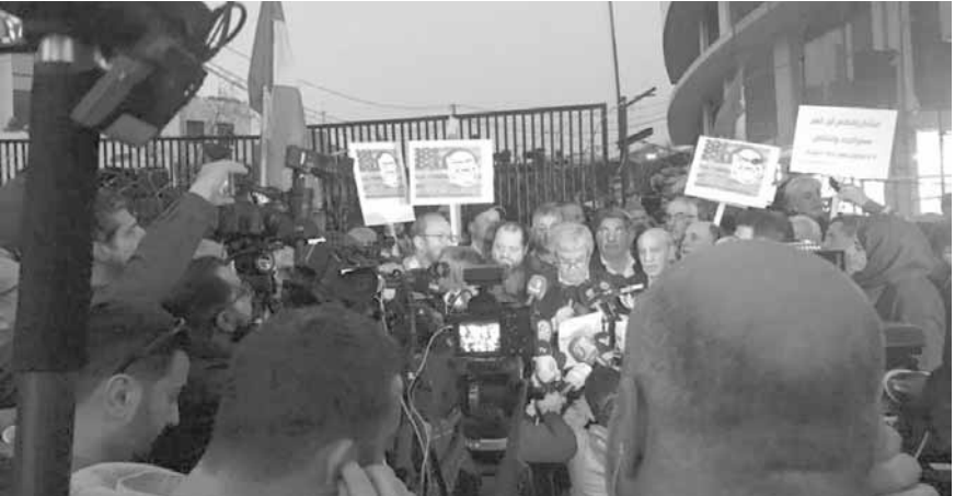
شعارات رفعت خلال التظاهرة

أقام الحزب الشيوعي اللبناني عصر امس، بمشاركة الحزب الديموقراطي الشعبي وممثلين عن الحزب السوري القومي الاجتماعي وجبهة تحرير فلسطين، اعتصاماً في ساحة عوكر وعلى الطريق المؤدية الى السفارة الأميركية احتجاجاً على «زيارة وزير الخارجية الأميركي مايك بومببيو للبنان وتدنيداً بسياسات الولايات المتحدة في العالم عموماً، ولبنان خصوصاً»، وذلك وسط إجراءات أمنية مشددة، حيث