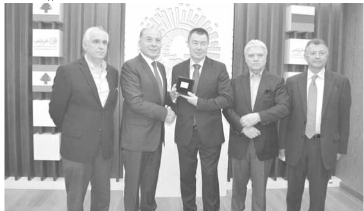
الوفد الروسي في غرفة طرابلس

واصرار وعزم مسيرة الشراكة والتعاون». وتابع: «نحن في هذا السياق سننطلق على قدرات لبنان الإستثمارية، لأن ثمة مقدرة على وجود أكبر مطار وأكبر مرافق وأكبر معرض وأهم سكة حديد من طرابلس، وكذلك أهم مراكز لإقتصاد المعرفة، وموقعا تاريخيا للمساحة التراثية والحضارية، ونحن قادرون على أن نستثمر في طرابلس الكبرى، وأعني بها تلك المقدمتة من البترون إلى أقاصي الحدود الشمالية في محافظة عكار، وما علينا إلا أن نستثمر الوقت والقدرة المصلحة شعوبنا، ونحن عازمون على ذلك، والعراق وسوريا يحتاجان إلى الخدمات الكثيرة، ونحن قادرون معا على توفيرها ونعزز شراكتنا ومن خلال اللبنانيين أينما وجدوا في بلدان الإنتشار».