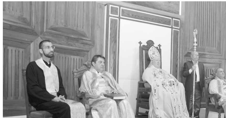
مطر يترأس القداس

لبت أسرة مدرسة الحكمة هاي سكول ( مريم أم الحكمة) في عين سعادة وأصدقائها، دعوة رئيس المدرسة الخوري كبريال ثابت للمشاركة في قداس الشكر الذي احتفل به رئيس أساقفة بيروت المطران بولس مطر في كاتدرائية مار جرجس في بيروت في مناسبة اختتام المدرسة احتفالاتها اليوبيلية في مناسبة مرور ٢٥ سنة على تأسيسها.