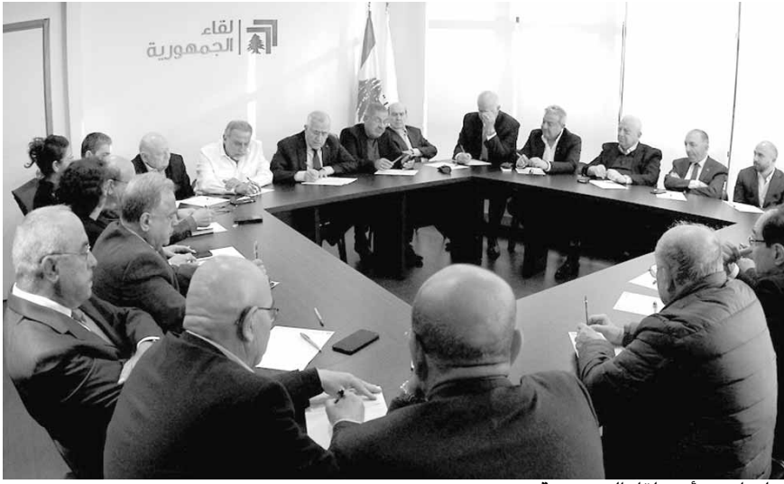
سليمان يترأس «لقاء الجمهورية»

«لقاء الجمهورية»: ترسيم الحدود حاجة ملحة والمواقف الإيرانية بالنيابة عن لبنان غير مقبولة