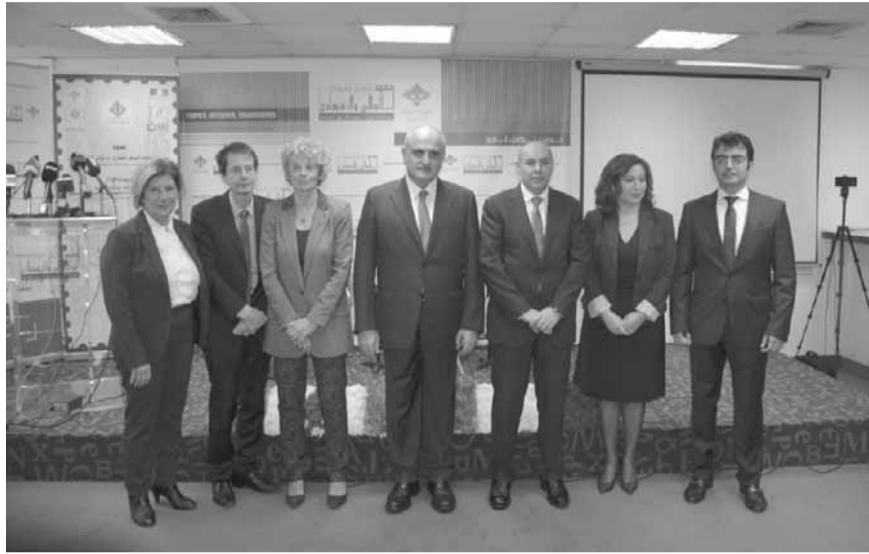
خليل خلال الندوة

تمنى وزير المال علي حسن امس، «المبادرة إلى دعوة سريعة لمجلس الوزراء من أجل المباشرة في مناقشة الموازنة العامة» تفادياً للوقوع في «محذور التأخر»، مؤكداً أن هذه الموازنة ستعكس «حرصاً حكومياً حقيقياً على تخفيض العجز في إطار خطة إصلاحية» تتضمن «قرارات جذرية بنوعية». وحذر خليل خلال افتتاحه ندوة عن مشروع مدعوم من فرنسا لربط أمانات السجل العقاري مع دوائر كتاب العدل، من أن أي «حزب أو تيار أو قطاع لن يكون بمعزل عن التأثير السلبي لأي خطوات اقتصادية أو مالية لا تعكس روحاً إصلاحية». وشدد على أن معركة محاربة الفساد وتعزيز ثقة الناس بالدولة «تكون بالعمل الحقيقي الجاد البعيد من الاستعراض والذي يصيب مكانم الخلل بشكل دقيق ويعالجها».