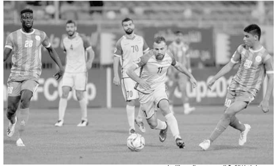
من مباراة المالكية البحريني والعهد اللبناني

فرض المالكية البحريني التعادل السلبي على ضيفه العهد اللبناني، في اللقاء الذي جمعهما أمس الثلاثاء ضمن الجولة الثانية من منافسات المجموعة الثالثة، ببطولة كأس الإتحاد الآسيوي.