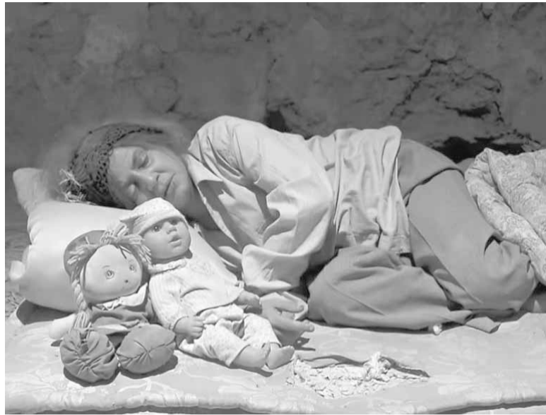
تلعب دور الام المسجونة في مسلسل حنين