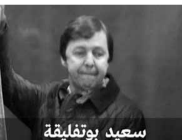
سعيد بوتفليقة 61 عاما حاكم الجزائر الحقيقي؟