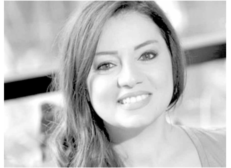
الممثلة فيفيان أنطونيوس