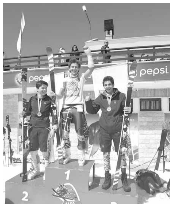
ابطال على منصة التتويج