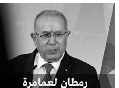
رمطان لعامرة 66 عاما الدبلوماسي المحنك