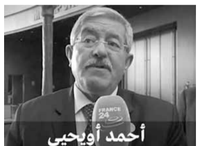
أحمد أويحيى 66 عاما رجل النظام