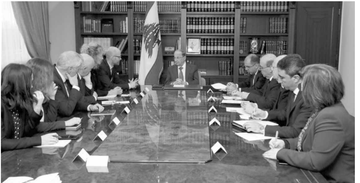
عون مجتمعاً مع الوفد الفرنسي