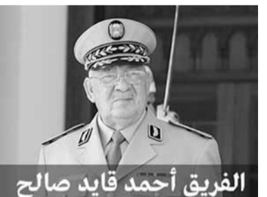
الفريق أحمد قايد صالح 79 عاما الولاء لبوتفليقة

قائد الجيش الجزائري احمد صالح ٧٩ عاما وهو كامل الولاء للرئيس بوتفليقة ويريد شقيقه سعيد رئيساً كذلك الدائرة المقربة من الرئيس بوتفليقة لكن الامر ينتظر موافقة الجيش الجزائري عن تولي سعيد بوتفليقة رئاسة البلاد والاهم موافقة فرنسا الدولة المهمة والأكثر نفوذا في الجزائر لكن الأهم هل سيقبل الشعب الجزائري بتولي سعيد بوتفليقة بعد حكم شقيقه الرئيس عبد العزيز بوتفليقة. ونشر لكم من هو سعيد بوتفليقة: