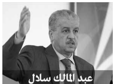
عبد المالك سلال 70 عاما محرك الحملة القاتل