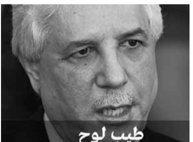
طيب لوح 67 عاما رفيق درب بوتفليقة