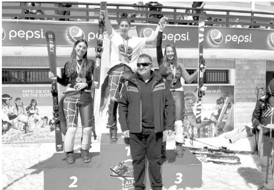
سلامة مع بطلات إحدى الفئات