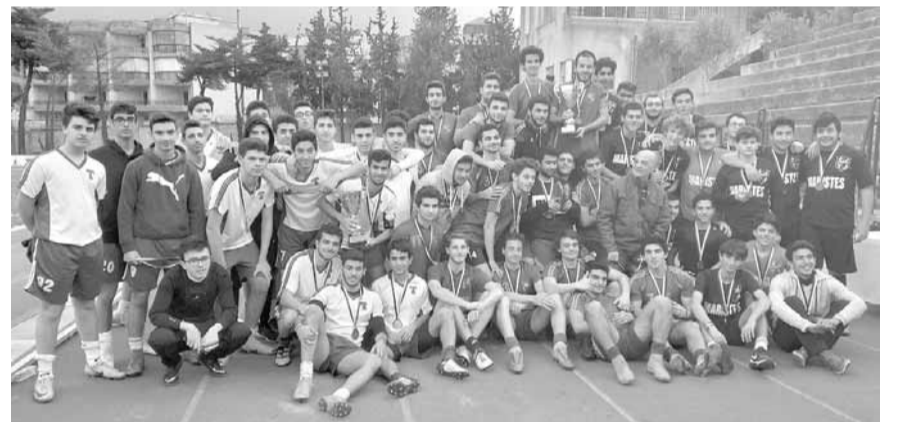
تتويج الفرق الفائزة

أحرزت مدرسة سيدة الجمهور لقب دورتها المدرسية السنوية في كرة القدم برعاية «فرنسيك»، والتي نظمتها على ملعبها الأخضر في حرم المدرسة. وجاء احراز المدرسة المتظمة اللقب بفوزها في المباراة النهائية على مدرسة الانطونية بعهدا (٢ - صفر). وقد احتلت مدرسة الريميين جبيل المركز الثالث. شارك في هذه الدورة ١٥