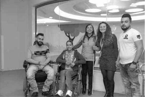
خلال زيارة المجمع

المسؤولين عن العلاجات من اجل خلق الشروط والمحيط والظروف المناسبة للأطفال من ذوي الإحتياجات الخاصة، من استحداث المرات الخاصة بهم في الدخول والتجول، وقد اطلقوا كتبيا عن الحملة باللغة الانكليزية ونسخة منه باللغة العربية وثالثة باللغة الإسبانية والتي تتضمن ١٠ اهداف تساعد على دمج وتمكين ذوي الإحتياجات في الحياة والمجتمع والعمل».