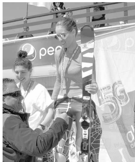
تتويج بطلة إحدى الفئات