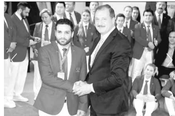
رعد يتسلم جائزته

يوم بعد يوم الجوائز بالجملة في الدورات والبطولات الخارجية وهذا ما يظهر قدرات الحكم اللبناني.