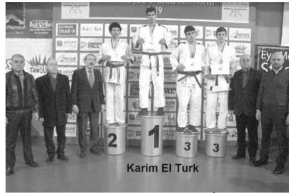
سعادة يتوج ابطلاً