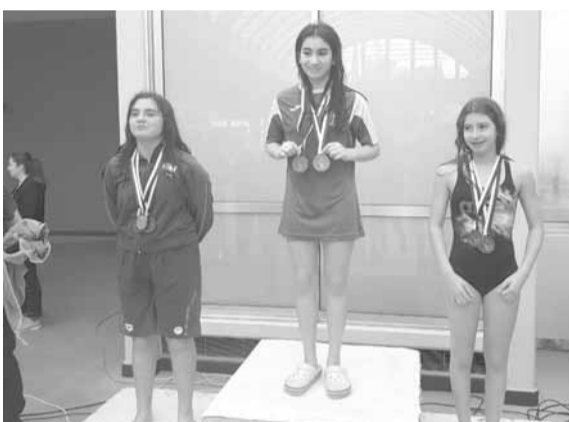
...بطلات احدي الفئات