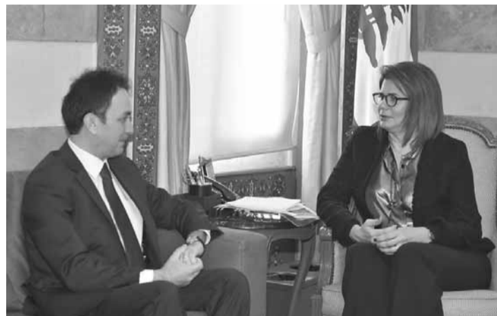
الحسن مجتمعة مع بارود

وقد اكدت هذا المبدأ وان الحكومة اللبنانية ستلتزم هذه السياسة وان تكون عوناً للاصدقاء والاشقاء ايضاً». وبحثت الحسن مع الوزير السابق زياد بارود في ملفات تتعلق بوزارة الداخلية. وقال بارود بعد اللقاء: «تباحثنا في أمور عدة ووضعت كل امكانياتي في تصرفها بعدما خدمت في هذا المكان لانها تملك مؤهلات النجاح». وتابع: «ان موضوع الزواج المدني ينتمي الى المواضيع الاشكالية في هذا البلد ويأخذ حيزاً اعلامياً اكثر ما في المضمون. لقد دعت الوزيرة الحسن الى فتح نقاش ووضع اطار للحوار في هذا الموضوع، فغريب ان يدعو انسان الى الحوار والنقاش ويواجه بلا حوار ولا نقاش وبردات فعل مسبقة الافكار. كل ما قالته الوزيرة الحسن ان هذا الموضوع يستحق ان يناقش فلنفتح باب النقاش لنرى الى اين سنصل لان هذا الموضوع يحتاج الى قوينة لئلا نبقي في الاطار الذي نحن فيه».