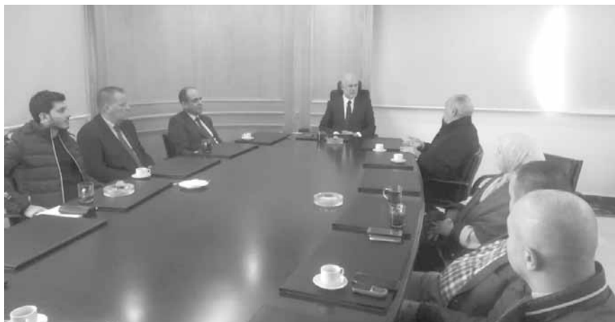
فينانوس مجتمعاً بوفد شركة غالفيتير

جهدوه والنجاح الذي حققه في المرفأ ودعمه المستمر لتطويره كي يصبح من أهم المرفأ في المنطقة.