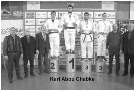
إبطال على منصة التتويج