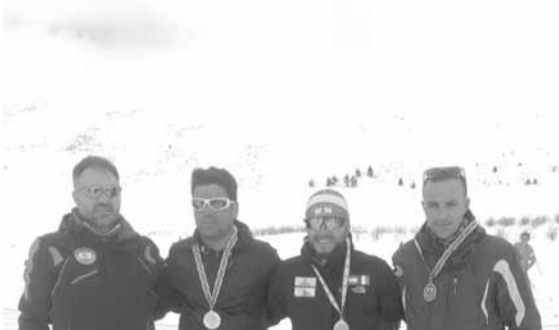
تتويج أبطال احدي الفئات