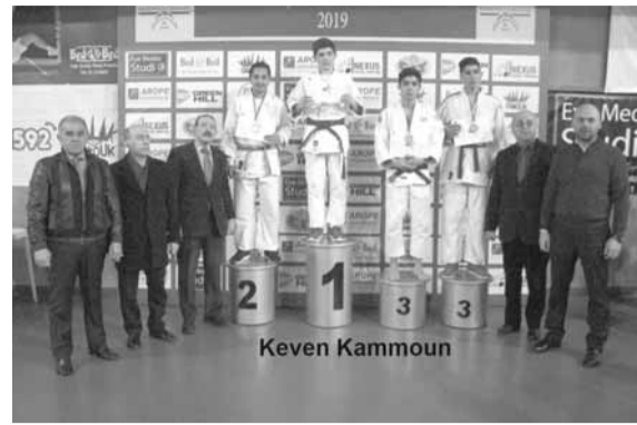
تتويج احدي الفئات