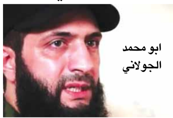
ابو محمد الجولاني

يبدو ان المخابرات السورية تغلغت في قلب محافظة ادلب التي يسكنها مليونان ونصف مليون مواطن سوري ويوجد فيها حوالي ٦٥ الف اراهمي من جبهة النصرة وجيش الاسلام واحرار الشام كما يوجد فيها ٩ مراكز عسكرية للجيش التركي بداخلها وتوجد فيها سرية من الشرطة العسكرية الروسية لا يزيد عددها عن مئة وقد أصيبت جبهة النصرة بصدمة كبرى بعد تفجير موكب ابو محمد الجولاني الذي يحتفظ بسرية تامة في ثقافته ومع ذلك تم تدمير موكبه واصابته بجروح ومقتل وجرح عشرات من مرافقيه ورجح المواطنون السوريون في محافظة ادلب ان المخابرات السورية استطاعت استهداف قائد جبهة النصرة الجولاني وليل امس ذكر موقع روسيا اليوم