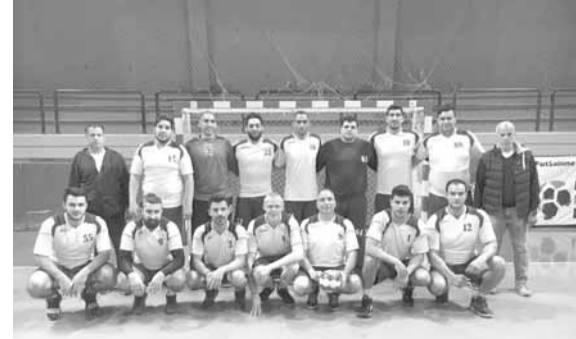
فريق فوج الإطفاء

ويشارك في البطولة هذا الموسم ٧ فرق، هي: الصداقة (بطل لبنان)، فوج الإطفاء بيروت (الوصيف)، الجيش اللبناني، الشباب حارة صيدا، الجمهور، البرة والشباب مار الياس.