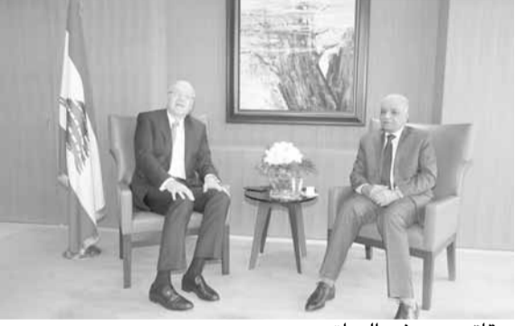
ميفاتي مع سفير العراق

الله بدأنا باللجنة الاولى التي سنستمر بالبناء فوقها لتصبح علاقاتنا بأفضل أحوالها».