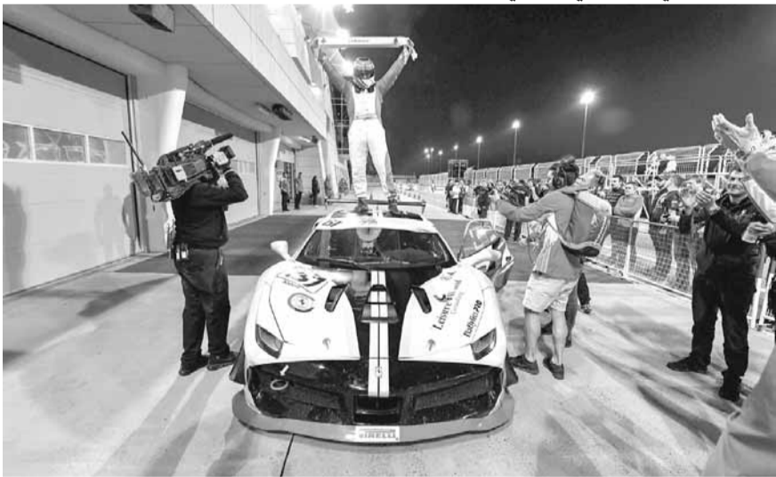
البطل ثاني حنا يحتفل بالفوز

الثاني يفارق عشر واحد عن الثاني مع العلم انه سجل اسرع لفة بفارق ثانية واحدة عن الثاني. وفي السباق الثاني، وفي السباق الثاني بدت عزيمة حنا واضحة للبيان لاحتراز لقب السباق بعدما خلف انظار السائقين الأوروبيين منذ السباق الاول وبتاوي يحسبون له الحساب. وفعلاً نجح حنا في احتلال المركز الاول بفارق نحو ٧ ثوان عن الثاني في انجاز جديد للسائق اللبناني ومحققاً اسرع لفة أيضاً أمام ذهول منافسيه، واطمئنتهم والحاضرين ليصعد السائق البطل ثاني حنا الى منصة التتويج وليعلم العلم اللبناني على وقع النشيد الوطني لوطن الأرز. وفي حال قرر حنا المشاركة في جميع الجولات الست لبطولة أوروبا فإنه سيكون المرشح الفاعوري» لاحتراز لقب ليجمع ثنائية تاريخية اي لقب بطولة آسيا وأوقيانيا عام ٢٠١٨ وبطولة أوروبا عام ٢٠١٩. يشار الى ان الجولة الثانية من البطولة ستقام على حلبة فالنسيا (اسبانيا) في ٢٩ و٣٠ و٣١ آذار المقبل.