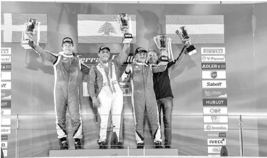
السائق اللبناني البطل ثاني حنا (في الوسط) خلال تتويجه