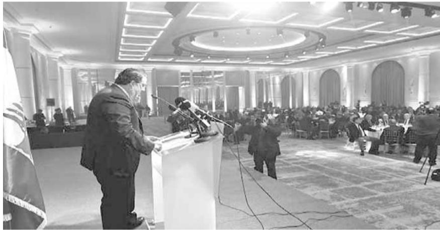
شقيير يلقي كلمته

أقامت الهيئات الاقتصادية اللبنانية امس في «Seaside Pavilion» حفل غداء احتفالياً جامعاً تكريماً لرئيسها محمد شقيير بمناسبة تعيينه وزيراً للاتصالات، بحضور حشد كبير من الوزراء والنواب واعضاء السلك الدبلوماسي والفعايلات الرسمية والسياسية والاقتصادية والعسكرية والامنية والقضائية والاجتماعية واعلاميين.