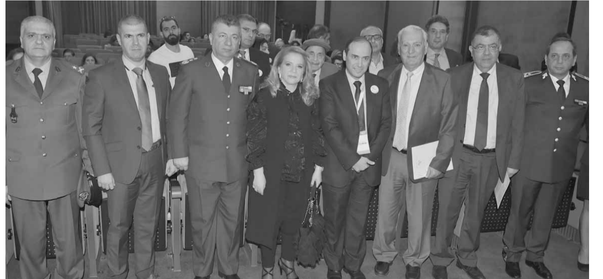
الصلح وعربيد والسيد وصايغ وممثلين عن الاجهزة الامنية

بدوره، اشار الخازن الى ان «في زمن الحروب الدولية