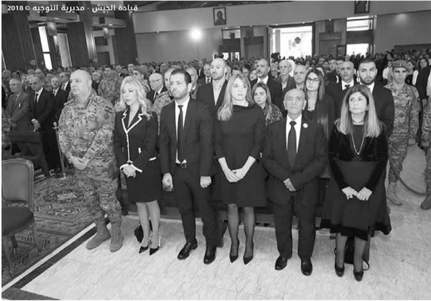
قيادة الجيش - مديرية النويجه ٢٠١٨