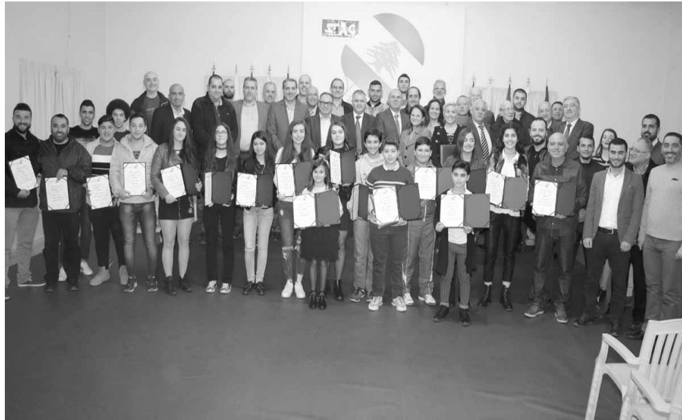
كبار الحضور مع الابطال والبطلات