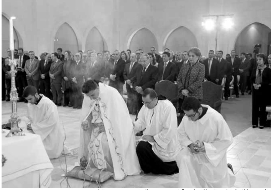
الراعي خلال القداس في الانطونية في حضور الرئيس عون وعقيلته