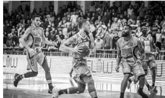
من مباراة الهومنتمن والشانفيل