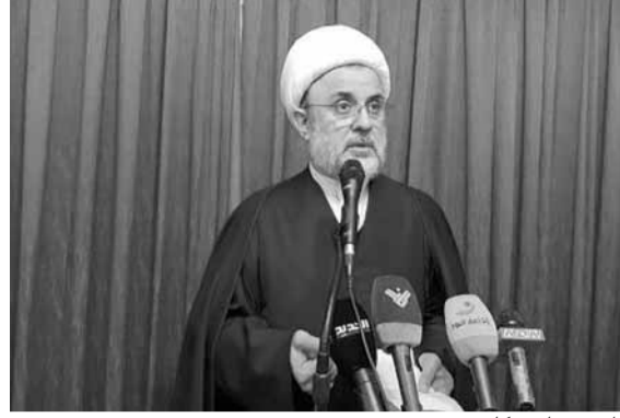
قاووق يلقي كلمته في سحمر

● أكد عضو المجلس المركزي في «حزب الله» الشيخ نبيل قاووق، خلال حفل تابيني في بلدة سحمر، أن «لبنان يزداد منعمة وتحصينا أمام كل تهديدات العدو بفضل معادلة الجيش والشعب والمقاومة، فمعادلة المقاومة تأسر العدو، العدو اليوم محاصر بمعادلات المقاومة ومفاجأتها، وهو يعيش أزمة خيارات ويفكر ألف مرة قبل أن يعتدي على لبنان، لأن معادلات المقاومة ومفاجأتها عمقت في وعيه أن يرتدع، فالعدو مردود بفضل تعاضم قدرة المقاومة، هذه المعادلة هي مجد وحصن لبنان».