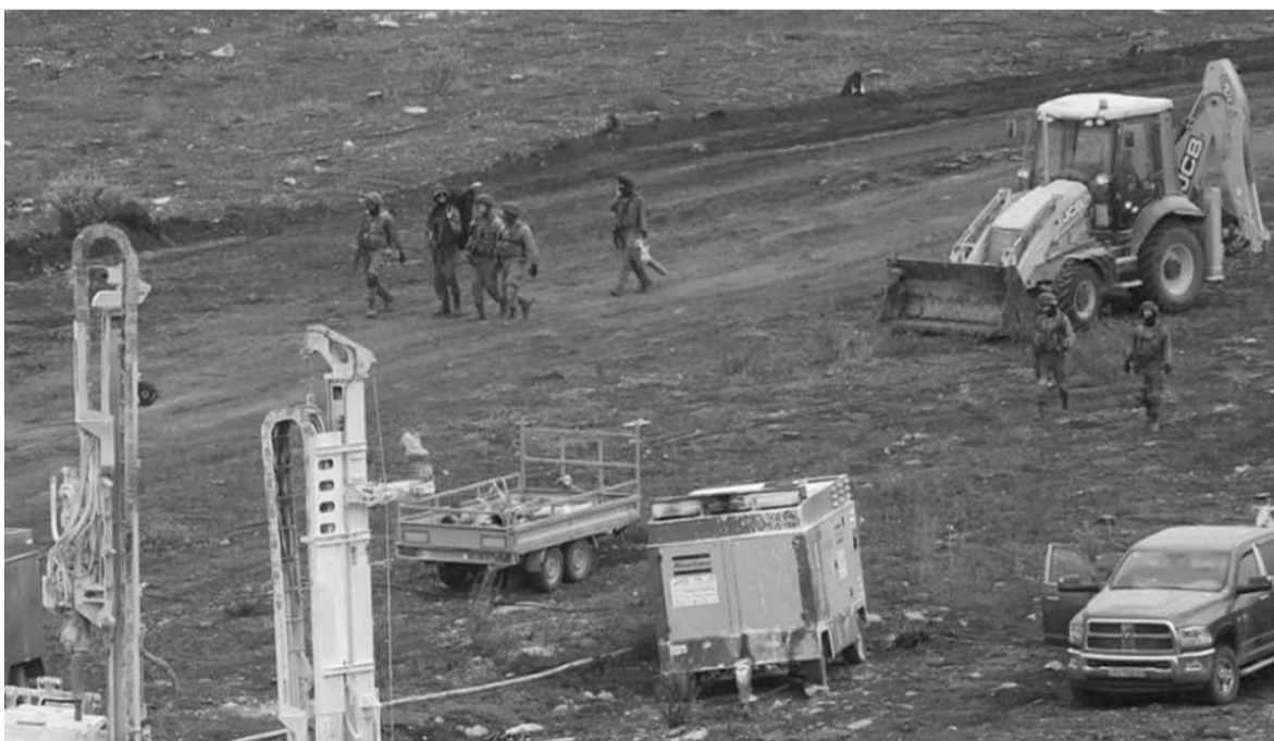
مواطنون يرفعون علماً فلسطينياً عملاقاً ورايات حزب الله عند الخط الازرق الحدودي تضامناً مع فلسطين

ومن هنا فإن الوساط الديبلوماسية تتوقع أن يتطور المشهد الفعلي اعتباراً من أواخر العام الجاري الذي يشارف على النهاية، لافتة الى أن ننتيا هو يسعى من خلال مناوراته امام مجلس الامن وواشنطن الى حشد الدعم من أجل تمكينه من مواجهة