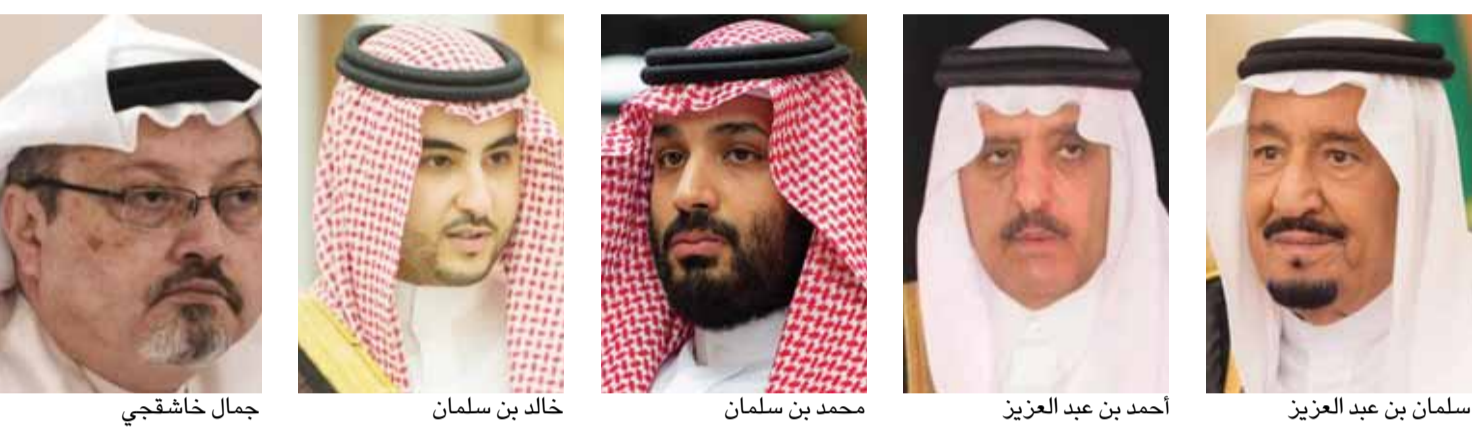
سلمان بن عبد العزيز - أحمد بن عبد العزيز - محمد بن سلمان - خالد بن سلمان - جمال خاشقجي