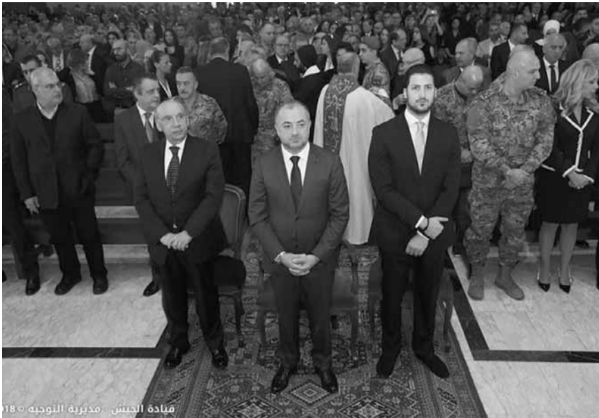
قيادة الجيش - مديرية النويجه ١٥٠٠

وقد أعلنت غرفة التحكم المروري بأنه عند الساعة ٢٠:٣٠ حصل تصادم بين شاحنة وسيارة واحترق الأخصيرة على الطريق البحرية شكا مدخل شركة هوليسم نتج منه قتيل وسيحتفل بالصلاة لراحة نفسه من الثانية من بعد ظهر اليوم الإثنين في كنيسة