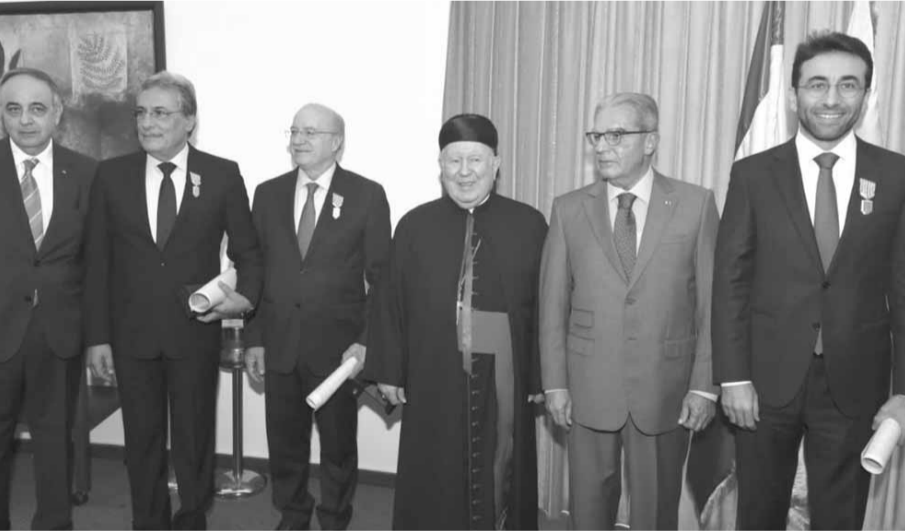
خلال حفل التكريم

والاقليمية، التي عصفت في بلدان المنطقة، وحرمت مشاعر مذهبية قديمة لإحكام الإقتتال فيما بين شعوبها، وتدمير قدراتها وفرواتها، بقي لبنان بعيدا عن شظاياها المباشرة، بعدما خبر معنى أن يكون ملعبا لمل هذه الصراعات في حروب الآخرين على أرضه، في حين حافظت القوى السياسية الفاعلة على عدم الإنزلاق إلى مهاوي الفتنة، بعدما دك جيشنا حصون التطرف على حدوده الشرقية، وتمكن مع المقاومة الوطنية من إبعاد شبح شروره في إتجاه الداخل إلى غير رجعة».